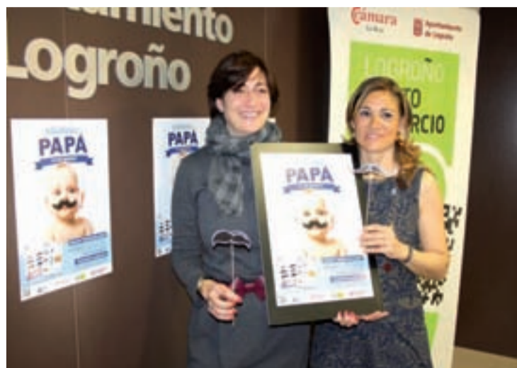
Presentación de la campaña comercial.

El concurso de fotografías está dirigido al público en general y se prolongará del 12 al 19 de marzo. Las personas que deseen participar deberán realizar una fotografía utilizando los 'bigotes de papá'. Para ello, se pueden utilizar las plantillas de bigotes que aparecen en la guía de regalos; en la web de Logroño Punto Comercio o en el perfil de Facebook. También se pueden utilizar bigotes creativos elaborados con otros materiales. Las imágenes deberán enviarse por mail a consultas@logronopuntocomercio.com o, entregarse en papel fotográfico con un formato de 10x15 centímetros en Logroño Punto Comercio.