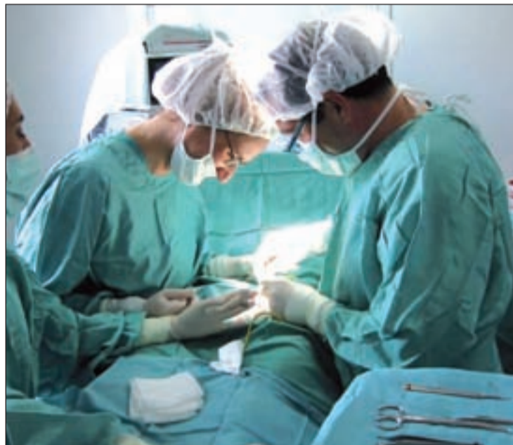
El donante debe ratificar ante un juez que no hay condicionantes

Las donaciones en vivo, autorizadas en España para pacientes de origen extranjero, están sujetas a un estricto protocolo, con diferentes controles médicos y judiciales para garantizar que se efectúa de forma voluntaria y sin condicionante económico, social o psicológico.