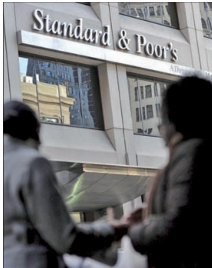
Una de las sedes de la agencia 'Standard & Poors'