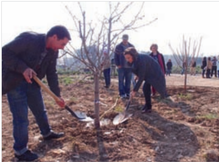
La alcaldesa visita los huertos sociales.

Los huertos urbanos o de ocio van dirigidas al público en general, mientras que los huertos sociales van destinados a personas con problemas de exclusión social que están incluidos en programas de la Unidad de Servicios