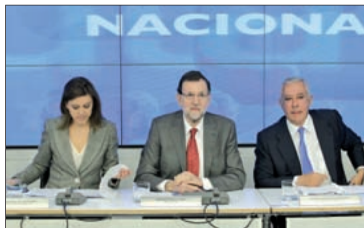
Cospedal, Rajoy y Arenas, en el Comité Ejecutivo del pasado lunes

"Los plazos están para utilizarlos", justificó la secretaria ge-