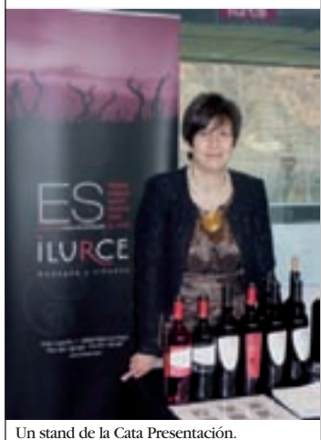
Un stand de la Cata Presentación.