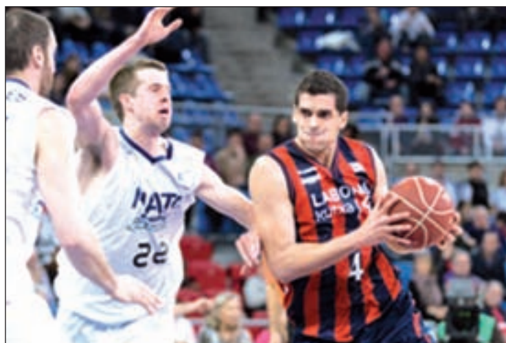
El Laboral Kutxa recibe este domingo al Cajazol