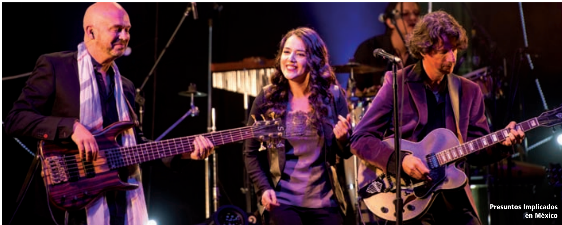
Presuntos Implicados en México