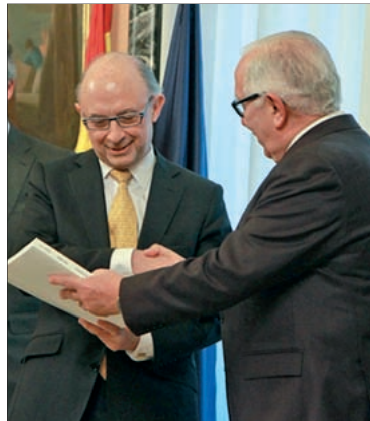
Cristóbal Montoro, al recibir el informe de los expertos

Sin embargo, el informe del grupo de sabios sí puede dar pistas del espíritu del texto final, así como centrar el debate en cuestiones concretas. De hecho, el Gobierno no sólo ha mostrado su oposición a algunas ideas, también ha acogido con interés otras, como bajar los tipos de algunos impuestos y eliminar bonificacio-