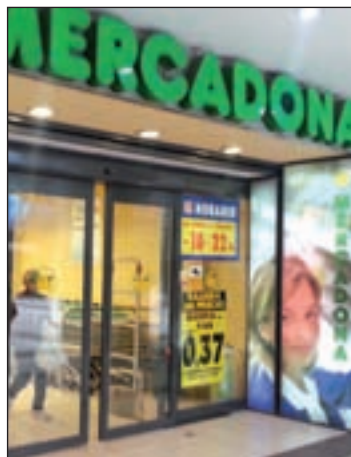
Un local de Mercadona