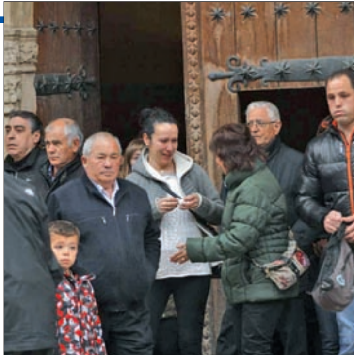
Un momento del funeral de la menor