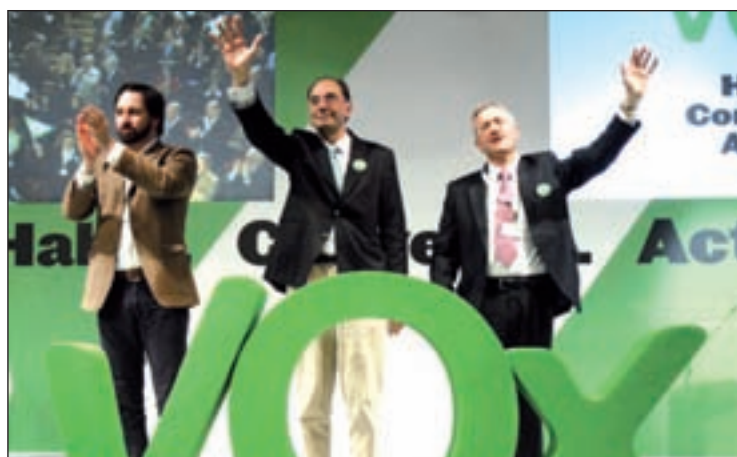
Vidal-Quadras, en la Asamblea Extraordinaria Inaugural de Vox

La Asamblea Extraordinaria Inaugural de Vox aprobó la composición del nuevo Comité Ejecutivo Provisional en el que José Antonio Ortega Lara aparece entre los vicepresidentes del equipo que dirigirá el partido hasta la celebración de la Asamblea General Ordinaria del próximo otoño.