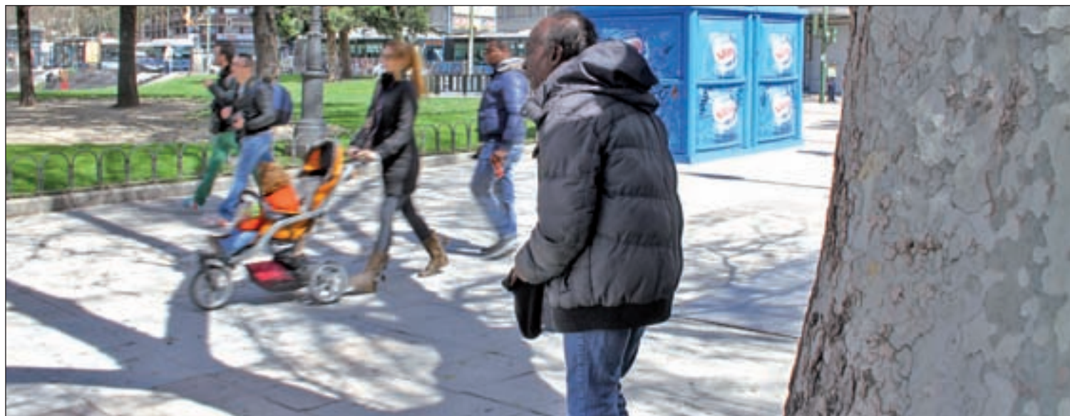
La OCDE cree que la recuperación económica, por sí sola, no solucionará la crisis laboral y social española