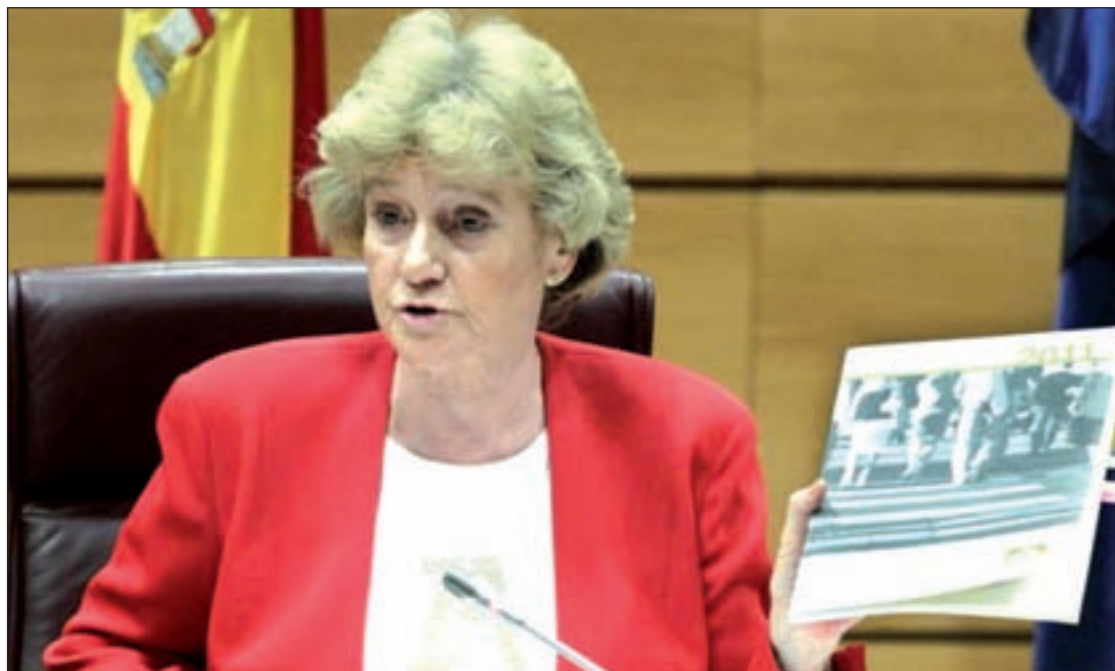
Soledad Becerril, Defensora del Pueblo, compareció en la Comisión Mixta del Congreso

No es el único juez que se plantea la aplicación de la nueva regulación. Pablo Ruz preguntó a la Fiscalía y al resto de partes personadas si debe archivar las causas que instruye sobre la creación de Guantánamo, la muerte del diplomático Carmelo Soria durante la dictadura chilena, el asalto a la Flotilla de la Libertad y los genocidios en el Sáhara.