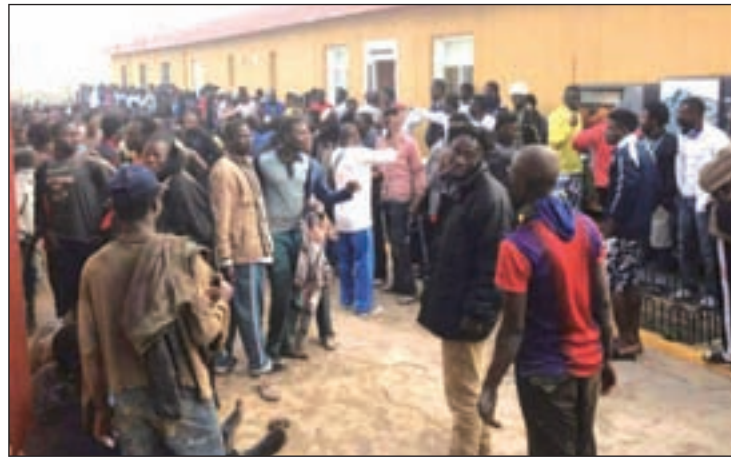
Al menos 492 personas entraron el pasado martes en Melilla

La decisión llega después de que Melilla registrara el pasado