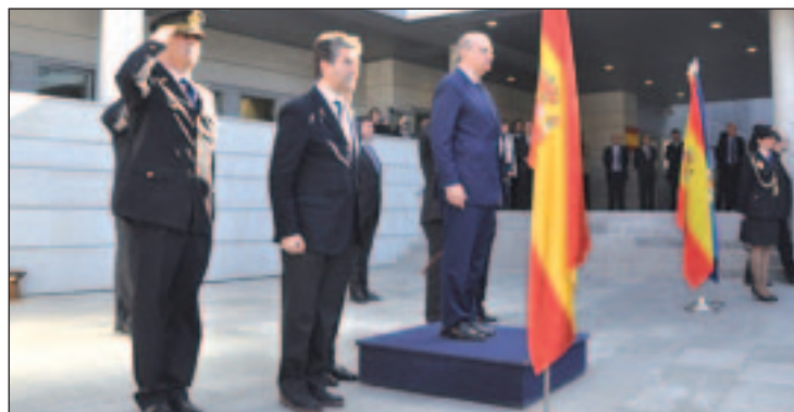
Jorge Fernández Díaz, durante la inauguración

En declaraciones realizadas durante el acto de inauguración de las nuevas dependencias del Cuerpo Nacional de Policía en San Sebastián, Jorge Fernández Díaz remarcó que el citado des-