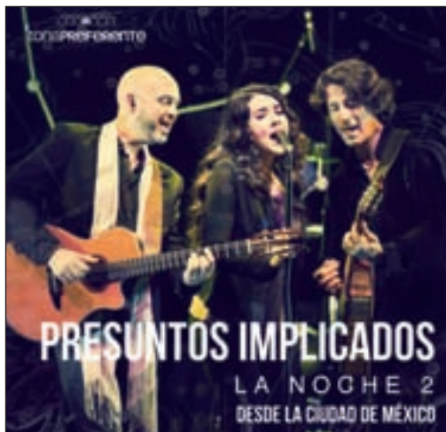
La portada del álbum

"Esa es otra de las cosas que después de ocho años en la formación la tengo asumida, Presuntos somos nosotros, nos ha costado nuestro tiempo tras conocernos dentro y fuera del escenario. Es algo que tenía superado, me siento muy en mi sitio y muy contenta. La verdad es que no pensé en hacerlo mejor o peor que en el 95, sólo en dar todo de mí. Lo que la gente quiere al final y con lo que se queda es precisamente con esto, no algo forzado ni medido, sino con esa magia