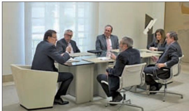
Rajoy y Báñez, en la reunión con Toxo, Méndez, Rosell y Terciado

Gobierno, sindicatos y empresarios señalaron que para consolidar este cambio en el ciclo económico y que éste llegue de manera más positiva al empleo es necesario abrir una "nueva etapa" que requiere impulsar, "desde un renovado protagonismo del diálogo social", medidas