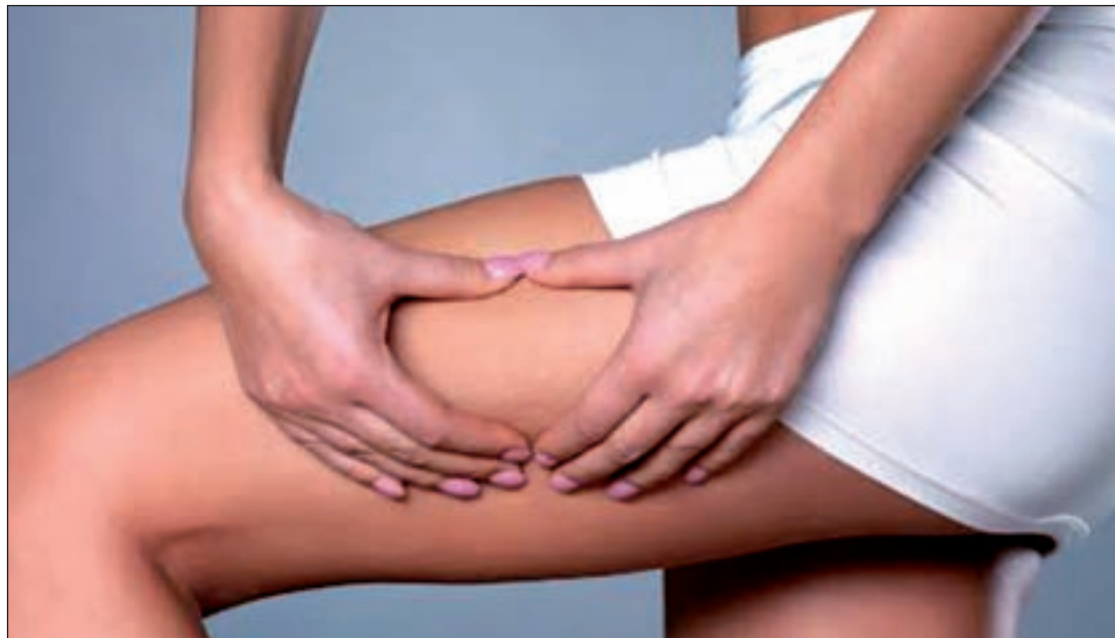
Celulitis localizada en la zona lateral de los muslos

Entre los alimentos recomendados se encuentran las frutas como el melón, el pomelo, la naranja o la piña. "El melón tiene un 94,6% de agua y el pomelo contiene vitaminas C, B y A, además de