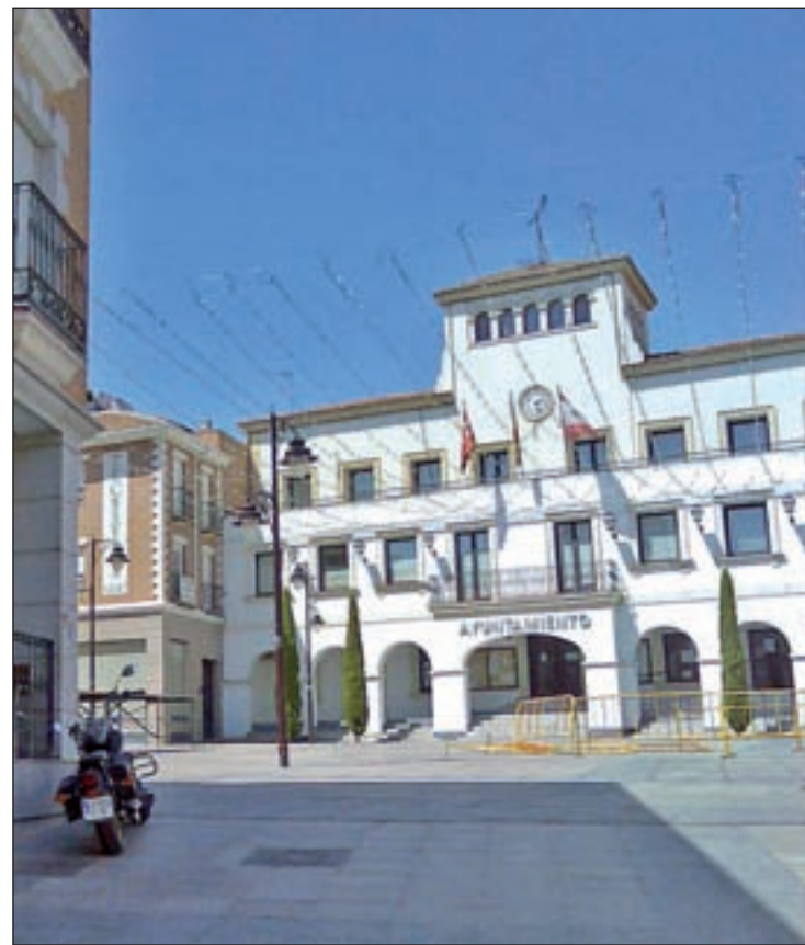
Ayuntamiento de San Sebastián de los Reyes

A juicio de los socialistas, es esta inadmisión masiva la que ha originado que sea la vía conten-