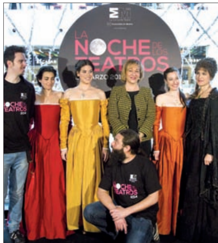
Presentación de la Noche de los Teatros

El público también podrá ver Fuenteovejuna con un original montaje de la mano Obskené, que presenta en clave contemporánea el clásico de Lope de Vega, en la