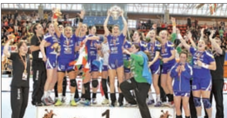
Las jugadoras del Bera Bera se alzaron con el trofeo

En cuanto al resto de equipos de Fundal, este fin de semana juegan todos en casa, menos el Euroconsult que se traslada a Albacete. El rugby tiene un importante choque con el Arquitectura. Por su parte, el Feel Voley seguirá en su lucha por meterse en la fase final de la liga.