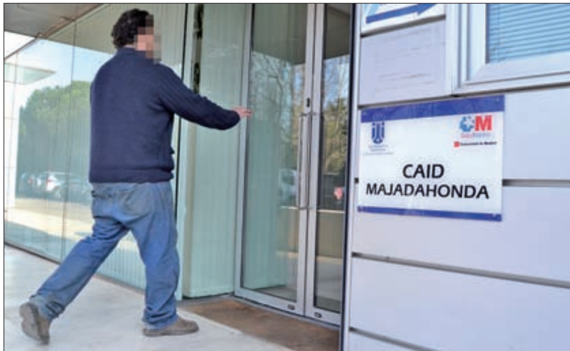
El CAID de Majadahonda ofrece servicio a otros municipios

El aumento se debe, entre otras razones, al convenio que tienen firmado con el Hospital Puerta de Hierro, que deriva a los pacientes con problemas de drogodepen-