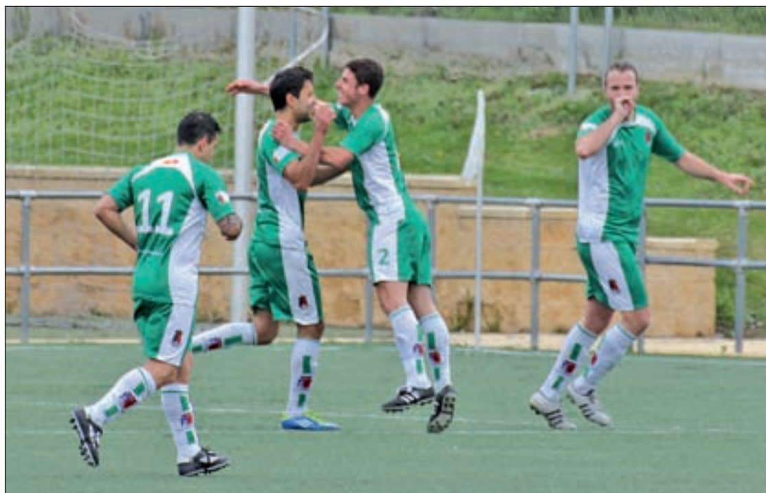
El Pozuelo vuelve a jugar este domingo ante sus aficionados