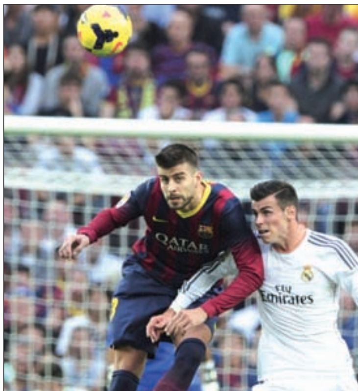
Piqué y Bale, en el partido de ida en el Camp Nou

Los resultados de las últimas semanas y el hecho de jugar como local otorgan, a priori, una ligera ventaja al Real Madrid, pero en un 'Clásico' este tipo de cuestiones tienen un valor más bien escaso. El Barça ya demostró el pasado domingo que si Messi e Iniesta sacan a relucir su mejor versión pueden decantar cualquier choque, aunque enfrente tendrá a un equipo que está a un solo partido de encadenar una vuelta entera sin conocer la derrota en la Liga. Este escenario devuelve el brillo a un partido que el año pasado se presentaba un tanto descafeinado. En ese momento, el Barça lideraba la clasificación con cierta holgura y el Real Madrid ocupaba la tercera plaza