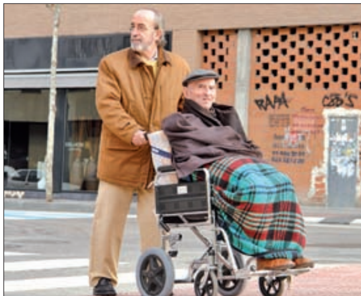
El año pasado se atendió a 35 familias roceñas

La siguiente batería de ayudas está destinada al pago del alquiler o de la hipoteca de la vivienda de