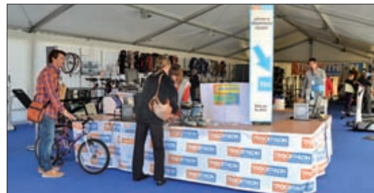
La feria Trocathlon de Majadahonda

Los clientes que vendan su producto durante el Trocathlon recibirán un vale por el importe de la venta para canjearlo dentro de la tienda.