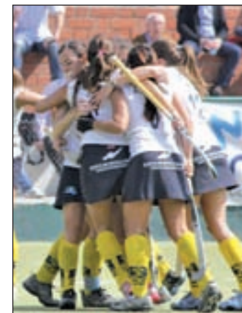
El Club de Campo, campeón

Como no podía ser de otra manera, Cataluña parte como favorita, pero la selección madrileña