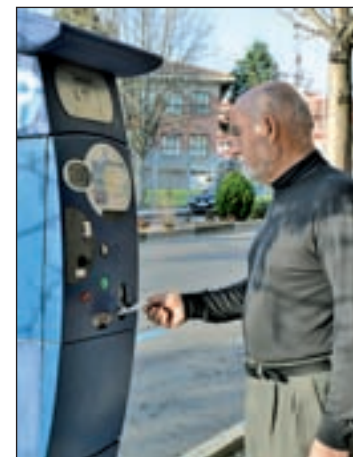
Un parquímetro de Majadahonda

Los pasos: registrarse a través de Empark.com; elegir una dirección de correo electrónico, una contraseña y un código de validación para crear la cuenta; y cumplimentar los datos personales y de las tarjetas de crédito o débito. Se permite por usuario hasta tres matrículas. La descarga de la aplicación para el 'smartphone' se