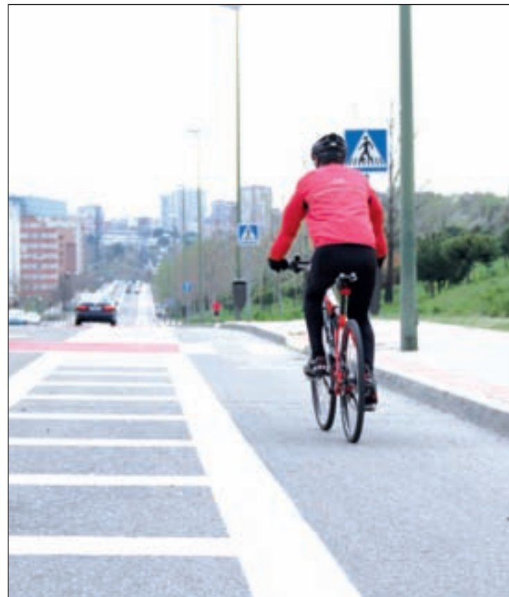
La calle Castillo de Candanchú

Sin embargo, la puesta de largo de esta nueva infraestructura no ha tenido la acogida esperada entre los usuarios que tildan al nuevo carril bici de “peligroso e inadecuado”. Entre las quejas principales de los vecinos hay una que destaca por encima de todas, la reducción de los carriles destinados a la circulación de vehículos. Un claro ejemplo se encuentra en la calle Castillo de Candanchú. Esta extensa vía contaba, anteriormente, con dos carriles por sentido y una zona reservada para aparcamiento, unas características que propiciaban que algunos coches circularan a velocidades excesivas. Esa situación, que en un principio intentó atajarse con un radar móvil, podría desaparecer con la instalación del carril bici, aunque ahora el problema es otro. Los vecinos denuncian la escasa visibilidad que tienen a la hora de salir con sus vehículos de los garajes de sus edificios, ya que deben invadir el