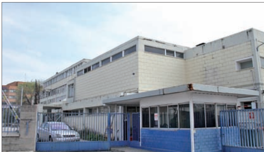
El edificio se construyó en el año 1961

Por otro lado, Ecologistas en Acción ha lanzado la campaña #PelotazoBernabéu en contra del proyecto de ampliación del estadio y en apoyo al recurso presentado ante el Tribunal Superior de Justicia de Madrid (TSJM). El grupo ecologista en Madrid recurrió en 2013 ante el TSJM la modificación puntual del Plan General de Ordenación Urbana de Madrid, al entender que este proyecto se haría "sobre suelo público, cedido previamente por el Ayuntamiento de Madrid para un proyecto que antepone los intereses particulares a los de la ciudadanía madrileña. Una operación especulativa, un #PelotazoBernabéu", ha criticado Ecologistas en Acción.