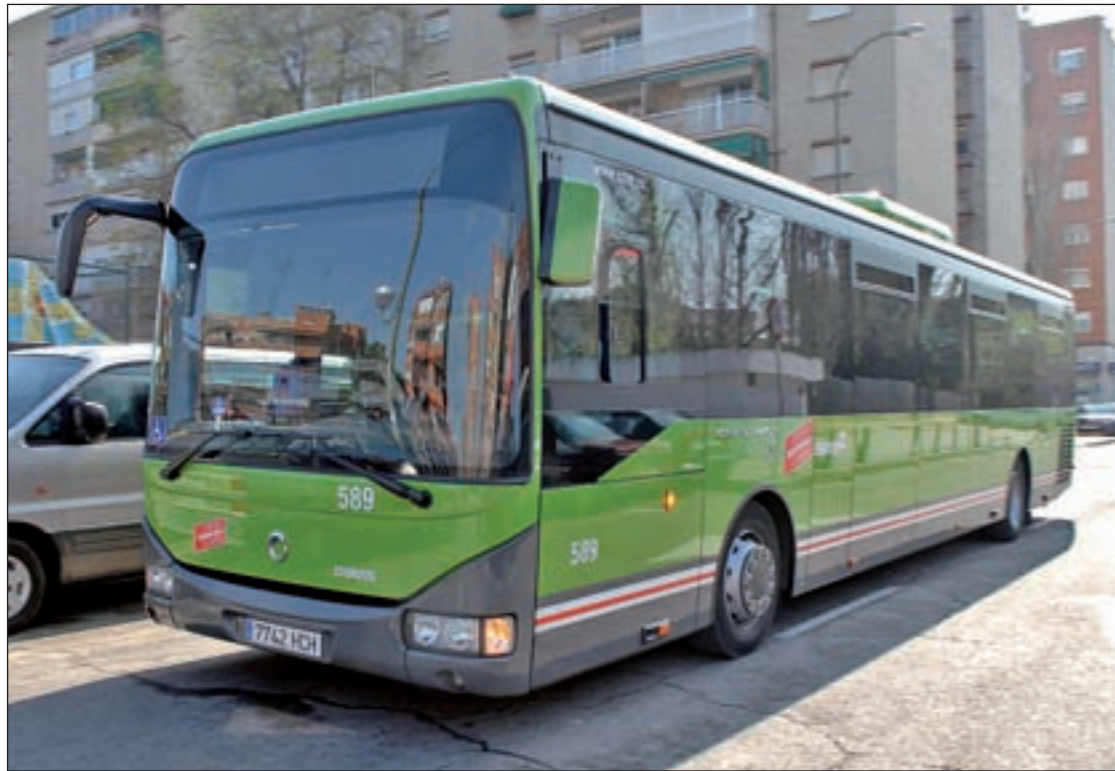
El transporte público, entre las reivindicaciones de los vecinos de la zona GENTE

Con una situación geográfica muy particular, este territorio pertenece, en casi todo su conjunto, al término municipal de Alcobendas, aunque una parte de él corresponde a Madrid. Por ello, los vecinos aseguran que esta solicitud de ampliación de la línea de autobús interurbana ya había sido llevada al Pleno del distrito de Hortaleza. Fuentes de esa Junta Municipal han asegurado a GENTE que ya han hablado con el Consorcio Regional de Transportes para que el 155-B, que no llega hasta una serie de urbanizaciones de Encinar de los Reyes, amplíe su recorrido, aunque desde el organismo que encabeza Pablo Cervero les han trasladado que no hay “masa crítica”. En otras palabras, que hay un número suficiente de usuarios para llevar a cabo esa modificación. Lejos de con-