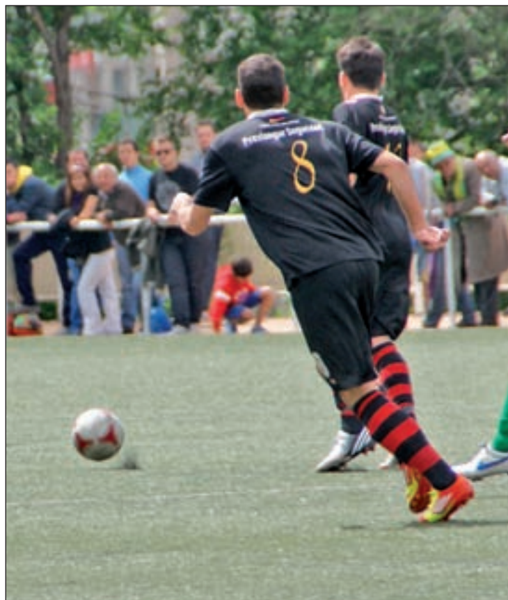
El Vereda de Ganapanes ha dejado de ser un fortín GENTE

así intentar poner fin a una racha de cinco encuentros sin conocer la victoria. Enfrente estará un equipo como el San Fernando que se ha acostumbrado a dar grandes sorpresas. Con 52 puntos, los hombres de Chiqui se han apuntado a la carrera por los 'play-offs', respaldados por una racha que les ha llevado a no probar el sabor de la derrota desde el pasado 22 de diciembre.