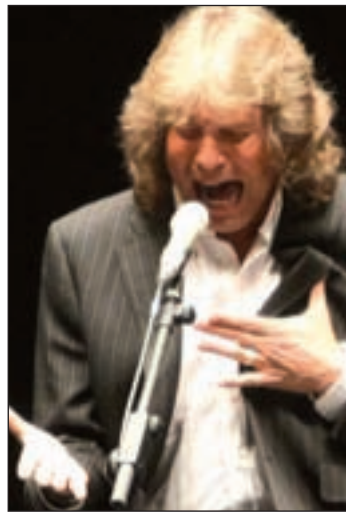
José Mercé, en concierto

Con más de cuatro décadas de recorrido profesional a sus espaldas, el jerezano llega este sábado a Tetuán para poner el broche al ciclo 'Pasión flamenca'. La cita será a la hora habitual, las siete de la tarde, en un escenario que la semana pasada vibró con un espectáculo, el Café de Chinitas, que reprodujo los orígenes y la trayectoria de este famoso tablao madrileño con todos los ingredientes