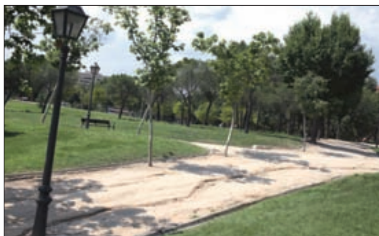
Imagen del parque Norte GENTE

CON UN PRESUPUESTO DE 22,6 MILLONES DE EUROS