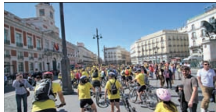
Los vecinos, tras su llegada a la Puerta del Sol

de la zona, "denunciando la política de parches y chapuzas a la que la Comunidad de Madrid está condenando la educación de sus hijos". Los citados colectivos preparan nuevas movilizaciones para las próximas semanas y no cesarán hasta que el instituto de Butarque sea una realidad.