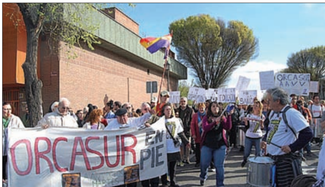
Una de las manifestaciones de los vecinos para solicitar mejoras en su barrio

Este residente focaliza los problemas en dos situaciones que necesitan una solución en firme que no termina de llegar. Por un lado, habla de las comunidades de propietarios en las que se llevan a cabo los citados realojos. “La convivencia no existe en estos portales, hay casos muy duros con familias que salen adelante como pueden a base de continuas llamadas