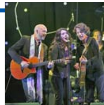
El grupo en México