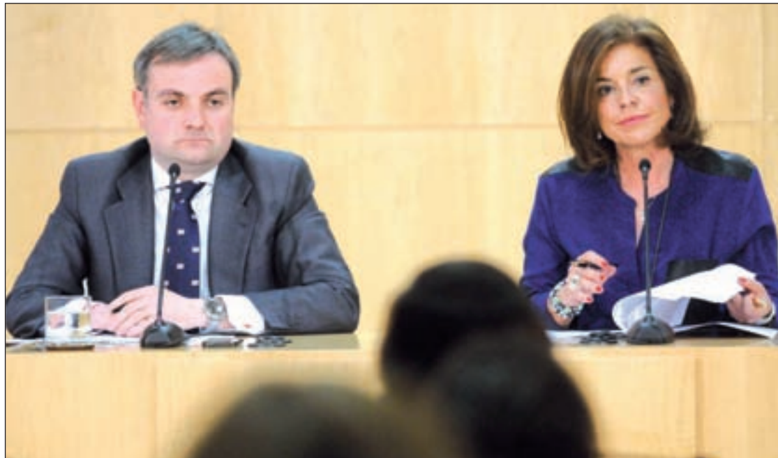
Un momento de la rueda de prensa posterior a la Junta de Gobierno

Por otro lado, la primera edil explicó que pasará de cobrar