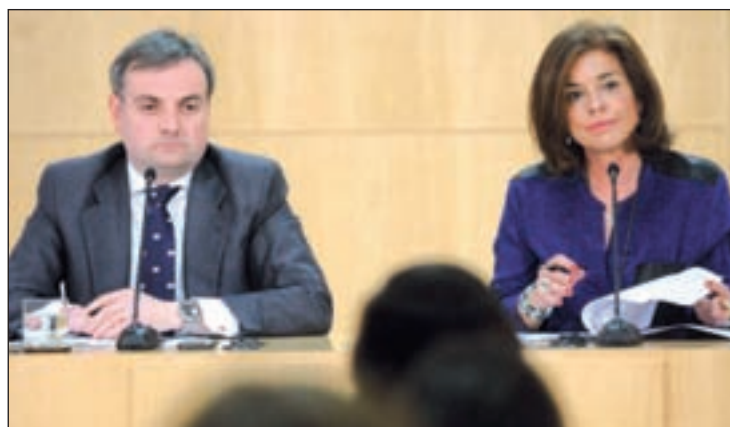
Un momento de la rueda de prensa posterior a la Junta

de la próxima semana. Una rebaja que se ejecutará siguiendo lo marcado en la Ley de Presupuestos Generales del Estado para 2014. El importe establecido para esta retribución coincide con el máximo que fije cada año esta ley para los municipios de este tramo de población, siendo para este ejercicio de 100.000 euros. En cuanto al acuerdo para retrasar la reducción salarial a la oposición se ha adoptado con todos los grupos municipales, como ha destacado Botella. La norma no obliga a reducir los salarios de los ediles