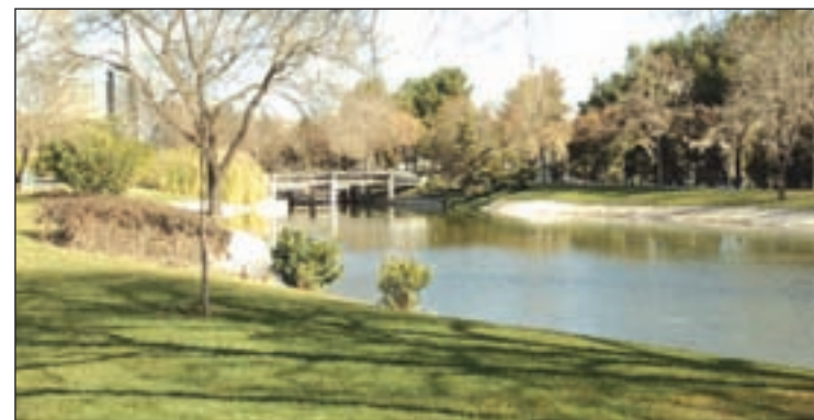
Parque Tierno Galván

na y Bremen y en las zonas verdes de Antonia Ruiz Soro y Parque de Eva Duarte; y en Moncloa en Parques Saconia, Blas de Otero, Valderromán, Jardines Museo de Goya y Colonia del Manzanares. Las actuaciones contemplan desde la reparación de redes de riego al suministro de plantas.