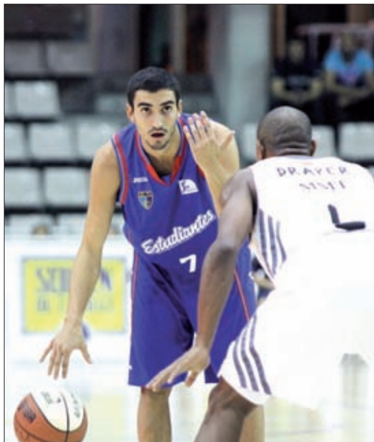
El Estu sigue por el camino correcto

dad de ampliar su racha de victorias. Enfrente estará un Bilbao Basket que, en su caso, pelea por entrar en los puestos que dan derecho a disputar los 'play-offs' por el título. Como en el caso del Tuenti Móvil Estudiantes, el Real Madrid tiene la oportunidad de dar un disgusto a un conjunto que, en temporadas anteriores, le privó de jugar la final de las eliminatorias de la ACB.