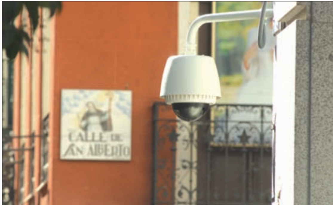
La colocación de los nuevos dispositivos en Centro necesita un presupuesto de 600.000 euros