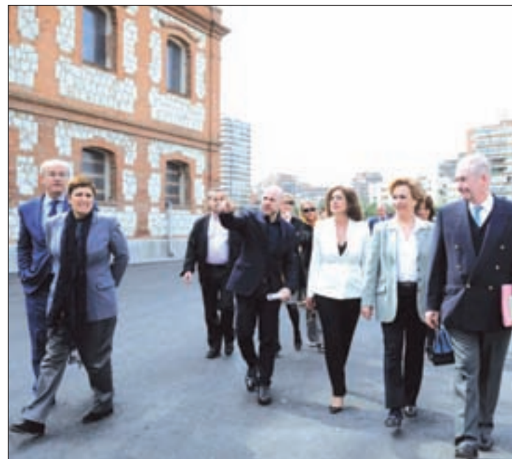
Visita de Botella a Matadero

En cuanto a la tercera fase, que este miércoles avanzó Botella y que comenzará en la primera quincena de mayo, buscará "mejorar la accesibilidad peatonal y eliminar barreras arquitectónicas para fomentar el acercamiento a las actividades culturales y al Parque Lineal del Río Manzanares", tal y como apuntaron desde el Consistorio. Este año también se