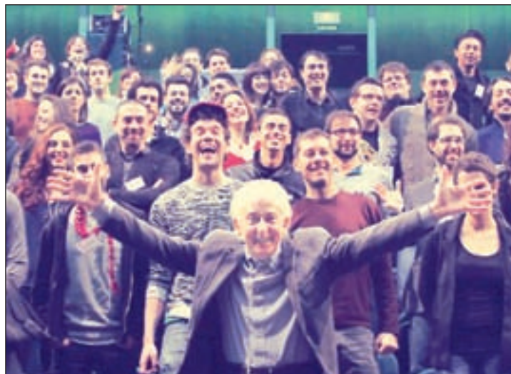
La última edición de Talent Madrid

TEATROS DEL CANAL A partir del 23 de abril