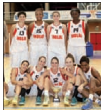
El CREF es tercero GENTE

Esta combinación de resultados hace que ahora el CREF cuente con dos victorias de diferencia respecto al cuadro de Esplugues de Llobregat, a la espera