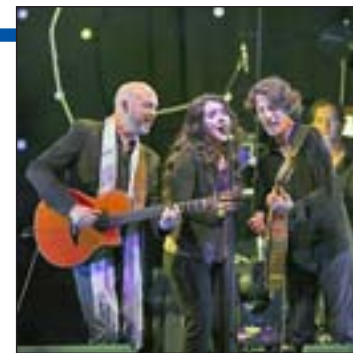
El grupo en México