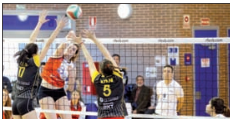
Las chicas del Feel Volley en su último partido

La central de 23 años, que comenzó a jugar en el Colegio Mesianos de Madrid y que se ha formado en la Academia de Balonmano Alcobendas cumple con el sueño de unirse al equipo nacional tras una inmejorable temporada en la Liga DHF, en la que se ha convertido en la sensación de la competición, anotando 103 goles en 20 partidos.