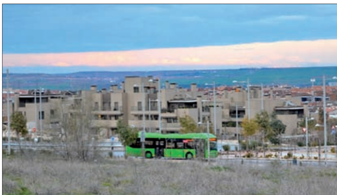
El joven barrio de Tempranales, en San Sebastián de los Reyes