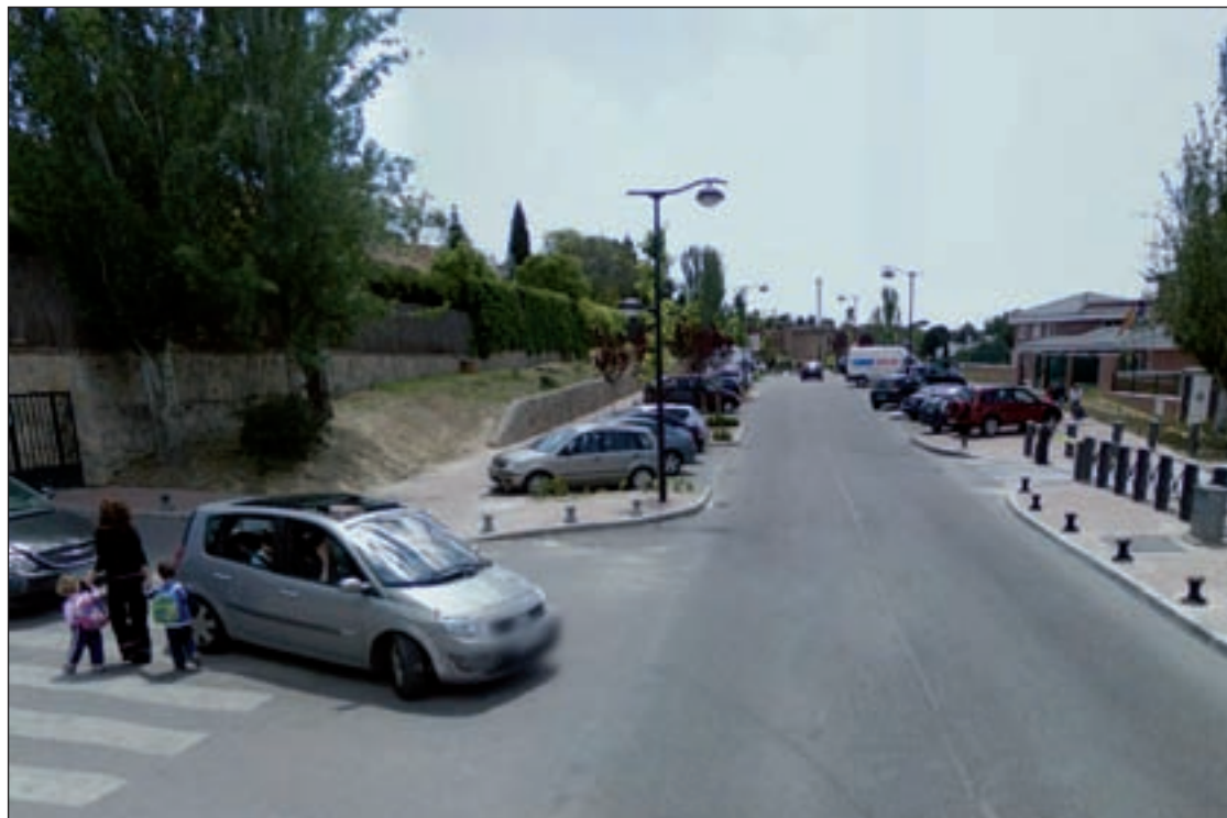
El Paseo de Alcobendas, donde se encuentran algunos de los centros

No obstante, según ha podido conocer este periódico, la zona es una de las más seguras del municipio, ya que cuenta con la vigilancia de la Policía Local y Nacio-