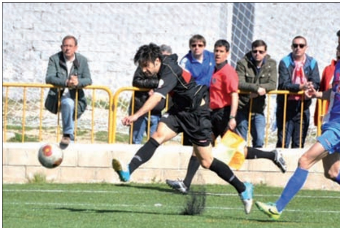
El Sanse, en un partido en casa esta temporada

Por ello, el club está convencido de que puede aspirar a volver a Segunda B. Ahora mismo, está segundo en la tabla con 62 puntos, a tan sólo 2 del líder que es el Trival Valderas. Pero a diferencia que su rival directo, al Sanse el calendario de final de temporada le sonríe. Ya ha pasado ante los rivales más duros, y ahora, sólo se tendrá que medir a dos aspirantes, el Unión Adarve, que no pasa por su mejor momento y al CF Internacional.