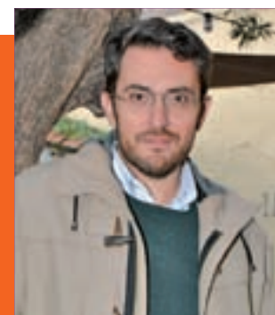
iGente TIEMPO LIBRE Pág. 16

RECORDAMOS QUE ESTE DOMINGO HAY QUE ADELANTAR LOS RELOJES UNA HORA: A LAS 2 AM, SERÁN LAS 3 AM