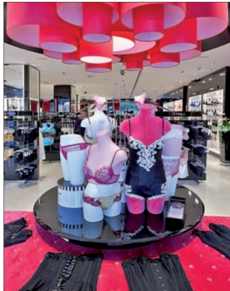
En las tres plantas del edificio se cuida cada detalle

Un espacio atractivo y cuidado al detalle con el objetivo de crear una atmósfera que haga que la mujer se sienta única y especial. De hecho, lo primero que hacen las dependientas cuando se va a adquirir un sujetador, es medir el contorno a la cliente para obtener su talla exacta y buscar así las prendas acordes a ella. Esta información se apunta en una tarjeta