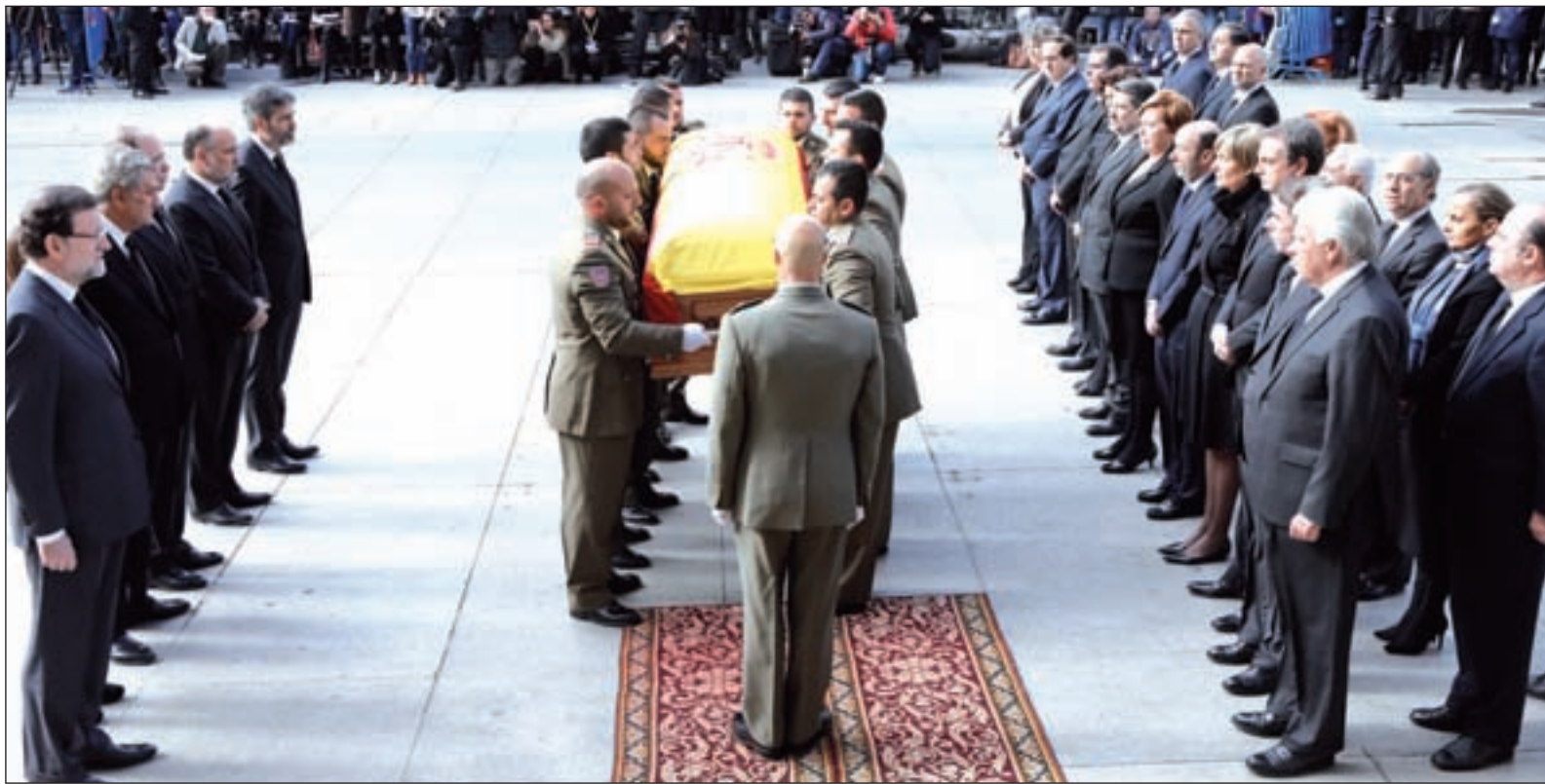
A la derecha, González, Aznar y Zapatero; y Rajoy a la izquierda, juntos para honrar al primer presidente de la Transición