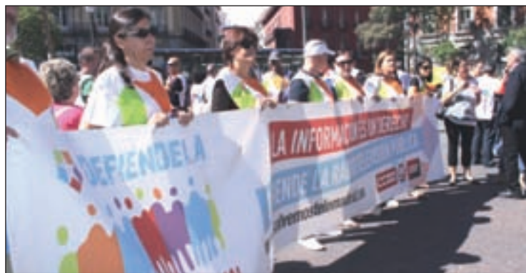
Los trabajadores de la cadena en manifestación

Dicen que fomentó el consenso y que hizo que enemigos irreconciliables aprendiesen a convivir juntos y en armonía. Me empezó a caer simpático cuando creó el CDS e hizo que lo social impregnase su travesía desde el poder a la nada. Pronto se fue del todo de la actividad política para atender sus necesidades familiares y ahora se marcha definitivamente, sin posibilidad de escuchar el coro de aduladores y defensores de lo que dicen que hizo pero que ellos no practican desde hace demasiado tiempo.