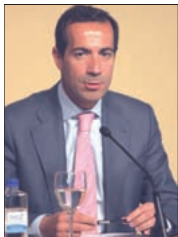
Salvador Victoria

Estas ayudas se enmarcan en los casi 12,5 millones de euros que la región destinará a la promoción y al fomento de las distintas artes escénicas, musicales y cinematográficas a lo largo de este 2014 para apoyar al sector cultural.