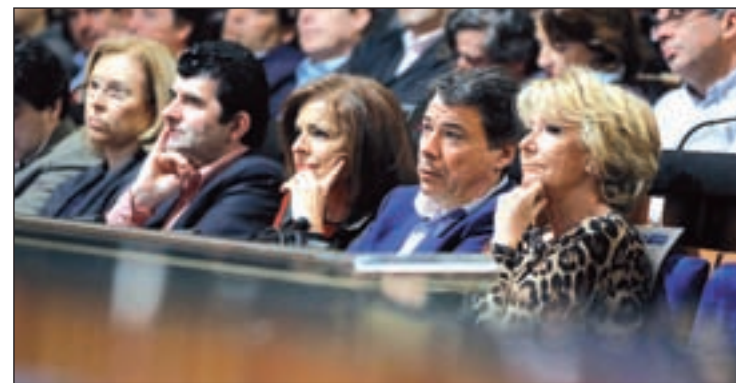
Esperanza Aguirre junto a Ignacio González y Ana Botella