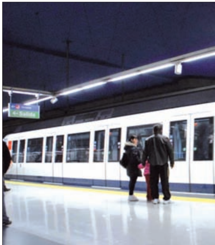
MetroSur de Leganés GENTE

El texto concluye que el material utilizado en las obras presenta un grado de degradación no vinculado con el uso sino con una mala ejecución de los trabajos, ya que los materiales empleados no eran los adecuados para las condiciones del terreno. Debido a esta causa, se tuvieron que encargar unas nuevas obras de manera urgente para corregir la degradación. En la actualidad, estos problemas ya se han solventado, pero no obstante se ha decidopro-