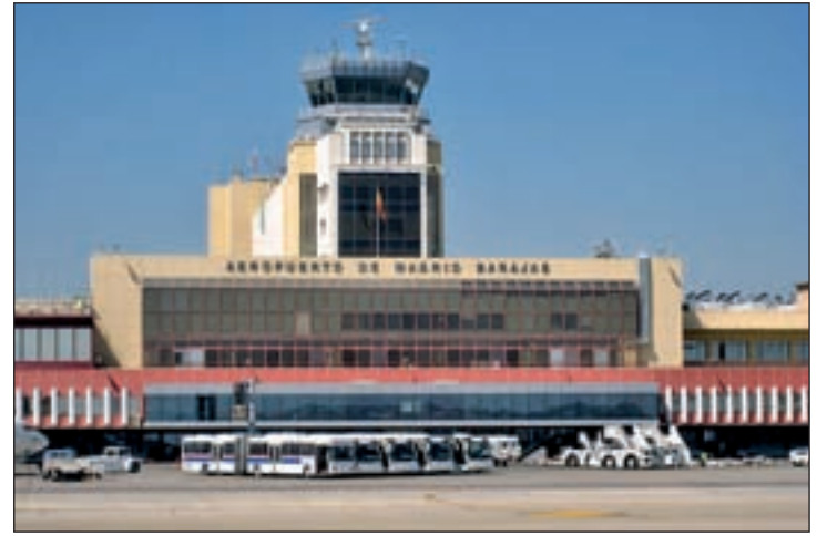
El aeropuerto Adolfo Suárez Madrid-Barajas

También, el presidente de la Comunidad, Ignacio González, ha dicho que propondrá la concesión de la medalla de oro de la Comunidad de Madrid a Suárez. Asimismo, el Ayuntamiento de Madrid ha aprobado el nombra-