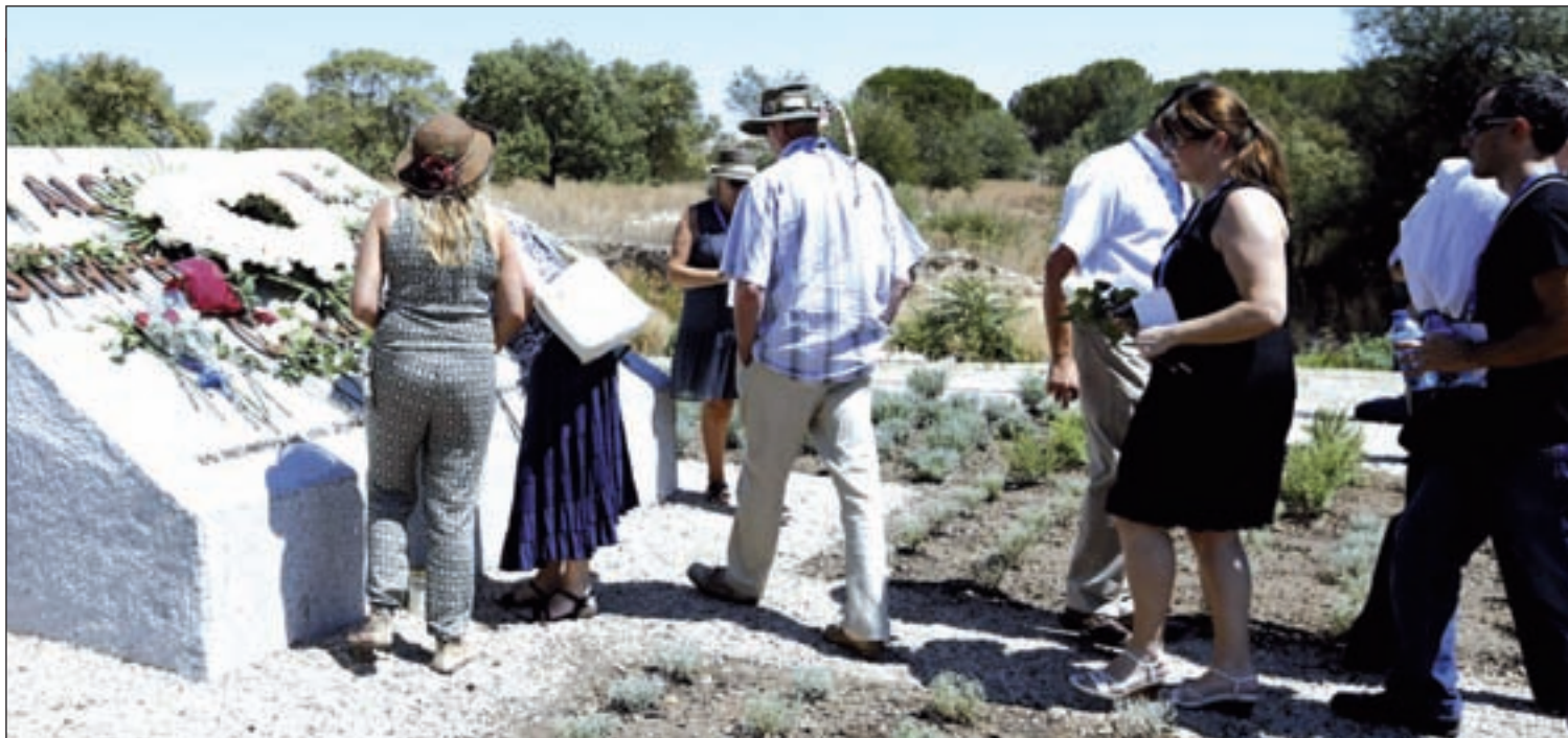
Un total de 154 personas fallecieron en el accidente, que ocurrió el 20 de agosto de 2008