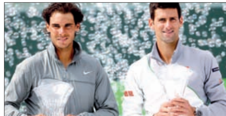
Los dos finalistas del Masters 1000 de Miami

Curiosamente, ni uno ni el otro estarán presentes este fin de semana en la ronda de cuartos de final de la Copa Davis. Serbia y España cayeron apeadas en la primera eliminatoria y tendrán que jugarse su permanencia en el Grupo Mundial en el mes de septiembre. En esta ronda destaca el duelo Italia-Gran Bretaña.