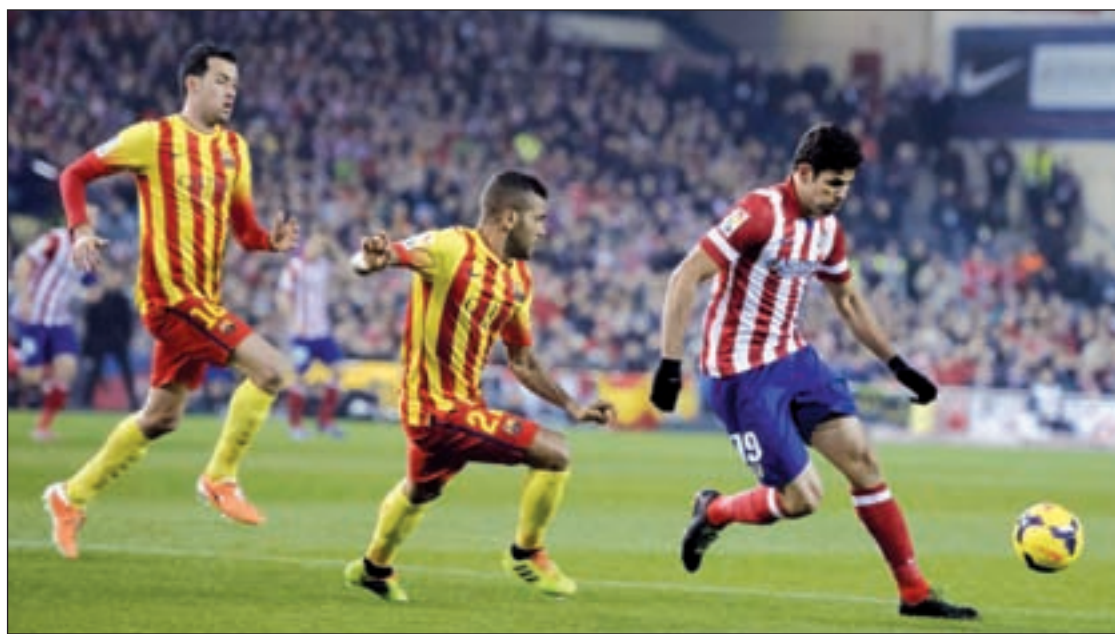
El Atlético recibirá al Barça el próximo miércoles en el torneo continental

En el horizonte aparece un Barcelona-Atlético de Madrid en el Camp Nou que podría despejar todas las incógnitas, pero hasta esa última jornada aún faltan una serie de encuentros que pueden provocar un cambio brusco en la zona noble de la tabla. Una de las fechas que puede dar pie a modificaciones es la que se disputará este fin de semana. Los tres candidatos al título jugarán el sábado con motivo de sus compromisos de Liga de Campeones. El encargado de alzar el telón será el Atlético de Madrid, que recibirá a partir de las 16 horas al Vi-