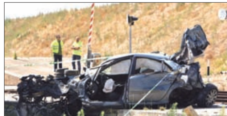
Los fallecimientos han caído un 75% en la última década

La tasa de mortalidad en carretera de España ha caído casi un 75% en la última década, desde las 136 víctimas por millón de habitantes que se registraban en 2001, hasta 53 en 2010, 41 en 2012 y 37 en 2013.