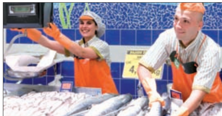
Mercadona cuenta en Castilla y León con 3.450 trabajadores

dustria agroalimentaria regional. La compañía ha finalizado el ejercicio con 63 tiendas en las nueve provincias castellanoleonesas, contando con una plantilla de 3.450 trabajadores, todos ellos con contratos estables y de calidad. La implantación del nuevo modelo de venta de productos