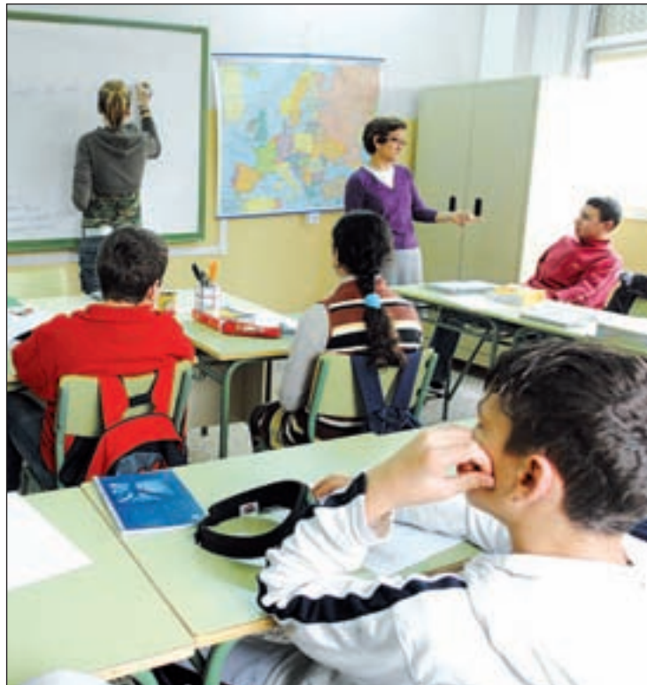
Estudiantes en un aula de Secundaria

Sin embargo, presentaría dificultades para comprar la combi-