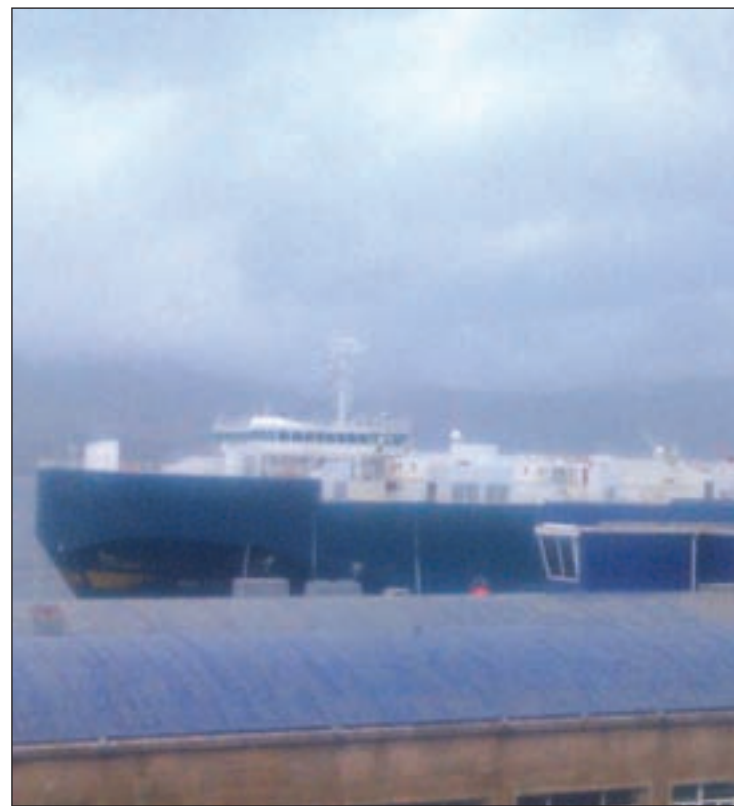
El mercante 'Baltic Breeze', en el puerto de Vigo

El equipo está formado por cinco buzos del grupo especial de actividades subacuáticas, procedente de la base estratégica de Salvamento Marítimo de Fene, un