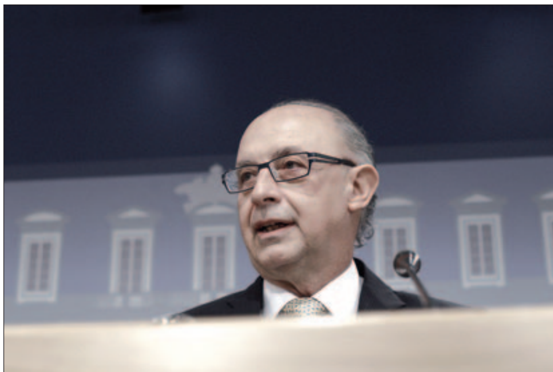
Cristóbal Montoro, ministro de Hacienda y Administraciones Públicas, en la rueda de prensa

En cuanto a las corporaciones locales, el ministro confirmó que