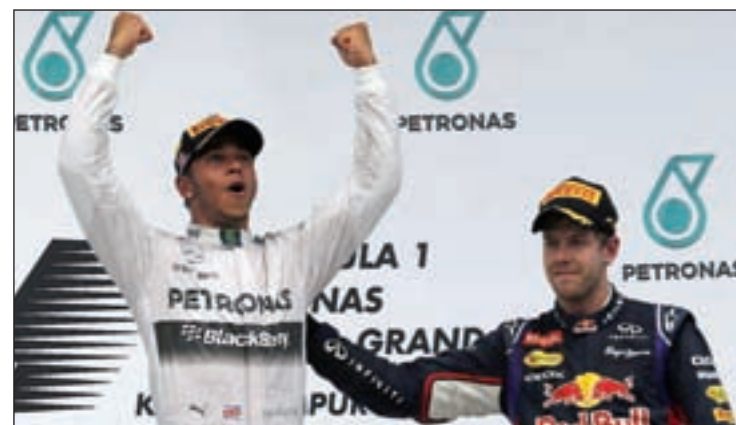
Hamilton y Vettel, en el podio de Sepang

Sin embargo, no todo son problemas en el seno de Ferrari. "Llegamos ahora a la carrera con un mejor conocimiento del reglamento y un mejor conocimiento de cómo se desarrollan las carreras este año, de la interacción entre la parte electrónica del coche y