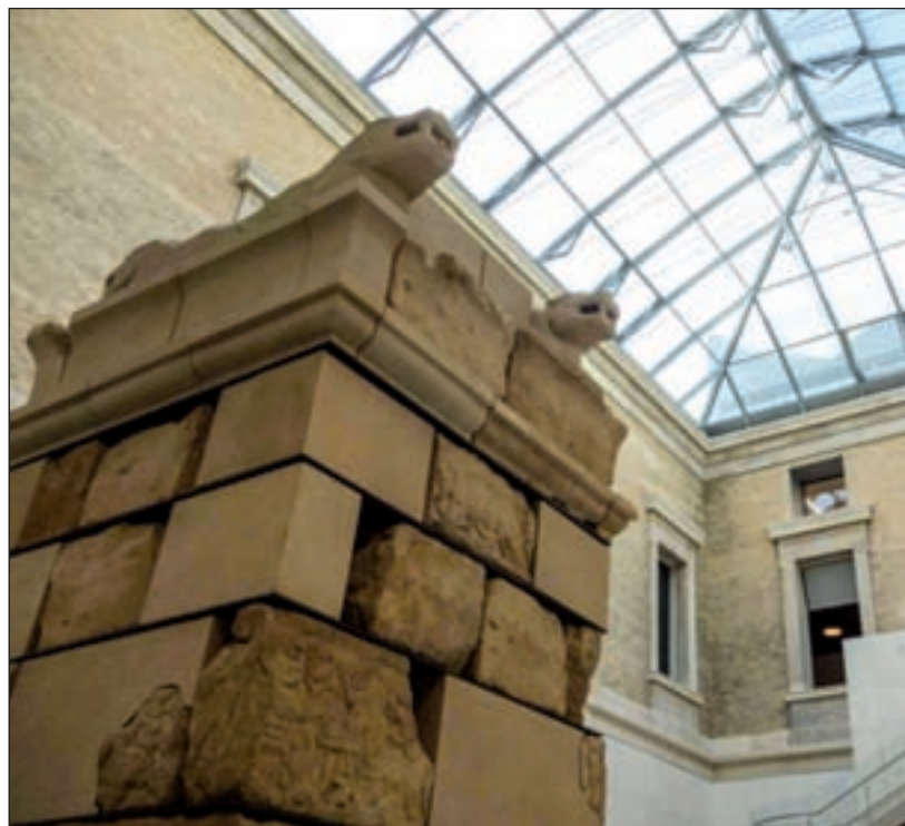
Una de las cúpulas acristaladas del Museo Arqueológico Nacional

No obstante, lo que más destaca de esta nueva etapa es la recuperación de las cubiertas acristaladas en los patios, como ya ocurre en otros edificios europeos, en concreto, el Museo del Louvre en