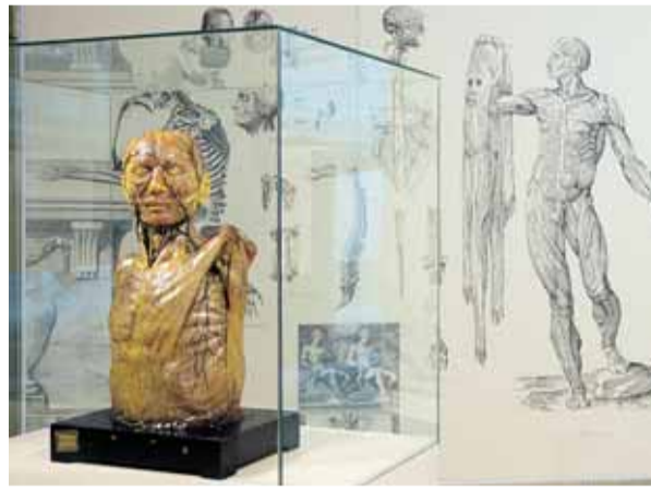
El realismo es la nota predominante de los cuerpos en cera