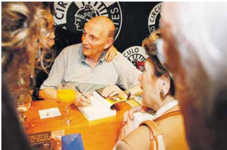
Marcos Ana, durante la presentación de su libro 'Decidme cómo es un árbol', una emotiva memoria de sus años de prisión y lucha por la libertad.

La candidatura de Marcos Ana al Premio Castilla y León de Valores Humanos 2013 fue presentada por la Fundación Ateneo Cultural Jesús Pereda, organización cultural de CCOO en Castilla y León.