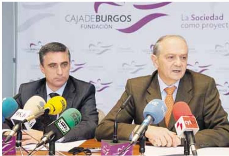
El presidente de la Fundación y el director general presentan las cuentas.