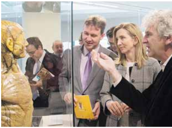
La consejera de Cultura inauguró la muestra en el MEH.