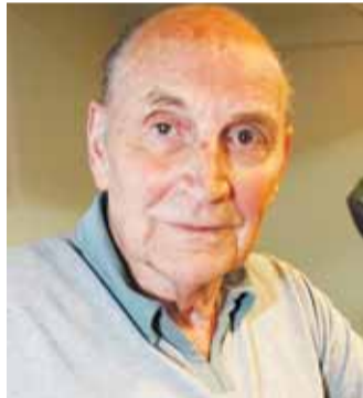
Marcos Ana ha cumplido 94 años.

Desde su casa en Madrid ha agradecido el premio, que quiere