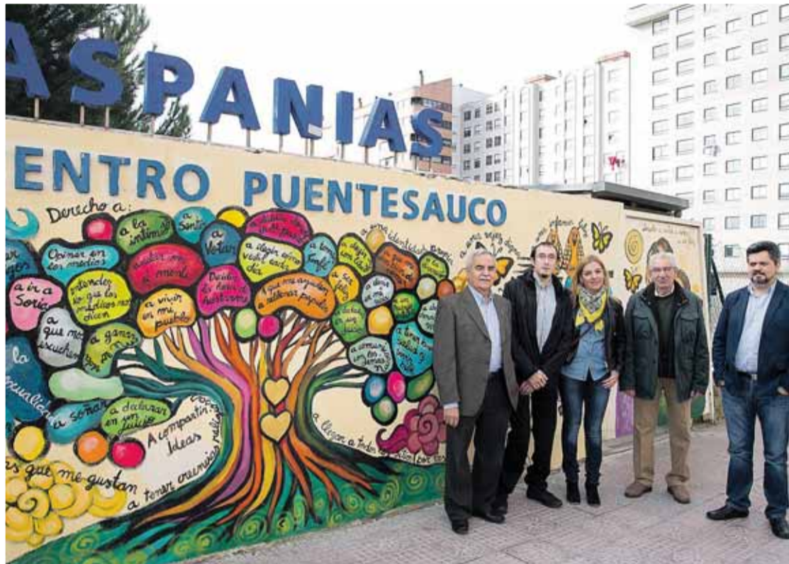
Directivos actuales y antiguos, profesionales y usuarios celebran el 50 aniversario de Aspanias en esta foto.

No sería hasta los años 80 cuando Aspanias consiguió derribar alguno de los muros que le impedían avanzar. En el año 1985 se inauguró el primer centro especial de empleo de Aspanias coincidiendo con la promulgación de una ley que el Gobierno central puso en marcha para establecer bonificaciones para que los empleados de este tipo de centros. "Se decidió