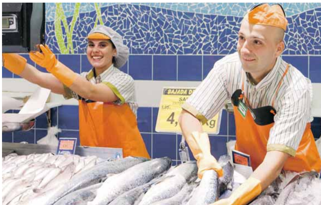
Las nuevas secciones de frescos generaron un incremento notable de la plantilla de Mercadona en Castilla y León.

A ello han contribuido asimismo las inversiones ejecutadas por los interproveedores, empresas que fabrican, entre otras, las marcas Hacendado, Bosque Verde, Deliplus y Compy, que en conjunto alcanzaron los 65 millones en Castilla y León. Actualmente, los interproveedores de Mercadona en la región dan empleo estable a 4.449 personas, y las pymes con las que colaboran, a un total