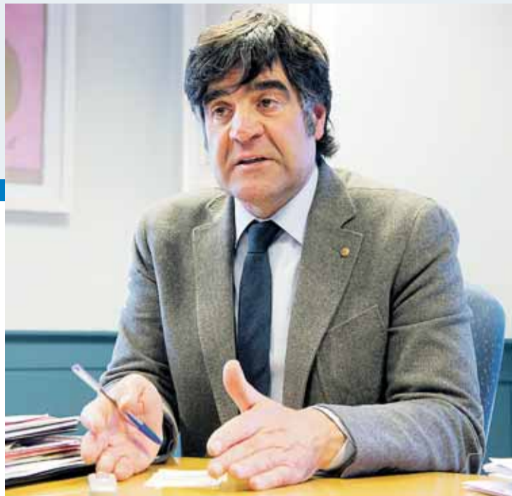
El presidente del IMCyT, durante la entrevista con Gente el día 31.

Tendría dos efectos muy beneficiosos. Estas declaraciones que vienen de fuera nos hacen valorar mucho más lo que tenemos, por lo tanto, en primer lugar, sería una llamada a la concienciación de los propios ciudadanos hacia su casco histórico, hacia su conservación y su disfrute, y en segundo lugar, un efecto de promoción internacional fundamental. Volvemos a hablar de turismo, de promoción de ciudad y de generación de empleo y de riqueza.