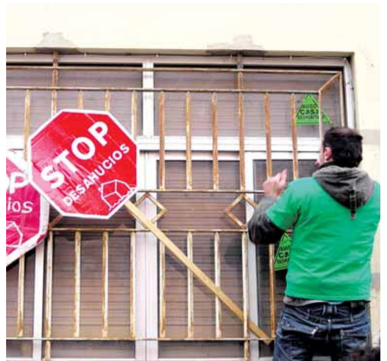
Los miembros de la PAH reclaman viviendas sociales en la capital.

"Además de viviendas hay innumerables locales vacíos. Solo pedimos una solución para quienes lo pasan mal", finalizó.