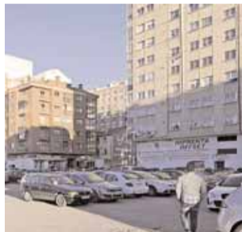
La calle Doña Constanza está muy deteriorada.

I. S. La Junta de Gobierno Local aprobó el jueves día 3 el pliego de cláusulas administrativas que ha de regir el procedimiento para contratar la ejecución de las obras de urbanización de la calle Doña Constanza, en el barrio de Gamonal, "un espacio muy deteriorado" que será objeto de una completa renovación.