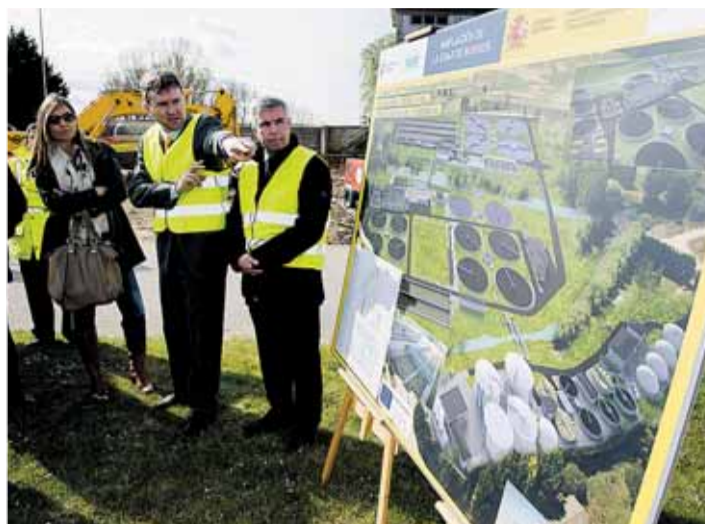
Los responsables visitaron las obras de la EDAR el lunes, 31.

Los trabajos de la EDAR se encuentran al 20 por ciento de ejecución. En este punto, el responsable de ACUAES destacó en declaraciones a los medios que "estamos en plazo" para acceder a los fondos europeos ya que el plazo no expira hasta diciembre