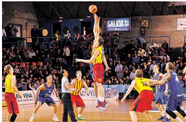
Autocid Ford suma 5 victorias consecutivas.

La fase de ascenso comenzará el próximo 11 de abril en El Plan-