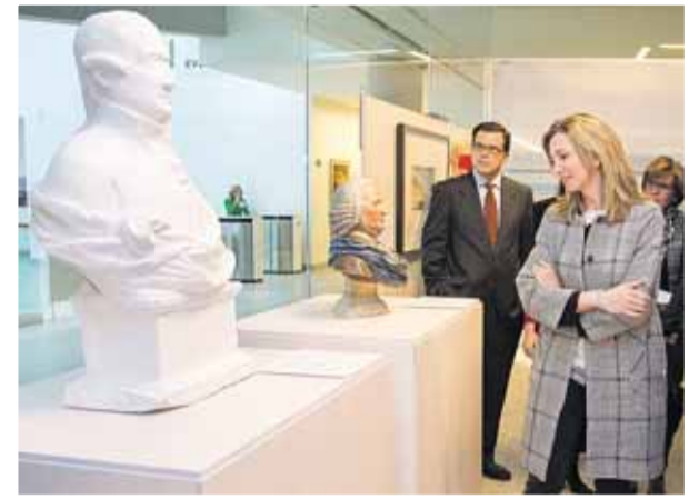
La muestra sale por primera vez de la U.Complutense.