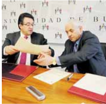
Firma del convenio de colaboración.

Entre las actuaciones del proyecto denominado '50 Aniversario del Petróleo de la Lora' previstas