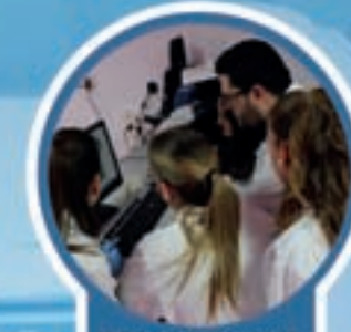
GRADO SUPERIOR ANATOMÍA PATOLÓGICA