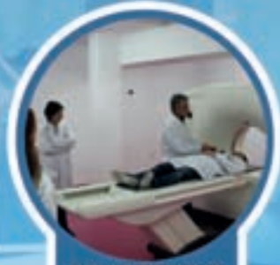
GRADO SUPERIOR DE IMAGEN PARA EL DIAGNÓSTICO