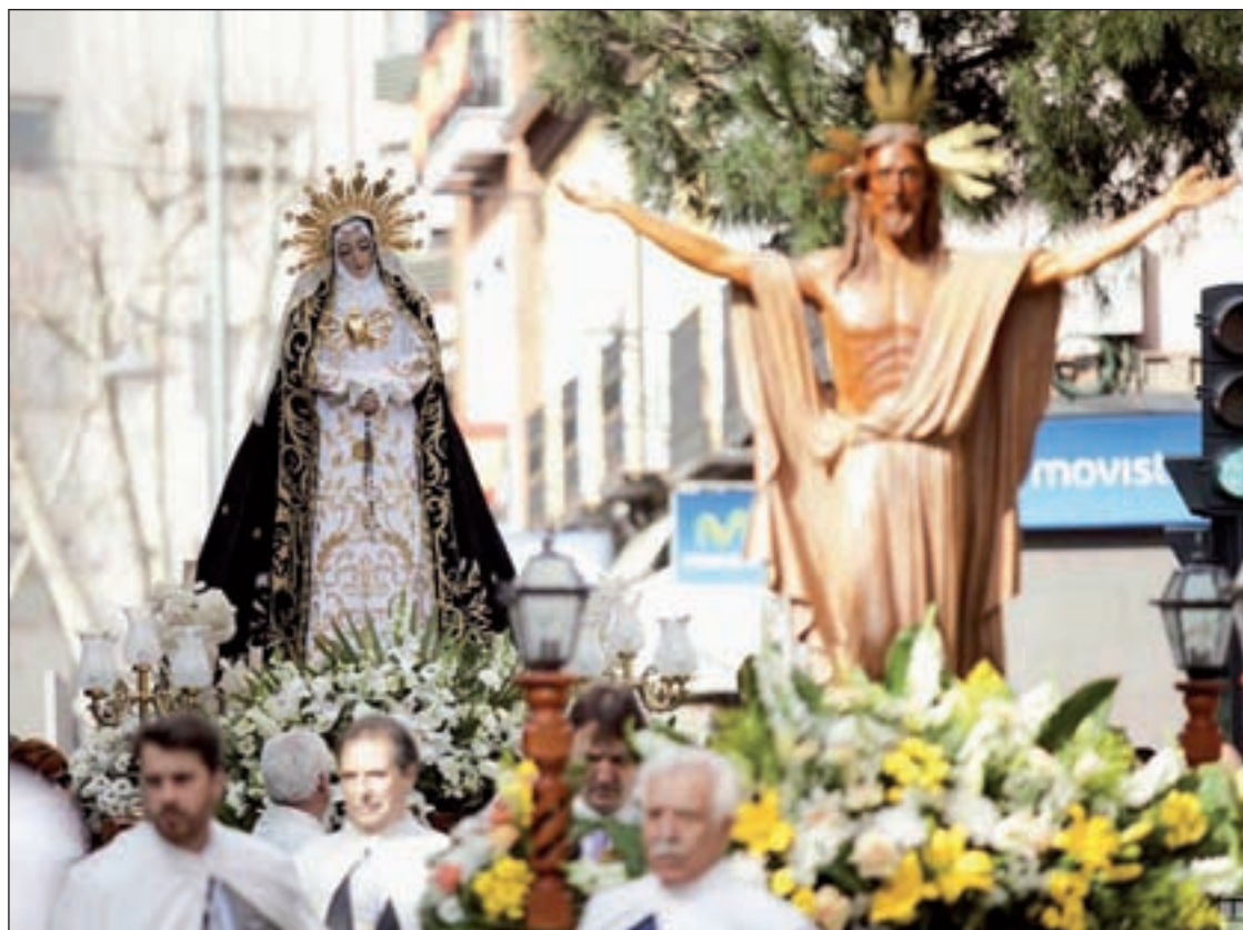
Miles de vecinos en la procesión de El Encuentro en Alcobendas

La Virgen de la Piedad es la más esperada por los alcobendenses. El Cristo de los Remedios recorrerá las calles y avenidas de Sanse PÁG.10