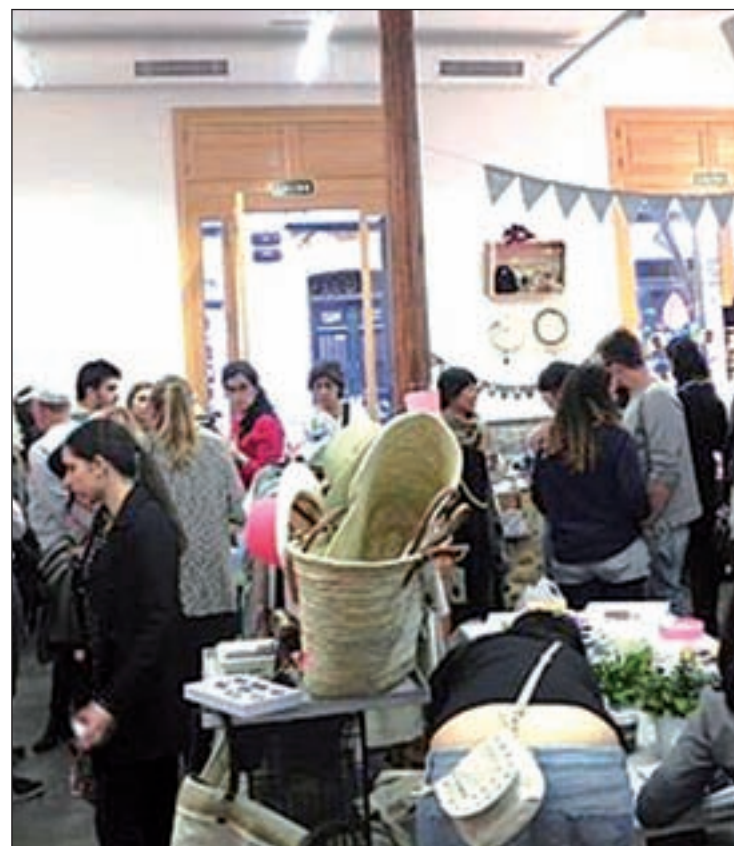
Restaurante Cañadío Madrid

También en uno de los barrios más de moda de la capital, Chueca, el restaurante Oribu Gastrobar propone una cocina de calidad, combinada con la experiencia más casual y divertida de un bar. Aquí los comensales podrán de-