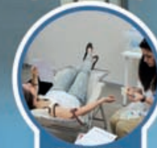
GRADO MEDIO EN AUXILIAR DE ENFERMERÍA