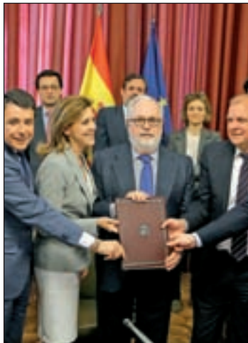
Los presidentes y el ministro

Cazadores y pescadores podrán solicitar la licencia en su comunidad de residencia, y las tasas por la misma se pagarán en esa región, simplificando los trámites administrativos, gracias al conve-