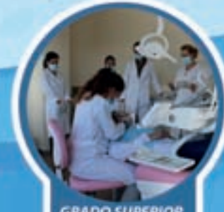
GRADO SUPERIOR DE HIGIENE BUCODENTAL