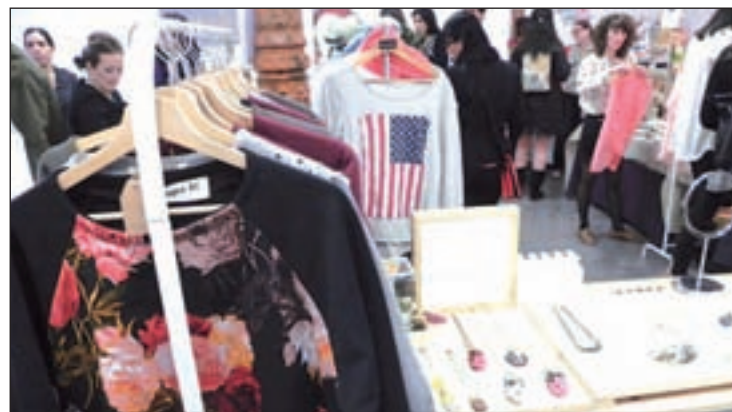
Imagen de la edición anterior del mercadillo

En otra de las zonas más castizas y culturales de Madrid, El Caldero, situado en el barrio de Las Letras, introduce a su menú habitual de cocina tradicional murciana, bacalao al ojo colorao y torrijas al estilo tradicional. Está abierto todos los días de Semana Santa, excepto el domingo y lunes noche. Por último, los asistentes al establecimiento Cañadío Madrid, fiel al estilo y a la filosofía culinaria santaderina, podrán degustar una ensalada con cebolla confitada y tomate Raff o buñuelos de merluza en tempura con suave alioli.