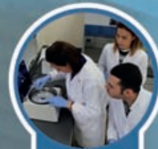
GRADO SUPERIOR DE LABORATORIO DIAGNÓSTICO CLÍNICO

Ésta es tu oportunidad ¡MATRICÚLATE AHORA!