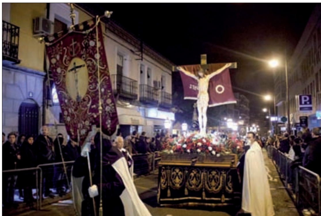
La Cofradía de Semana Santa cuenta con siete pasos

Ya adentrados en la Semana Santa, el Jueves Santo, desde las 19 horas, la iglesia vivirá las cele-