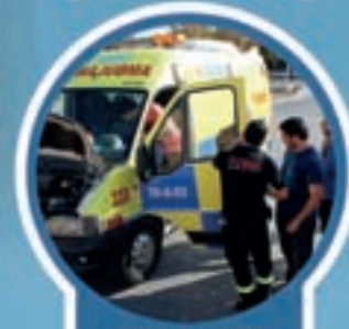
GRADO MEDIO EN EMERGENCIAS SANITARIAS