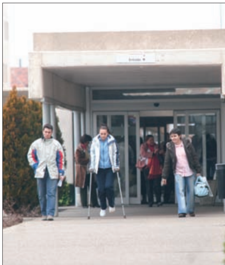
La citación sucesiva permitirá agrupar las consultas GENTE

La incorporación de estas nuevas prestaciones será posible gracias a los 13,6 millones que el Ejecutivo regional va a destinar a la actividad del Centro de Atención Personalizada (CAP) del Servicio Madrileño de Salud durante los próximos dos años, desde el 1 de mayo del ejercicio actual hasta el 30 de abril de 2016. Este servicio público, que presta el grupo Indra, ha sido, desde su puesta en marcha hace cuatro años, un elemento clave para agilizar los procesos de cita y facilitar la libre elección de médico y hospital en Atención Especializada. Una nueva mejora en el servicio del CAP