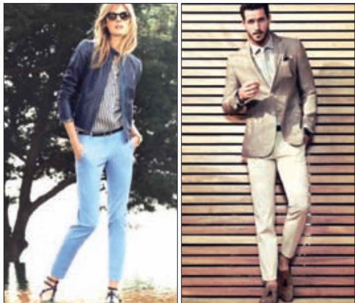
Massimo Dutti propone estos 'looks' para primavera

MODA Opciones para cumplir con el dicho popular