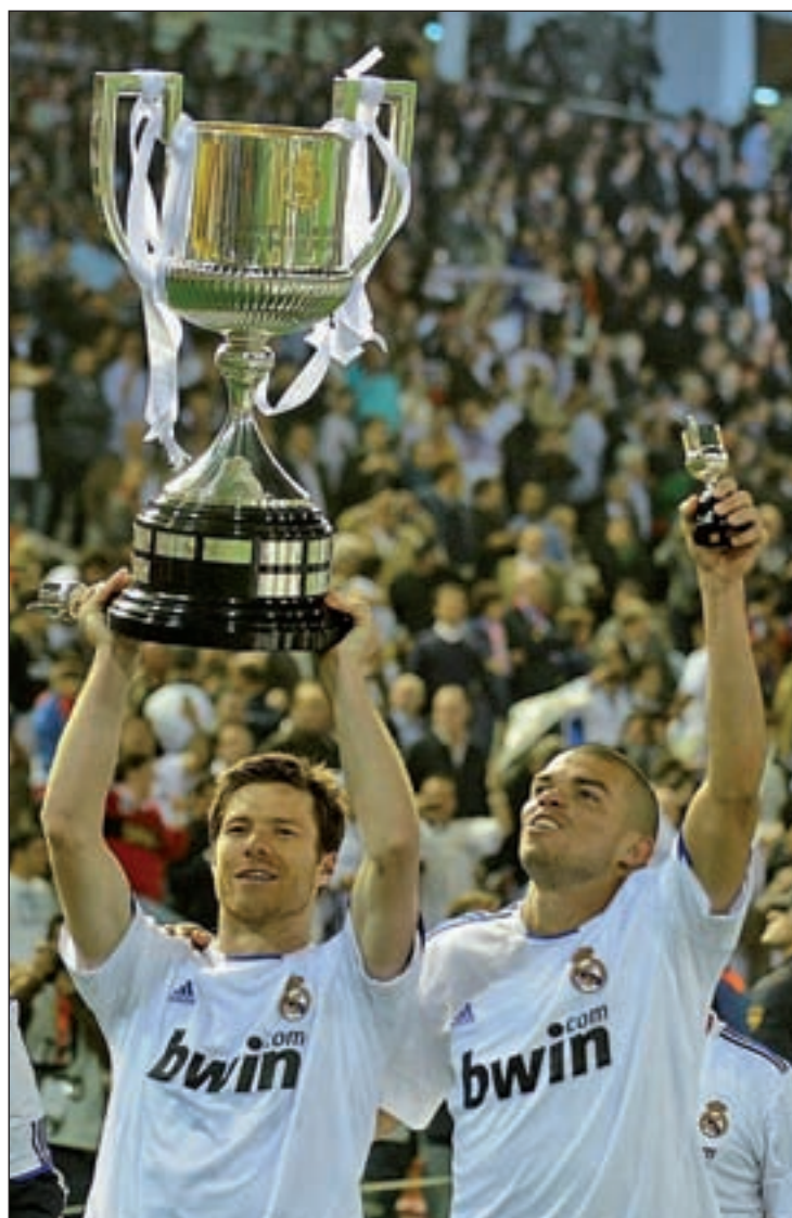
Los aficionados blancos se preparan para otro desplazamiento

Está previsto que la expedición blanca parta el miércoles, a las 9 horas, desde el recinto ferial del barrio de Vicálvaro y, aunque Lora duda de que pueda viajar con el grueso de los aficionados, la emoción del hincha se combina con la responsabilidad que conlleva la organización de este viaje: