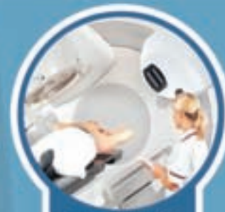
GRADO SUPERIOR DE RADIOTERAPIA