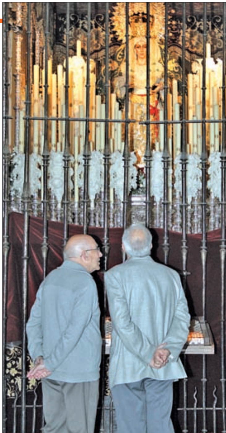
La Esperanza Macarena ya está en su paso

peranza Macarena saldrán de la Real Colegiata de San Isidro, recorriendo el barrio de los Austrias. "Esta hermandad fue creada por ilustres cofrades de Sevilla que se vinieron a vivir aquí, y por ello, también se trajeron la advocación de las dos tallas más veneradas allí, el Jesús del Gran Poder y la Esperanza Macarena. Hoy, está formada por más de 1.200 hermanos de distintos sitios que si-