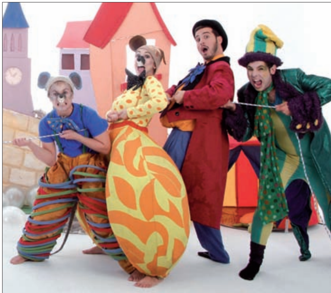
'El flautista de Hamelín' llega para el público infantil

Durante las vacaciones de Semana Santa la capital se llena de numerosas propuestas culturales como la obra 'Testigo a cargo', la exposición de Píxar o la música de Elefantes o David de María