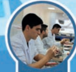
GRADO SUPERIOR PRÓTESIS DENTAL