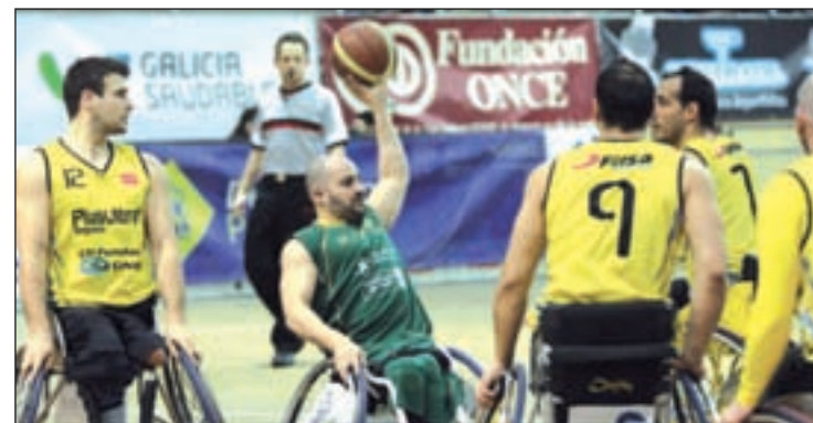
Nuevo éxito para la plantilla del equipo madrileño

Antes de jugar esa final, el Fundosa fue superando los obstáculos que encontró por el camino. El primero fue el Cludemi Almería, al que ganó con un marcador contundente (102-28). Ya en semifinales, el rival fue Amfiv de Vigo, un equipo que puso más a prueba la defensa del Fundosa, aunque finalmente el resultado también acabó sonriendo a los madrileños: 85-54.