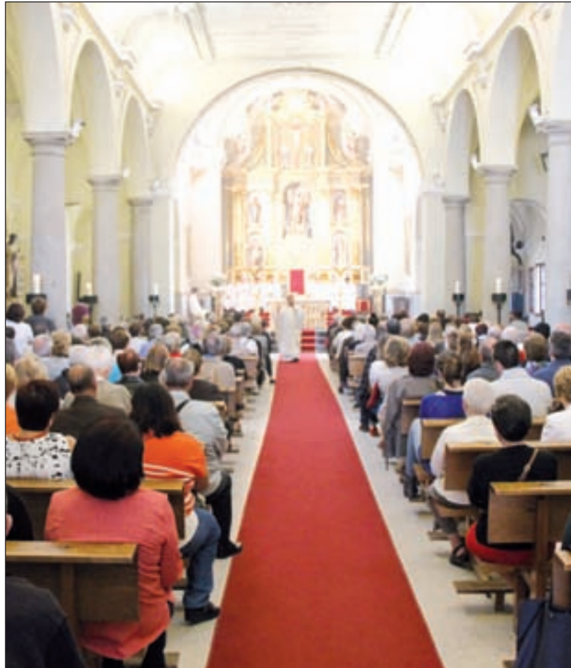
La parroquia de San Miguel Arcángel, lugar destacado