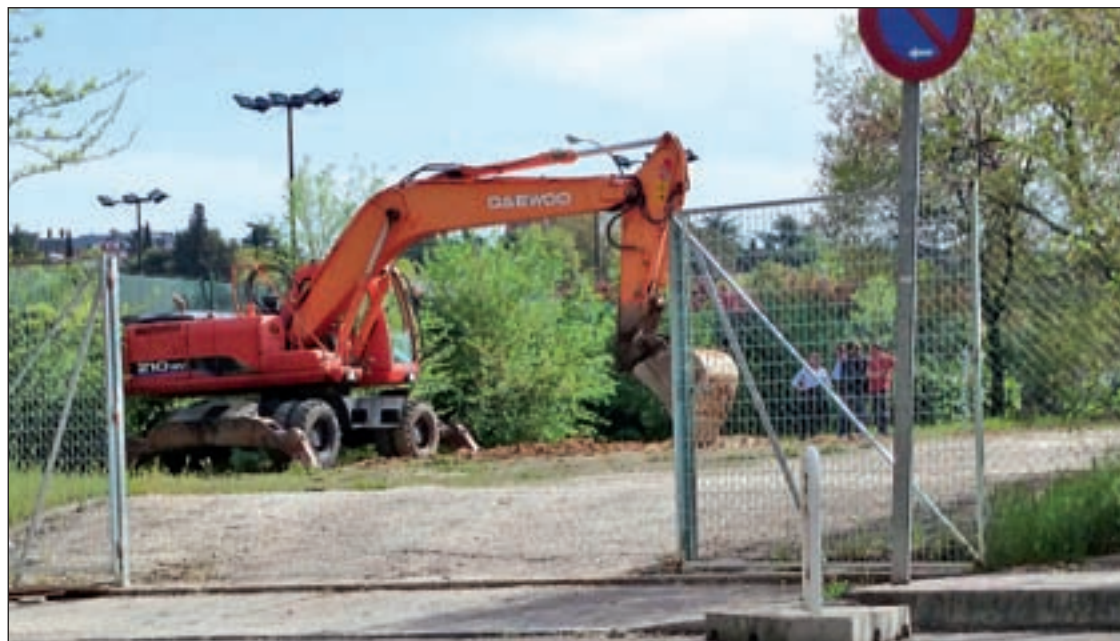
Las obras de mejora de este espacio ya han comenzado

el Centro Cultural Carril del Conde ofrece seis piezas de teatro breve que a través de parejas de mujeres, de hombres y mixtas presentan situaciones de la vida cotidiana. En la tarde del sábado (19 horas), el testigo lo recoge el Centro Cultural Hortaleza donde el grupo de teatro Kalidoscopio adapta la comedia 'Arte', de Yasmina Reza.