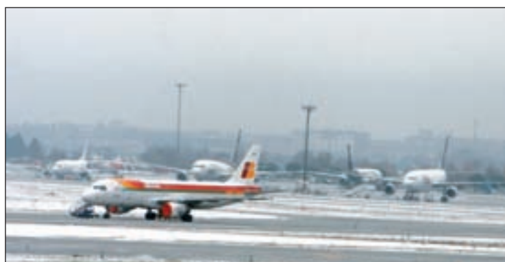
Barajas reúne el 6% de los gases contaminantes de la región

EL PLAN AZUL PLUS REDUCIRÁ UN 70% LAS EMISIONES CONTAMINANTES DEL AEROPUERTO