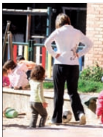
Se repartirán 31.000 becas GENTE