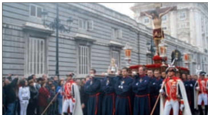
44 anderos portan el Cristo de los Alabarderos

La primera en salir será la de Jesús Nazareno de Medinaceli, una talla del siglo XVII, desde la iglesia de los Padres Capuchinos (plaza de Jesús, 2) a las 19 horas. También, ese día saldrán otras cinco procesiones desde las 19 horas. El sábado, a las 8 de la mañana, habrá una procesión desde la Iglesia de Jesús de Medinaceli y otra a las 16:30 horas desde la parroquia de San Ginés.