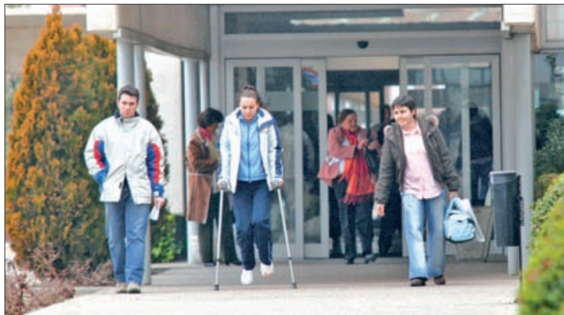
La citación sucesiva permitirá agrupar las consultas para pruebas diagnósticas GENTE

El CAP ha incluido entre sus actividades la explotación de datos de citas y libre elección para adaptar el servicio a las necesidades de los pacientes.