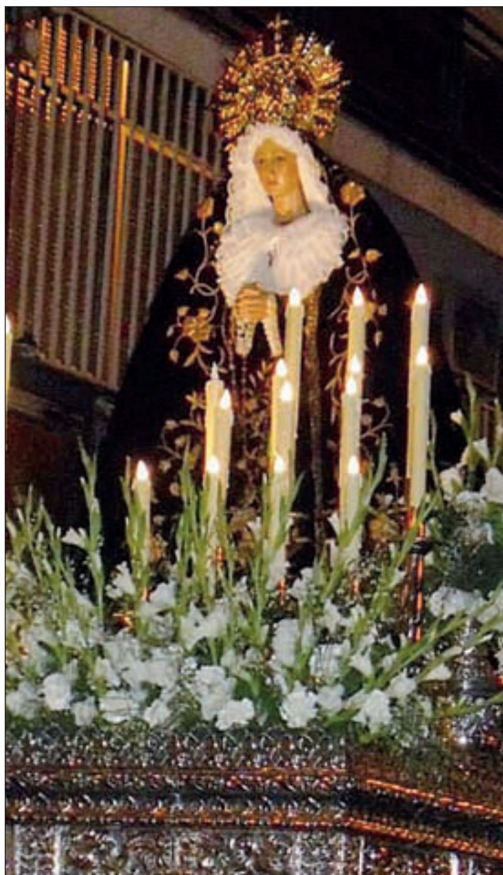
Imagen de la Virgen de la Soledad

Sin embargo, no será el único centro de culto religioso que bendiga los ramos, si no que muchas de las parroquias de la ciudad llevarán a cabo esta tradición. Las iglesias María Auxiliadora, Anunciación y Santa Ana lo harán a las 12 horas, mientras que en Nuestra Señora de Belén y la Sagrada Familia la bendición será a las 13 horas. En las parroquias de San Francisco y Santa Clara será a las 11:30 horas y las 12:30 horas, respectivamente. Por último, en Nuestra Señora de Fátima se producirá a las 11, según ha informado a GENTE la Diócesis de Getafe.