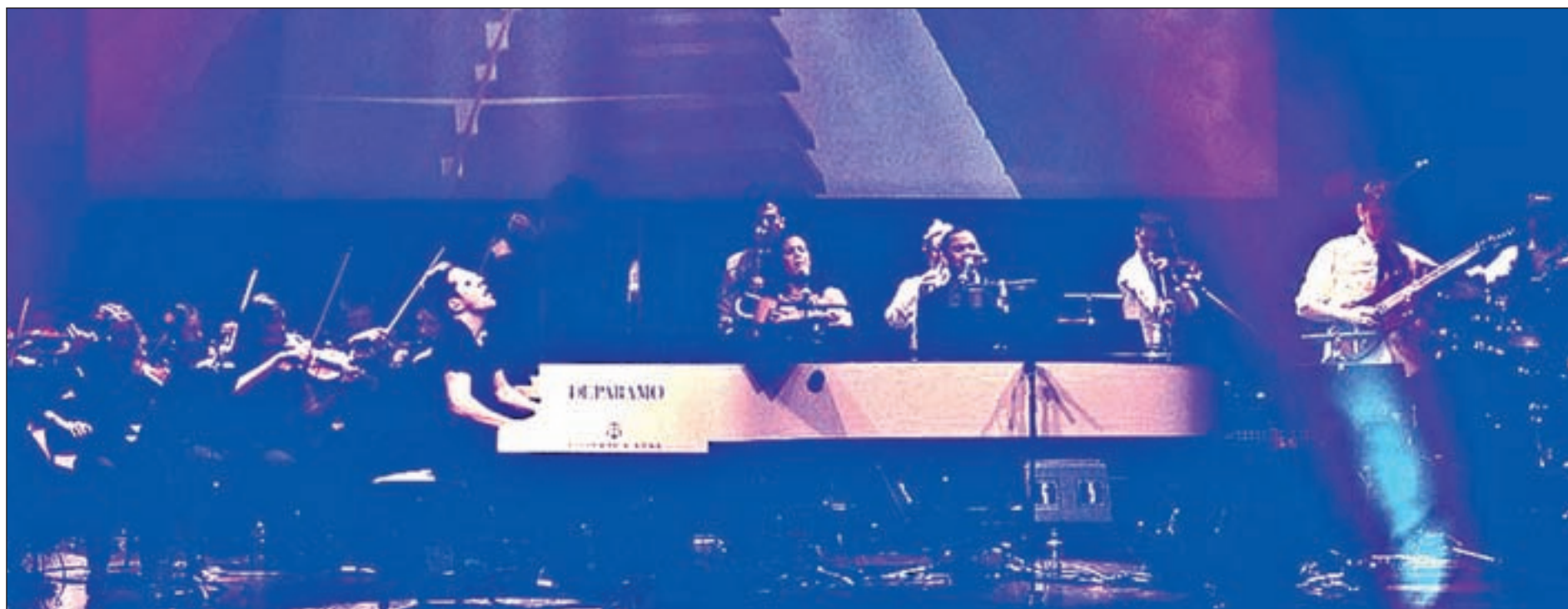
El artista presentó por primera vez este espectáculo en Barcelona, donde vendió todas las entradas