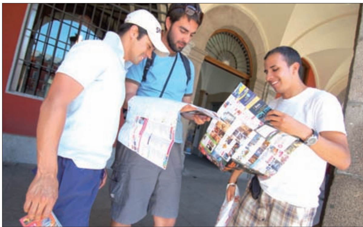
La zona centro de la capital será testigo de una mayor afluencia de turistas GENTE

Sin embargo, si el buen tiempo no acompaña, puede que el pronóstico mejore. Y es que la principal competencia para la capital durante esta festividad religiosa son los destinos de la costa, por lo que, según Antonio Gil, "si la temperatura no es muy buena", Ma-