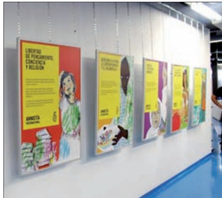
Exposición 'Los derechos de los niños'