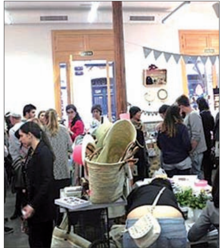
Restaurante Cañadío Madrid

También en uno de los barrios más de moda de la capital, Chueca, el restaurante Oribu Gastrobar propone una cocina de calidad, combinada con la experiencia más casual y divertida de un bar. Aquí los comensales podrán de-