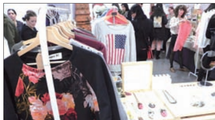
Imagen de la edición anterior del mercadillo

En otra de las zonas más castizas y culturales de Madrid, El Caldero, situado en el barrio de Las Letras, introduce a su menú habitual de cocina tradicional murciana, bacalao al ojo colorao y torrijas al estilo tradicional. Está abierto todos los días de Semana Santa, excepto el domingo y lunes noche. Por último, los asistentes al establecimiento Cañadío Madrid, fiel al estilo y a la filosofía culinaria santaderina, podrán degustar una ensalada con cebolla confitada y tomate Raff o buñuelos de merluza en tempura con suave alioli.