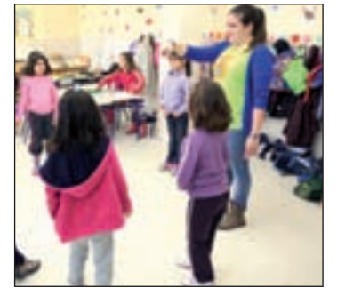
Niños de Fuenlabrada en clases

La iniciativa municipal se dio a conocer a los padres durante la celebración de 'Mi Aula'