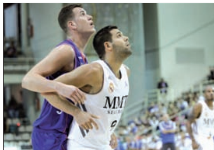
FELIPE REYES, EL PROTAGONISTA Aunque en la actualidad es el capitán del Real Madrid, el ala-pívot blanco se crió en la cantera del Estudiantes. Esta temporada, Reyes está destacando notablemente en el equipo de Pablo Laso, dando un toque más de morbo al derbi de este domingo.

el Zalgiris en tierras lituanas, mientras que el Tuenti Móvil Estudiantes se ha centrado toda la semana en preparar este encuentro. Aunque la diferencia entre los dos equipos es notable, las últimas estadísticas de los derbis suelen estar igualadas. El año pasado venció con comodidad el Real Madrid (74-87), al contrario que hace dos temporadas, cuando ganó el equipo estudiantil por 5 puntos. Entonces, al igual que ahora, los blancos también se encontraban en la zona noble y el Estudiantes en mala posición.