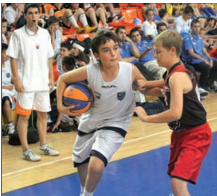
Campus de Vacaciones 2013 BALONCESTO FUENLABRADA

Para los interesados en llevar a sus chicos a la actividad ludico-deportiva, pueden hacerlo poniéndose directamente directamente en las oficinas del Baloncesto Fuenlabrada.