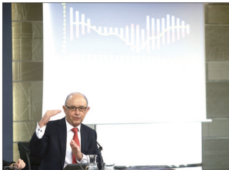
Cristóbal Montoro, ministro de Hacienda

Por lo que se refiere a la tributación indirecta, asegura que se