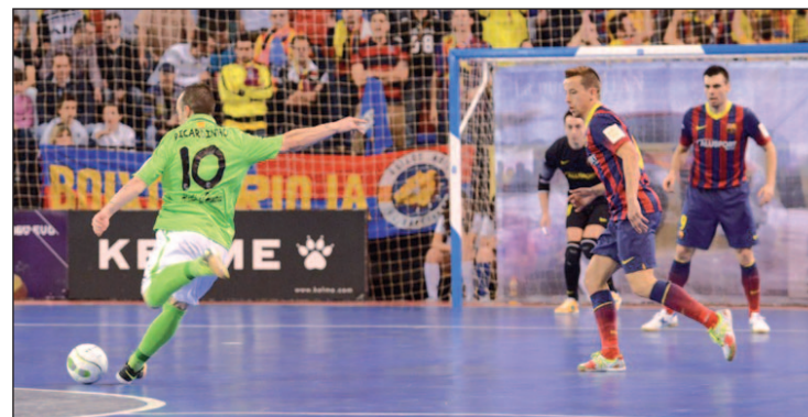
El Inter Movistar y el FC Barcelona, dos de los favoritos al título

Este mismo viernes se alza el telón de la serie de cuartos de final con los primeros partidos de las series que miden al Triman Navarra con el Marfil Santa Coloma y al Montesinos Jumilla, debutante en esta fase, con el vigente campeón, el FC Barcelona. Para el sábado quedan programados los partidos Burela Pescados Rubén-ElPozo Murcia y Ríos Renovables-Inter Movistar.