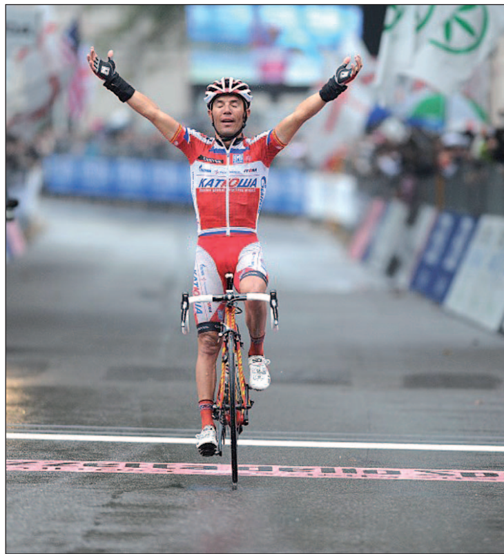
El corredor del Katusha parte entre los favoritos

Pero para alcanzar ese gran éxito, 'Purito' deberá superar varios es-