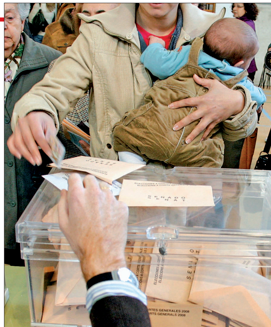
Los electores tienen una cita con las urnas el 25 de mayo

Junto a la agrupación de Vidal-Quadras llega a unas elecciones Impulso Social, que agrupa Fami-