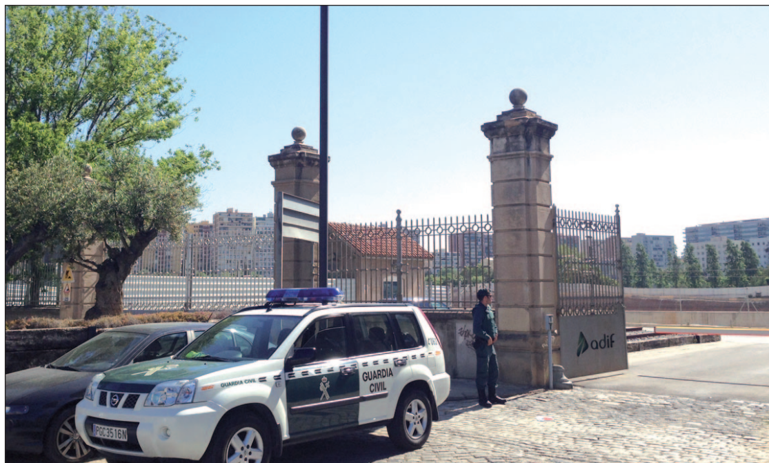
Uno de los registros practicados el pasado lunes en Adif

Además, precisa que se utiliza de manera extraordinaria, como lo demuestra que en 2013 concediera menos del 3% de las peticiones y que en el 94% de los casos cuente con el parecer “favorable” del tribunal sentenciador y/o el Ministerio Fiscal.