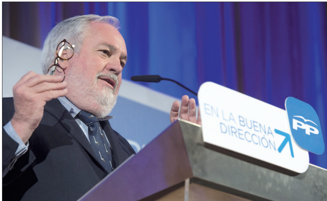
Miguel Arias Cañete, cabeza de lista electoral del Partido Popular

El Barómetro de Opinión realizado por el Centro de Investigaciones Sociológicas (CIS) el pasado mes de abril otorga al PP una estimación de voto del 31,9%, frente al 26,56% que concede al PSOE. Ambos caen unas décimas respecto a la encuesta de enero (dos décimas el PP y cuatro el PSOE), marcando nuevos mínimos históricos.