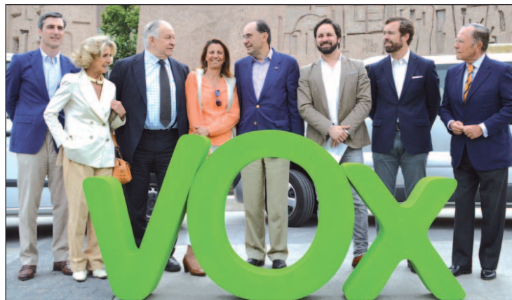
Abascal y Vidal-Quadras, durante el acto en la Plaza de Colón

VOX cuenta con 4.000 afiliados y 10.000 voluntarios para hacer llegar su mensaje, a través de más de 300 actos. "Vamos a tener presencia en más de 500.000 hogares españoles", aseguró el secretario general. Además, este partido se ha dirigido por carta a todos los ciudadanos británicos, alemanes,