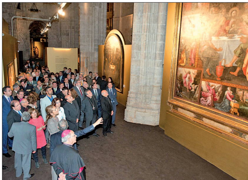
La infanta Elena recorrió la XIX muestra ‘Eucaristía’

Las Edades del Hombre, que ya ha recibido a 10.230.000 visitantes a lo largo de veinticinco años, es un proyecto cultural y turístico vivo y actual. La Junta de Castilla y León ha apoyado la organización y difusión de estas muestras de