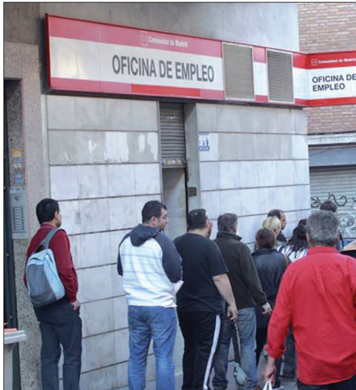
El paro se ha reducido en el último año un 6,1%

En concreto, el volumen total alcanzó a cierre del pasado mes la cifra de 4.684.301 personas sin trabajo, tras reducirse en el último año un 6,1%. En términos de estacionalización, el paro se redujo en abril en 50.202 desempleados, su mayor descenso en este mes dentro de la serie, y ya acumula su noveno recorte mensual consecutivo, lo que no sucedía, según el Ministerio, desde el año 1999.