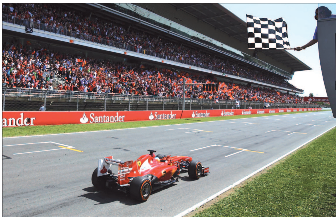
Barcelona volverá a vibrar con el piloto de Ferrari

Durante estas semanas de parón, las diferentes escuderías pueden haber trabajado en unas mejoras