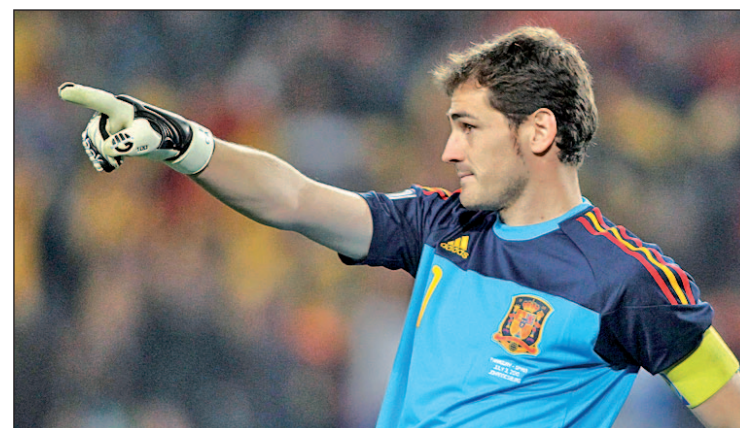
El portero habría pagado dos millones de euros

Al menos siete futbolistas están siendo inspeccionados por presunto fraude fiscal, que ya afectó recientemente al jugador Leo Messi; sin embargo, en la inspección a Casillas se ha considerado que, a diferencia de lo que la Agencia Tributaria y la Fiscalía consideraron en el caso de Messi, no ha habido ánimo de eludir las obligaciones fiscales. Por eso, su expediente no se ha llegado a