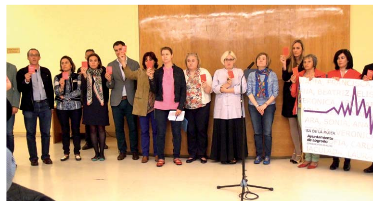
Concentración mensual convocada por la Mesa de la Mujer.