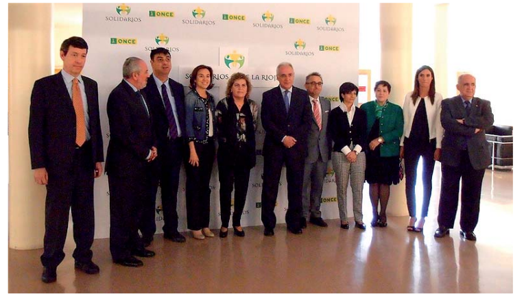
Foto de familia con los galardonados de los II Premios Solidarios Once.