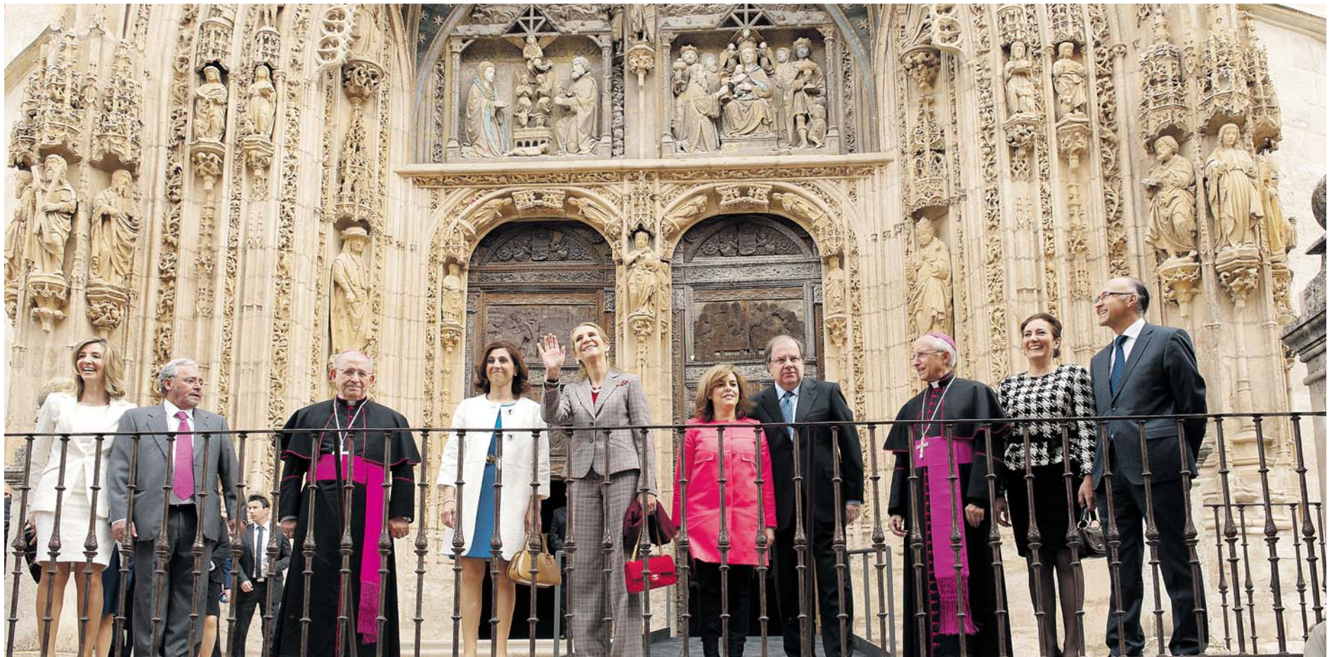
La infanta Elena, acompañada por autoridades civiles y eclesiásticas, saluda al público congregado frente a la iglesia de Santa María, minutos antes de visitar 'Eucaristía'.

LAS EDADES DEL HOMBRE LA INFANTA ELENA INAUGURÓ EN ARANDA LA XIX EDICIÓN DEL PROYECTO EXPOSITIVO DE ARTE SACRO