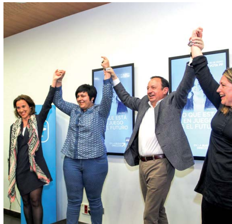
Pegada de carteles en la sede del Partido Popular.