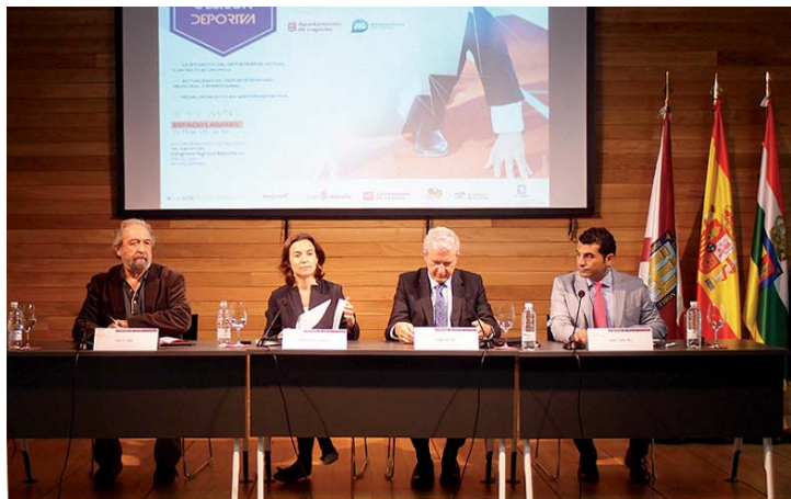
Inauguración del Congreso en el Espacio Lagares.