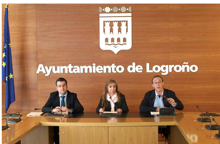
Presentación de las actividades deportivas.

Así, a la nueva edición del torneo '3X3 Interbarrios', que arrancó el pasado 1 de mayo en el barrio de San José, se sumarán otras prácticas deportivas en doce zonas de la ciudad (Valdegastea, 7 Infantes de Lara, Varea, Zona Centro, San Antonio, El Arco, La Estrella, Lobete, Fueclaya, El Carmen, El Cubo