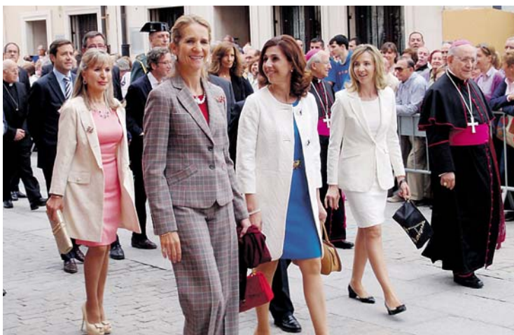
La Infanta, durante su recorrido por las calles de Aranda.

La muestra está llamada a ser evento cultural y turístico de referencia en 2014