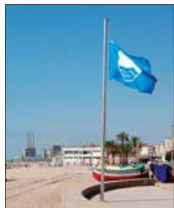
Habrán 573 playas con bandera