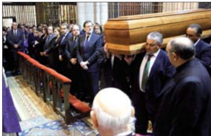
El presidente del Gobierno, Mariano Rajoy, acudió al funeral