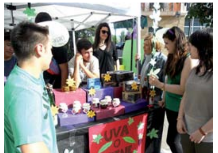
Puesto en el mercado instalado en la plaza de las Escuelas Trevijano.