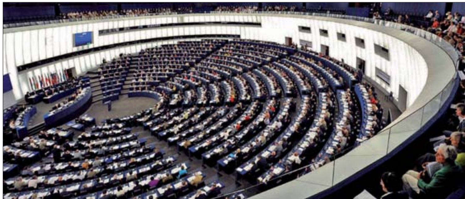
Un total de 54 españoles pasarán a formar parte del Parlamento Europeo tras las próximas elecciones

Par más información: www.gentedigital.es