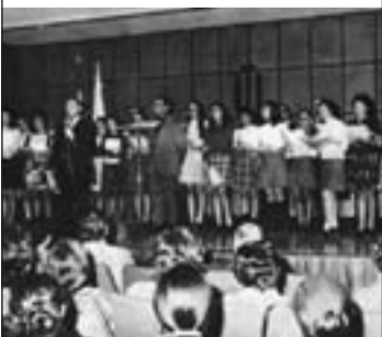
Primera actuación del Orfeón.