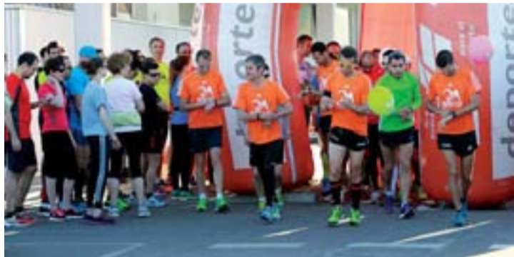
La primera quedada fue todo un éxito de participación.