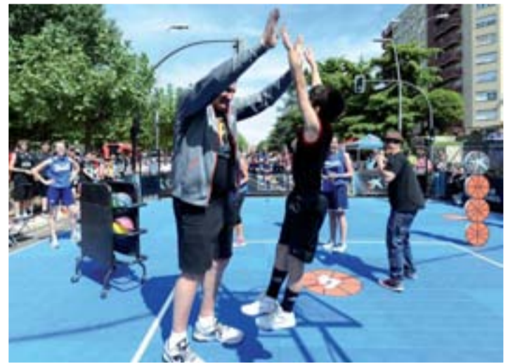
Imagen del pasado evento celebrado en León.