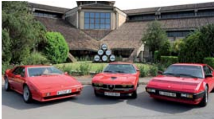
Lotus, Alfa Romeo y Ferrari en la puerta de la bodega.

Los apasionados de la fotografía también tendrán un hueco en