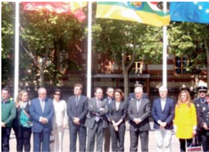
Autoridades locales y regionales en el Ayuntamiento.