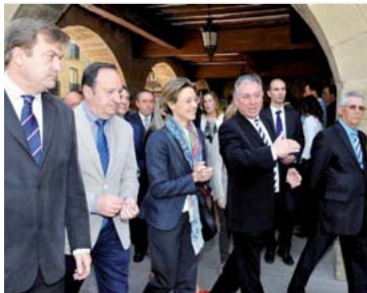
Visita de la ministra a San Asensio el pasado jueves.