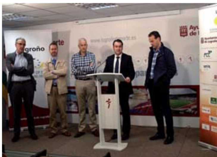
Presentación en rueda de prensa del torneo.

Los municipios integrantes de esta asociación con Logroño son: