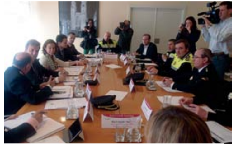
Reunión de la Junta Local de Seguridad.