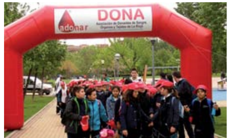
Pequevalvanerada de 2013 en su octava edición.