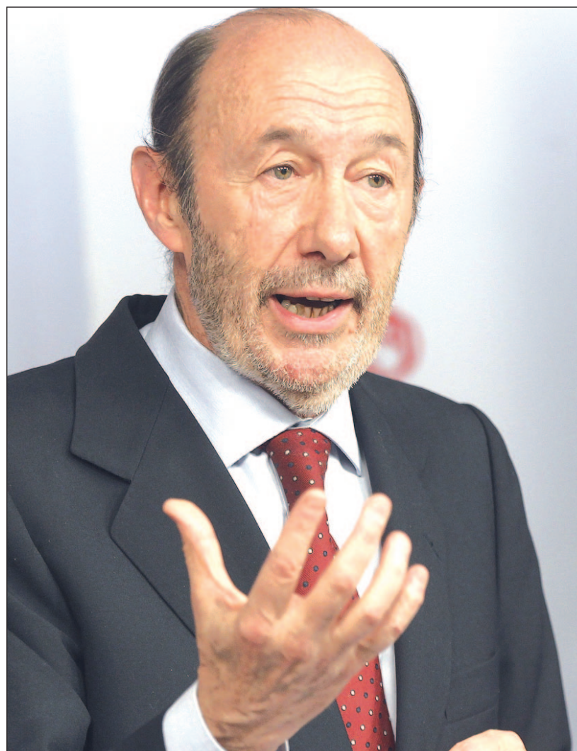
Alfredo Pérez Rubalcaba, en rueda de prensa el pasado lunes

Sin embargo, el nombre que más suena tras el éxito obtenido en las europeas es el de la presidenta de la Junta de Andalucía,