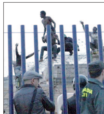
Entrada de inmigrantes