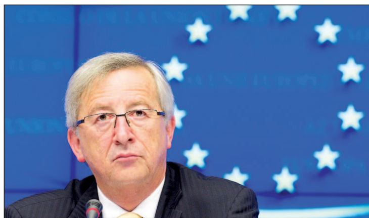
Jean-Claude Juncker, candidato a presidente de la Comisión

En concreto, el PP europeo ha obtenido la victoria con 212 de los 751 escaños en juego (el 28,2% del total), frente a los 185 eurodiputados obtenidos por los socialistas (el 24,63%). En tercera posición se sitúan los liberales de ALDE con 71 escaños (el 9,4% del total), seguidos de los verdes con 55 escaños (el 7,3%), Izquierda Unitaria con 45 escaños (5,9%) y los