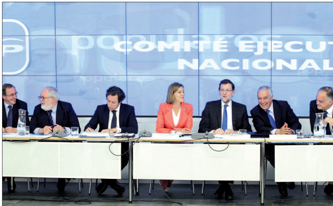
Mariano Rajoy y María Dolores de Cospedal, en el Comité Ejecutivo Nacional

Este punto fue reconocido por el presidente del Gobierno, Mariano Rajoy, que anunció ante el Comité Ejecutivo Nacional un plan para dinamizar el partido a partir de septiembre, de cara a las