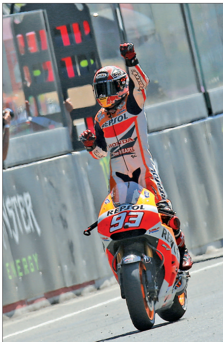
El piloto español quiere dar otro golpe en el Mundial

Un poco mayor es el colchón que tiene el líder de Moto3, Jack Miller, aunque aquí la atención pasa por ver cómo se comporta en la pista el australiano tras su último pique con Efrén Vázquez, quien aseguró que Miller "está loco, no tiene nada en la cabeza".