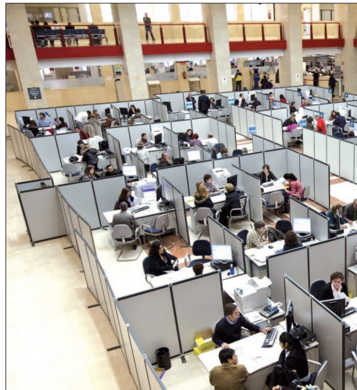
Una oficina de la Agencia Tributaria

Según explica el estudio, los ciudadanos aportaron en 2011 al Estado 139.737 millones de euros, el 90,76% del total, mientras que las empresas pusieron el 9,24%, 14.529 millones de euros, fruto de beneficios y ventajas fiscales que han reducido un 64% la recaudación vía impuesto de sociedades y provocado que frente al 30% de ti-