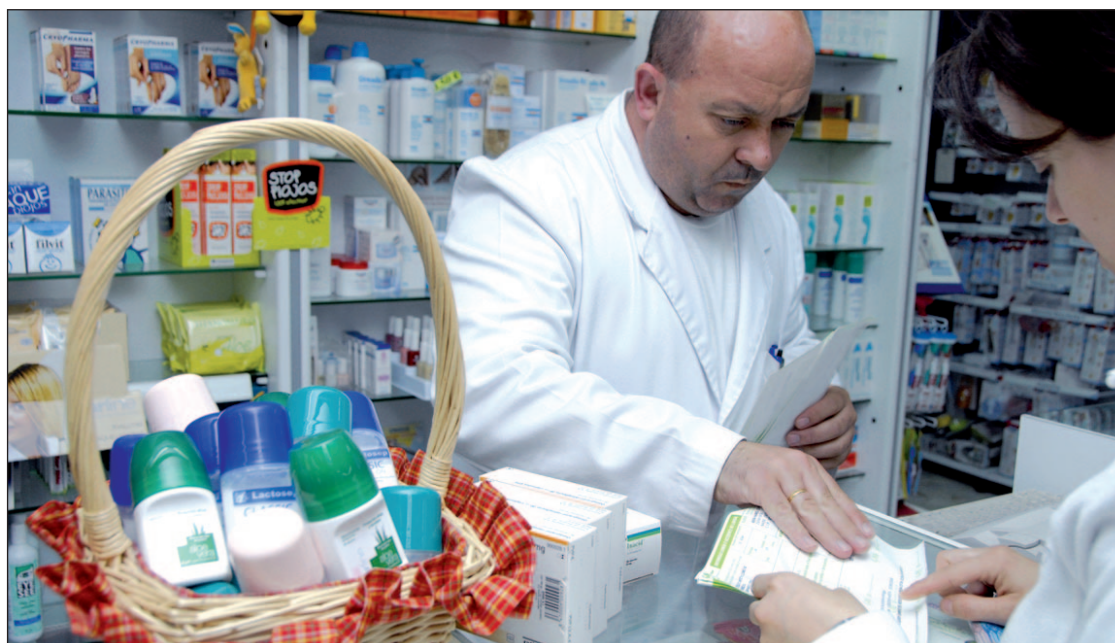
Sanidad ha ampliado el plazo de aplicación de este sistema hasta 2015

Del resto, en Asturias logra conseguir cita de un día para otro el 62 por ciento de los pacientes, seguida de Extremadura (61%), Aragón (61%), Castilla-La Mancha y Castilla y León (ambas un 55%), Galicia y Cantabria (52%), País Vasco (51%), Murcia (47%), Andalucía (38%), Madrid (36%), Comunidad Valenciana (26%) y Baleares (20%).