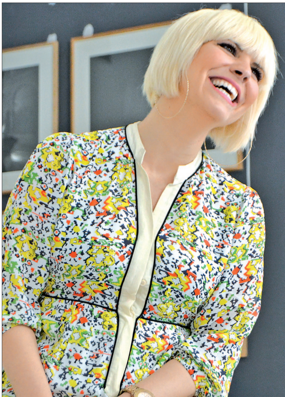
Pasión Vega, antes de su concierto en Madrid