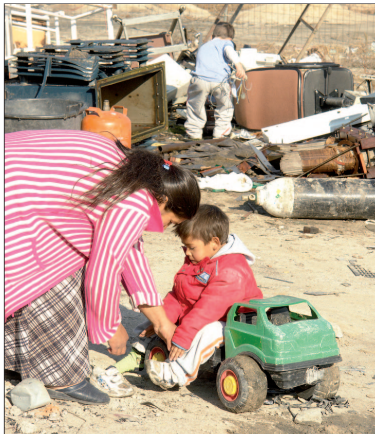
Desciende el riesgo entre los mayores de 65 años

Este indicador no afecta a todos los ciudadanos por igual. Se registran tasas más altas entre quienes se quedaron en estudios primarios o por debajo (25,1%), en los hogares monoparentales con hijos dependientes a cargo (38%) y entre las personas en paro (39,9%).