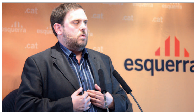
Oriol Junqueras, presidente de ERC

INDEPENDENTISMO LOGRAN MÁS DEL 40% DE LOS VOTOS