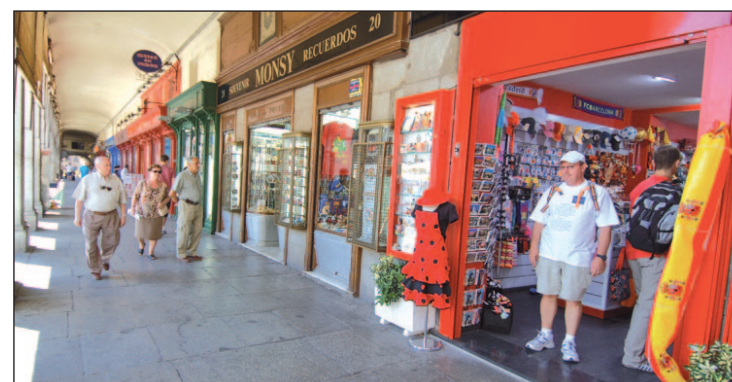
La estancia media aumenta un 7,2%

gasto medio por viaje (+4,6%). En los cuatro primeros meses del año, el gasto medio diario aumentó un 0,9%, hasta 111 euros, y el gasto medio por turista se incrementó en un 1,8%, hasta 968 euros. La estancia media se incrementó un 7,2%, fijándose en 8,4 noches.