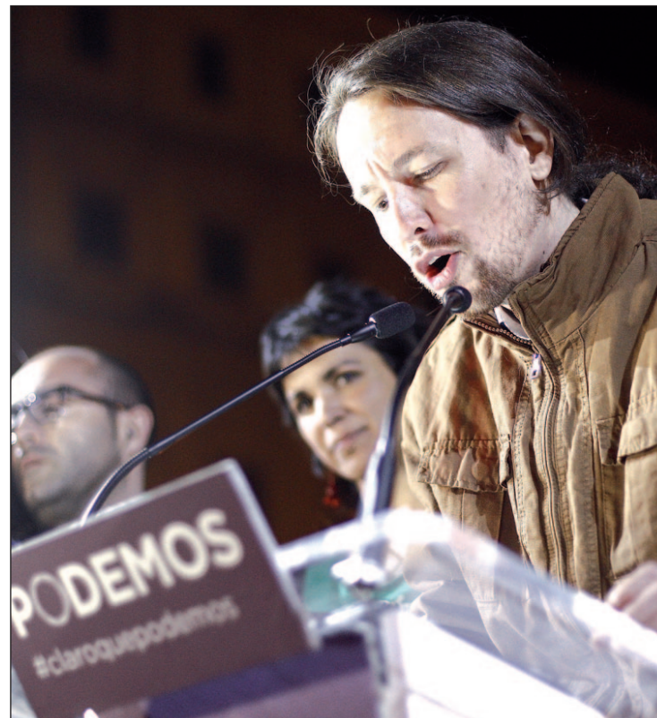
Pablo Iglesias, líder de Podemos

Sin embargo, su programa, que recoge el sentir y la opinión de la calle, puede parecer irrealizable en ocasiones. Un salario mínimo digno y otro máximo, nacionalización de empresas vinculadas a