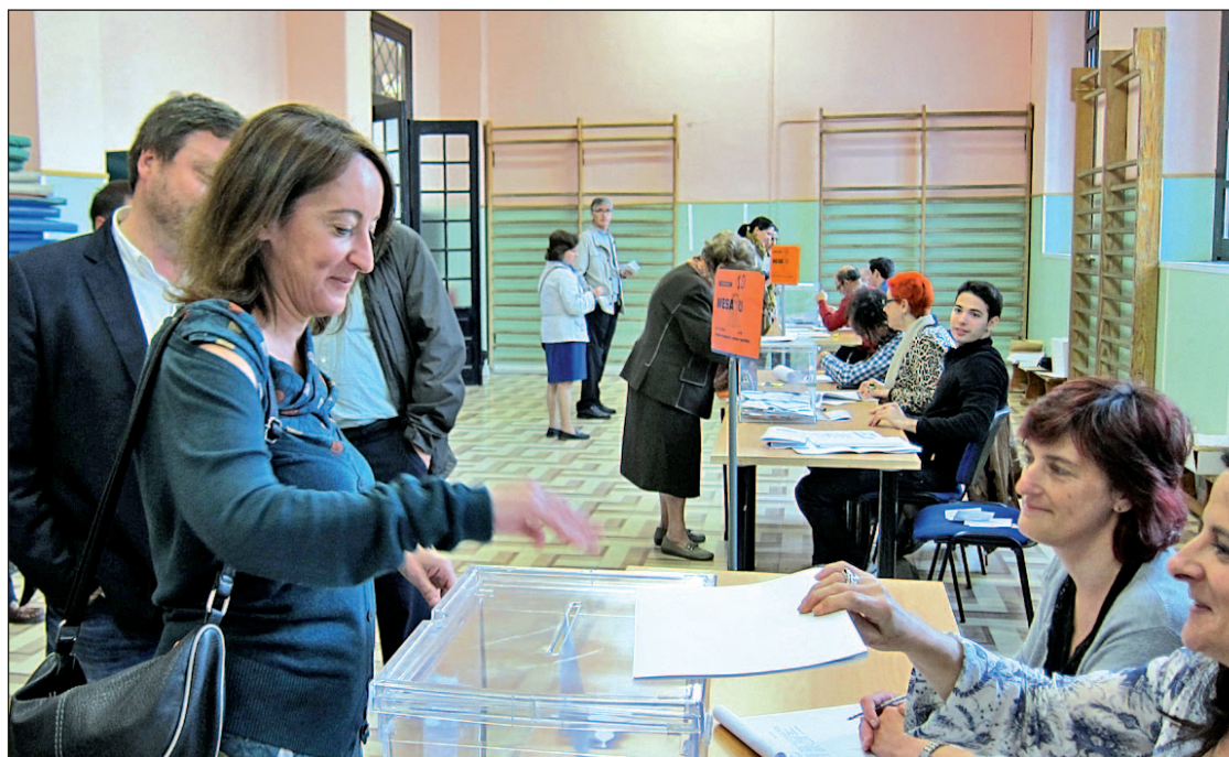
Más del 54% de los ciudadanos decidieron no ir a votar

Lo cierto es que no se pueden extrapolar los resultados electorales a unas generales. El alto número de ciudadanos que decidió quedarse en casa; el diferente sistema de recuento, que utiliza una