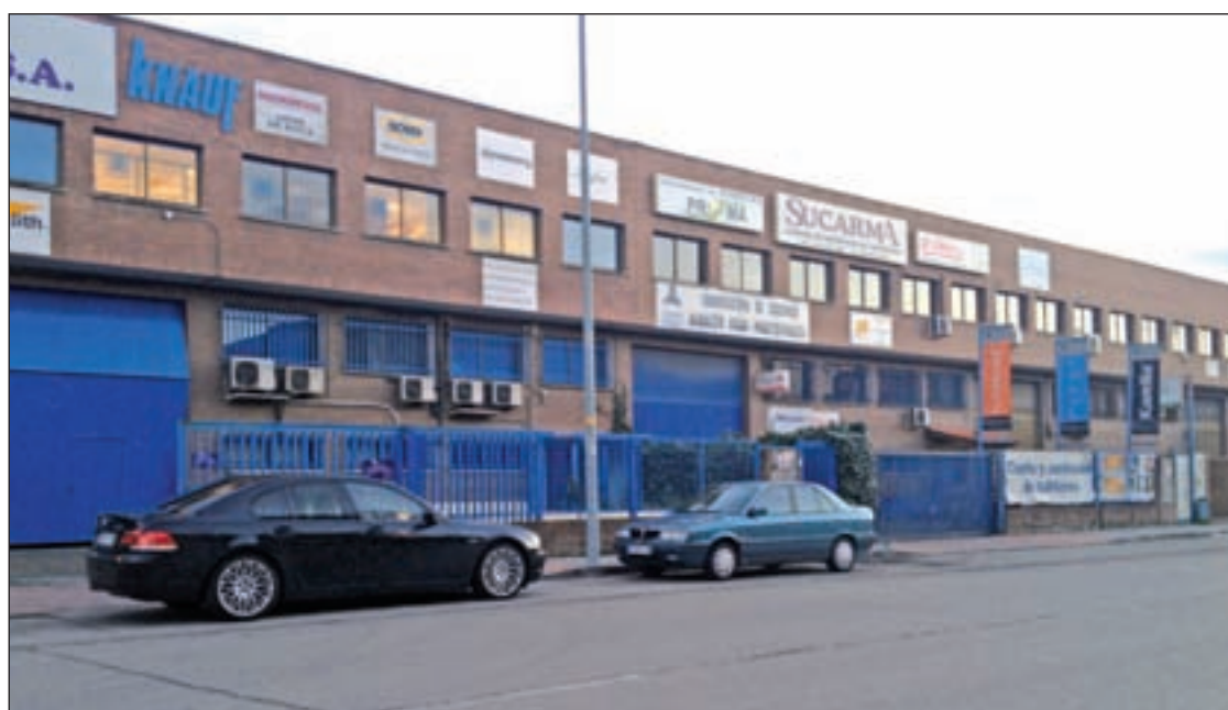
Uno de los polígonos del municipio en el que ya está instalado la banda ancha

durante la época estival, de junio a septiembre, debido al incremento de las temperaturas y de la radiación solar. La finalidad es evitar situaciones como la irritación de ojos o de garganta, tos o dolor de cabeza, entre otros. Los interesados pueden llamar al 616 42 48 03.