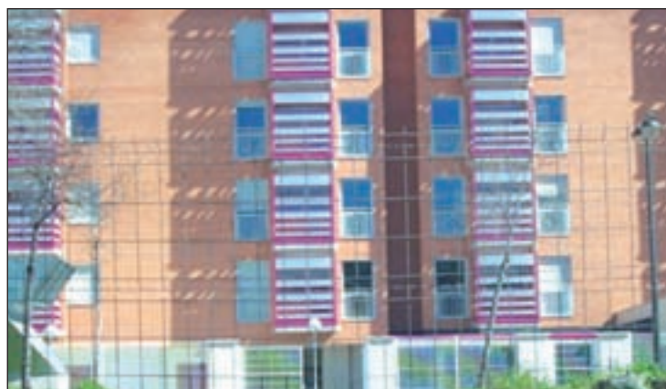
Pisos tutelados de la avenida de las Ciudades

La adjudicación se ha realizado en base a la Ordenanza Reguladora del Procedimiento de Adjudicación de Viviendas municipales para emergencia social del Ayuntamiento y a los baremos recogidos en ella, que contemplan que el alojamiento tendrá un carácter temporal que permita su rotación. Según la ordenanza, la puesta a disposición de las viviendas conllevará un canon mensual de como máximo un 30 por cien-