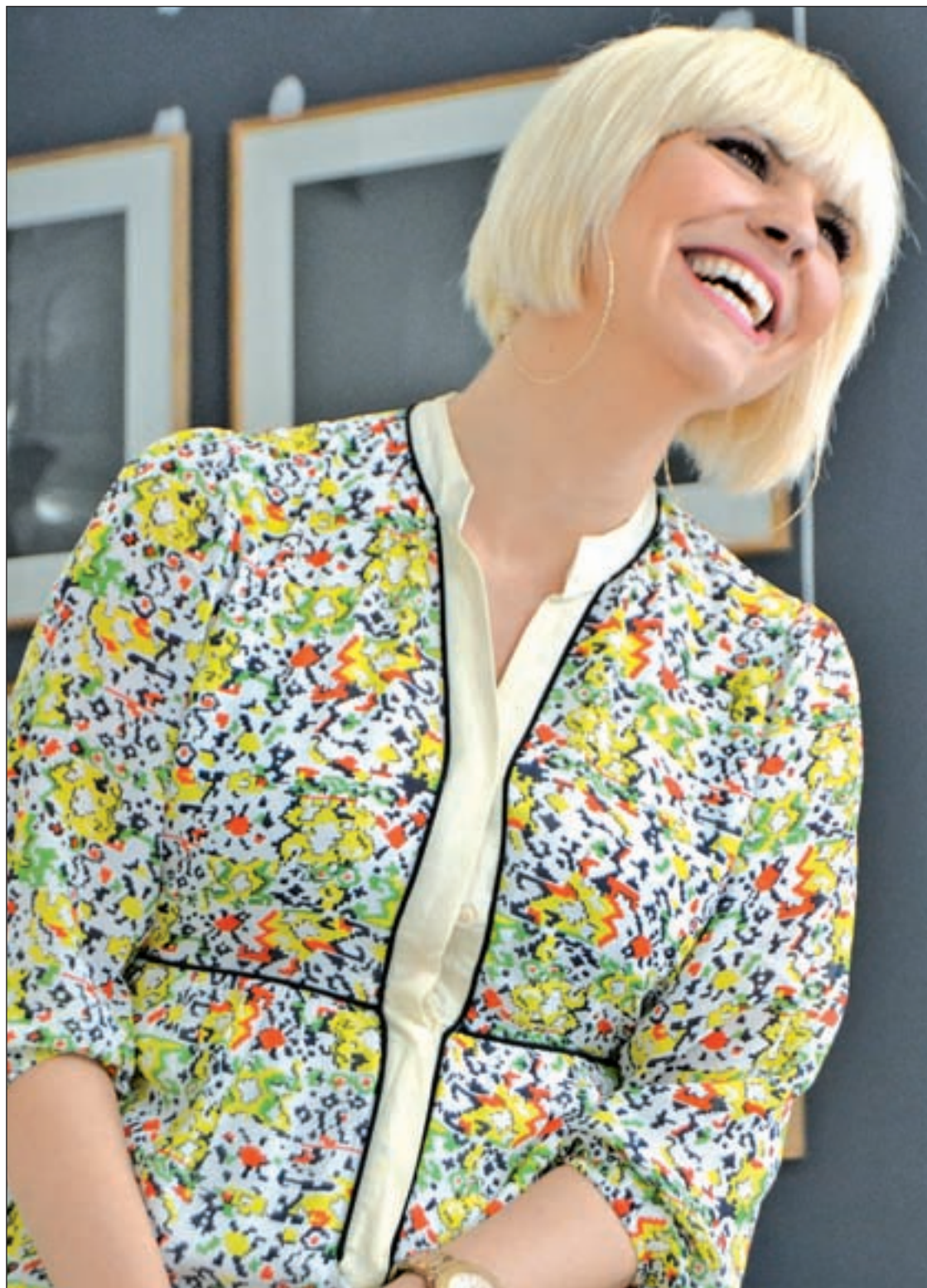
Pasión Vega, antes de su concierto en Madrid