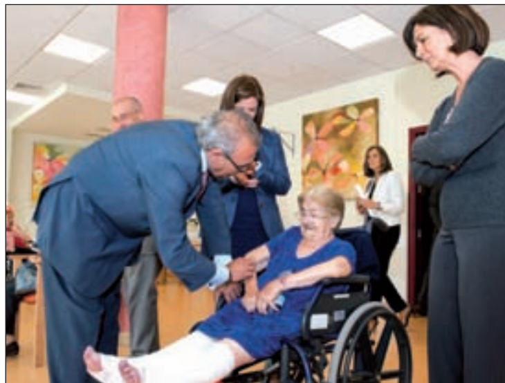
Fermosel presenta el portal en una acto en Pozuelo

POBREZA EN LA TERCERA EDAD Respecto al comunicado que el sindicato CCOO publicó el día anterior en el que se denunciaba la situación de pobreza en la que viven 155.000 mayores de la Comunidad de Madrid (14,7 por ciento de la población que supera los 65 años), el Consejero respondió que el Gobierno ha aumentado un 4,3 por ciento (53 millones de euros) la partida de este departamento y de los 1.303 millones dedicados a Servicios