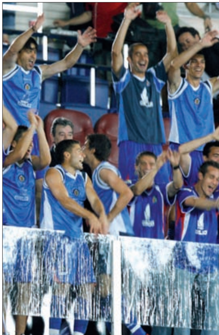
Imagen del Coliseum Alfonso Pérez