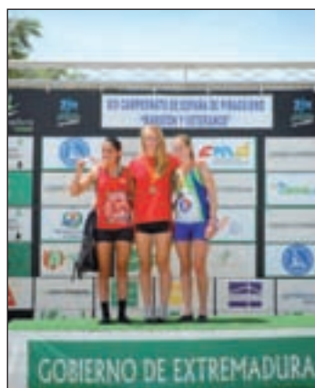
Prácticas de piragüismo