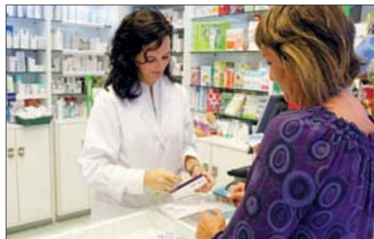
Las personas mayores son las que más cumplen