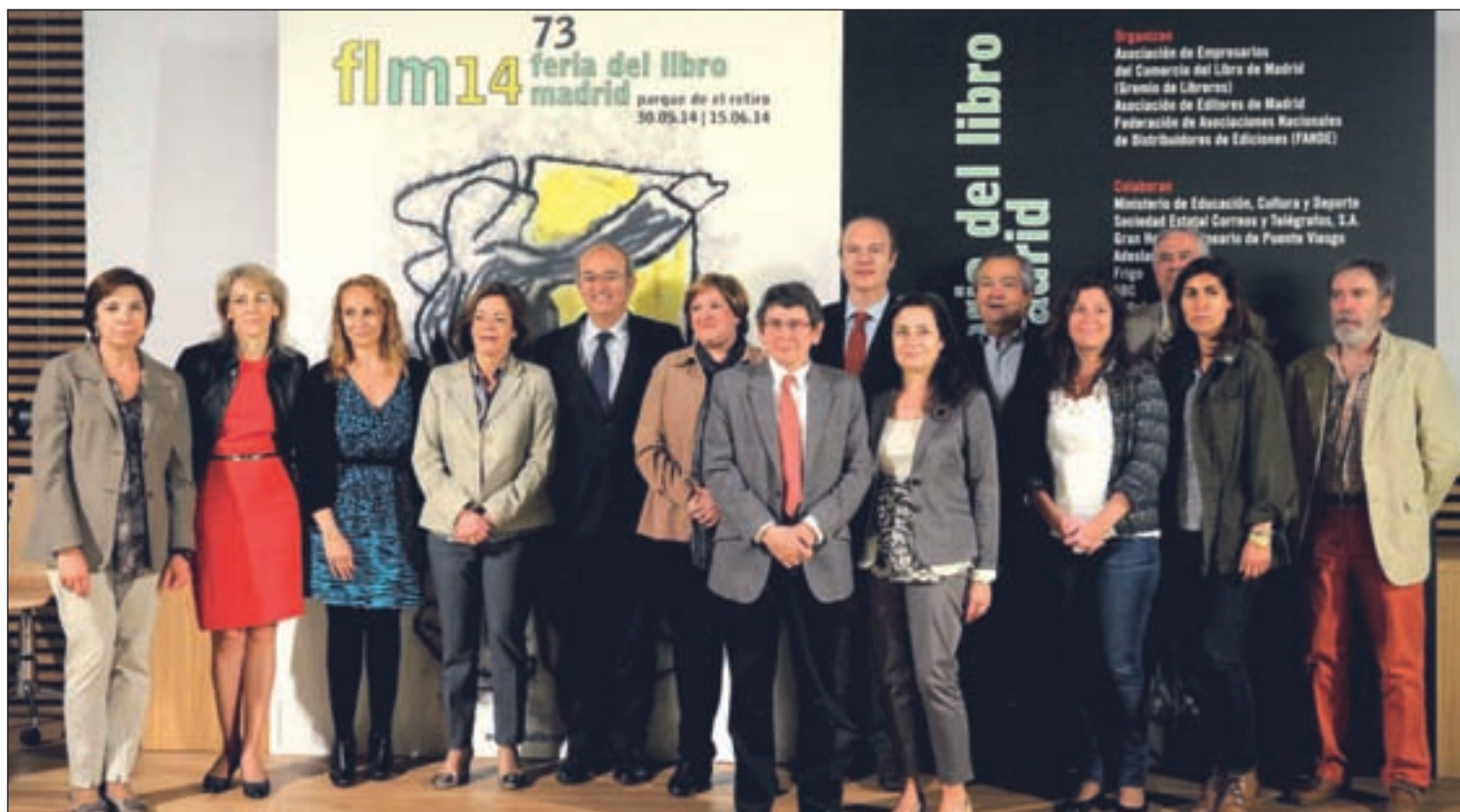
Presentación de la feria, el pasado lunes en el salón de actos de Conde Duque

así como la recuperación del ‘Micro de la Feria’, elemento distintivo años atrás, que verá pasar cada jornada a mediodía a novelistas, poetas, librerías o periodistas, cuya voz proyectará la megafonía del Paseo de Coches. Por otro lado, se reconocerá a Quino, premio Príncipe de Asturias de Comunicación y Humanidades, al cumplirse el 50 aniversario de ‘Mafalda’; se han organizado diferentes encuentros en torno al centenario de la Primera Guerra Mundial; y presentaciones de libros como ‘La Real Academia Española. Vida e historia’, de Víctor García de la Concha.