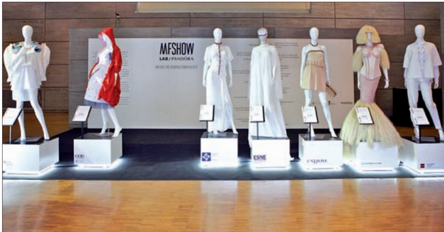
Los siete diseños que compiten en el concurso, expuestos en el Museo del Traje