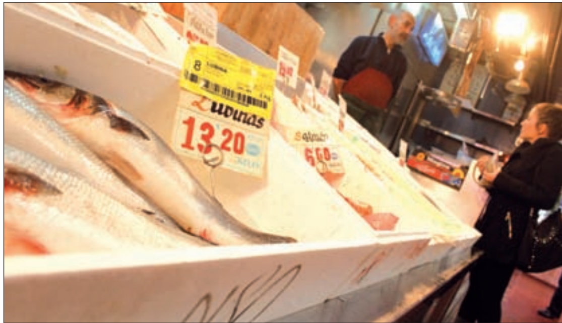
El etiquetado debe ofrecer una información detallada

Asimismo, en el primer trimestre del año, el número de viviendas hipotecadas se redujo un 24,2% en relación al mismo periodo de 2013.