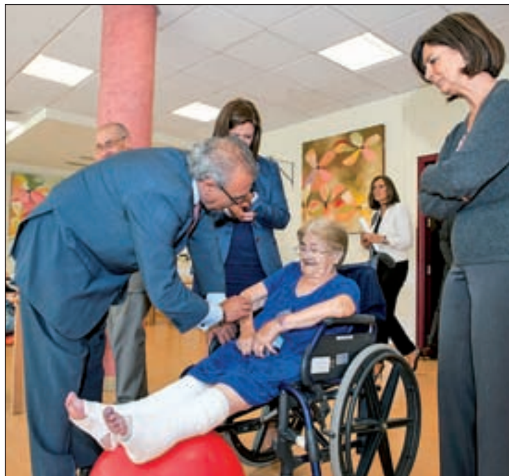
Fermosel presenta el portal en un acto en Pozuelo

Respecto al comunicado que el sindicato CCOO publicó el día anterior en el que se denunciaba la situación de pobreza en la que viven 155.000 mayores de la Comunidad de Madrid (14,7 por ciento