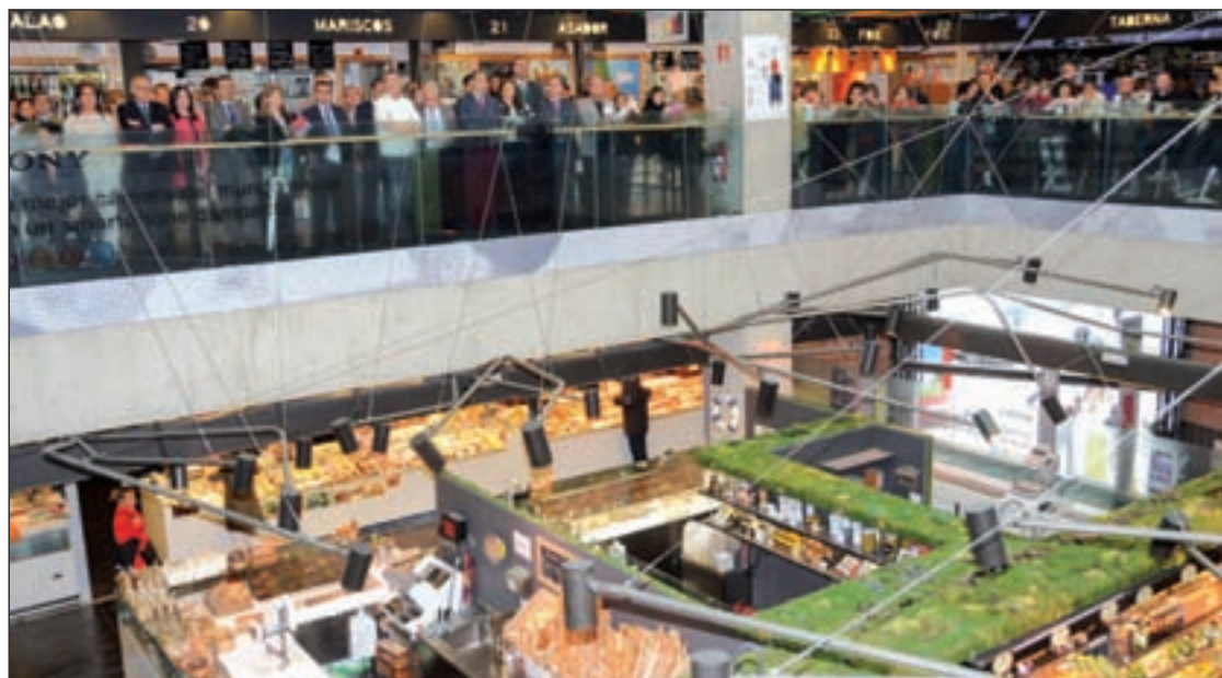
El Mercado de San Antón en un momento de la inauguración del ciclo de conciertos

El espectáculo que inauguró este ciclo tuvo lugar en el Merc-