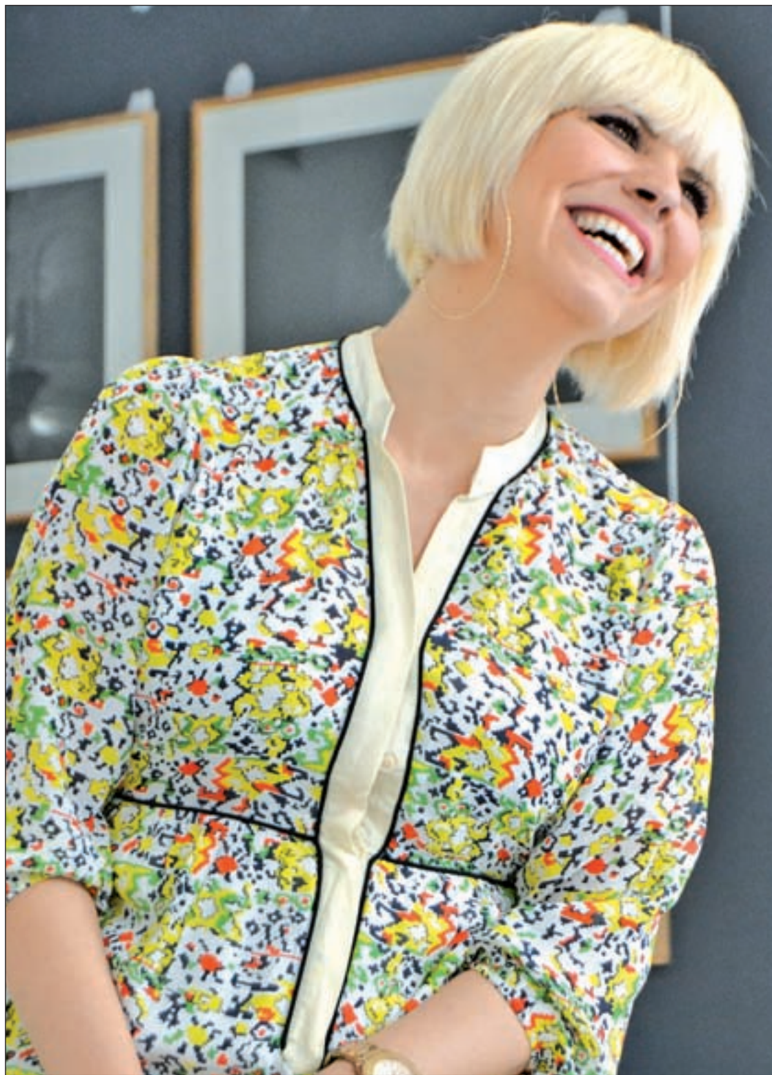
Pasión Vega, antes de su concierto en Madrid