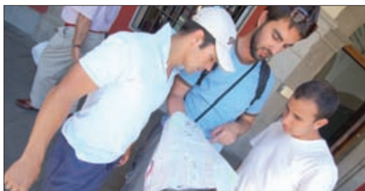
La Comunidad recibió 1,3 millones de turistas hasta abril GENTE