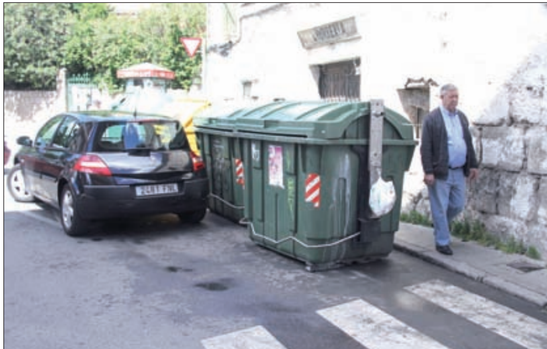
Los contenedores de basura de la Plaza de la Marina que será sustituidos por islas ecológicas

Pero dentro de este plan hay más acciones. En concreto, la cuantía total de dinero para invertir en mejorar la localidad es de 2,5 millones de euros que se han repartido en diferentes proyectos entre los que también destaca el nuevo aparcamiento que se ubicará en el barrio de La Magdalena, en concreto, en el descampado situado en la calle Sierra Cazorla, justo detrás de la Escuela Infantil Los Puertos. Su coste será de 550.000 euros y otorgará a la zona un total de 80 plazas, de las cuales dos serán reservadas para