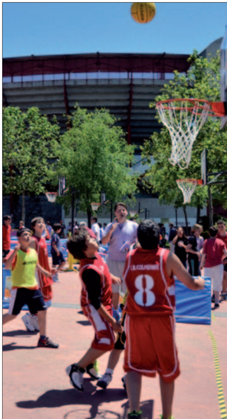
Los jugadores del torneo celebrado el año pasado

"Este torneo no es una competición en el estricto sentido de la palabra sino una actividad con la que desde el Ayuntamiento, y la Concejalía queremos fomentar la