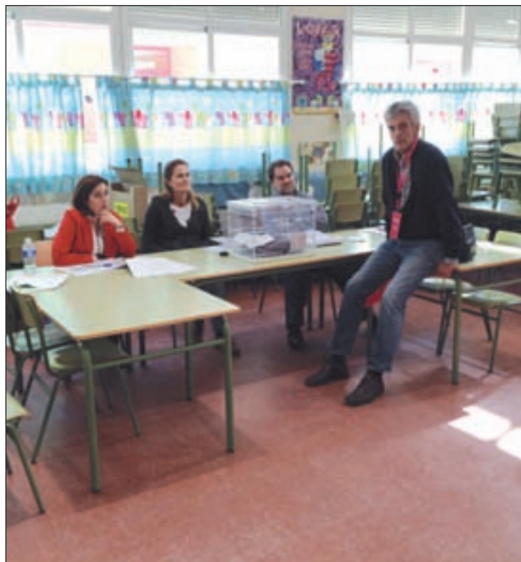
La escasa participación dejó mesas vacías en Colmenar

En cuanto a la participación, hay que destacar el notable descenso en Colmenar respecto a 2009. En esta localidad sólo se acercó a votar un 46,48% de los electores. Sin embargo, en Tres Cantos, se obtuvo un buen dato, el 57,16%, siendo uno de los grandes municipios de la Comunidad en donde más votantes hubo.