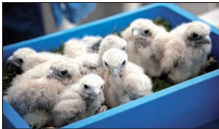
Los pollos en el área de las incubadoras

Una de las labores principales de este hospital de fauna es también, cuidar de las diferentes aves que llegan desde el aeropuerto Adolfo Suárez. Debido a la cercanía del centro al mismo, se ha intensifi-