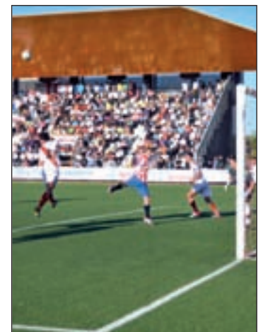
Un partido del año pasado

La competición comenzará a las 9:30 horas de la mañana y está previsto que todos los partidos acaben en torno a las 14 horas.