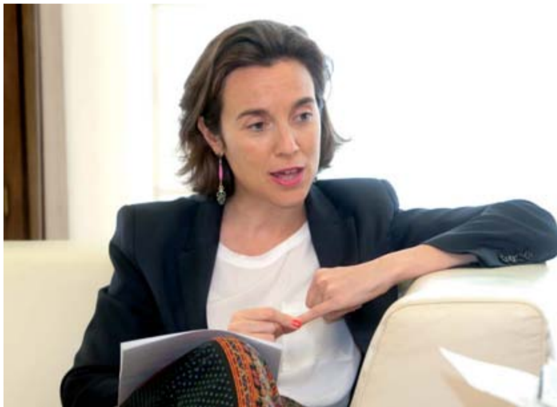
Cuca Gamarrá, alcaldesa de Logroño, en un momento de la entrevista.