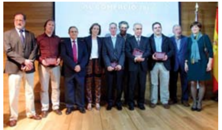
Entrega de los Premios Ciudad de Logroño al Comercio 2014.

'PREMIOS CIUDAD DE LOGROÑO AL COMERCIO 2014'