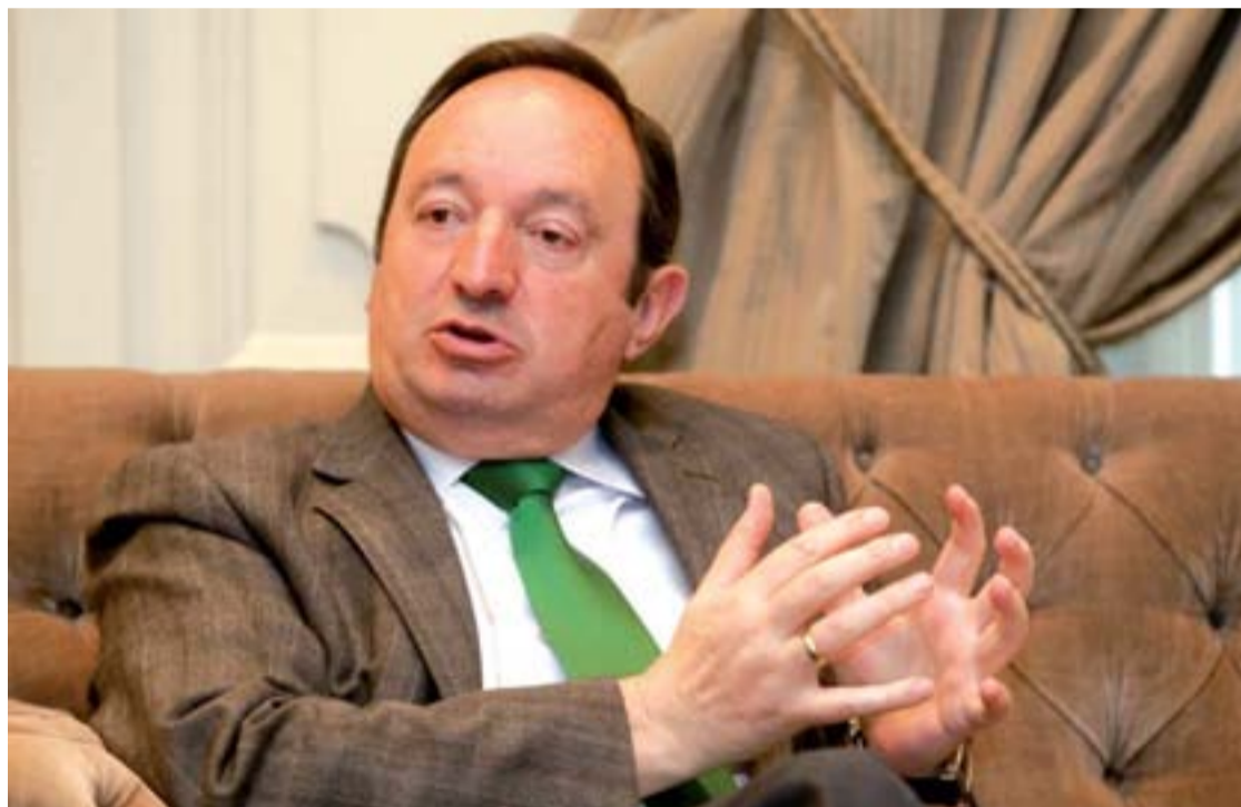
Pedro Sanz, presidente de La Rioja, en un momento de la entrevista.

El 9 de junio celebramos el Día de La Rioja. ¿Cómo define el papel del Estatuto de Autonomía en estos 32 años de vigencia?