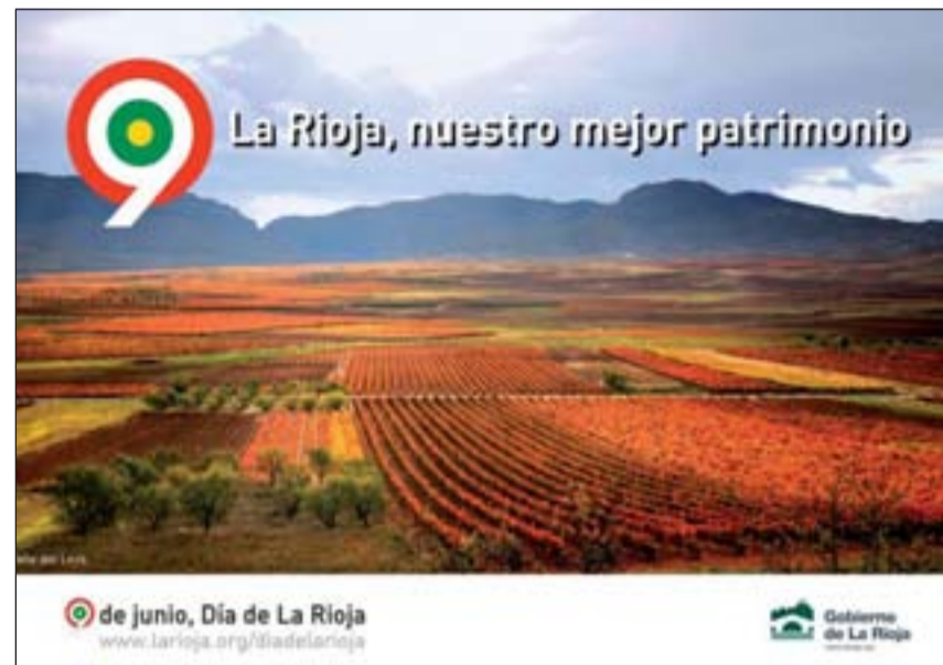
Cartel oficial del Día de La Rioja.

riojanos su tradicional discurso del Día de La Rioja. También se entregarán las Medallas de La Rioja que otorga el ejecutivo regional.