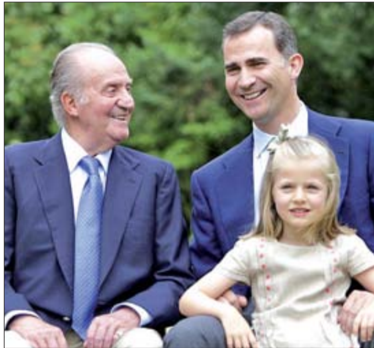
El Rey, el Príncipe de Asturias y la Infanta Leonor

En su discurso, palabras para su sucesor, Don Felipe, del que dijo "tiene la madurez, la preparación y el sentido de la respon-