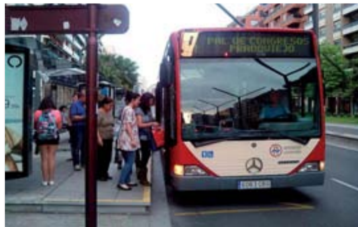
El 9 y 11 de junio habrá autobuses cada 15 minutos.