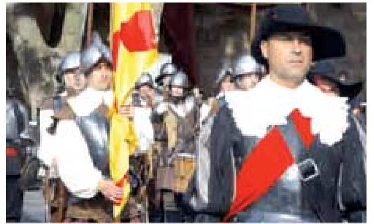
Las tropas pasean por la ciudad logroñesa.

'Tres Tristes Trigres' actuarán los días 7,8 y 9 de junio con tres espectáculos. El primero de ellos