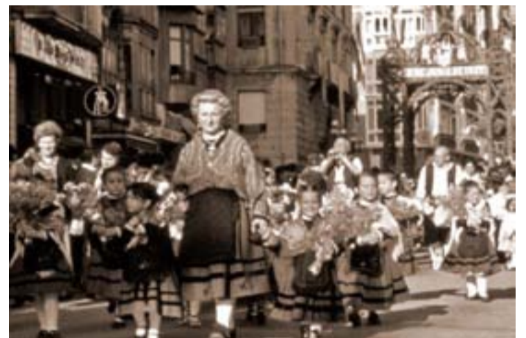
Procesion de las visperas 1981