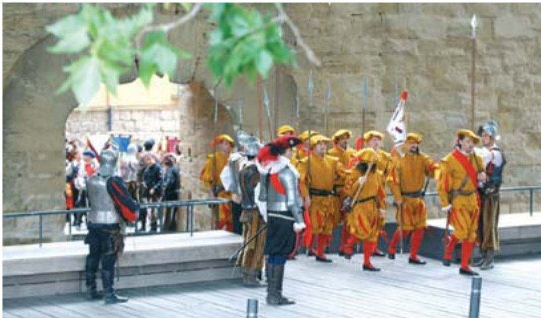
Logroño resistió a las tropas francesas en 1521.