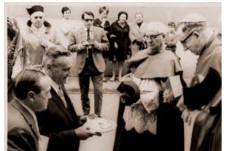
Ofrenda del pez 1960