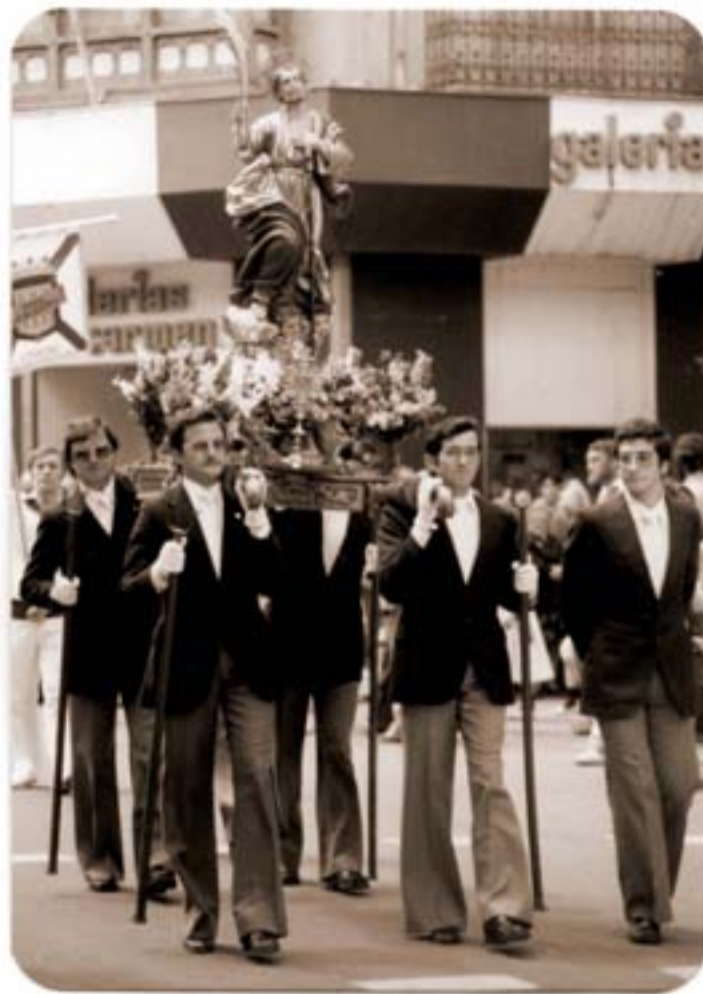
Procesion de San Bernabe 1970