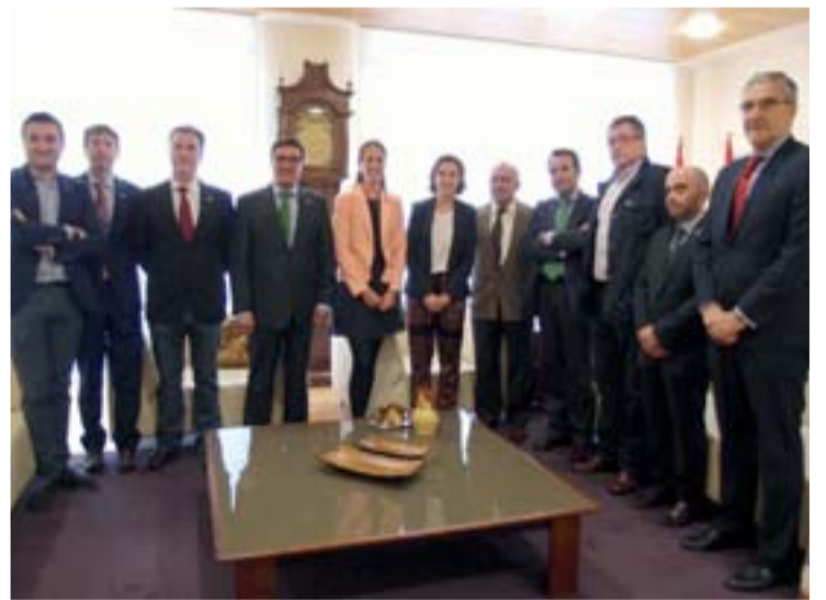
La alcaldesa de Logroño recibió a las cofradías en vísperas de las fiestas.

El acto de entrega tendrá lugar el viernes día 6 a las 20,00h. en el centro Cultural de IBERCAJA de Portales 48 de Logroño, como preámbulo de las fiestas de San Bernabé 2014.