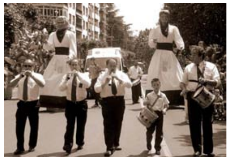
Gaiteros en la procesion de San Bernabe