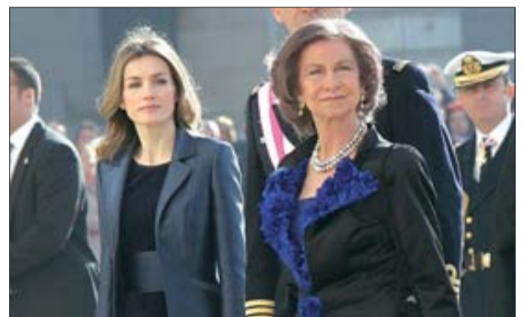
Doña Letizia y Doña Sofía, en un acto público

En cuanto a la Princesa, la escritora cree que "tiene que estar en la calle". "Es el modo de decirle al pueblo: estamos con vosotros, somos vosotros", por lo que no se plantea que los futuros Reyes dejen sus salidas nocturnas a cenar o al cine ni