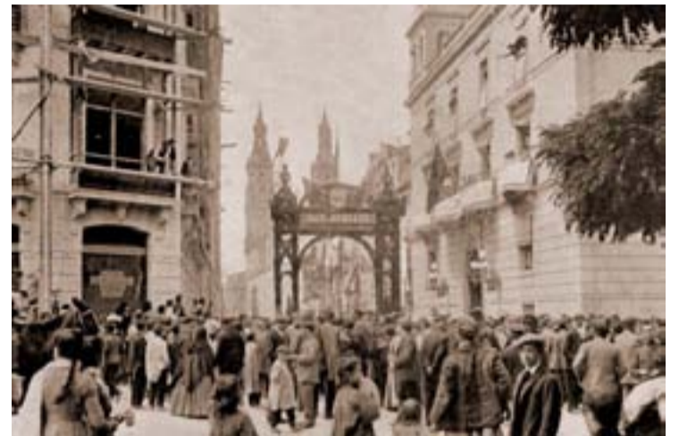
Arco de San Bernabe 1910

tas antiguas de la ciudad por parte del Regidor mayor, que en estos últimos años le ha correspondido a nuestra alcaldesa, Cucca Gamarra. Además hay otras nuevas, que se han ido incorporando, como la 'Bendición de los peces' o la 'Ofrenda del pez' al santo con la participación del obispo de la Diócesis, así como las fresas que ofrecen de almuerzo la Cofradía de San Bernabé que junto con el pan, el pez y el vino de la Cofradía del Pez, son unos de los actos troncales de la festividad. Sin olvidar la procesión del santo que recorre la ciudad y en la que participan además de numerosas autoridades y vecinos, los logroñeses que han sido distinguidos con la insignia de su ciudad, la 'Insignia de San Bernabé' que sin ser una cofradía, forman un nutrido grupo de personas amantes de las tradiciones de Logroño, que se honran también de acompañar al santo tanto en las vísperas como en la procesión mayor del día 11 de junio o en la misa de difuntos que, en recuerdo de nuestros antepasados, se celebra todos los años en la concatedral de La Redonda.