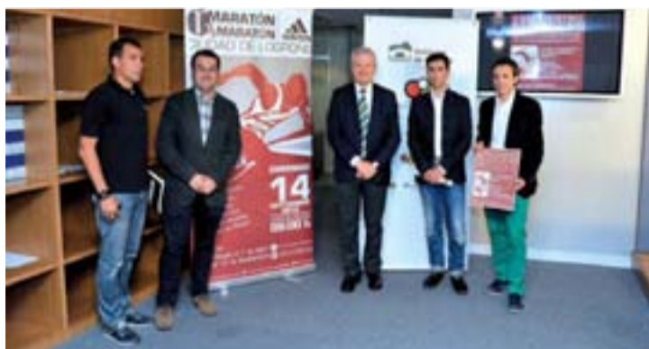
Presentación en rueda de prensa del encuentro.

Se trata de un encuentro dinámico donde los profesionales que se den cita en Logroño podrán debatir contando con las opiniones de todos los internautas que