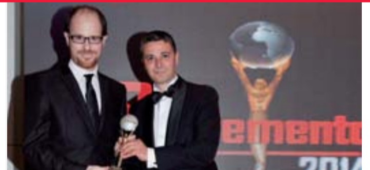
Ysios Reserva 2007 ha sido galardonado como el Mejor Vino del año por los Premios El Suplemento, unos galardones que reconocen a empresas, marcas y personalidades de referencia en los campos social, cultural y económico.