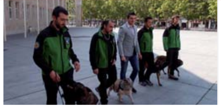
La Unidad Canina de Rescate de La Rioja mostrará su formación para salvar vidas en una exhibición durante las fiestas de San Bernabé el próximo 9 de junio a las 18 horas en la Plaza de Ángel Bayo.