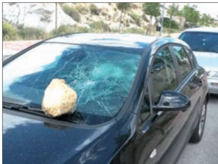
Un vehículo con la luna rota en la zona de la estación GENTE

Pero estos actos vandálicos no son únicos en esta zona de Colmenar. En la mañana del pasado lunes día 9 de junio, alrededor de media decena de coches apare-