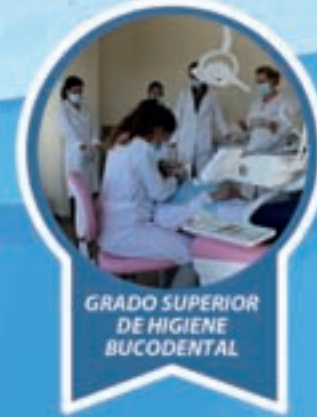
GRADO SUPERIOR DE HIGIENE BUCODENTAL