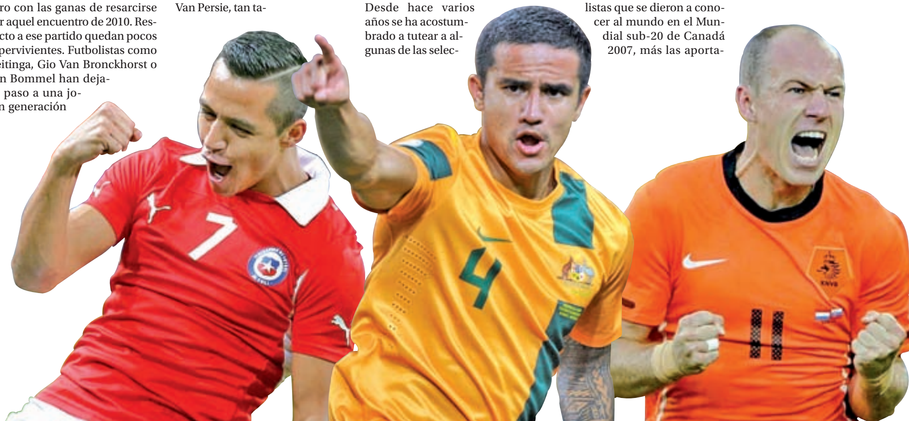
Alexis Sánchez, Tim Cahill y Arjen Robben, tres de los rivales a los que deberá vigilar la selección en la fase de grupos

Completa este grupo B la selección australiana, un equipo que se ha habituado en los últimos años a meterse en la cita mundialista. Su buena actuación en Alemania 2006 dejó un grato recuerdo que ahora parece complicado revivir. Su estrella sigue siendo Tim Cahill.