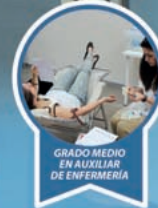
GRADO MEDIO EN AUXILIAR DE ENFERMERÍA