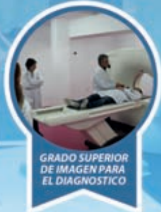
GRADO SUPERIOR DE IMAGEN PARA EL DIAGNÓSTICO