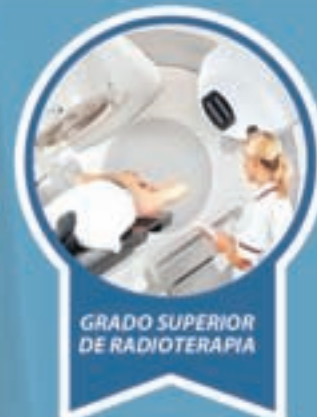
GRADO SUPERIOR DE RADIOTERAPIA