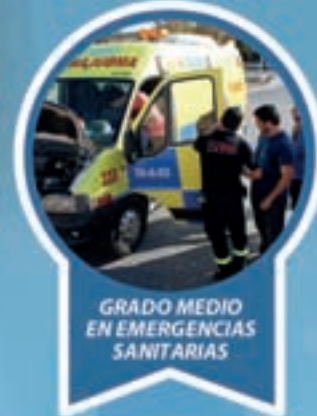
GRADO MEDIO EN EMERGENCIAS SANITARIAS