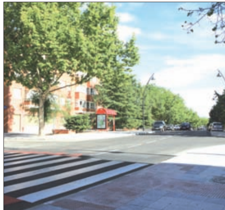
Nuevo aspecto de la calle Bolillero de Tres Cantos

Según el alcalde de Tres Cantos, Jesús Moreno, "la reforma de esta calle era uno de los compromisos que teníamos con los vecinos de la Segunda Fase. Con las mejoras recién inauguradas en el sector Embarcaciones y las que se llevarán a cabo próximamente en la calle Tagarral, el equipo de Go-