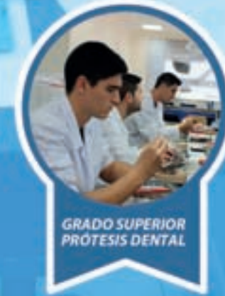
GRADO SUPERIOR PRÓTESIS DENTAL