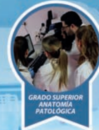
GRADO SUPERIOR ANATOMÍA PATOLÓGICA