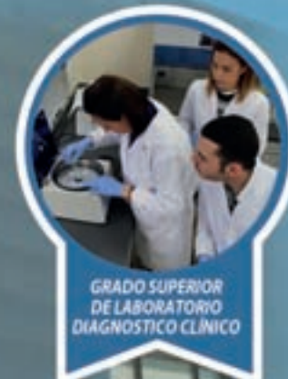
GRADO SUPERIOR DE LABORATORIO DIAGNÓSTICO CLÍNICO

Ésta es tu oportunidad ¡MATRICÚLATE AHORA!