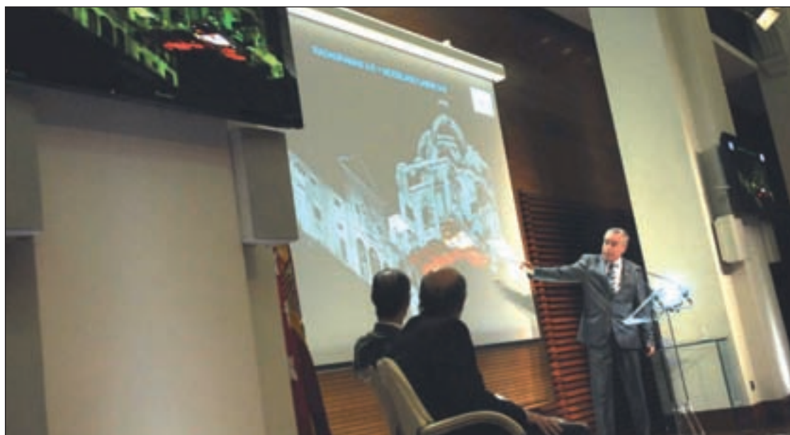
El informe de la primera fase se presentó el pasado lunes en Cibeles

Dos meses después se iniciaron las sesiones, con la participación de expertos y, entre otros, los ex-presidentes Joaquín Leguina, Alberto Ruiz-Gallardón y Esperanza Aguirre. El PP presentó pero no registró su propuesta, consistente en crear 43 circunscripciones uninominales y la implantación de un sistema de doble urna que garantiza la proporcionalidad. Los populares aseguran que con este nuevo sistema, teniendo en cuenta los últimos resultados electorales autonómicos, la representación de los partidos políticos sería igual a la existente. Un año después, el mismo Ignacio González cerró lo que se inició sin contar con nadie y que parece ser no ha servido para nada, ya que una reforma de este tipo necesita una mayoría para que algo que afecta a todos no se haga sin contar con todos. UPyD quiere cambios y que se cuente con ellos, IU pasa de todo esto porque considera que lo que hay sirve y el PSM sabe lo que no quiere y no quiere nada que venga de la mano del PP, que ha puesto sobre la mesa algo necesario pero sin practicar el diálogo que tanto reclama. Doce meses con intervenciones de expertos en la materia que ofrecieron sus conocimientos sobre los distintos modelos electorales que se conocen. Hablaron sobre unos cambios que todos quieren siempre que prevalezca lo que cada uno cree que le beneficia.