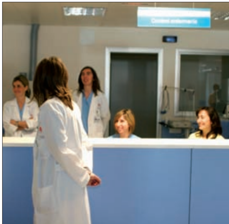
El 90% de los pacientes está satisfecho con la atención GENTE

El consejero destacó que la valoración personal de los pacientes aporta la verdadera visión que los usuarios tienen de la sanidad pública madrileña. "La mejor respuesta a las acusaciones infundadas, apocalípticas, en busca de réditos políticos fáciles, es la valoración libre de los usuarios de la sanidad pública", sentenció Rodríguez. Asimismo, añadió que "todo es mejorable, pero el sistema