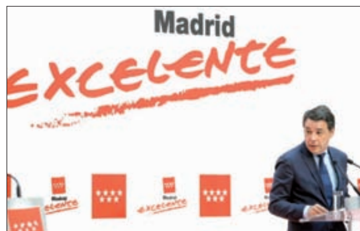
Ignacio González anunció los datos del PIB de la región

En este sentido, se abordarán a lo largo de este año proyectos derivados de los resultados de esta encuesta. Algunas de estas acciones de mejora serán las relativas a los tiempos de espera y a la adecuación de la hora de la cita a la intervención en cirugía ambulatoria y la restauración y la información en el área de hospitalización.