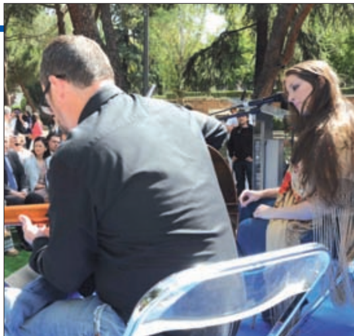
Actuación de Argentina en la presentación del festival

lio, "adelantaré algo de mi quinto disco, que publicará a finales de año, y que será otro 'Viaje por el cante' -título de su anterior trabajo-, pero abriendo el abanico a otros géneros". Acaba de actuar en las Fiestas de San Isidro y esta será su cuarta vez en los Veranos de la Villa, una visita que disfrutará con otros compañeros en cartel como Diego El Cigala, que abrirá este ciclo cultural el próximo 30 de junio en el Teatro Circo Price. Por Sabatini se pasarán Joaquín Cortés (con 'Gitano', del 1 al 3 de julio), José Mercé (4 de julio), Miguel Poveda (6 y 7 de julio), Carmen Linares (8 de julio) y Estrella Morente (11 de julio), entre otros. "Este festival es diferente cada