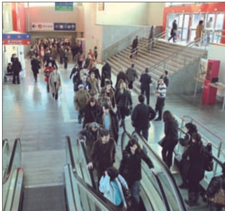
El Plan pretende impulsar la actividad en la estación

La antigua estación de Príncipe Pío recupera el uso de oficinas que tuvo en su día y podrán instalarse en ella actividades relacionadas con servicios al público, así como sedes o delegaciones de empresas u organismos. Así lo recoge el Plan Especial aprobado inicialmente este jueves por la Junta de Gobierno. Los objetivos del plan pasan por impulsar la actividad en el recinto de la estación y mejorar los mecanismos de protección del edificio histórico. El documento ordena los usos del recinto, de 43.040 metros cuadrados de superficie, en el que coexisten el centro comercial y el intercambiador de transportes.