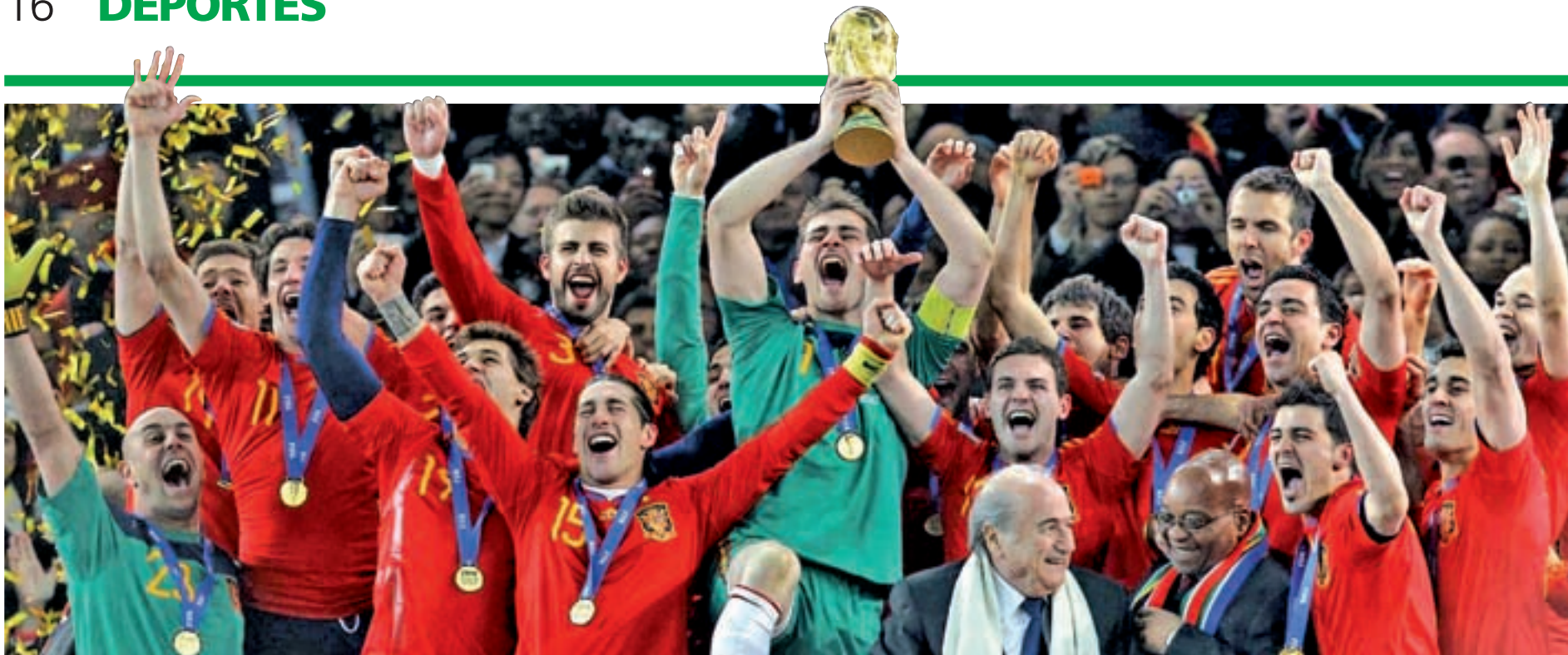
Iker Casillas protagonizó uno de los momentos con los que todos los aficionados españoles habían soñado durante años