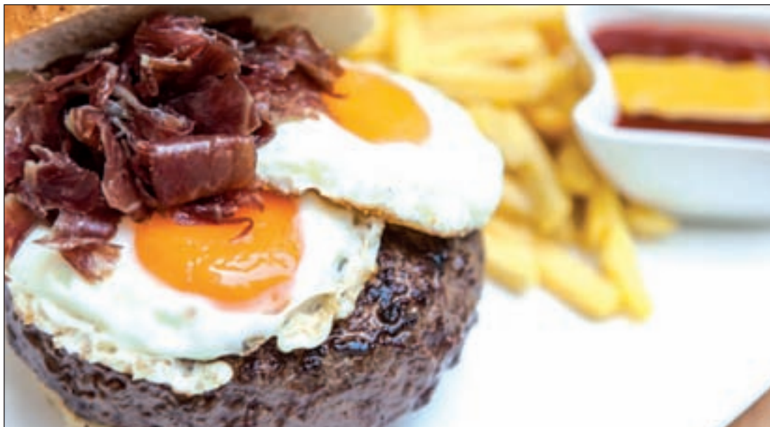
La hamburguesa 'Con un par', de los restaurantes La Vaca Picada