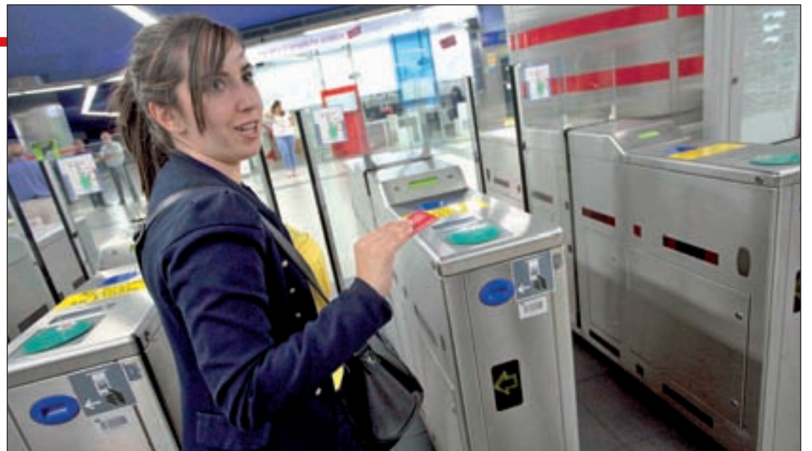
Cualquier ciudadano puede descargarse esta herramienta

Esta nueva herramienta ha sido desarrollada por el Consorcio Regional de Transportes de Madrid y no tienen ningún coste extra para los usuarios del sistema madrileño. De esta forma, cualquier ciudadano puede descar-