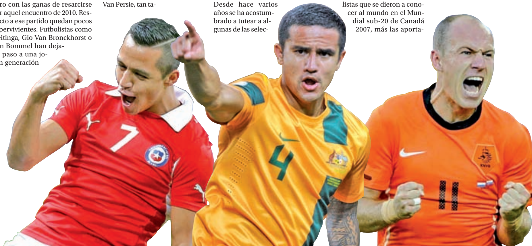
Alexis Sánchez, Tim Cahill y Arjen Robben, tres de los rivales a los que deberá vigilar la selección en la fase de grupos

Completa este grupo B la selección australiana, un equipo que se ha habituado en los últimos años a meterse en la cita mundialista. Su buena actuación en Alemania 2006 dejó un grato recuerdo que ahora parece complicado revivir. Su estrella sigue siendo Tim Cahill.