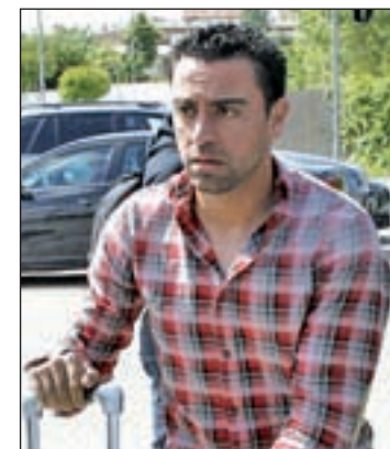
Xavi, el motor de la selección

do el colectivo. La calidad de Iniesta, el instinto de Villa y Torres o la fortaleza de Piqué y Ramos han hecho de esta selección un equipo muy difícil de batir. De hecho, desde el Mundial de 2006 España no sabe lo que es encajar un gol en los cruces de los torneos más importantes. Ese legado lo deben mantener jugadores como Jordi Alba, Azpilicueta o De Gea. El futuro parece asegurado, pero la generación de oro quiere entonar el canto del cisne para pasar de ser una leyenda eterna.