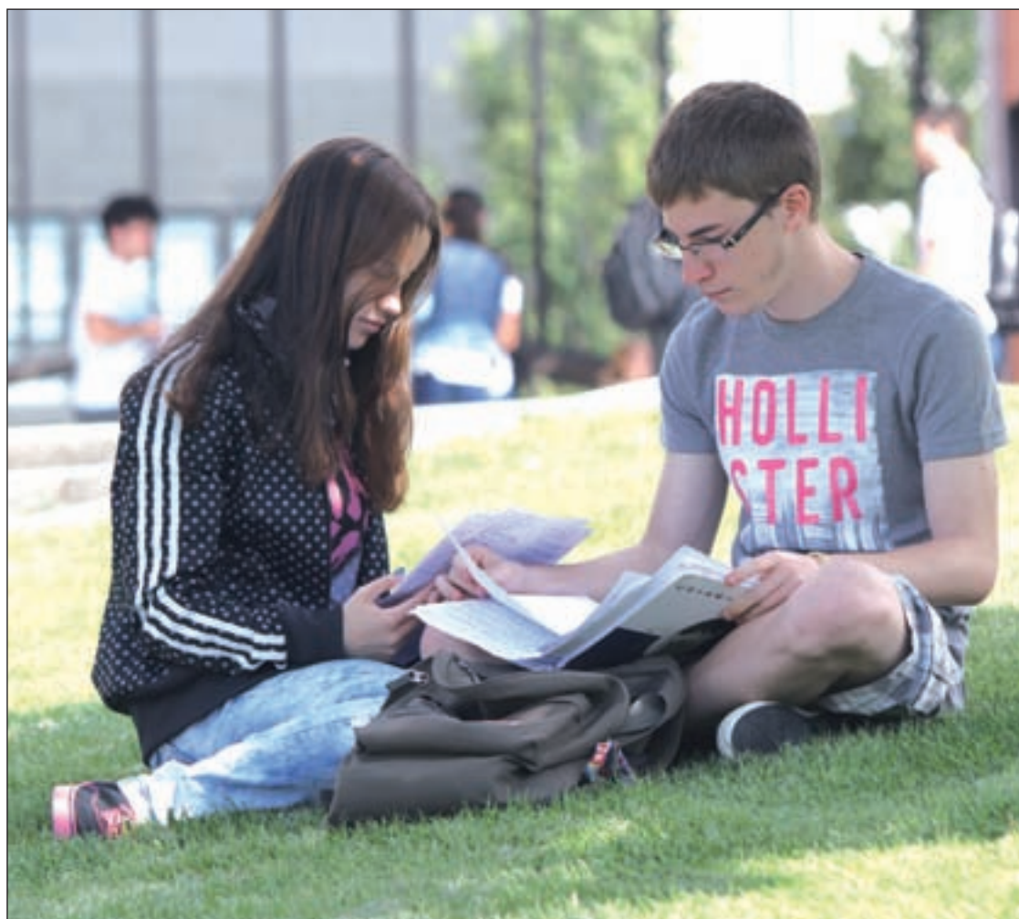
Dos jóvenes repasan antes de entrar a un examen

Un total de 29.943 alumnos madrileños realizaron los días 10, 11 y 12 de junio los exámenes de la Prueba de Acceso a la Universidad