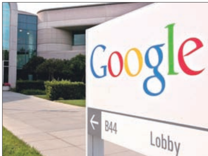
Los datos deben ser inadecuados o no pertinentes

En este punto, hay que ser lo más exhaustivo posible a la hora de explicar por qué se considera que esos enlaces han de desaparecer de Google, en una caja que ha incorporado la compañía en el