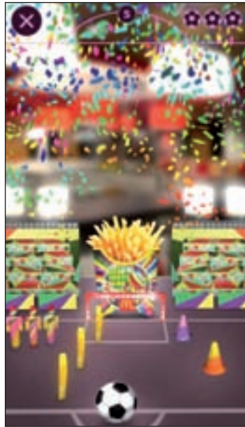
La aplicación en Gol.mcd.com

En la parte trasera de ellos se indican las instrucciones para descargar la aplicación, McDonald's GOL!. Esta app, que es compatible con la mayoría de dispositivos de Apple y Android, puede des-