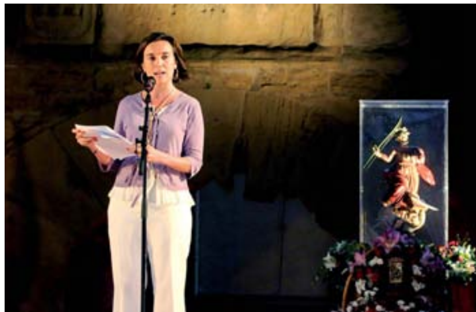
Acto de evocación histórica de la ciudad en las Murallas del Revellín.