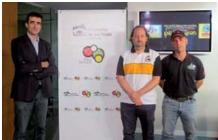
Presentación en rueda de prensa.