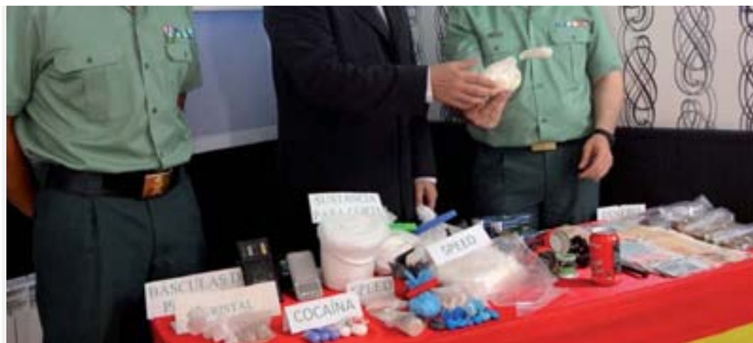
Material incautado en los registros.