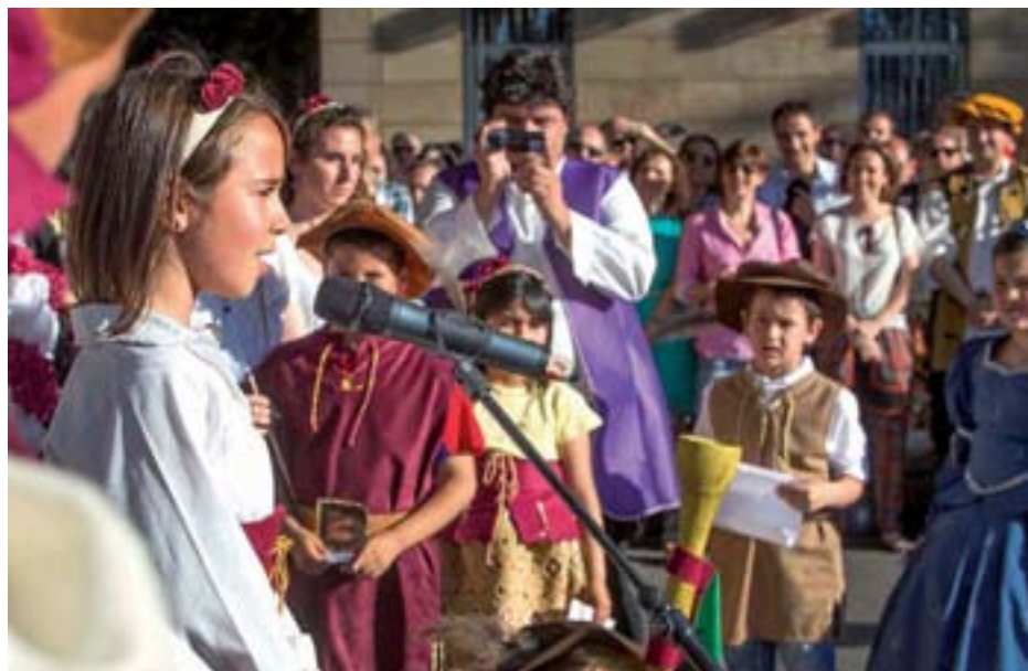
Pregón inaugural el pasado 7 de junio.

Las fiestas de San Bernabé acabaron el pasado jueves 12 de junio y los logroñeses y visitantes pudieron disfrutar de un programa de más de 250 actos que estuvo acompañado por un tiempo estupendo