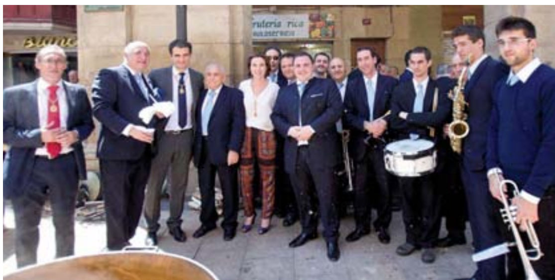
Degustación de toro guisado, en cumplimiento del Voto.

La alcaldesa de Logroño, Cuca Gamarra, invitó a todos los logroñeses a "trabajar unidos por encima de nuestras diferencias para defender nuestra ciudad de sus nuevos enemigos: el pesimismo, el desánimo y la resignación" durante su intervención en el 'Acto de Evocación Histórica de la ciudad' que tuvo lugar el pasado 10 de ju-