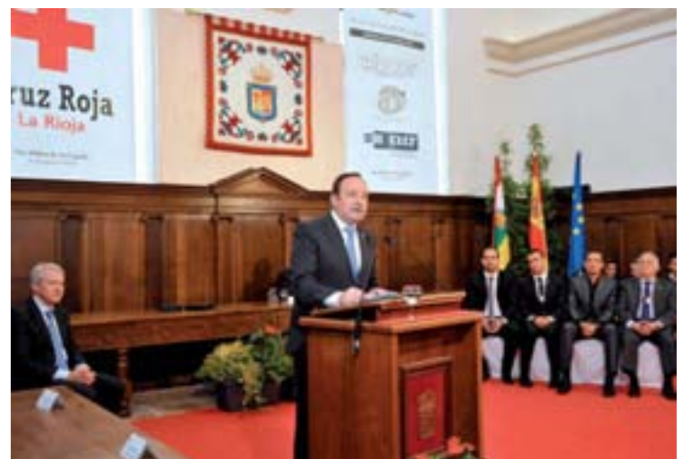
El presidente riojano, Pedro Sanz, durante su intervención.

Asimismo, y tras recordar que La Rioja "ha resistido mejor que otras regiones" la crisis económica, se mostró convencido de que "todos queremos seguir siendo una región competitiva, productiva y diferente". Para seguir ofreciendo valor añadido, Pedro Sanz incidió en seguir apostando por la innovación, la formación, el emprendimiento o la internacionalización. En su intervención, Sanz destacó que precisamente las dos Medallas de La Rioja que se conceden este año son muestra de esa cohesión social y del