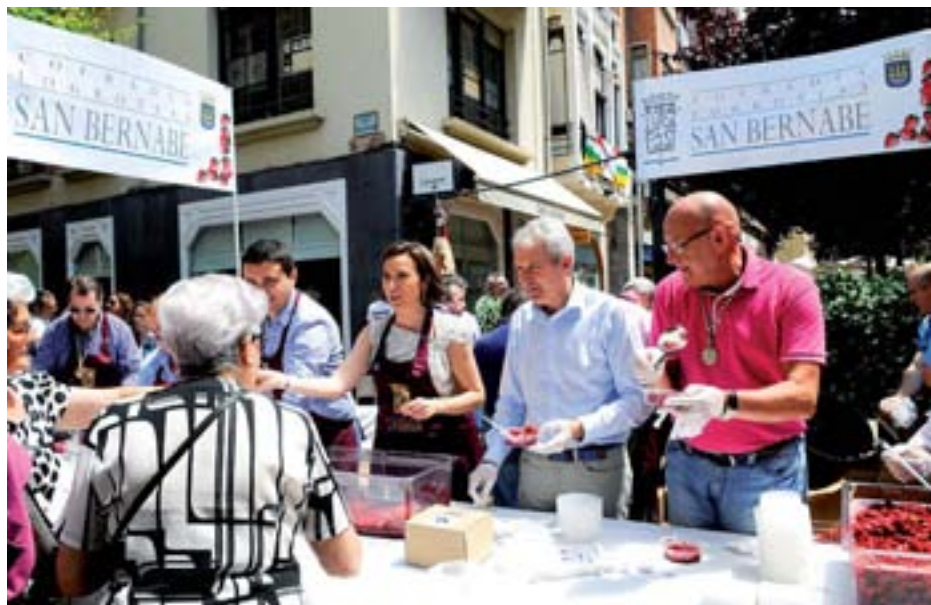
Obsequio de fresas con vino organizado por la Cofradía de San Bernabé.