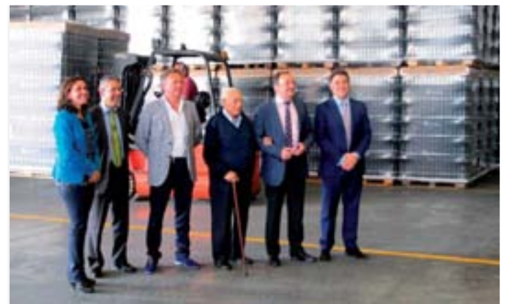
Visita al centro logístico en La Portalada II.