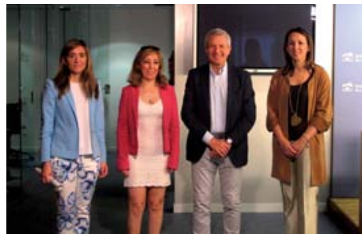
Renovación del convenio en rueda de prensa.

Entre los objetivos de la Red Vecinal se encuentran el de informar a las víctimas de los recursos sociales existentes en La Rioja; apoyar y acompañar a las víctimas a las dependencias administrativas, policiales y judiciales; divulgar entre la sociedad riojana el proyecto de la Red Vecinal e impartir cursos de formación específica para los voluntarios que accedan a cola-