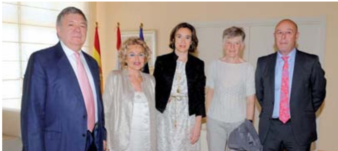
Los insignias 2014 junto a la alcaldesa de Logroño, Cuca Gamarra.