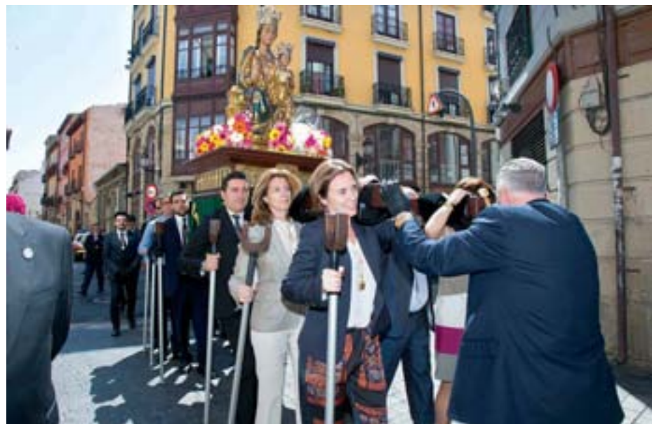
Procesión tras la misa de requiem en honor a los héroes del 1521.