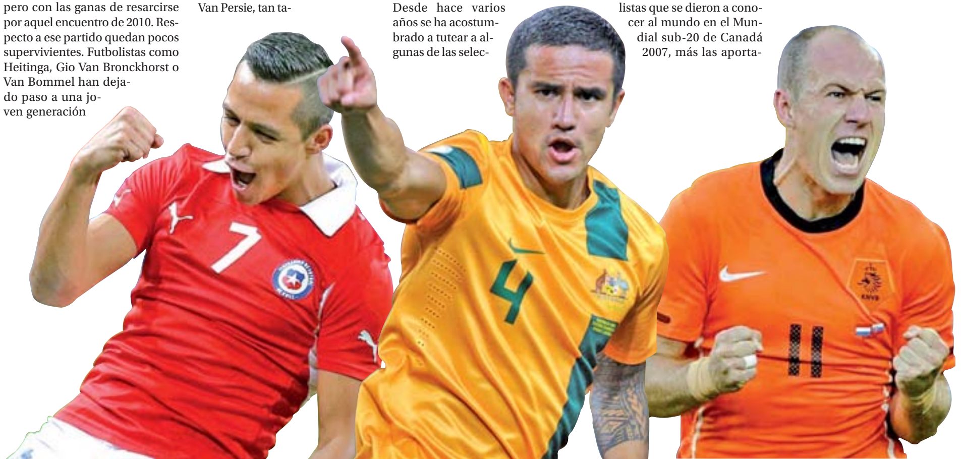
Alexis Sánchez, Tim Cahill y Arjen Robben, tres de los rivales a los que deberá vigilar la selección en la fase de grupos

Completa este grupo B la selección australiana, un equipo que se ha habituado en los últimos años a meterse en la cita mundialista. Su buena actuación en Alemania 2006 dejó un grato recuerdo que ahora parece complicado revivir. Su estrella sigue siendo Tim Cahill.