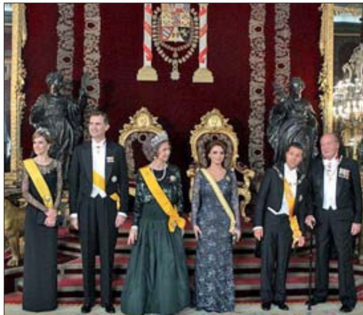
Los Reyes y los Príncipes, durante la visita del presidente de México

Al finalizar la votación, tanto PP como PSOE aplaudieron el resultado. De hecho, el presidente del Gobierno, Mariano Rajoy, aseguró que "estamos aquí para cumplir la voluntad de los españoles, que no es otra cosa que la Constitución. No se plantea modificar nada, si no cumplir la ley en una democracia en la que todo afecta a la Corona. Co-