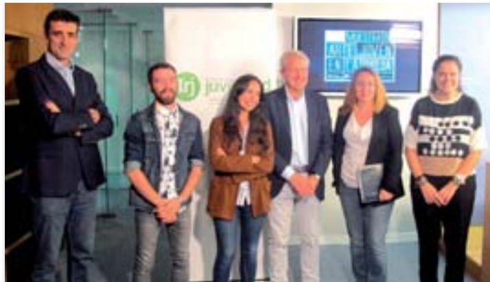
Presentación de la convocatoria en rueda de prensa.

El plazo de presentación de los proyectos finalizará el 11 de septiembre, que se podrá realizar de manera presencial en la sede de la Dirección General del Deporte y del IRJ ; a través de la Oficina General de Registro de la Administración General de la Comunidad de La Rioja o en el Registro Electrónico del Gobierno de La Rioja, a través de su página web: www.larioja.org .