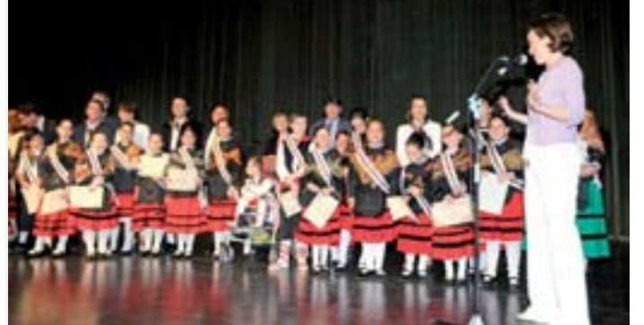
La alcaldesa de Logroño recibió a los niños representantes de la ciudad en las fiestas de San Bernabé en el auditorio del Ayuntamiento de Logroño.