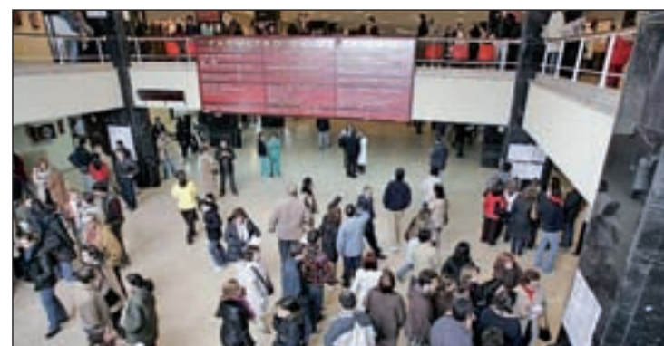
Facultad de Derecho de la Universidad Complutense de Madrid

formática, lo que demuestra "que muchos estudiantes tienen la idea de crear en un futuro su propia empresa". Por su parte, Ciencias Empresariales, Economía o Derecho, que antes eran las de mayor salida laboral, hoy aún mantienen altos valores, pero se han desplazado del podio.