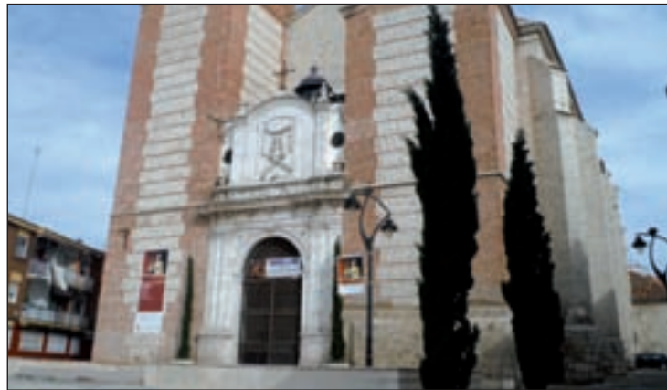
Catedral de La Magdalena

Según el Obispado, la verja de entrada a la catedral se hizo en la