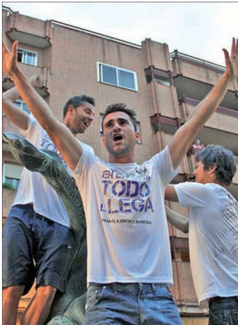
La plantilla pepinera lo celebró en la Plaza de España

FRANCISCO QUIRÓS SORIANO deportes@genteenmadrid.com