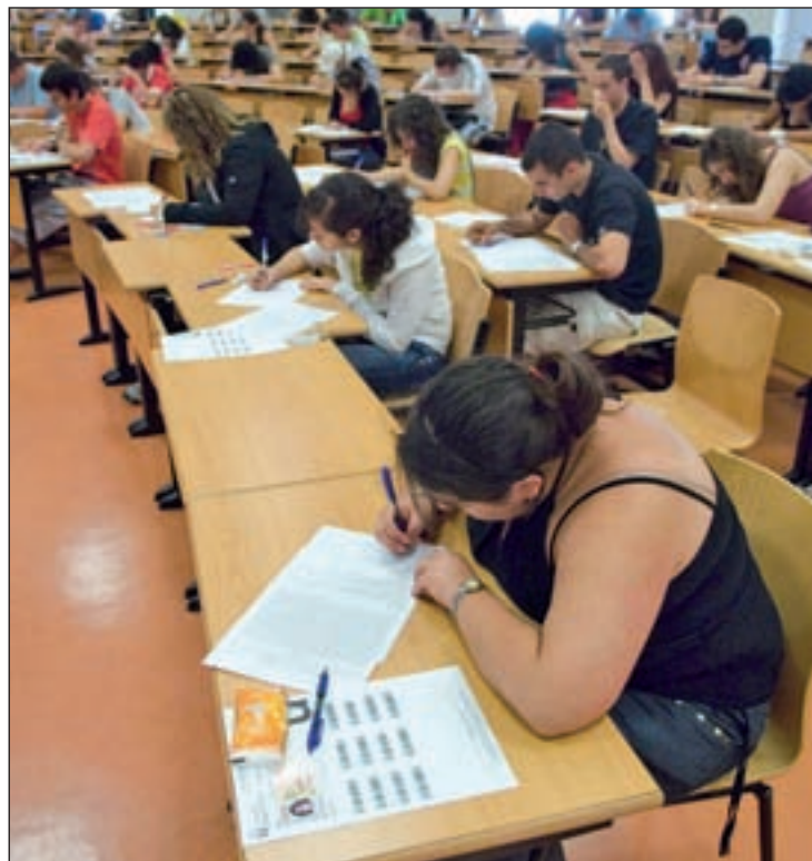
Alumnos asistiendo a las Pruebas de Acceso a la Universidad