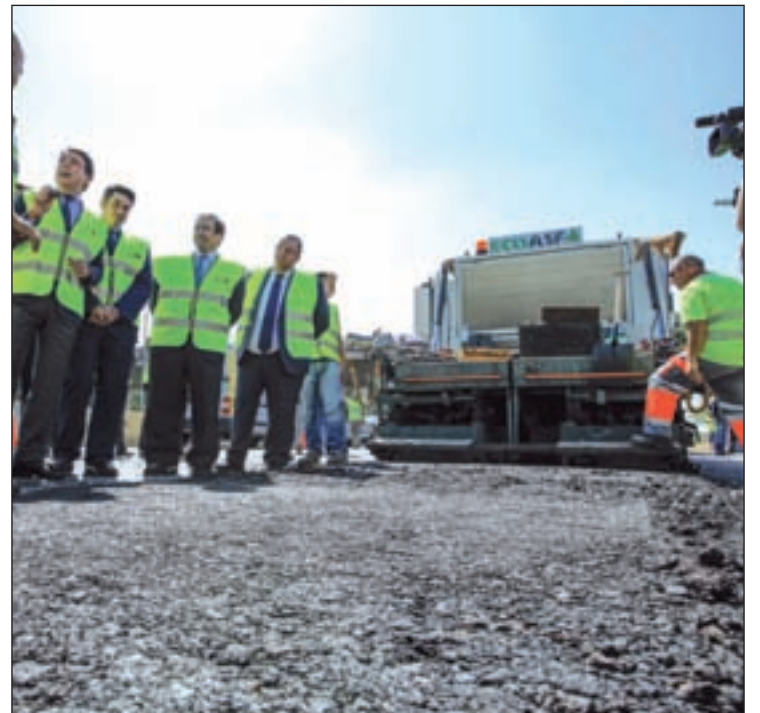
Ignacio González visita las obras de la M-406

En total, se invertirán un total de 1,3 millones de euros en el conjunto de las obras, que afectan a 10 kilómetros de la M-406. Una zona que soporta un tráfico diario superior a los 36.000 coches, de los cuales, entre el 6,13 y el