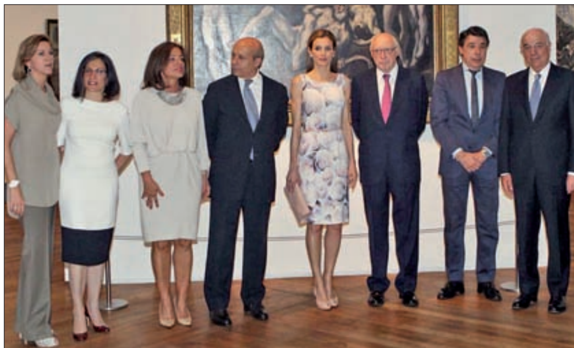
Doña Letizia Ortiz acudió a la inauguración de la exposición en el Museo del Prado

Además pueden verse ‘La Anunciación’, ‘El Cristo Resucitado’ o ‘Maurice Barrès con Toledo al fondo’, de Ignacio Zuloaga.