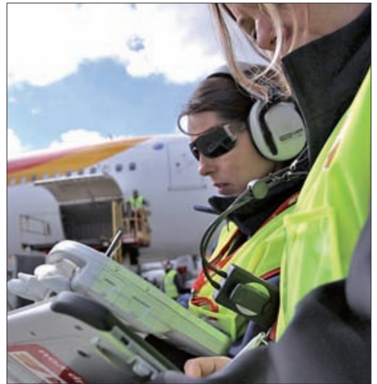
El trabajo en terminales de pasajeros, de los más demandados

Este ranking lo completan otras profesiones como la de Operario especialista, aquel que desarrolla su trabajo dentro de una línea de producción o cadena de montaje; Gestor de clientes, Ingeniero para proyectos internacionales, Teleoperador con idiomas,