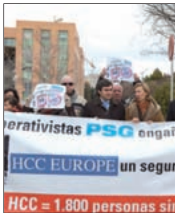
Afectados de PSG

El Grupo Independiente de Cooperativistas (GiC) ha asegurado que, "a raíz de descubrir el proyecto de fusión de HCC Europe, por el que esta compañía aseguradora desaparecerá absorbida por su casa matriz en Inglaterra", han recrudecido las actuaciones judiciales en defensa de los inte-