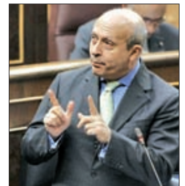
El ministro, en el Congreso

3/2 para dar mayor protagonismo a la especialización, facilitar la homologación de títulos y promover la movilidad de los estudiantes. Wert ha atendido la demanda de los rectores, que no ven con buenos ojos el cambio, y aclaró que, "apenas" concluida la adaptación a Bolonia, pretender un "cambio radical y obligatorio podría acarrear más problemas que soluciones". Por eso insistió en que puede ser "optativo y selectivo" por los campus.