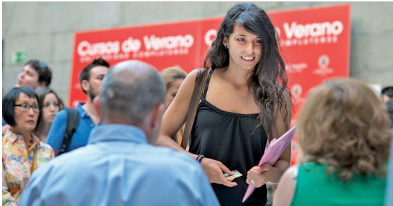
Los jóvenes suelen ser los más interesados en los cursos estivales