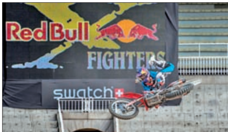
El espectáculo está garantizado este viernes

El cartel de participantes reúne a algunos de los pilotos de más re-