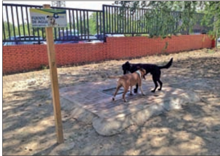
Área canina en la calle Madrid

Aprovechando la creación del área canina, el Ayuntamiento ha realizado también trabajos de alumbrado, en colaboración con el Departamento de Mantenimiento, así como la adecuación de los alcorques de los árboles para protegerles de los perros. El mobiliario urbano del parque, tanto vallas como bancos, papeleras o farolas, han sido reciclados. Para algunos vecinos que ya