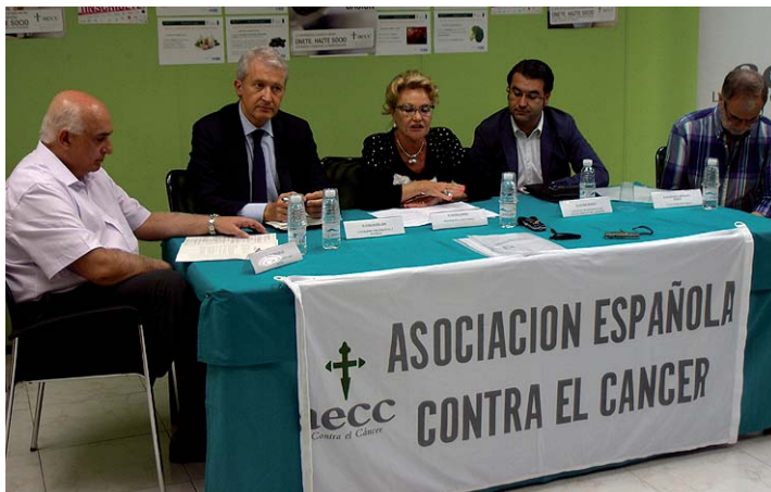
Presentación en rueda de prensa de las becas.