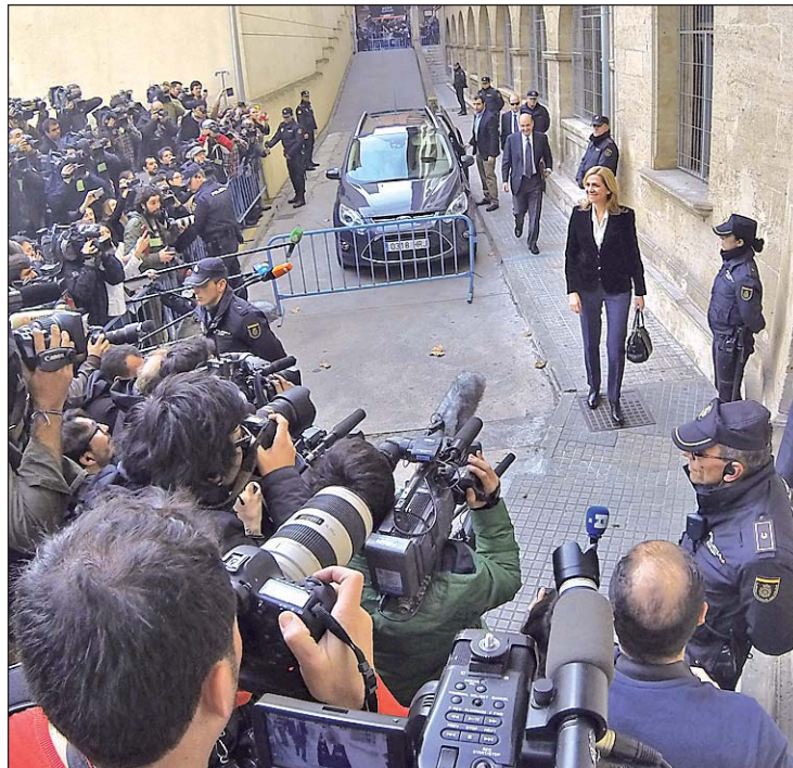
La Infanta Cristina en los juzgados de Palma de Mallorca, en febrero

Así lo decretó mediante un auto, conocido como pase a procedimiento abreviado, en el que también da el primer paso para que Iñaki Urdangarín sea juzgado, en su caso, por delitos de prevaricación, malversación de caudales públicos, fraude a la administración, tráfico de influencias, estafa, falsedad en documento oficial, falsedad en do-