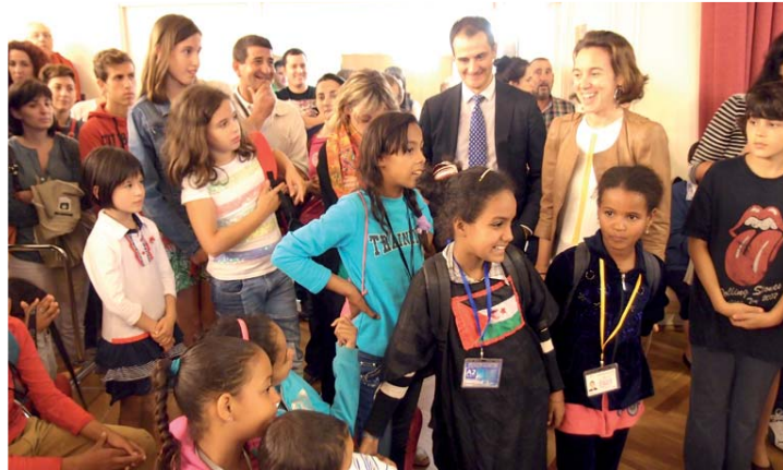
Llegada de los niños saharauis.

Estas vacaciones estivales permiten a los niños alejarse de las duras condiciones de vida que ofrecen los campamentos de refugiados, donde se pueden alcanzar temperaturas entre 50 y 55 grados con deficiencias de agua y alimentación importantes.