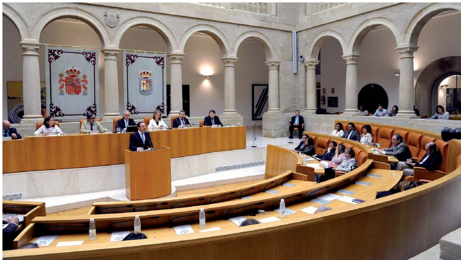
Debate del Estado de la Región en el Parlamento riojano.

Entre las novedades en materia educativa, el presidente regional anunció que el próximo curso 2014-2015 contará con un nuevo