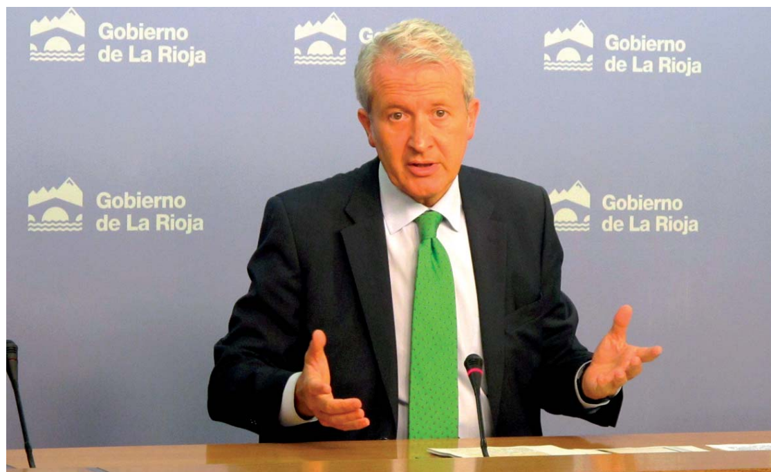
Emilio del Río, consejero de Presidencia y Justicia, en rueda de prensa.

Estas becas se enmarcan en el Plan de Capacitación Integral en Internacionalización puesto en marcha por la Agencia de Desarrollo Económico de La Rioja (ADER) para ayudar a las empresas riojanas a exportar. Además, cuentan con la cofinanciación del Fondo Social Europeo.