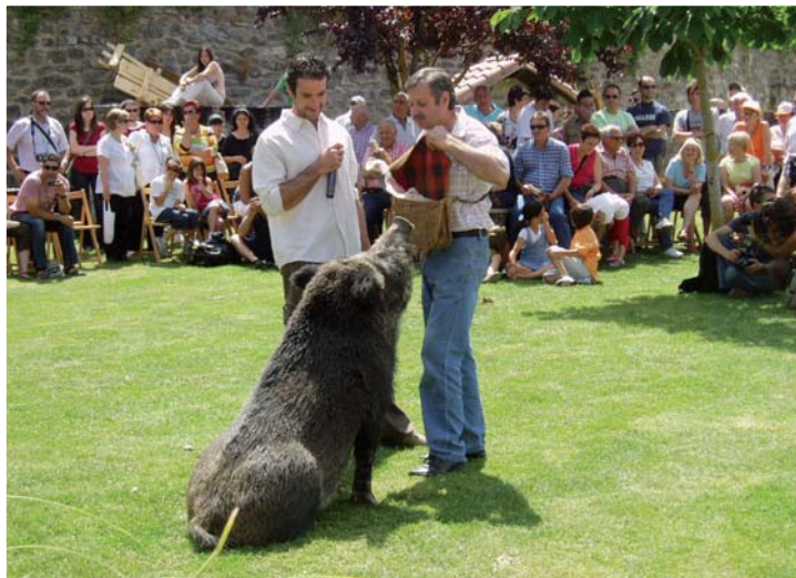
Pasada edición de la Feria de la Trufa.

Ganadería y Medio Ambiente organiza esta tradicional cita en colaboración con el Ayuntamiento de la localidad riojana.