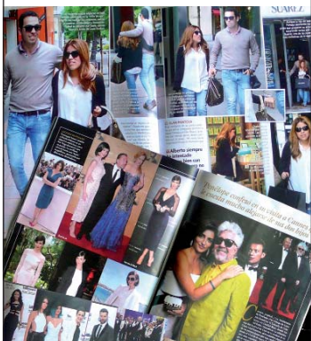
Revistas del corazón.