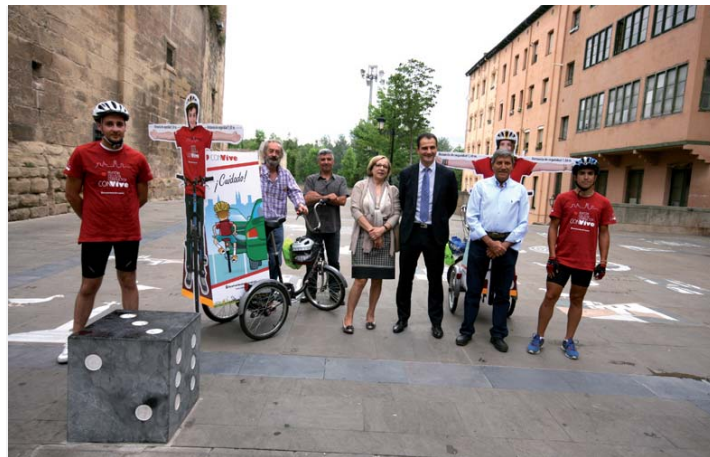
Este encuentro se produjo en la sede de la Federación.