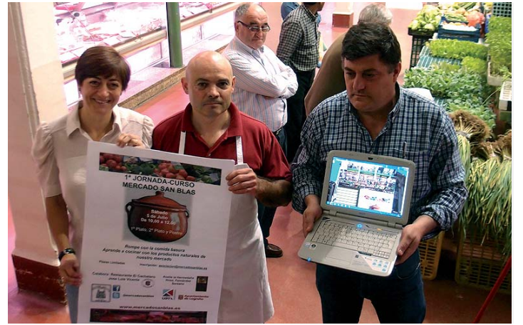
Presentación de las nuevas iniciativas en el propio mercado.