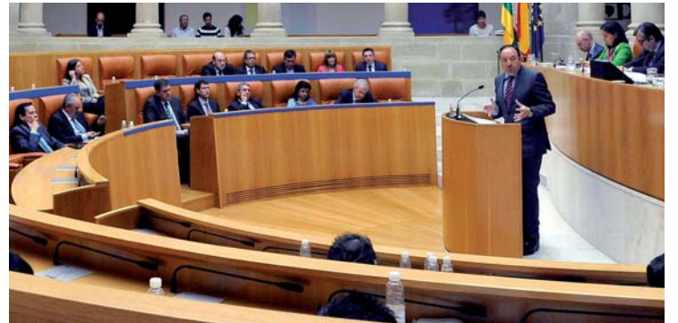
Pedro Sanz anuncia la eliminación del impuesto sobre el patrimonio en La Rioja en el Debate sobre el Estado de la Región Pág.8

Una de las novedades de esta edición reside en la demostración gastronómica a cargo de los cocineros que conforman el 'Cooking Team' Pág. 7