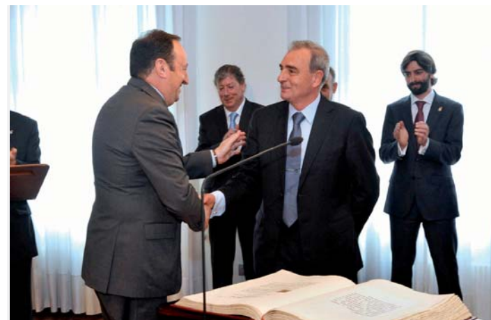
Toma de posesión como nuevo miembro.