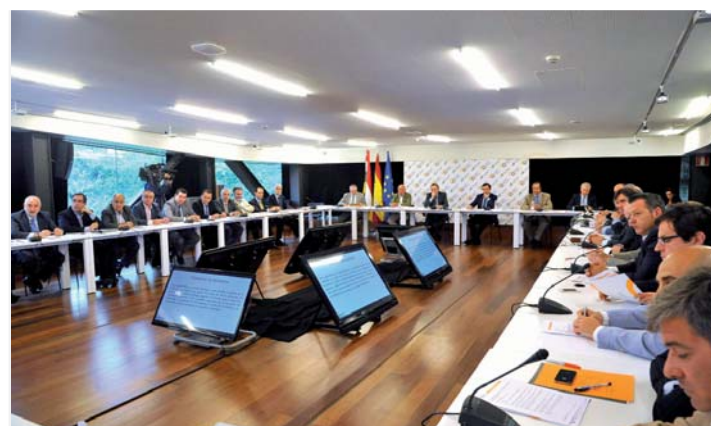
Reunión del XI Patronato de la Fundación Riojana para la Innovación.