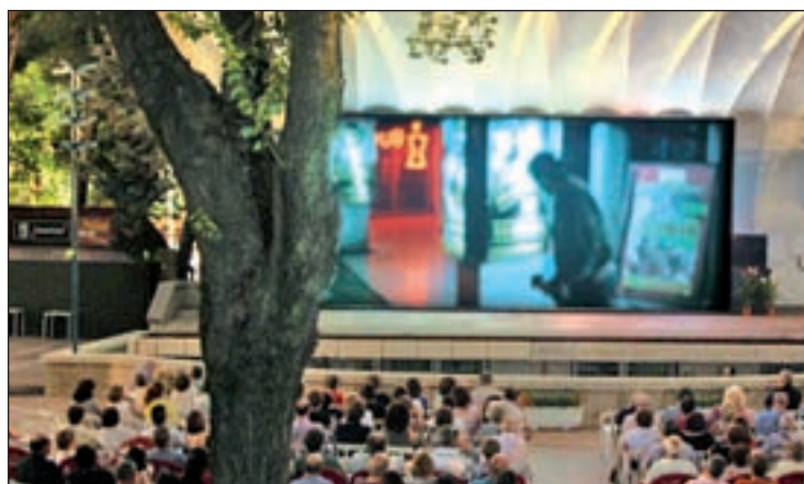
Uno de los cines de verano de la Comunidad de Madrid

El cine español tendrá como siempre una gran presencia, rondando el 40%, con títulos como ‘15 años y un día’, de Gracia Quejetera; ‘Blancanieves’, de Pablo Berger; o ‘Lo imposible’, de Juan Antonio Bayona. También será una oportunidad para volver a recordar otras cintas que han tuvieron un gran calado en el público como ‘Argo’, de Ben Affleck; o