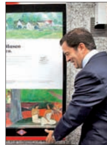
El consejero de Transportes

Otro de los colectivos a los que pretende llegar la galería son