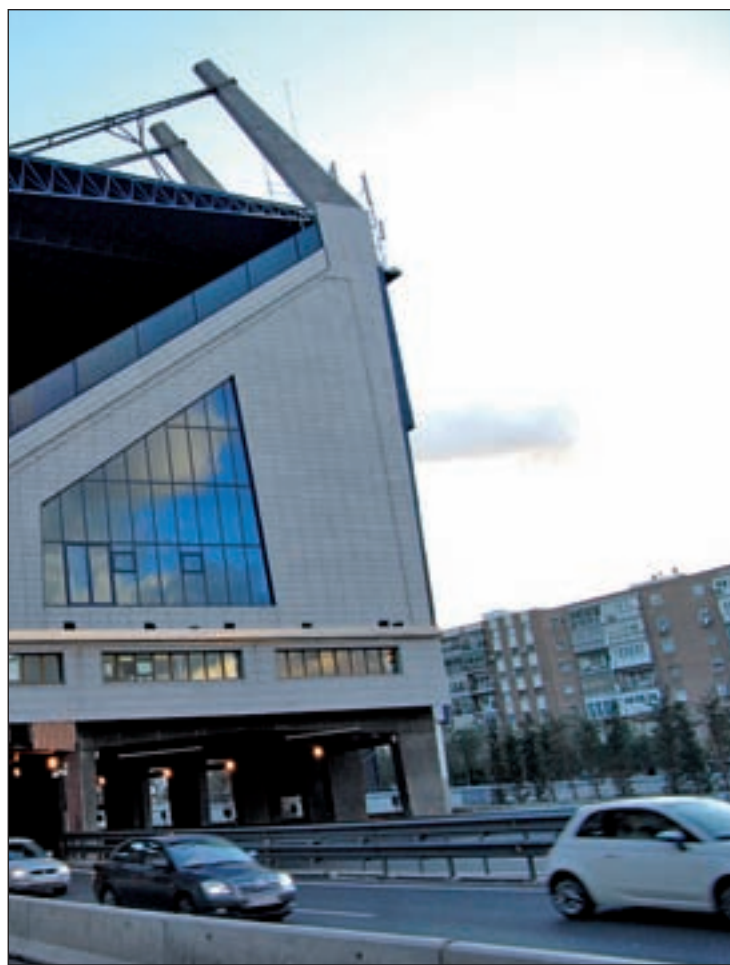
Entorno del Vicente Calderón

denciales y terciarios, y las nuevas dotaciones educativas. La Manzana 1 estará destinada a la ampliación del Colegio Tomás Bretón, la 2 a la construcción de dos edificios, la 3 a una gran zona verde privada y a viviendas de distintas alturas y comercios a nivel