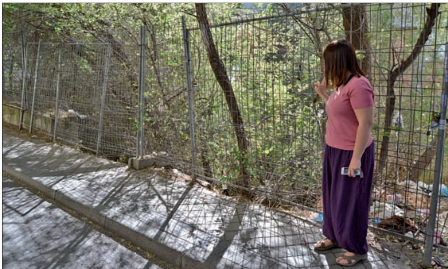
CHEMA MARTINEZ / GENTE