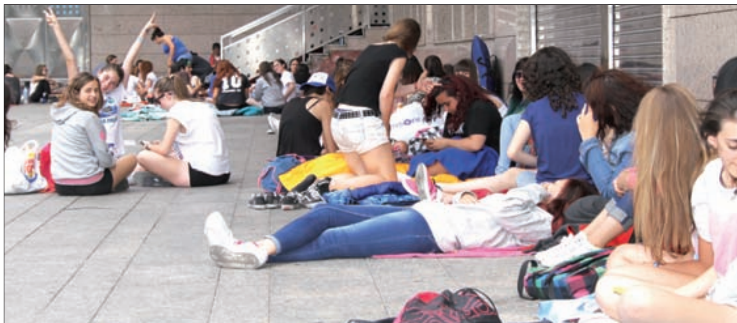
Jóvenes asentados en las puertas del estadio de fútbol Vicente Calderón para ver en concierto a One Direction

Por su parte, Tina, 'solucionadora' en Madrid, considera que "es una oportunidad de trabajo y es una buena opción para los padres, porque los niños no pierden tiempo de estudio".