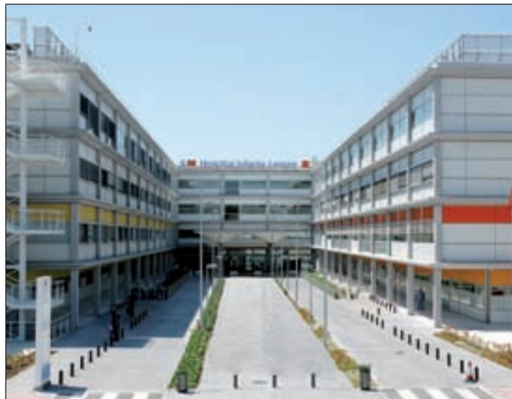
El centro sanitario de referencia de los dos distritos vallecanos