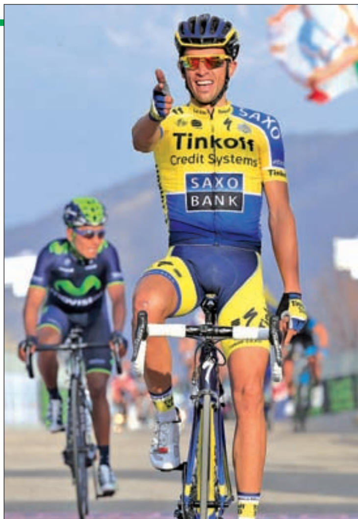
El madrileño buscará su tercer triunfo en la ronda gala

A la espera de saber si Froome podrá defender su corona con menos ayuda de la habitual a causa de las bajas de Boasson Hagen y Henaó, los españoles deben dar un paso al frente también con menos respaldo del que cabría esperar. 'Purito' Rodríguez planifi-