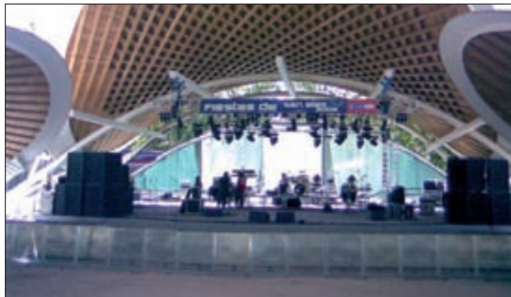
El auditorio volverá a ser el centro de los festejos

A lo largo de tres jornadas, el distrito acogerá juegos infantiles, actuaciones de títeres, una exhibición canina, flamenco, discotecas móviles y pasacalles. Además