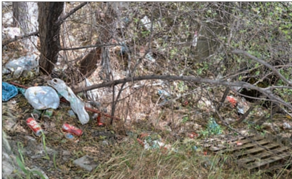
Estado actual del interior de la parcela a la que accedió este periódico

Esta ciudadana comenta que llevan pidiendo, desde hace más de 10 años, una solución para esta parcela que les genera diferentes problemas, sobre todo con la llegada del verano en forma de un aumento del número de insectos y del consiguiente riesgo de incendio por el crecimiento incontrolado de la maleza. Su última reclamación se produjo el pasado 4