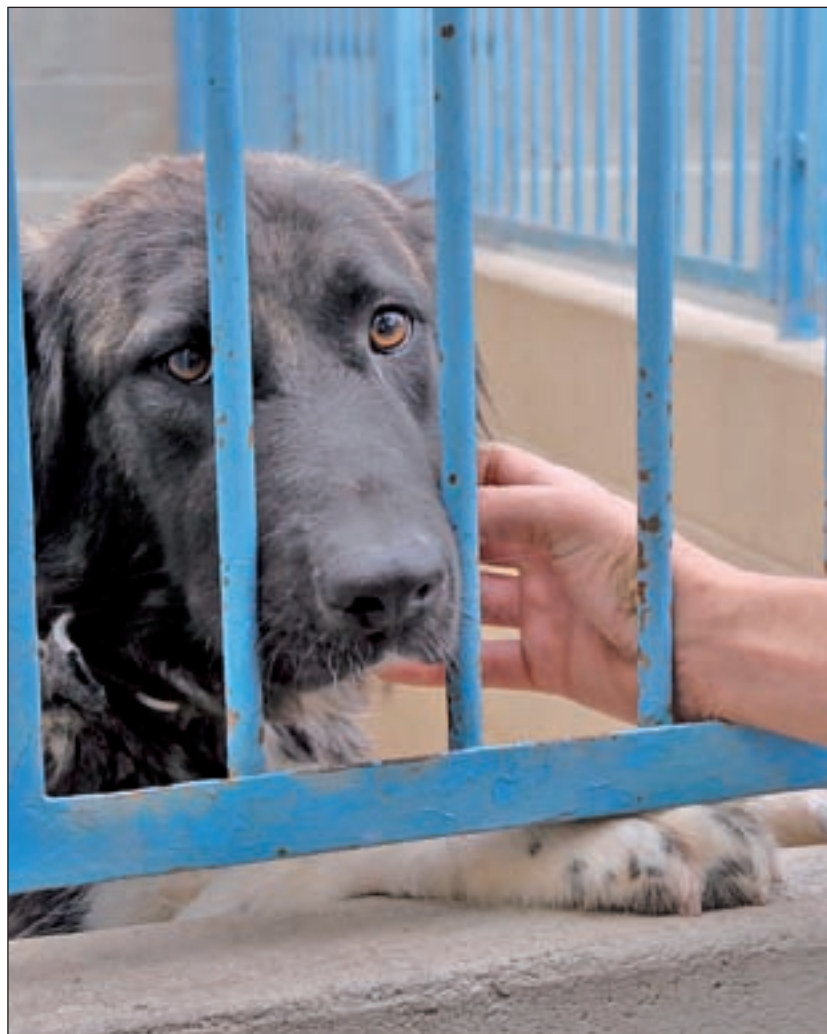
Quienes abandonan, lo hacen independientemente de la época del año GENTE