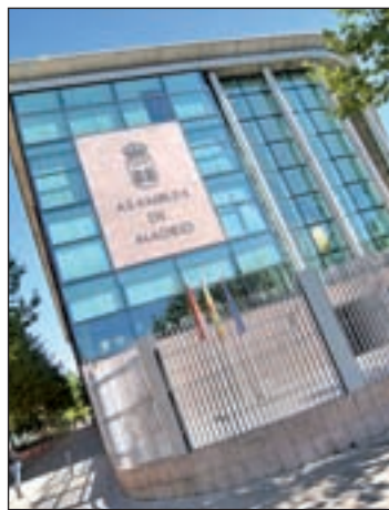
Asamblea de Madrid GENTE

Así, la cifra alcanza los 431.871 euros en el Parlamento de Vitoria, que cuenta con un presupuesto de 32,3 millones y tiene 75 escaños ocupados representando un territorio muy pequeño. Cataluña es la región que tiene la media