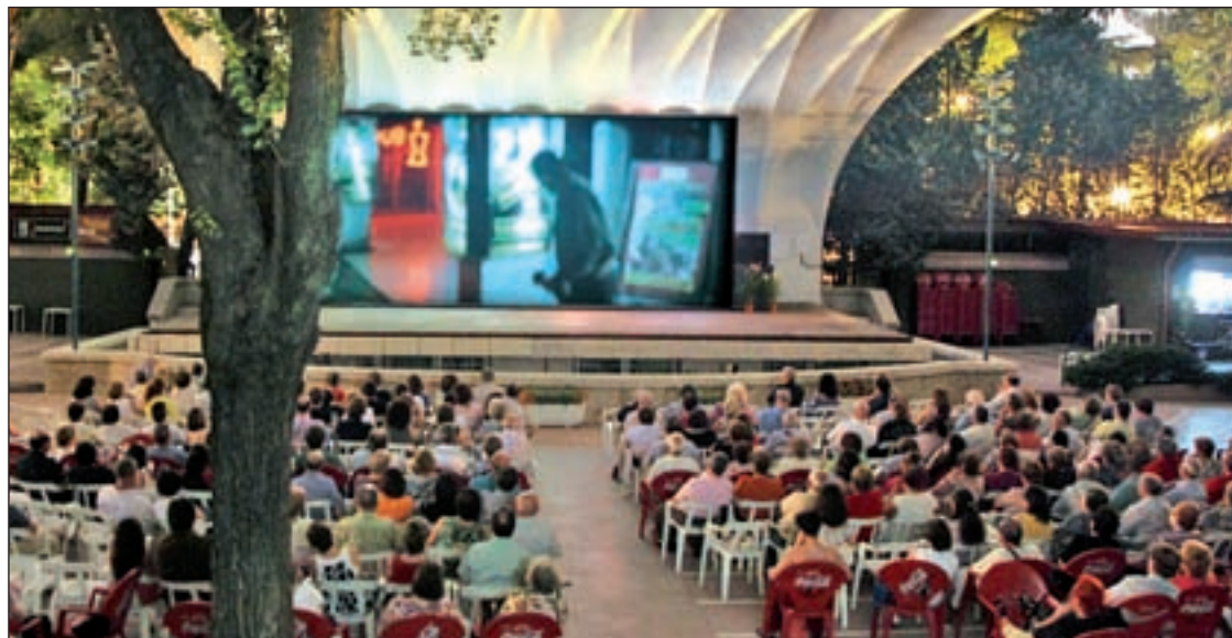
Uno de los cines de verano de la Comunidad de Madrid