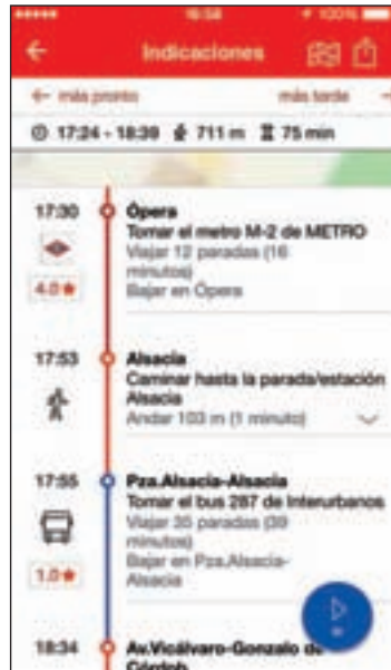
La 'app' propone alternativas

Además del servicio especial de autobuses, habilitado por la Consejería de Transportes, que realizarán un recorrido similar al del suburbano, la aplicación para dispositivos móviles 'Moovit' permitirá planificar los desplazamientos teniendo en cuenta los cortes y ofrece alternativas para esquivarlos. La 'app' funcionará a partir de los datos que aporten los usuarios y de los que generen los operadores de transporte público. Se informará a los usuarios sobre horarios, tiempos de llegada, planifi-