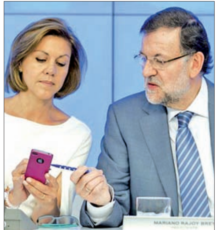
Rajoy presidió el lunes el Comité Ejecutivo Nacional del PP

Esta reflexión podría alcanzar también al número de parlamentarios autonómicos o incluso al de