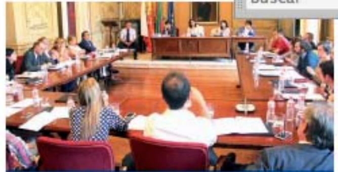
El Pleno del Ayuntamiento de Torrelavega aprueba revisar el nuevo PGOU y el futuro del Torrebiús Pág.11