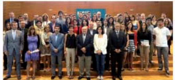
Entregados los XII premios UCem, que han registrado su mejor participación, con un total de 166 emprendedores Pág.10

Los alcaldes de Santander, Ramales y Camargo buscan una solución Págs. 04 y 05