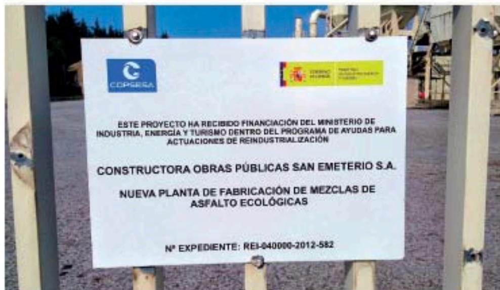
Cartel a la entrada de la finca donde Copsesa pretende fabricar el 'greenroad', el asfalto ecológico.

Lo que no es suposición sino total certeza es el riesgo que supone el gasoducto de alta presión que discurre por debajo del recinto fabril, la estación Reguladora de Gas y la presencia de cientos de residuos acumulados en Valoria (también del Grupo Bolado) a menos de 500 me-