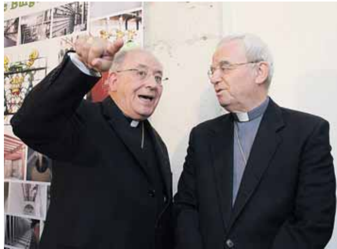
Las autoridades eclesiásticas durante la inauguración del archivo.

La nueva ubicación del archivo es muy distinta a la que tuvo en el Medioevo. El primer archivo data del año 1068. Un tiempo en el