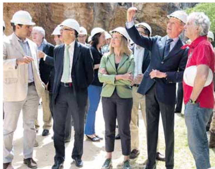
El ministro, con la consejera y codirectores, en los yacimientos.

En el turno de preguntas, el ministro se comprometió a agilizar la unión de las calles La Puebla con