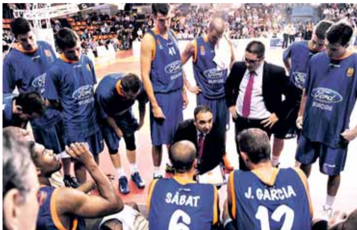
CB Tizona Autocid Ford jugará en una LEB Oro de 14 equipos.

En Liga Femenina, la AD Promete de Logroño y el Universi-