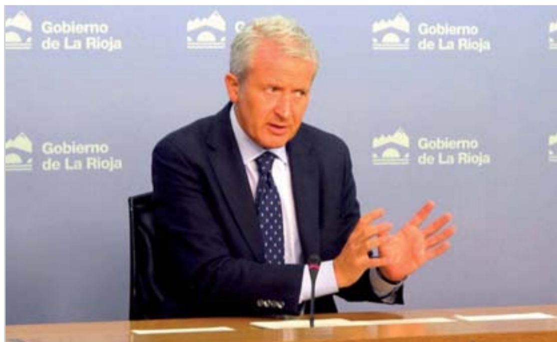
Emilio del Río, consejero de Presidencia y Justicia.

Durante este periodo de programación, 2007-13, un total de 301 jóvenes riojanos se han beneficiado de las ayudas concedidas por un importe de 14 millones de euros y, de este modo, se ha generado una inversión vinculada al sector primario de 20 millones de euros durante los últimos seis años.