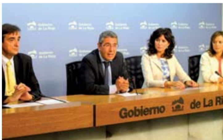
El Gobierno de La Rioja y Kutxabank renuevan el programa.