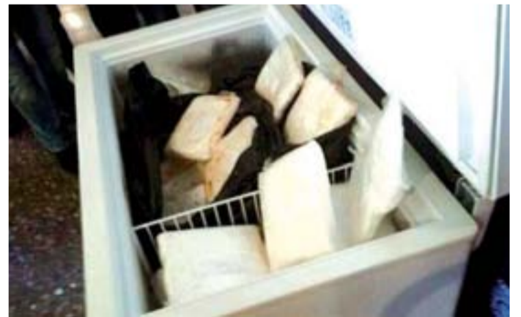
Parte de la droga incautada.