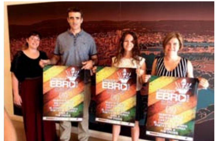
Presentación del concurso en rueda de prensa.

Por último y "muy importante", en estos tres años se ha conseguido una "estabilidad institucional y política, fomentando la colaboración entre instituciones, que es fundamental para las empresas", finalizó el concejal.