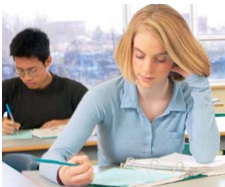
Alumnos en la prueba de selectividad en julio.

La Universidad de La Rioja abrirá el periodo extraordinario de admisión, para el curso académico 2014-2015, del 18 al 31 de