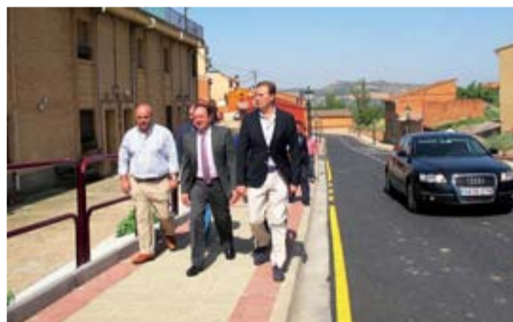
Visita al barrio de las bodegas.