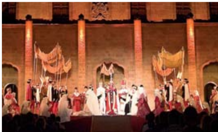
Momento de la representación.