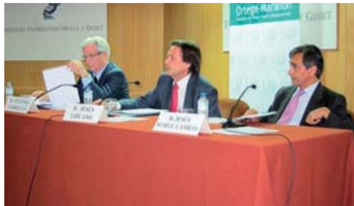
Presentación de los datos.