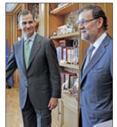
Mariano Rajoy, junto a Felipe VI

Alfredo Pérez Rubalcaba resaltó que a Sánchez le cabe el "orgullo" de ser el primer secretario general elegido por los militantes.