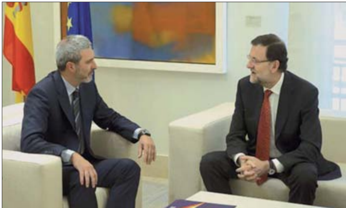
El presidente del Gobierno conversa con un representante de la plataforma Sociedad Civil Catalana

En concreto, un 30,9 por ciento de los consultados califican la campaña de Pablo Iglesias de "buena" o "muy buena". Sin embargo, un 17,4 por ciento juzga que su intervención en las dos semanas previas a la votación fue "mala" o "muy mala". En el caso de Arias Cañete, para un 9,4 por ciento su campaña fue "buena" o "muy buena", y "mala o muy mala" para el 44 por ciento. La candidata socialista, por su parte, realizó una campaña "mala o muy mala" para el 38,2 por ciento de los sondeados por el CIS, mientras que un 7,1 la juzga como "buena o muy buena". Por último, la campaña de Willy Meyer, cabeza de lista de la izquierda Plural, fue "buena o muy buena" para el 5,5 por ciento de los sondeados y "mala" o "muy mala" para el 17,4 por ciento.