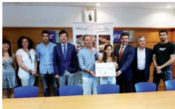
Presentación de la iniciativa.