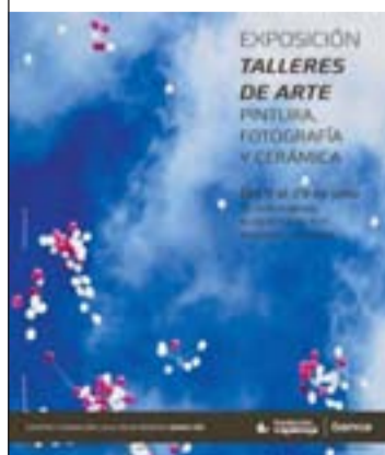
Cartel de la exposición.

Talleres de Arte es el título que lleva la exposición que estará hasta el 29 del presente mes de julio en Cajarioja-Bankia. Es una exposición en la que los alumnos de los Talleres del Arte de la Asociación de Amigos del Plus Ultra muestran sus obras, en las diferentes disciplinas que han cursado, como son: pintura, plumilla y acuarela, cerámica y fotografía. En ella pueden verse los logros de estos alumnos a lo largo del pasado curso 2013-2014. He tenido el privilegio de ser el profesor de uno de estos cursos, el de plumilla y acuarela. Y digo el privilegio, pues para mí ha supuesto una bocanada de aire fresco el estar en contacto con 'curiosos' que se acercan a estos cursos con ganas de aprender y de relacionarse con otras personas con sus mismas aficiones. Entre todos hemos compartido experiencias. Yo, como profesor, aportando mis conocimientos y mi experiencia en las artes plásticas, ellos poniendo ganas y pasión en el aprendizaje. Ahora, con muy buen criterio, la Asociación de Amigos del Plus Ultra ha organizado una exposición para que ellos puedan mostrar sus progresos. Algunos son la primera vez que cuelgan una obra suya en una sala de arte, otros ya tienen experiencia de años anteriores. Pero a mí, todos me recuerdan la ilusión, mezclada con un cierto pudor, que yo sentí en mi primera exposición, así que como les he comentado, eso me hace rejuvenecer. No se la pierdan, merece la pena.