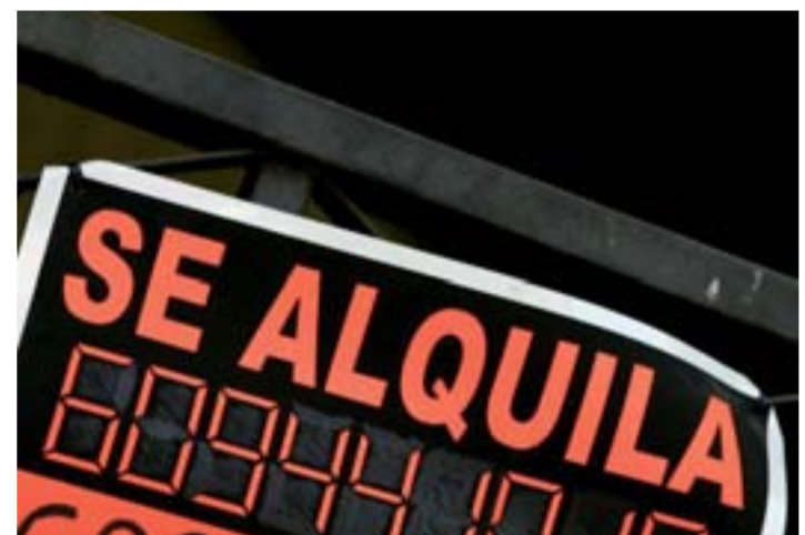
Llamativos carteles cuelgan de las fachadas.

to), se publicarán las listas definitivas el 26 de agosto. La matrícula deberá formalizarse del 27 de agosto al 1 de septiembre.