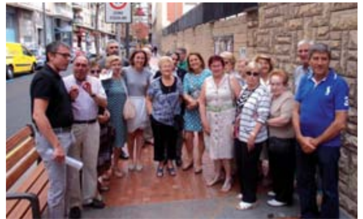
Visita de la alcaldesa con los vecinos.