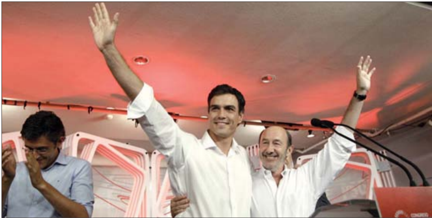
Pedro Sánchez, en la sede de Ferraz tras conocer el resultado

Para más información: www.gentedigital.es