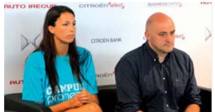
Rueda de prensa de la presentación de la jugadora.

42.195 metros y 21.097 metros, para Maratón y media Maratón respectivamente. El domingo 14 de septiembre, la prueba arrancará a las 9 horas con salida y meta en el Paseo del Espolón.