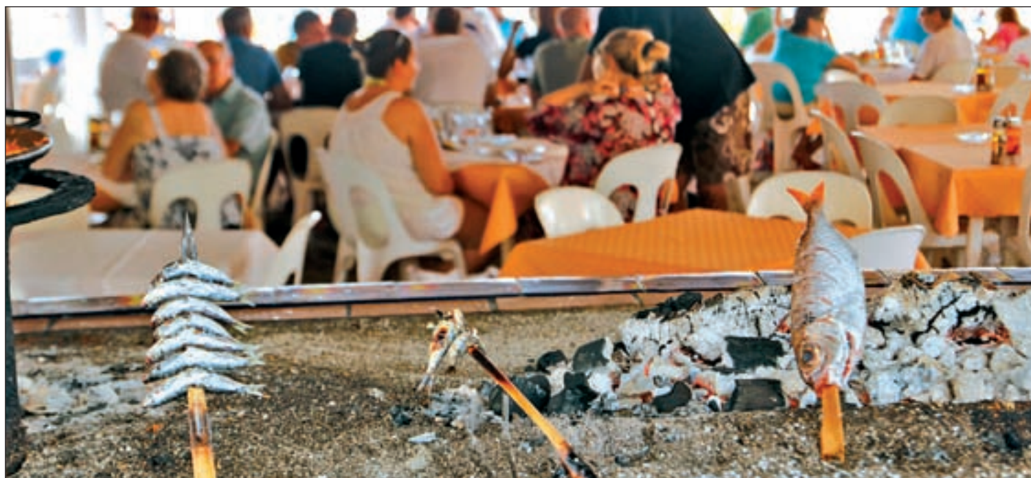
Las sardinas al espeto, plato típico de la costa andaluza, lo más aconsejable para una alimentación equilibrada en vacaciones