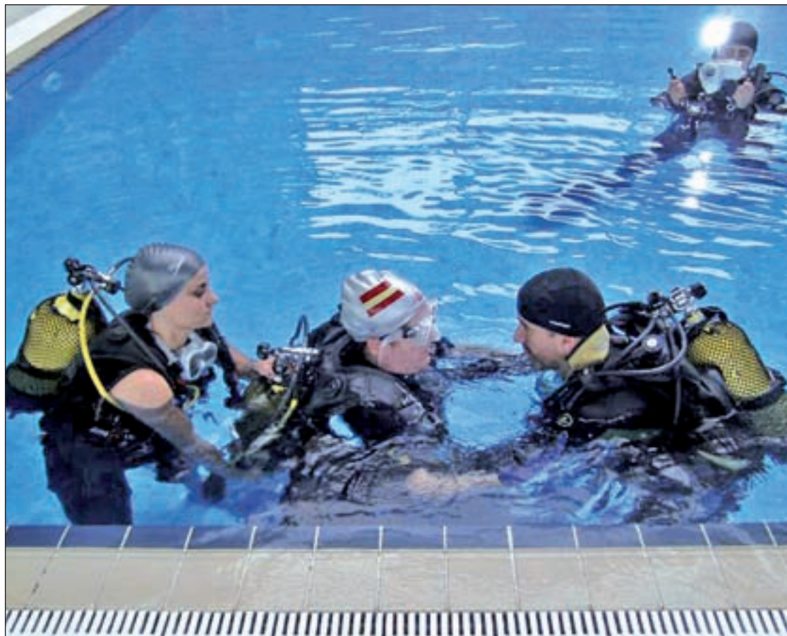
Los cursos de iniciación al buceo, un buen reclamo para estos meses

Varias empresas madrileñas ofrecen actividades como la espeleología o las rutas en quad • El buceo, una de las opciones más demandadas