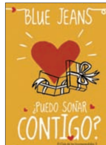
El nuevo libro de Blue Jeans

Amores imposibles, reencuentros inesperados, historias que renacen, malentendidos, envidias y nuevos personajes son los principales ingredientes de '¿Puedo soñar contigo?', la tercera y última entrega de la trilogía 'El Club de los Incomprendidos'. Sus personajes han acompañado a los más jóvenes desde 'Buenos días princesa!' y 'No sonrías que me enamoro', todas de Blue Jeans o, como le conocen en su Sevilla natal, Francisco de Paula Fernández, un fenómeno literario que ha llegado al corazón de los y las adolescentes de medio mundo. Algo parecido a lo que ocurrió con Fede-