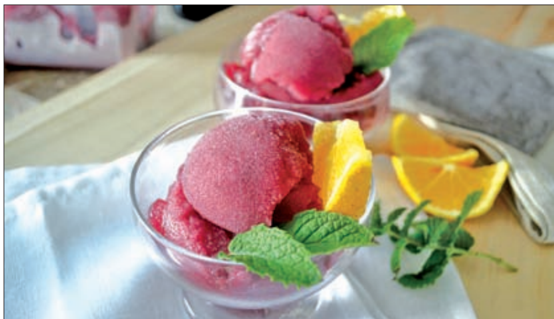
Los granizados y sorbetes son una alternativa para combatir el calor