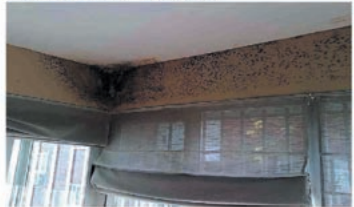
Problemas de humedades por condensación

micología en el instituto de la Salud Pública Louis Pasteur, explica este aumento por nuestro modo de vida: "Vivimos más en el interior, en casa o en el despacho. Desde los años 60, tendemos a un exceso de aislamiento para no dejar escapar el calor y además no se airea suficientemente".