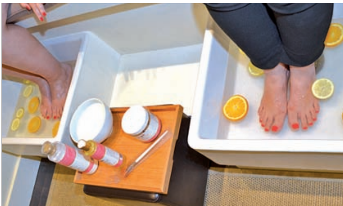
La pedicura de azahar con cítricos se realiza en Escape