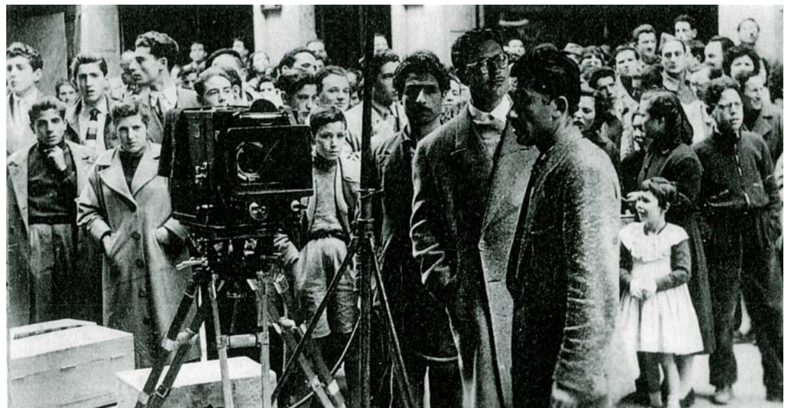
RODANDO CALLE MAYOR 1956