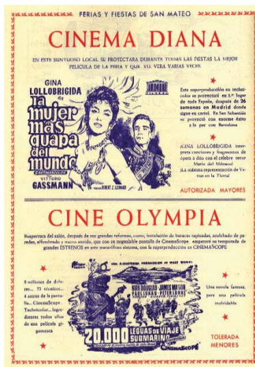
PELICULAS SAN MATEO 1956