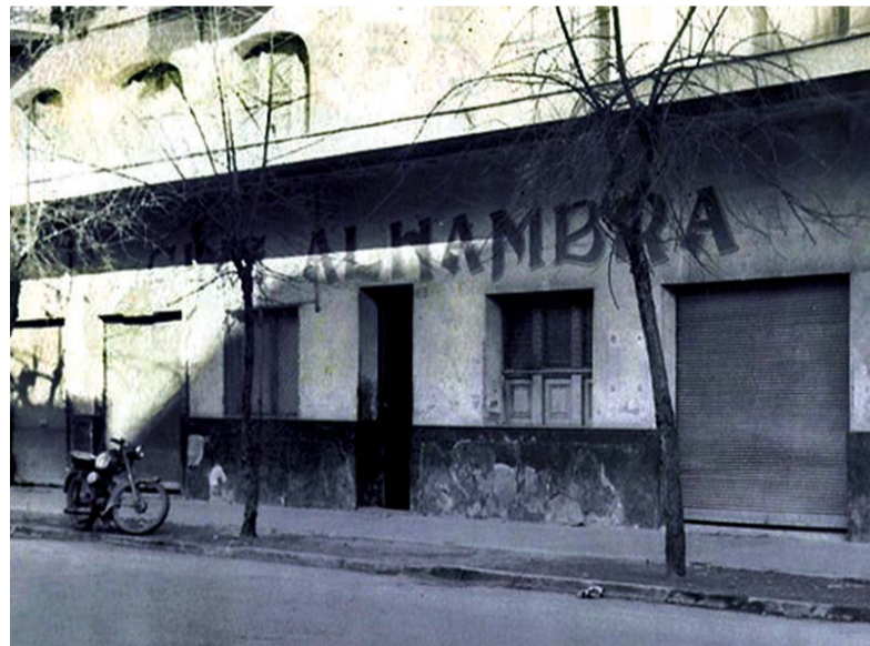
ALHAMBRA DECADA DEL 50