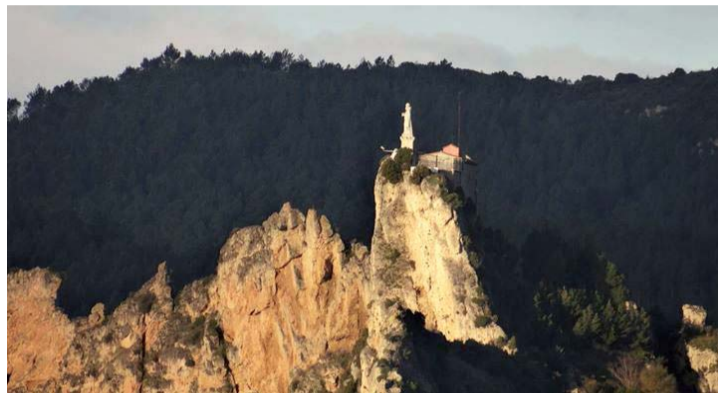
Ermita de San Felices de Haro.

Los actos comenzarán con la actuación del grupo de danzas de Ezcaray en el quiosco de la plaza de la Paz, tras lo cual tendrá lugar una degustación popular de productos riojanos y el sorteo de regalos entre todos los participantes en el concurso promovido por la Guía Repsol para elegir el Mejor Rincón de España 2014 que respal-