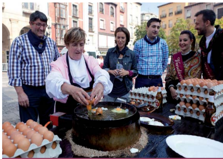
Degustación en la Semana Gastronómica en la Plaza del Mercado.

Hay ocho peñas federadas: La Unión, La Simpatía, Los Brincos, Logroño, Aster, La Alegría, Rondalosa y La Rioja, que agrupan a más de mil peñistas