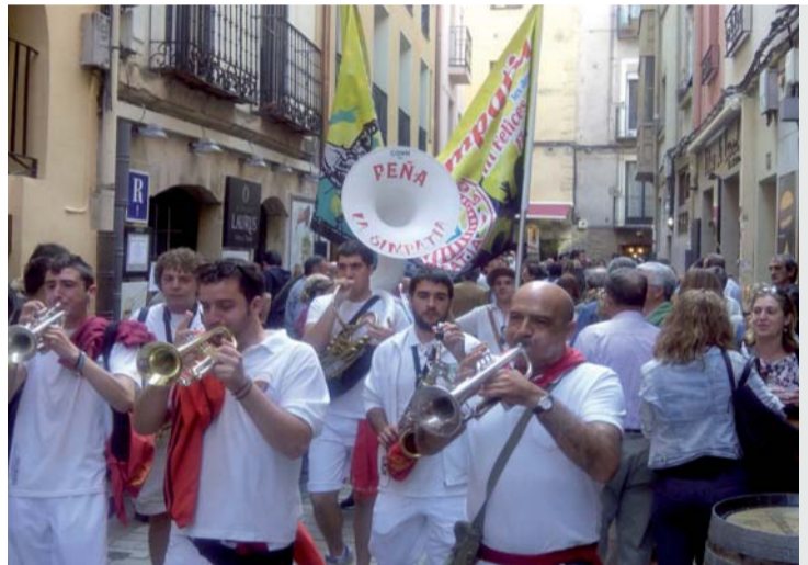
Las peñas van y vienen de la calle San Juan a la Laurel.