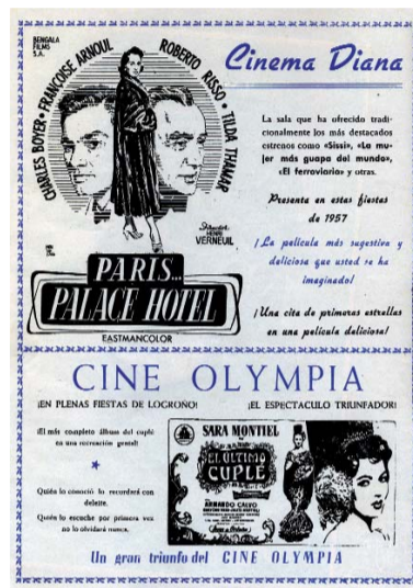
PELICULAS SAN MATEO 1957