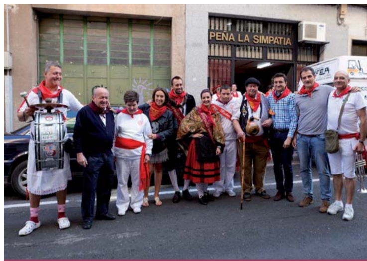
La alcaldesa de Logroño visita a la Peña Simpatía.

La alta participación de los logroñeses en los actos celebrados en la calle durante todas las jornadas ha caracterizado los sanmateos 2014. Aunque el tiempo no ha acompañado algunas noches por la lluvia, el centro de Logroño ha lucido un ambiente festivo inmejorable. Las peñas de Logroño han llenado de alegría las calles y de ahí que sean una parte esencial en las fiestas. En Logroño hay ocho peñas federadas: La Unión, La Simpatía, Los Brincos, Logroño, Aster, La Alegría, Rondalosa y La Rioja, que agrupan a más de mil peñistas de todas las edades. La alcaldesa visitó los chamizos de las peñas como cada sanmateo y agradeció "la dedicación e implicación de los peñistas, que desarrollan un trabajo que se realiza de manera voluntaria y altruista, con el único objetivo de dinamizar y animar la ciudad durante los días de fiestas".