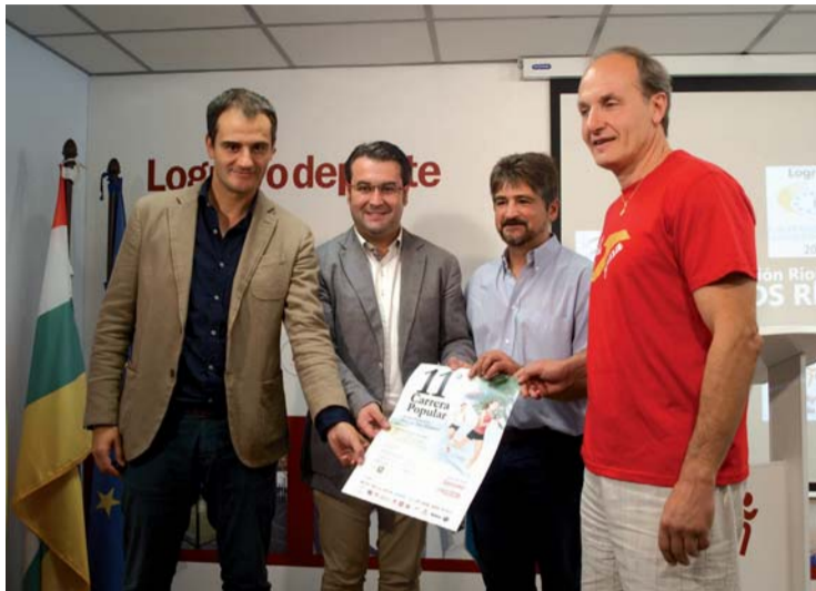
Presentación de la carrera solidaria Tres Parques.