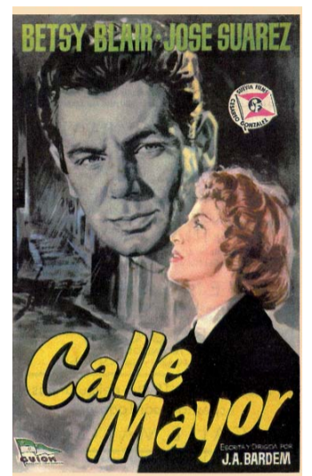
CALLE MAYOR 1956