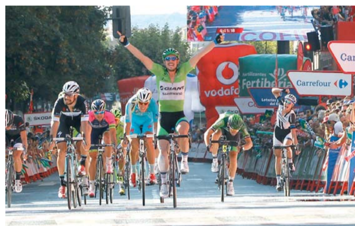
Entrada por la línea de meta.