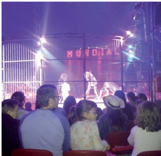
Gran Circo Mundial.

Gente El recinto ferial es un clásico de las fiestas. Las luces, los colores y los sonidos de las atracciones llaman a niños y mayores a disfrutar de las tardes de fiesta. Este año, la novedad han sido las 'sillas voladoras', a 54 metros de altitud que giraban a gran velocidad.