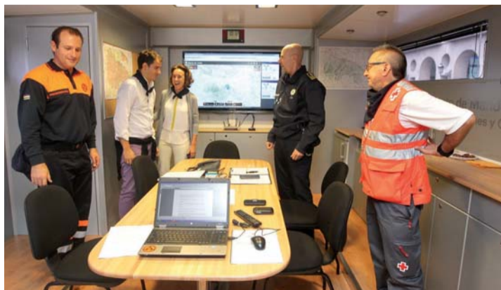
Visita al Puesto de Mando Avanzado.

A diario se reúnen en él Policía Local, Protección Civil, Cruz Roja y Bomberos, a los que en ocasiones puntuales se suman agentes de Policía Nacional y Guardia