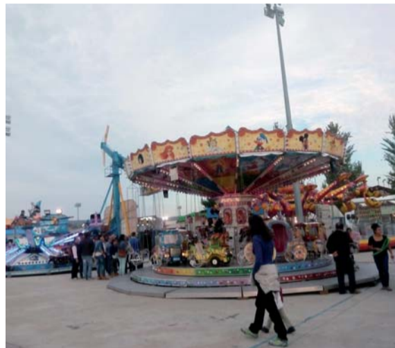
Atracciones de feria.

El Circo Mundial ofrece funciones hasta el domingo 28. El viernes a las 17:15 y 20 horas, y el sábado y domingo a las 12, 17:15 y 19:45 horas