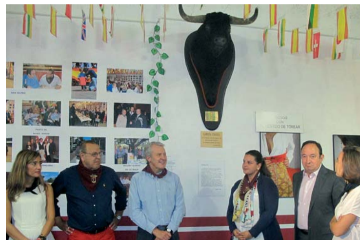
El toro fue lidiado por Pablo Hermoso de Mendoza.

estrecha relación con nuestra región, le cortó las dos orejas el 22 de septiembre de 2008 en la Feria de San Mateo en la Plaza de Toros de La Ribera de Logroño. Tras la faena, el rejoneador se la entregó al presidente del Gobierno regional, quien la ha donado al Club Taurino Logroñés.