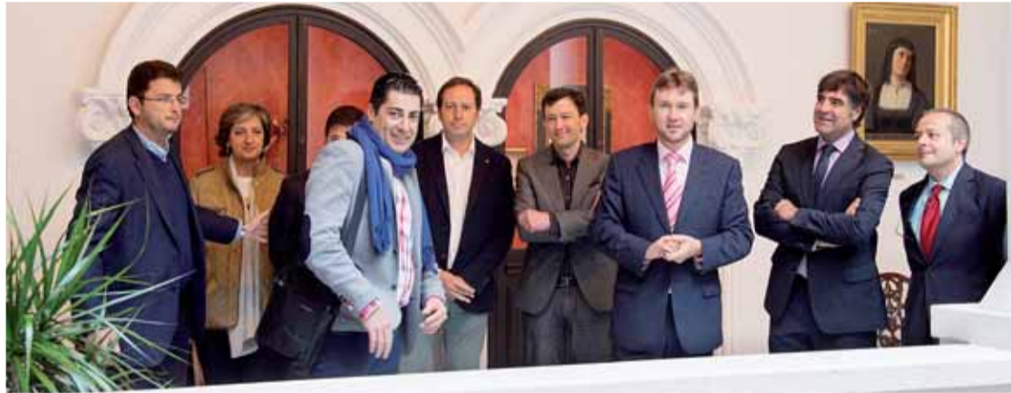
Foto de familia de los integrantes del Consejo Especial para la Custodia, Defensa y Promoción del Patrimonio Mundial.