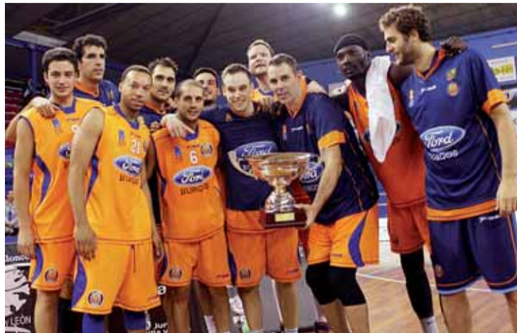
Segunda Copa Castilla y León consecutiva de Autocid.

Será el sábado 4 de octubre a partir de las 19.15 horas cuando la pelota entre en juego para el conjunto dirigido por Andreu Casadevall. Una campaña en la que Autocid Ford será, de nuevo, uno de los principales equipos a batir, después del potencial demostrado durante la pretemporada. Una fase de preparación en la que el equipo burgalés tan sólo ha encajado una derrota, contra un ACB como el CAI Zaragoza. Además, el CB Tizona consiguió su segunda Copa Castilla y León consecutiva el pasado