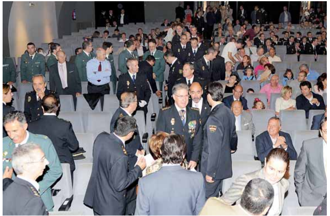
Los responsables celebraron los Ángeles Custodios, patrón del Cuerpo Nacional de Policía.