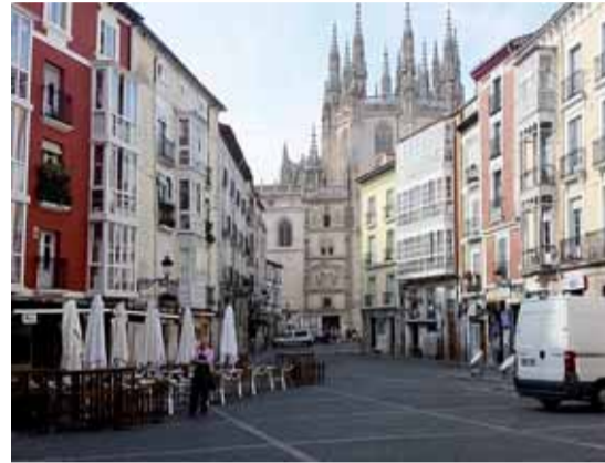
La Flora y La Llana de Afuera son espacios del Centro Histórico pendientes de rehabilitación.