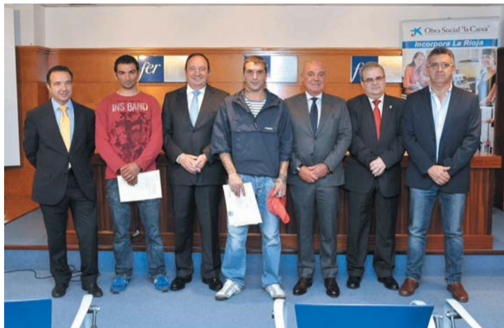
Acto de entrega de los diplomas a los internos del Centro Penitenciario.

Los participantes, todos ellos en la parte final de la condena, han efectuado en la Federación de Empresarios de La Rioja (FER) operaciones básicas de restaurante y bar, organizadas en colaboración con la Asociación Riojana de Hoteles. En concreto, 290 horas de formación, servicio y prácticas en siete empresas riojanas. A partir de