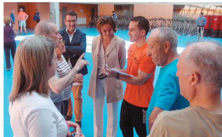
Visita de la alcaldesa al inicio de las actividades.

COMIENZAN LAS ACTIVIDADES DE LOGROÑO DEPORTE