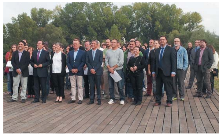
Entrega de diplomas a 60 emprendedores y empresarios.