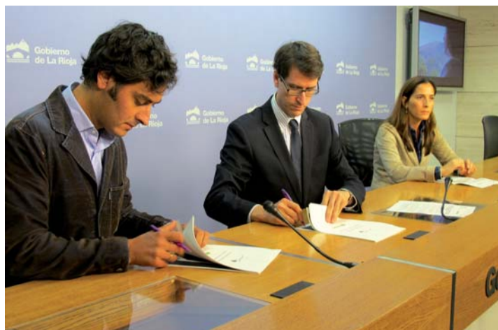
Presentación de la nueva campaña de promoción.