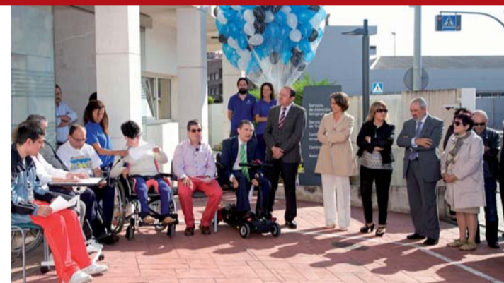
Pedro Sanz respaldó "una educación inclusiva, efectiva y real entre las personas con parálisis cerebral" y recordó que el Gobierno de La Rioja "colabora y colaborará con el movimiento Aspace-Rioja para fomentar el pleno desarrollo de las personas con discapacidad desde el momento en el que se detecta, pasando por las distintas fases de su desarrollo"