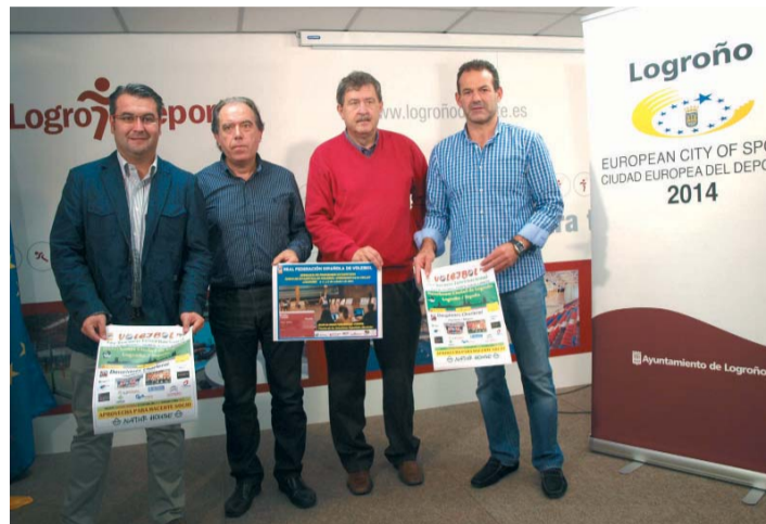
Presentación del torneo.

De manera paralela a este encuentro se van a desarrollar también unas 'Jornadas de Programas Estadísticos' que incluyen un 'Curso de Estadística de Voleibol: Operador Data Voley'. Se celebrarán los