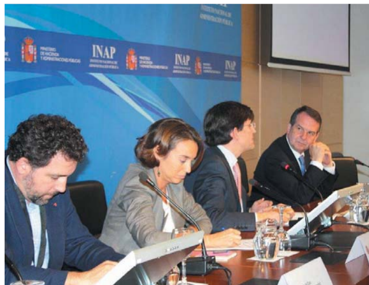
La alcaldesa de Logroño en el congreso.

La alcaldesa de Logroño, Cuca Gamarra, participó el martes 30 de septiembre en el V Congreso Internacional en Gobierno, Administración y Políticas Públicas del INAP (Instituto Nacional de Administración Pública en la que defendió la innovación "como palanca del cambio en las ciudades"; un cambio necesario ante "nuevos problemas sociales y otros que siempre han estado ahí pero que han adoptado otras formas". Desafíos diferentes caracterizados, según la alcaldesa, por "su complejidad, dinamismo y diversidad" y ante los que "ya no podemos seguir actuando de la misma manera, tenemos que innovar". Un línea de actuación en la que deben implicarse todos los actores sociales pero que las administraciones tienen el deber de liderar; fomentándola como "motor de competitividad que genere el crecimiento económico y la creación de empleo que