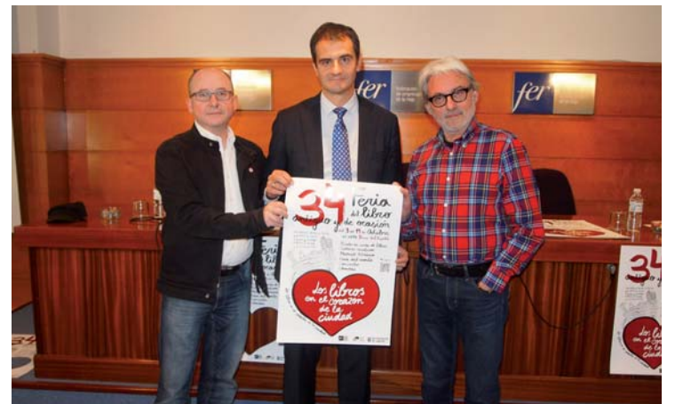
Presentación de la feria en rueda de prensa.

El Paseo del Espolón acoge esta feria que se ha convertido en una de las principales referencias de libro antiguo y de ocasión que se desarrollan en el norte de España.