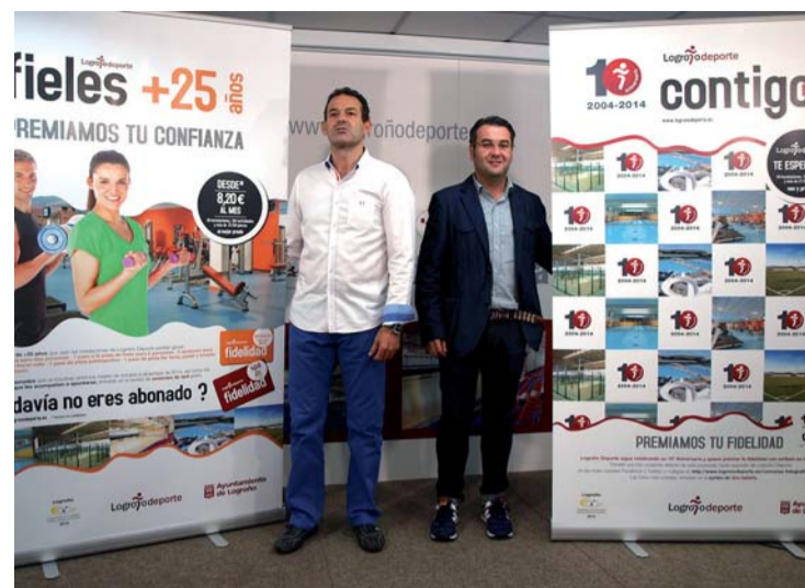
Presentación de la campaña de Logroño Deporte.

Los participantes deberán hacerse una foto en alguno de los pho-