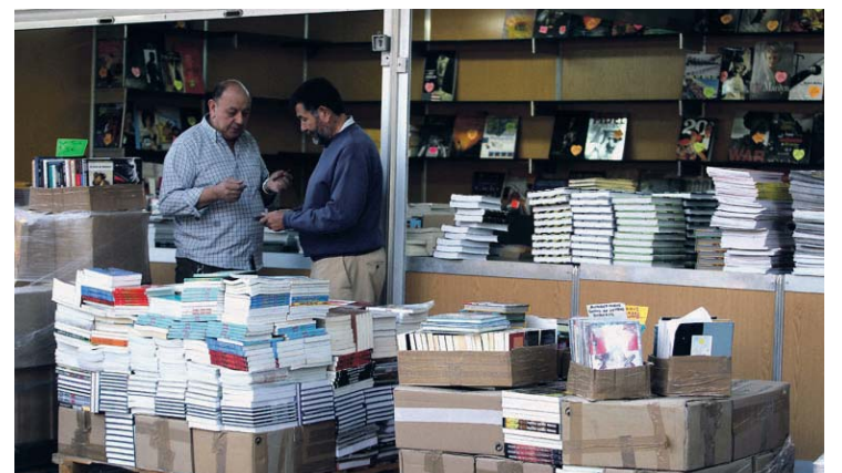
Pasada edición de la feria en el Espolón.