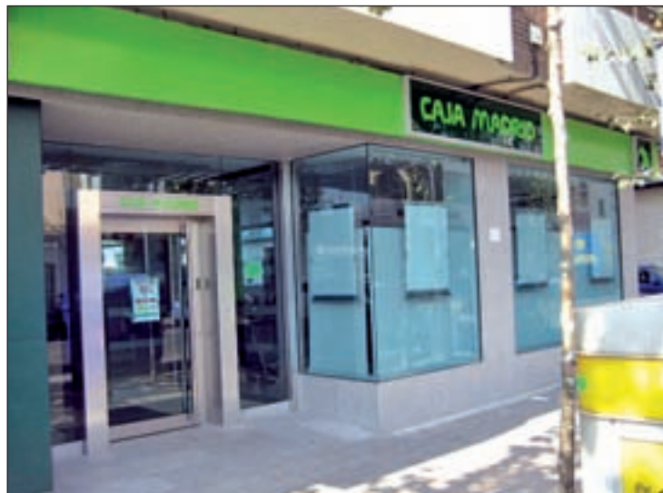
Una sucursal de Caja Madrid

La oposición madrileña (PSOE, UPyD e IU), además, ha acordado solicitar la creación de una comisión de investigación en la Asamblea de Madrid para "analizar y evaluar" las posibles responsabili-