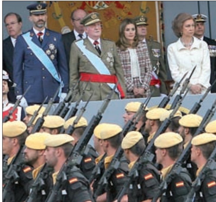
Imagen del Día de la Hispanidad del pasado año

Defensa todavía no ha dado a conocer el presupuesto que va a dedicar al desfile del 12 de octubre, si bien es previsible que sea algo superior al del año pasado (que costó alrededor de 823.000 euros) debido a la participación de más aeronaves. Eso sí, las fuentes consultadas han señalado que lo tampoco se podrá ver por las calles de Madrid serán carros de combate. Las aeronaves que se podrán ver durante el desfile militar llevan días practicando en el cielo de Madrid, mientras que los efectivos que marcharán a pie por el Paseo del Prado de la capital