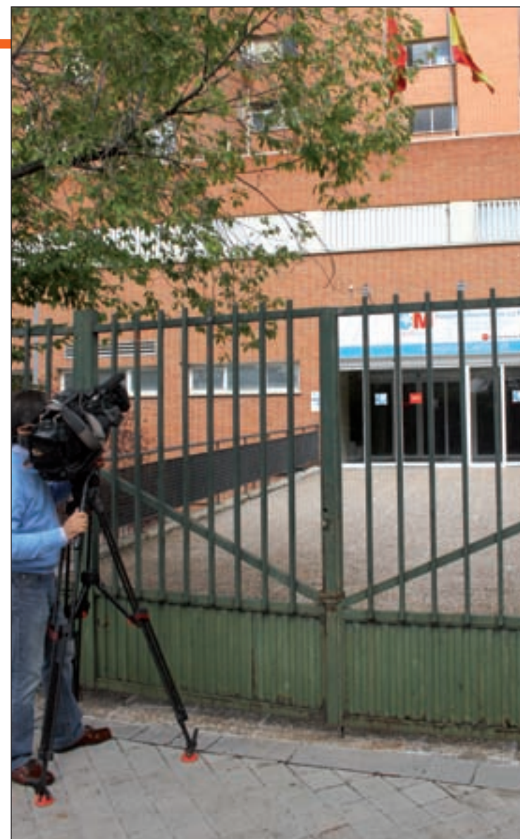
El Hospital Carlos III de Madrid

El titular de Defensa considera, además, que la ministra de Sanidad, Ana Mato, "está haciendo lo que debe hacer" para solucionar