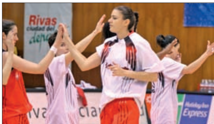
El conjunto ripense busca aumentar su palmarés

La pérdida de algunos de sus mejores efectivos invita a pensar en