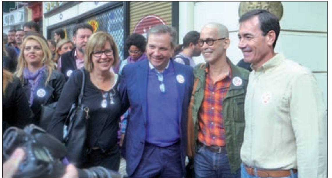
Tomás Gómez y Antonio Miguel Carmona, juntos en un acto