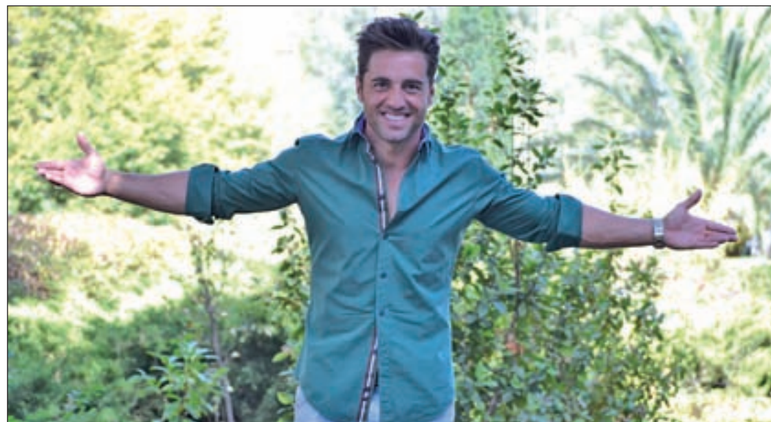
CHEMA MARTÍNEZ / GENTE

Seis personas han llegado a estar ingresadas en el Carlos III y dos recibieron el alta • La Comunidad modifica el protocolo de seguridad PÁGS. 2-3