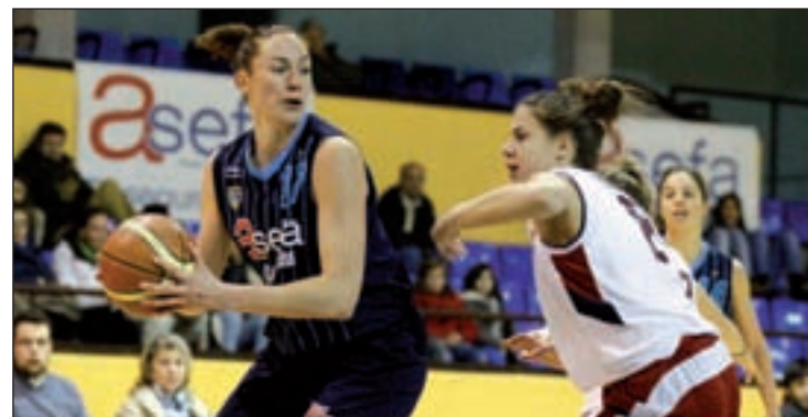
Nuevo test para las colegiales

Para la jornada del domingo quedarán reservados el partido por la tercera y la cuarta plaza (10 horas) y, por supuesto, la gran final (12 horas).