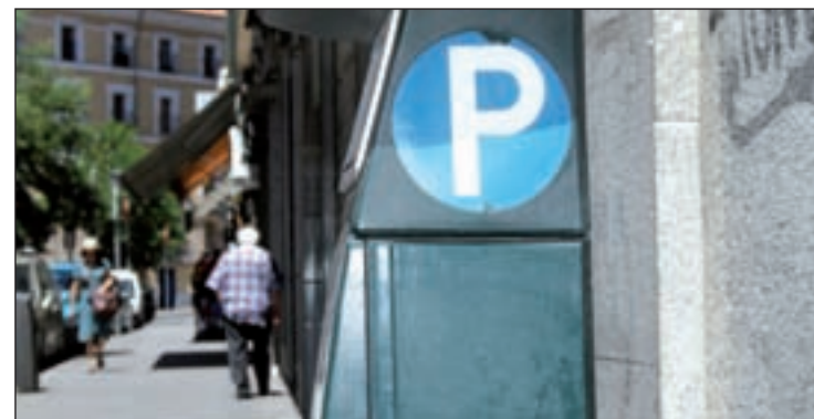
Parquímetro en la capital

solución adoptada por el TSJM en relación con las recientes modificaciones del SER llevadas a cabo por el Ayuntamiento de Madrid. Estas resoluciones afectarían, entre otras cosas, a la ampliación del estacionamiento regulado a los barrios de Casa de Campo y Ciudad Universitaria.