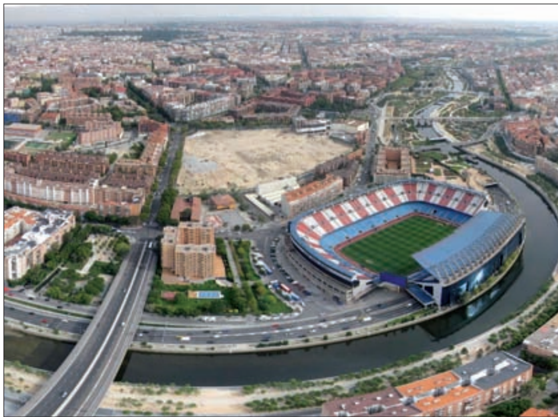
Vista aérea del estadio

En su día, el TSJM estimó parcialmente el mencionado recurso, pero en la tramitación del proceso no emplazó debidamente a Mahou, una parte interesada en