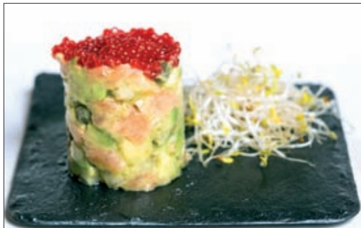
Tartar de salmón, de La Mancha en Madrid