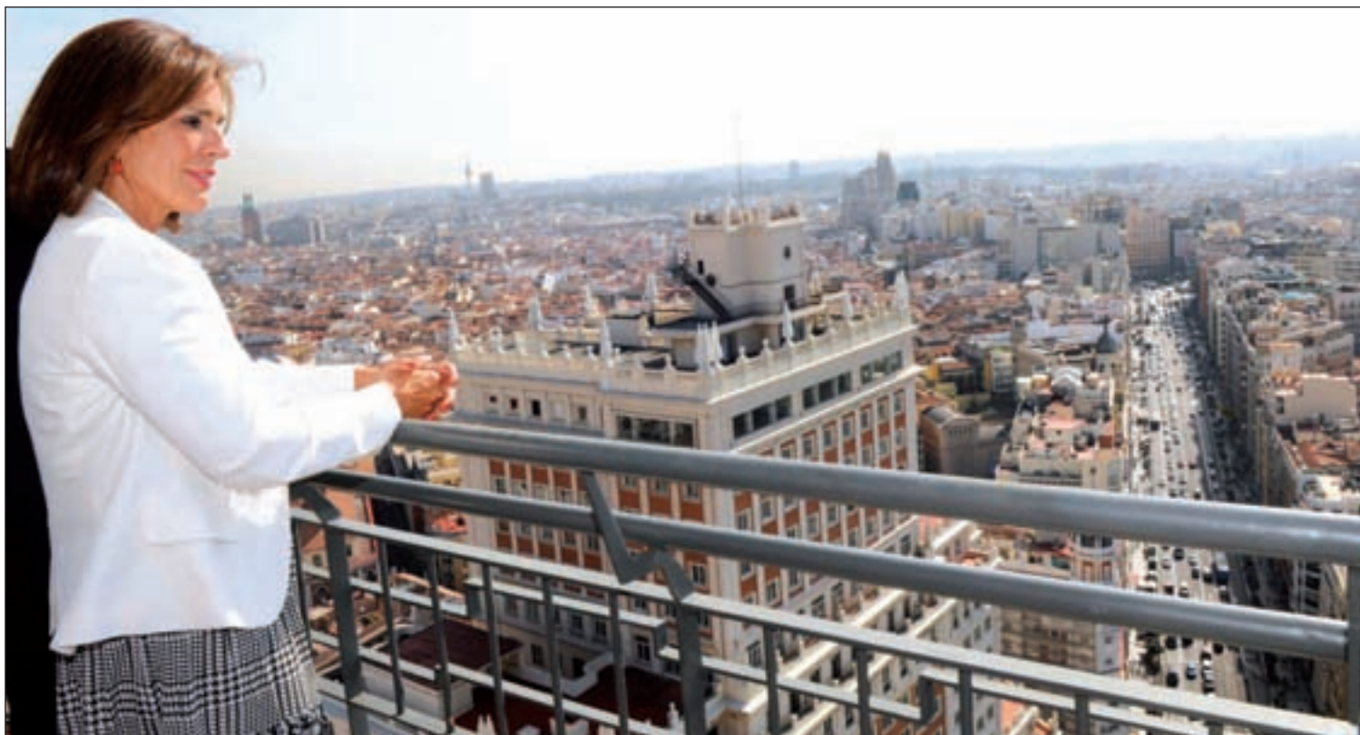
Ana Botella, alcaldesa de Madrid, en el ático de Torre España