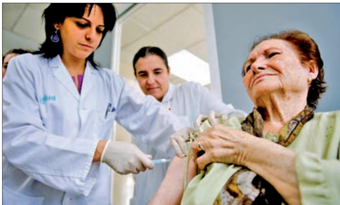
Se vacunará a los grupos de riesgo

La Comunidad ha pagado los más de 60 millones de euros, en concepto de indemnización, a los propietarios de la finca El Tagarral de Tres Cantos, tal y como recoge una sentencia del año 2003. Este era un problema de recalificación de terrenos que venía desde el año 1987.