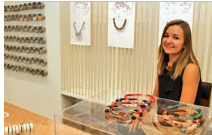
Los collares de latón

Los productos más especiales que se puede encontrar en 'Por tu cuenta' son unos collares de latón con una fotografía estampada que se imprimen en Japón. En estos diseños, Irene plasma su amor por el arte y cuenta con collares con el estampado de 'Line over form' de Mondrian, 'Los ángeles' de Rafael o 'El jardín de las delicias' de El Bosco, y, además, es-