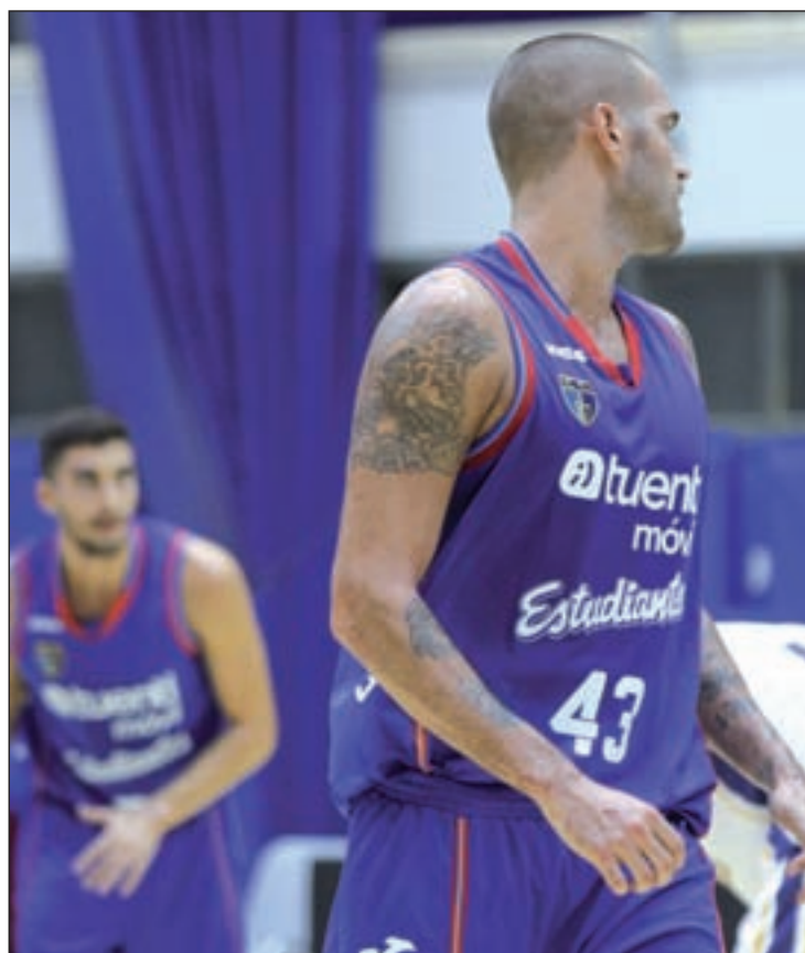
El Estudiantes sumó su primer triunfo

tivamente. Bajo la magistral batuta de Javi Salgado, el Estudiantes mostró una versión alegre que espera conservar este domingo (12:30 horas) en su visita a la cancha de otro histórico de la competición, el FIATC Joventut, que también arrancó con buen pie la temporada al imponerse por 74-79 al CAI Zaragoza. Fede Van Lacke será baja por una lesión en el tobillo.