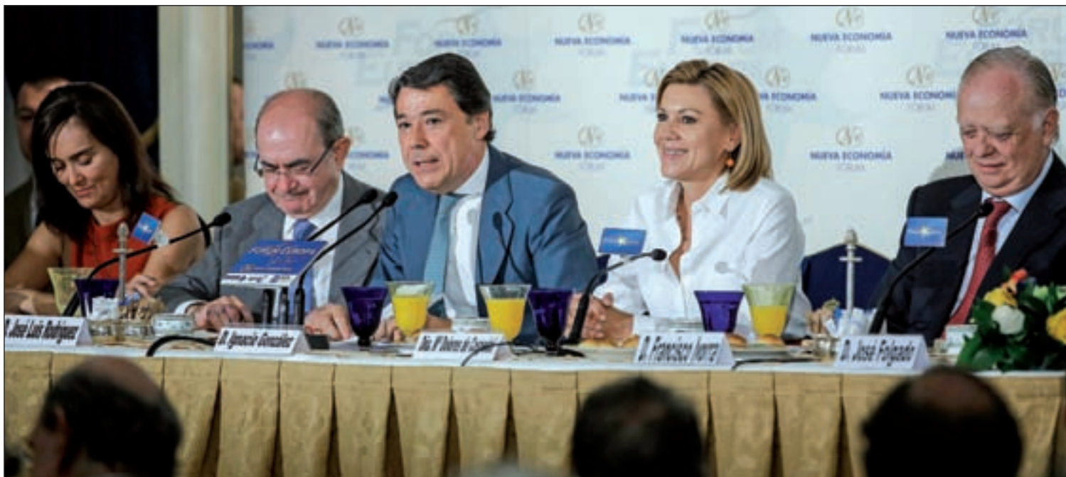
El presidente de la Comunidad, Ignacio González, durante su discurso en el foro 'Nueva Economía Fórum'