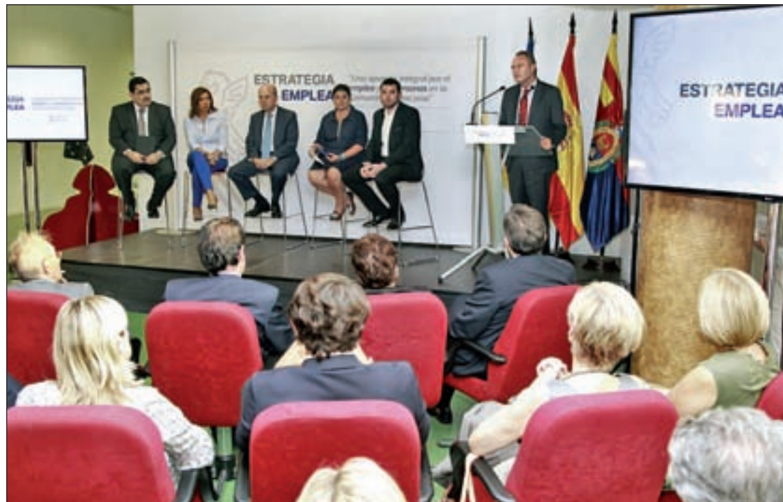
El Presidente de la Generalitat, Alberto Fabra GENERALITAT VALENCIANA

"Vamos a seguir construyendo una Nueva Economía, mejorando la competitividad de las empresas, apoyando su financiación, la internacionalización, el emprendimiento y eliminando las trabas