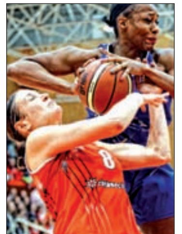
La Supercopa, a partido único

El rival del conjunto salmantino será el Rivas Ecópolis, un equipo que durante las últimas temporadas se ha ganado el respeto tanto a nivel nacional como europeo a