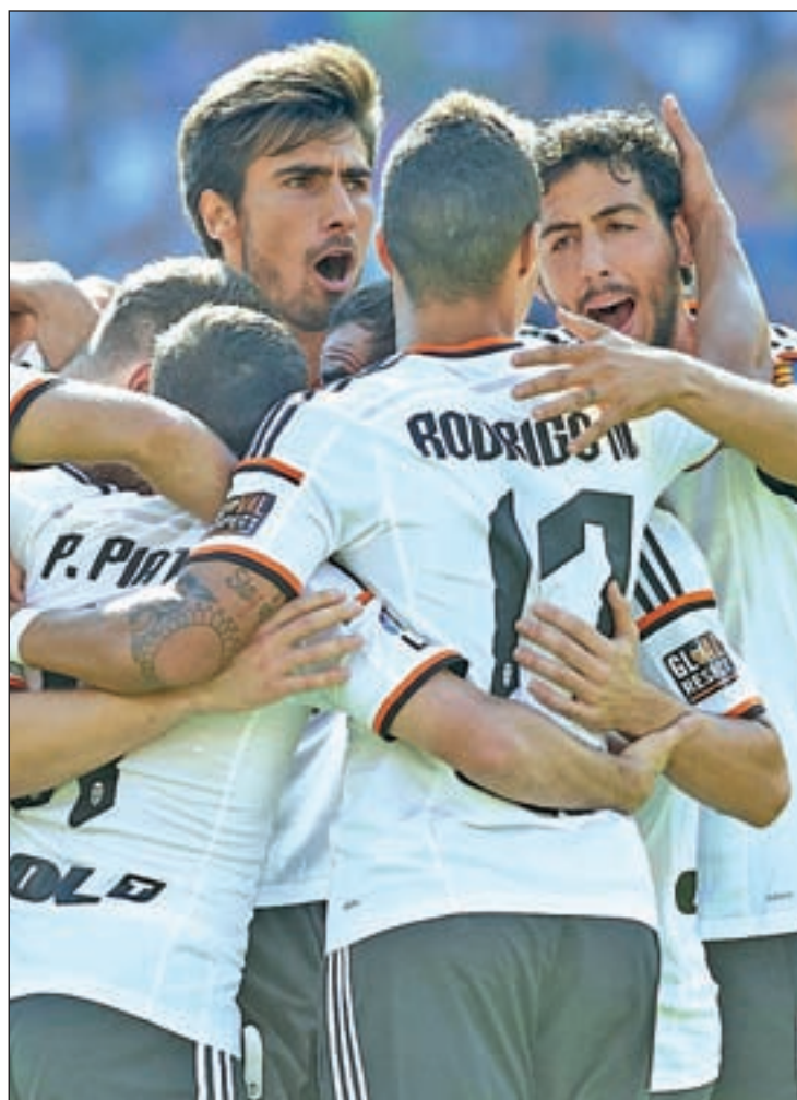
El Atlético tampoco pudo frenar al Valencia

ne motivos para estar satisfecho. En siete jornadas sólo se ha dejado cuatro puntos en el tintero, completando unos números que le valen para ser actualmente el segundo clasificado. El pleno de triunfos del Barcelona ha evitado que los pupilos de Nuno miren a sus rivales desde un puesto más alto, pero desde el vestuario se aboga por no mirar a metas muy ambiciosas, basándose en la máxima que proclama el último entrenador que pasó por el banqui-