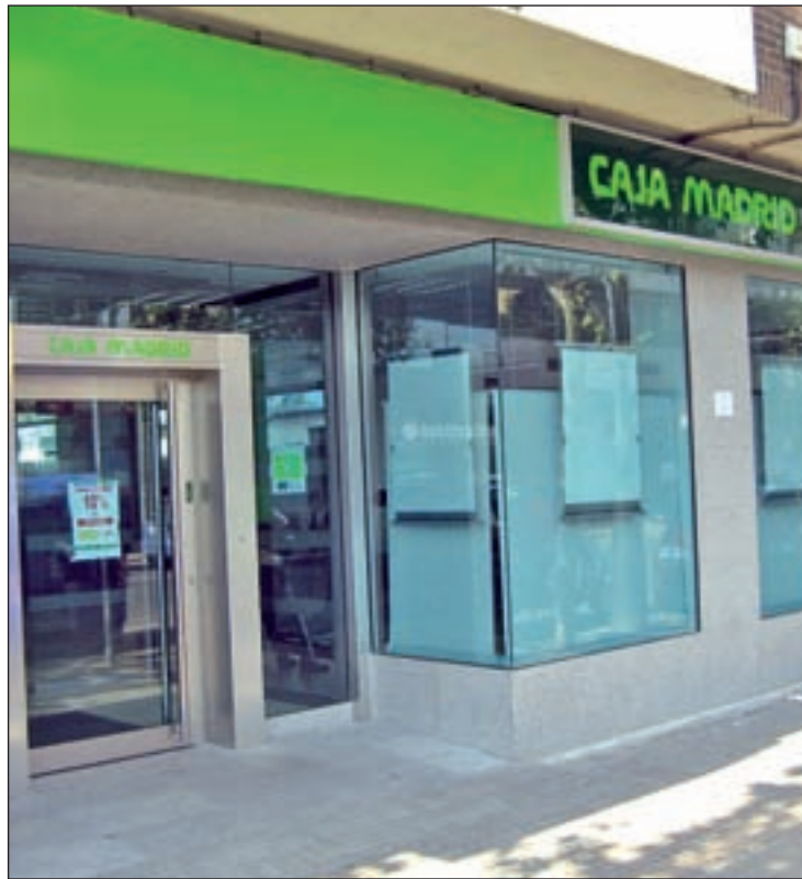
Una sucursal de Caja Madrid