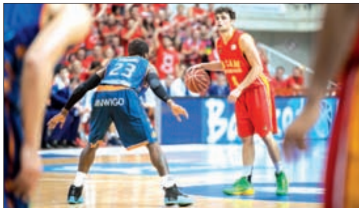
El UCAM Murcia dio el primer disgusto del año al Valencia