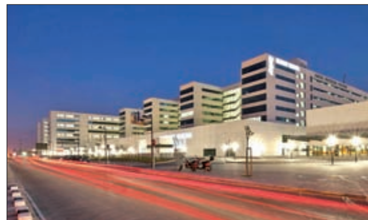
Fachada nocturna del Hospital La Fe

De hecho, criticó que la Conselleria no dio ninguna directriz cuando saltó la alarma el pasado mes de abril, por lo que hubo "una dejación y falta de responsabilidades y de coordinación entre ministerio y Conselleria".