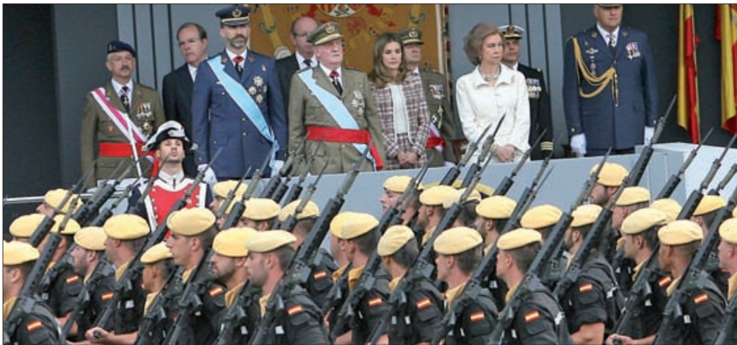
Imagen del Día de la Hispanidad del pasado año