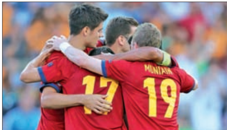
Los jugadores de Celades, ante un nuevo reto

Con este decorado, no es de extrañar la importancia que ha cobrado la eliminatoria contra Serbia. El primer asalto tendrá lugar este viernes (17 horas) en el estadio Gradski de la ciudad balcánica de Jagodina, resolviéndose