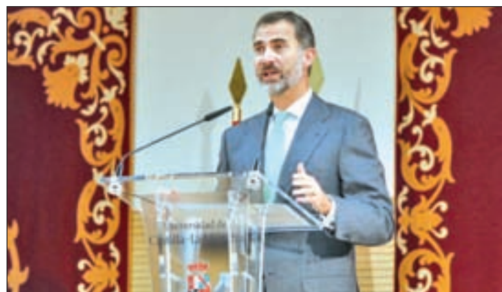
El Rey Felipe VI, durante un acto

En el acto también se otorgaron distinciones para el empresario alicantino Manuel Peláez Castillo (también a título póstumo) y al