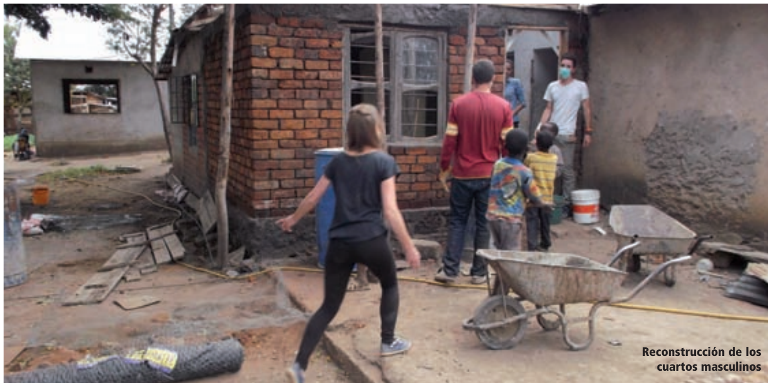
Reconstrucción de los cuartos masculinos