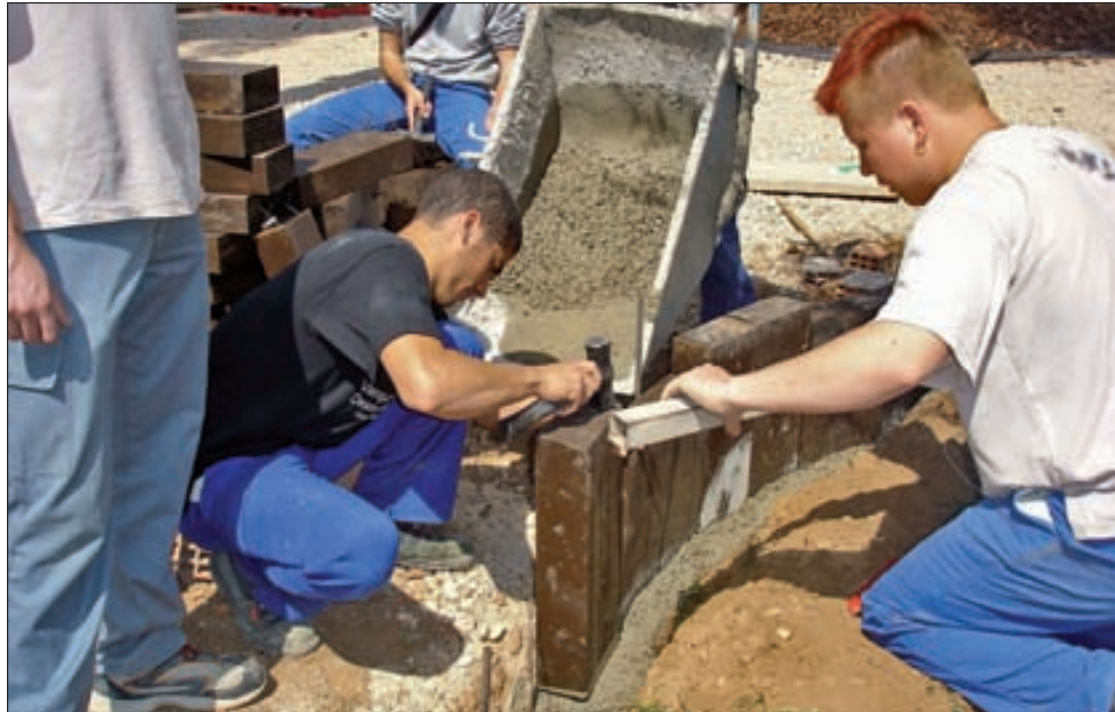
El día 1 de octubre se incorporaron los parados del plan de empleo anterior

Los trabajadores realizarán servicios muy diversos, que irán desde la mejora de la vivienda a la gestión de residuos y aguas, pasando por los transportes colectivos, el mantenimiento del patrimonio cultural, la promoción del turismo, el desarrollo de la cultura local, la promoción del deporte y el sector audiovisual, el mantenimiento del patrimonio cultural, la ayuda a jóvenes con dificultad y la prestación de servicios a