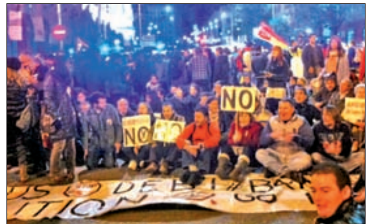
Grupo de protestantes

En el caso de las otras seis ruedas de reconocimiento, habría habido "muchas dudas" por parte de las menores.