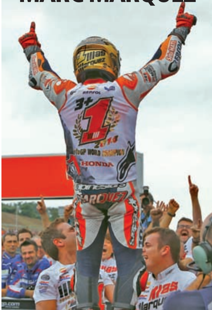
El piloto de Honda celebrando el Mundial en Japón

FRANCISCO QUIRÓS SORIANO @franciscoquiros