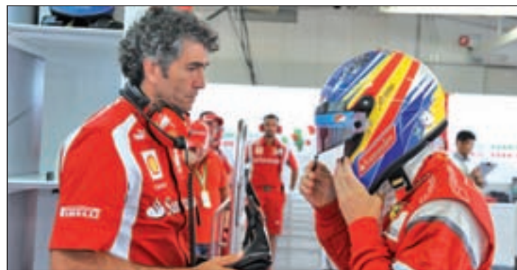
El futuro del piloto español sigue en el aire

prueba de Sochi. Ese resultado no ha hecho más que enrarecer el ambiente dentro de Ferrari. Tanto es así que se ha llegado a especular con la posibilidad de que Alonso opte por pasar un año sabbático, en el caso de no firmar por otra escudería, antes que alargar la agonía con el equipo italiano.