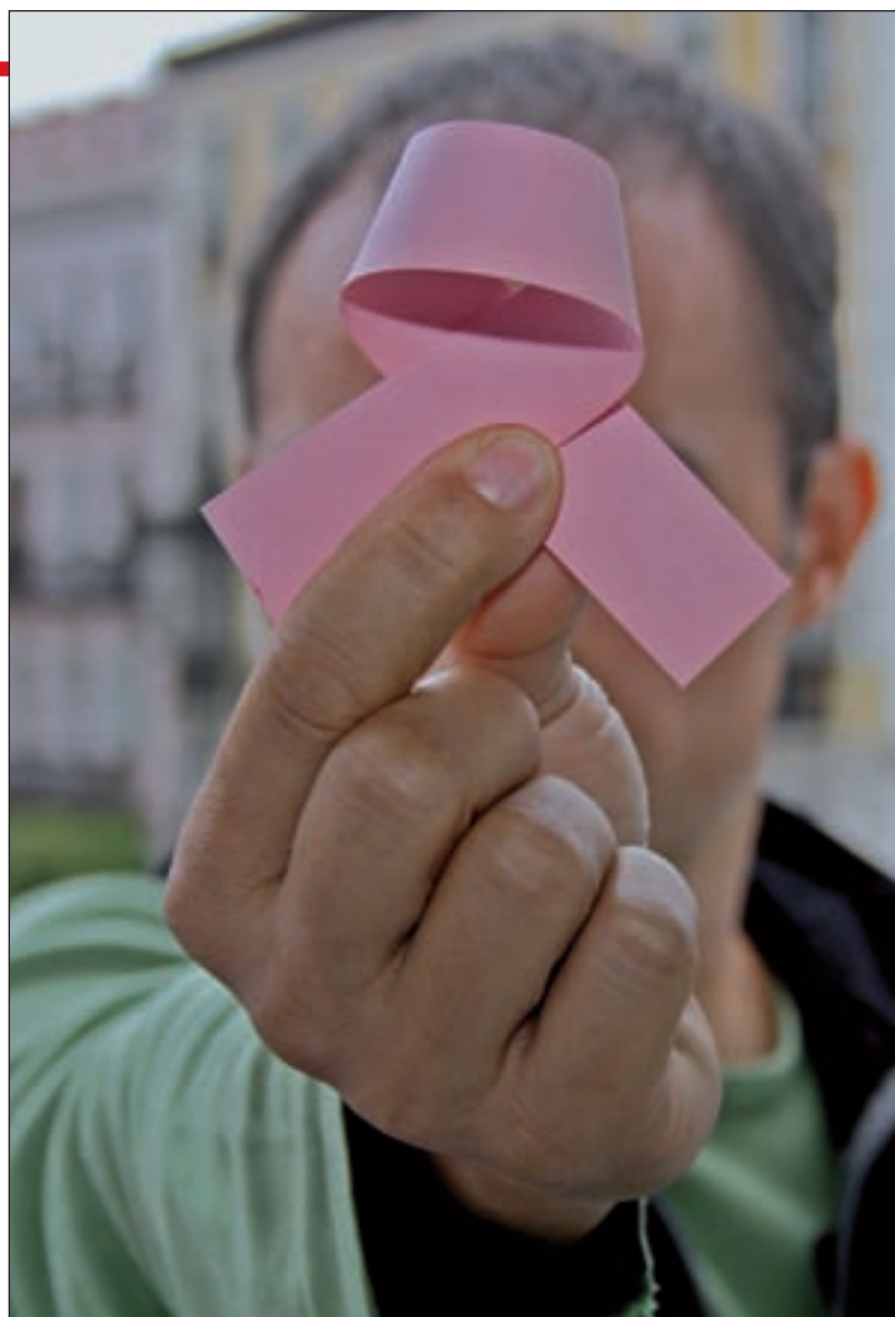
El lazo rosa simboliza la lucha contra el cáncer de mama

Asimismo, si se tiene en cuenta que "un número muy importante de mujeres con cáncer de mama lleva un tratamiento de hormonoterapia durante cinco o diez años", en el caso de los hombres, "por el nivel de estrógenos en su cuerpo, de las cuatro pastillas que existen de hormonoterapia sólo pueden recibir una", matiza Muñoz. En la gran mayoría de los casos, una mutación genética es el factor más importante en los hombres que tienen cáncer de