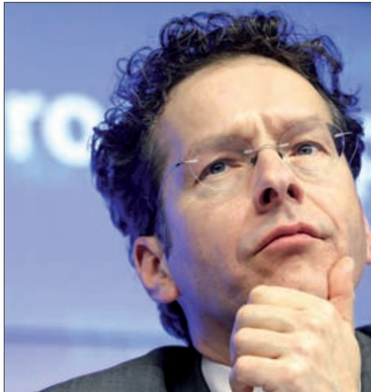
El presidente del Eurogrupo, Jeroen Dijsselbloem

Al ser preguntado por la posibilidad de que Bruselas rechace el presupuesto de Francia para 2015 por incumplir los compromisos de reducción del déficit, Jeroen Dijsselbloem admitió que "las cifras que están escuchando de Pa-