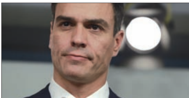
El líder socialista, Pedro Sánchez

El último informe sí incluye, por ejemplo, el aval para que tres de estos diputados (uno del PP y dos del PSOE) compaginen el escaño con abogacía.