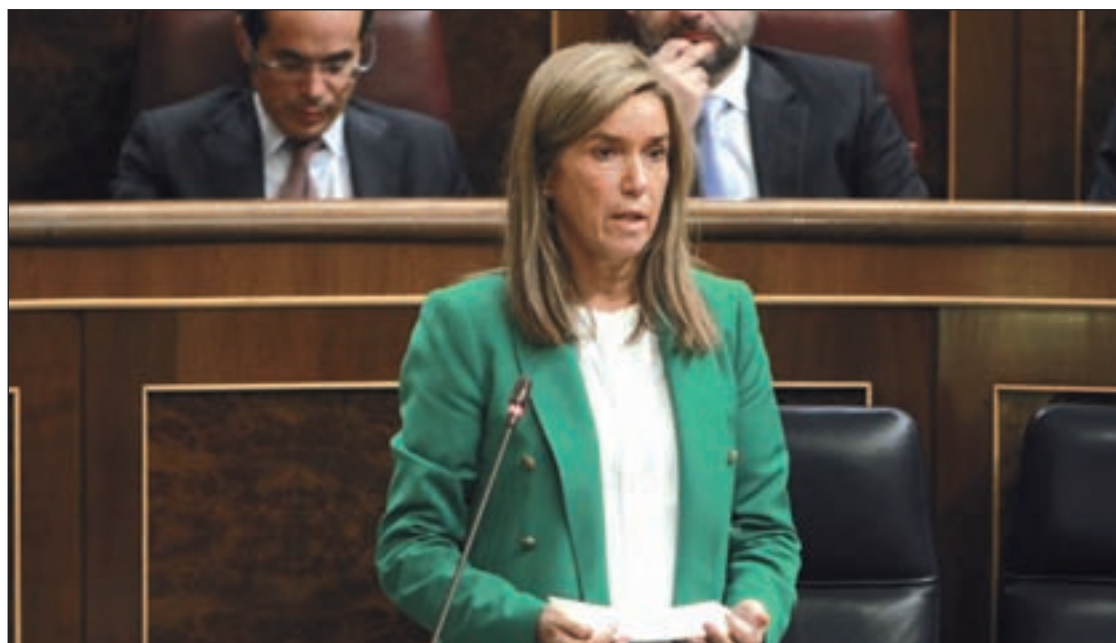
La ministra de Sanidad compareciendo en el Congreso

programa de alimentos sea utilizada como puente aéreo para la rotación de personal humanitario. En cuanto al riesgo de transmisión, aseguró comprender la preocupación existente en España, pero recordó que en África se han registrado 8.000 casos de ébola para una población de 22 millones de habitantes y con una “sistema sanitario deficitario”.