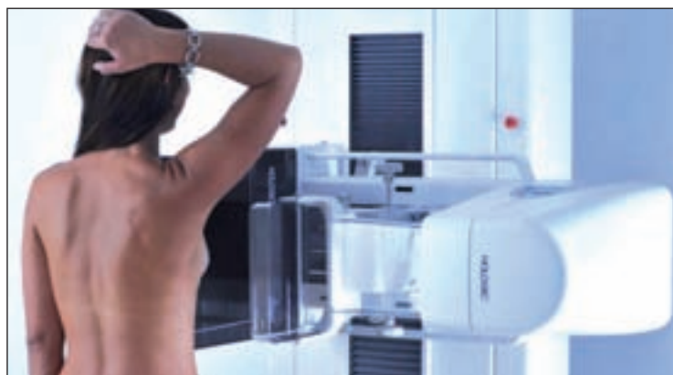
Una mujer durante una de las pruebas

El 19 de octubre se celebra el Día contra el Cáncer de Mama, cuyo símbolo es un lazo rosa en representación de las mujeres que lo padecen y de ese 1% de hombres.