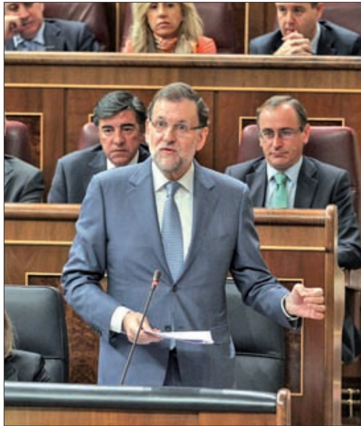
Rajoy se refirió a las tarjetas de Caja Madrid en el Congreso

Según ha informado el PSOE, los seis restantes, hasta un total de 16 personas vinculadas al PSOE, ya habían pedido su baja de forma voluntaria tras conocer-