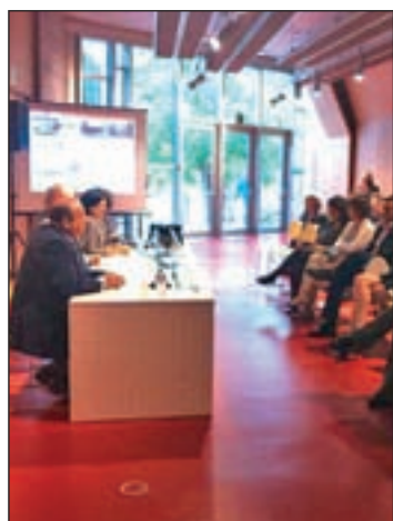
Un momento de la presentación