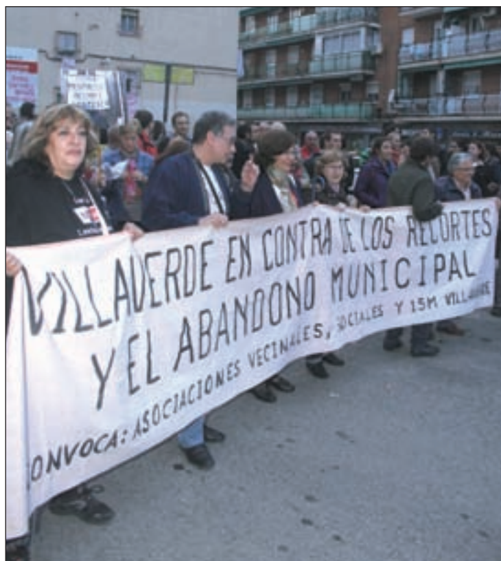
Un momento de la protesta por las calles de Villaverde Alto

El representante ciudadano adelantaba que ésta puede ser la primera de más protestas. "Estamos a expensas de lo que se pueda decir en esa reunión, pero la situación cada vez es peor, por el deterioro físico y social de la colonia", advierte. La reivindicación de La Experimental vivió un nuevo episodio