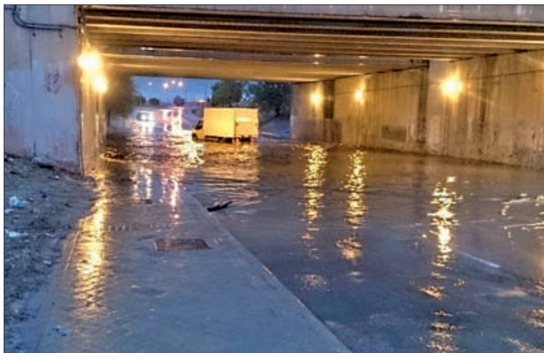
Una de las zonas inundadas, a la altura del túnel de la M-40 AVIB

“La reforma de la avenida fue una enorme chapuza y el Ayuntamiento nunca debió recepcionar la calle en esas condiciones. Ahora es el responsable de lo que está ocurriendo y por eso volveremos