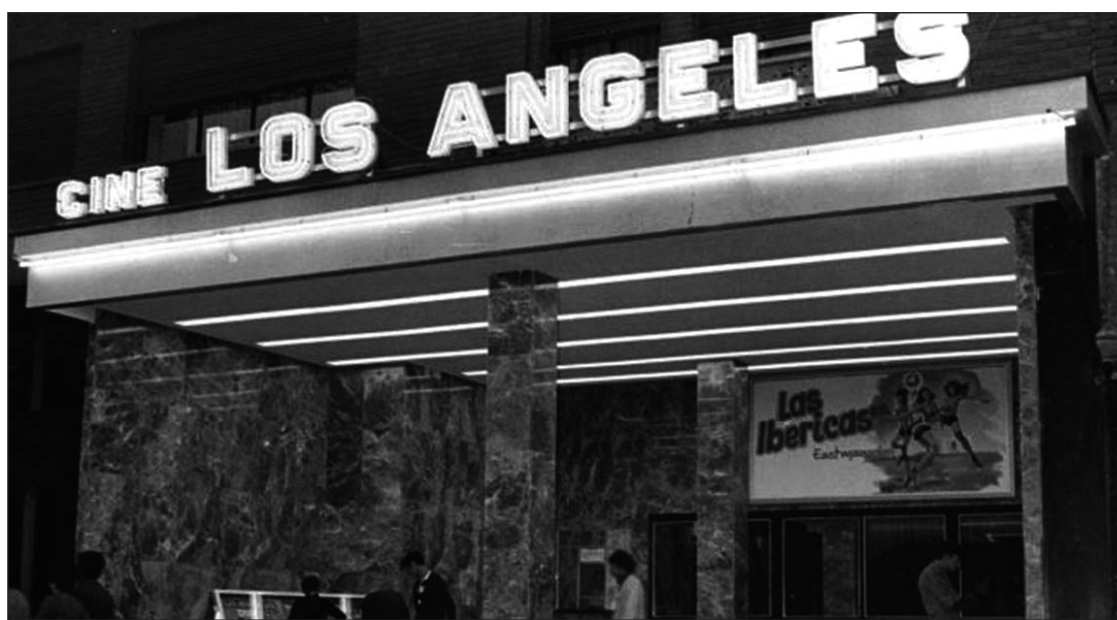
El desaparecido Cine Los Ángeles estaba situado en la calle de General Ricardos, en Carabanchel