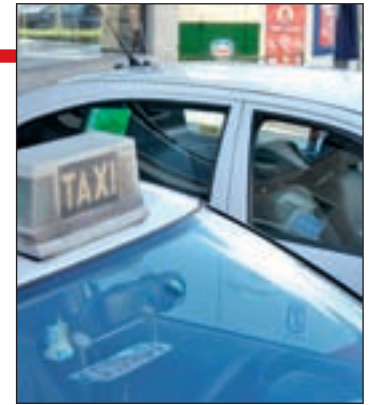
Entraría en vigor en 2015 GENTE

que la tarifa 3, que incluye una cuantía mínima de salida de Barajas, quedaría en 20 euros, una cantidad que se incrementará si el servicio se realiza en horario nocturno.