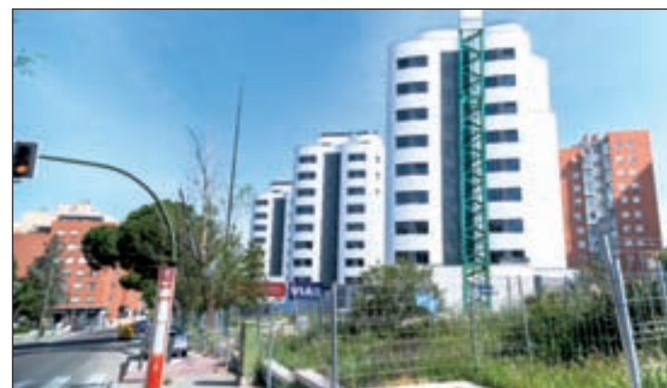
Una de las promociones de vivienda pública del Ivima

Pero lo más preocupante a su juicio es la okupación de las viviendas vacías. “En algunos casos,