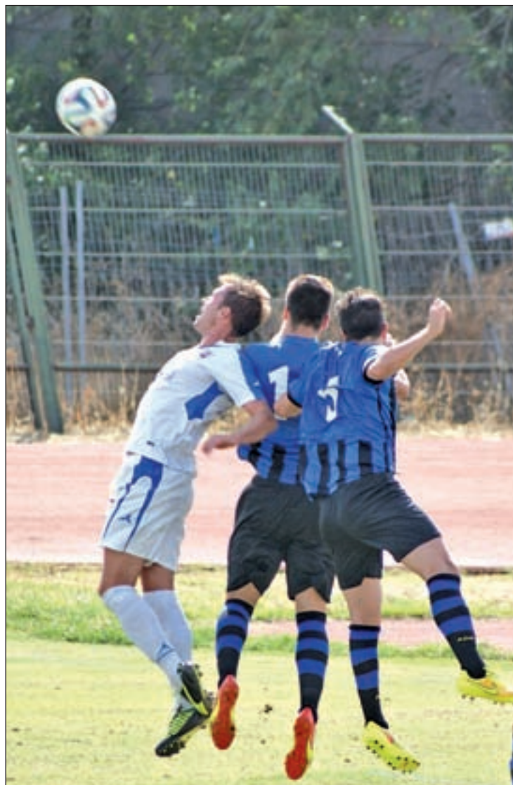
El Puerta Bonita visitará al Alcalá