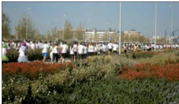
Participantes de la pasada edición de la Holi Run en Madrid

Para competir o para pasárselo bien, con fines solidarios o buscando la mera diversión. El completo calendario de carreras que atañe a la capital de España ofrece este domingo dos pruebas muy diferentes entre sí. Por un lado, la Carrera en Marcha contra el Cáncer se presenta ante los aficionados con el objetivo de "promover la mayor participación ciudadana en un evento solidario, uniendo a voluntarios, socios, pacientes, familiares, entidades, instituciones y a toda la sociedad civil,