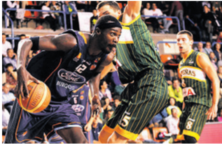
El equipo azulón mostró una mejoría en El Plantío.

Coruña llega al encuentro con fuerza pese a la derrota frente al CB Valladolid en la pasada jornada.