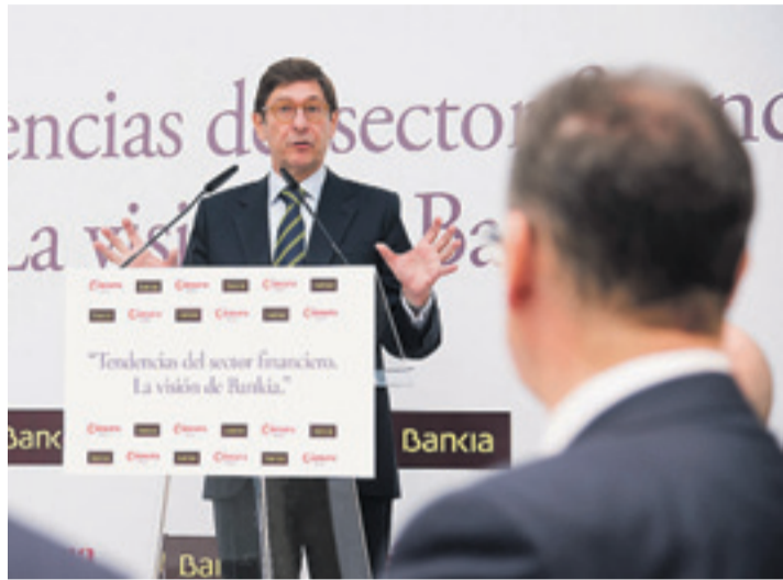
El presidente de Bankia, durante la conferencia que impartió en Burgos.

Consideró "positiva" la agenda reformista acometida por España, que evitó el rescate en el año 2012 y "supuso un cambio de rumbo muy importante para la economía". Por ello, indicó que "en los últimos 12 meses hemos tenido noticias muy positivas e incluso sorprendentes", como crecimientos del PIB por encima del 1% y con previsiones por encima del 2% para el próximo año. "La clara mejora de la economía española y de las perspectivas económicas no ha tocado en ninguna tómbola; es producto y consecuencia del esfuerzo de todos los agentes económicos y de los ciudadanos españoles".