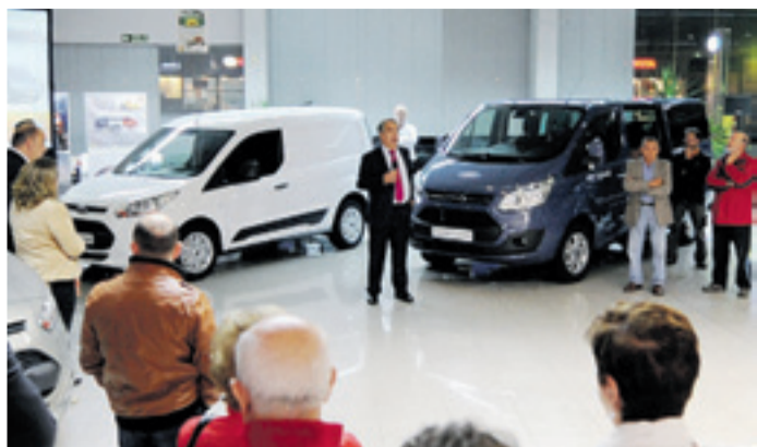
Del 17 al 25, Autocid ofrece la posibilidad de probar los nuevos modelos.