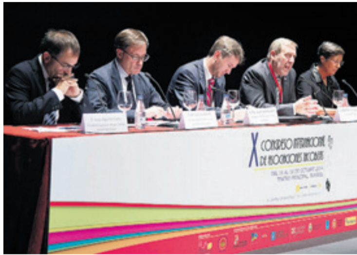
Asociaciones jacobeanas de todo el mundo participan en el congreso.

En este sentido, el responsable de Patrimonio de la Junta valoró que, en un momento de inversio-