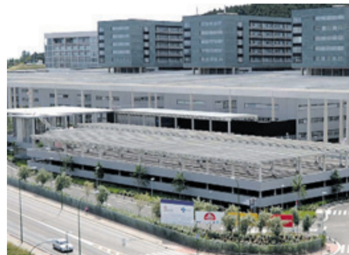
El pago del HUBU contempla un canon de 69 millones para 2015.

En cuanto a las partidas “olvidadas” dentro del montante total, Blanco indicó que el Parque Tecnológico es el principal damnificado porque “a diferencia de lo que dijo Tomás Villanueva, no existe partida alguna”. Los procuradores socialistas también echan en falta ayudas para el Plan de Empleo alternativo a la central nuclear de Santa María de Garoña, así como cuantías que fomen-