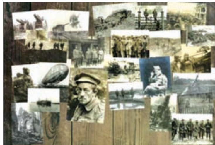
Parte de la muestra