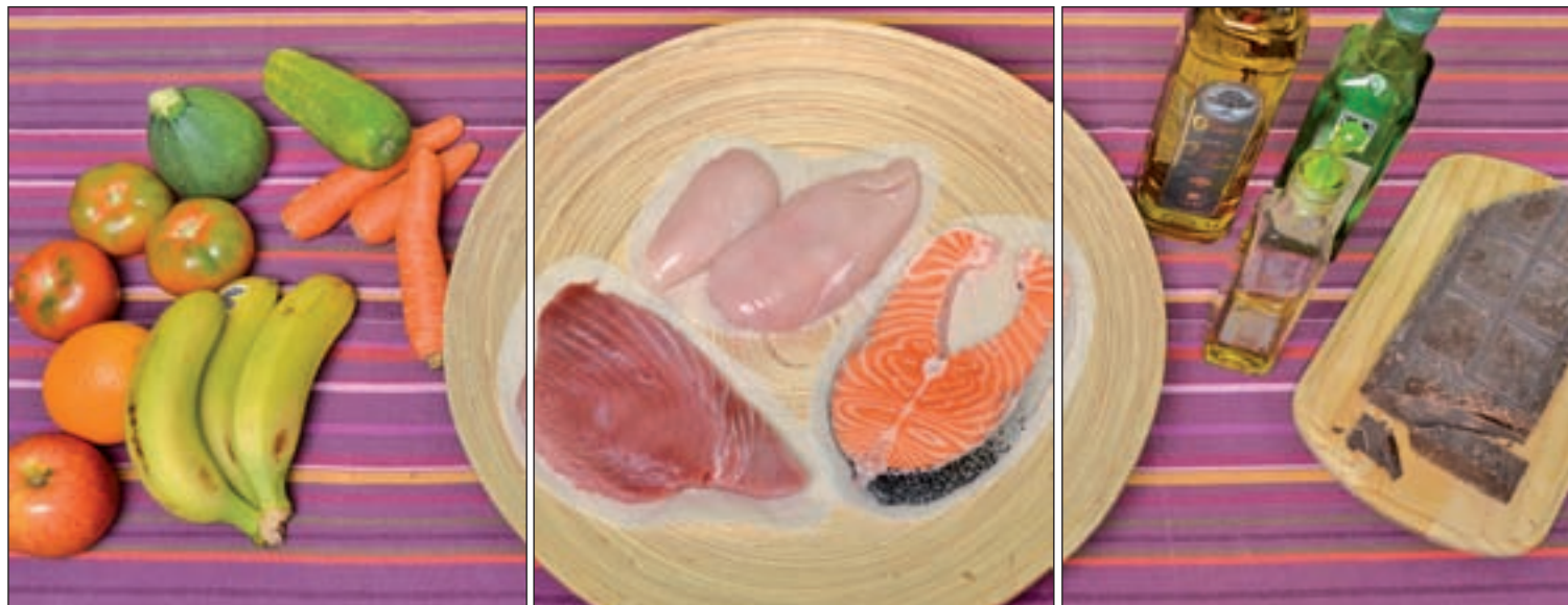
Los tres grupos de alimentos en los que hay que dividir el plato