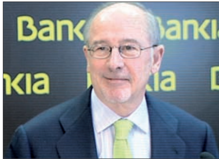
Rodrigo Rato tendrá que explicarse ante su partido

Según ha informado el PSOE, los seis restantes, hasta un total de 16 personas vinculadas al partido, ya habían pedido su baja de forma voluntaria tras conocerse su relación con los hechos investigados.