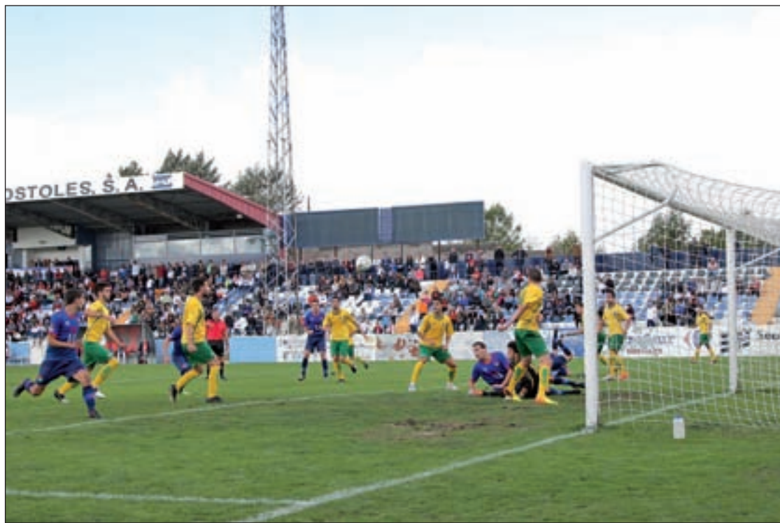
Jugada de estrategia en el partido Móstoles-Parla

El CD Móstoles llegará a la ciudad deportiva blanca con la intención de resarcirse del empate sin goles que cosechó el pasado fin de semana en El Soto frente al Parla, uno de los rivales con los que está luchando por hacerse un hueco