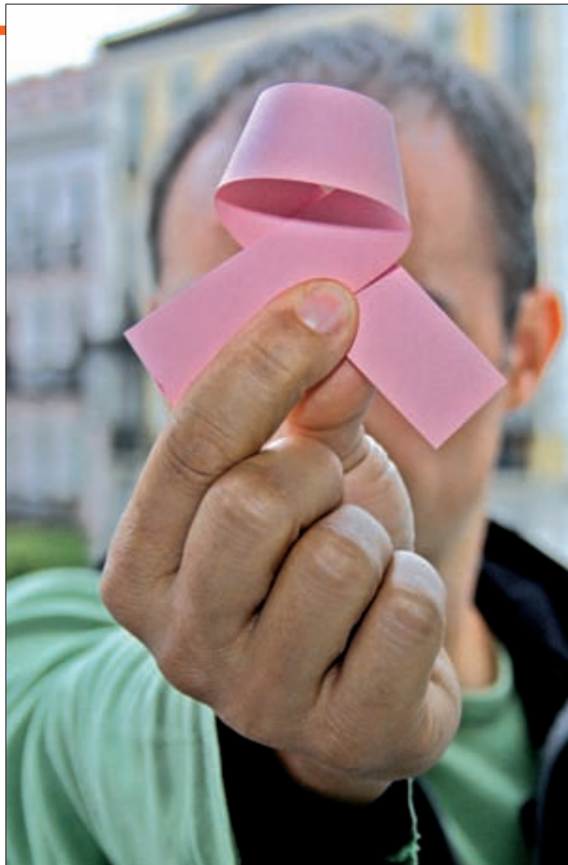
El lazo rosa simboliza la lucha contra el cáncer de mama

El 19 de octubre se celebra el Día contra el Cáncer de Mama, cuyo símbolo es un lazo rosa en representación de las mujeres que lo padecen y de ese 1% de hombres.