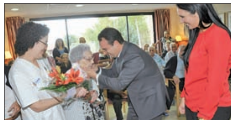
El alcalde entrega el diploma a una de las homenajeadas