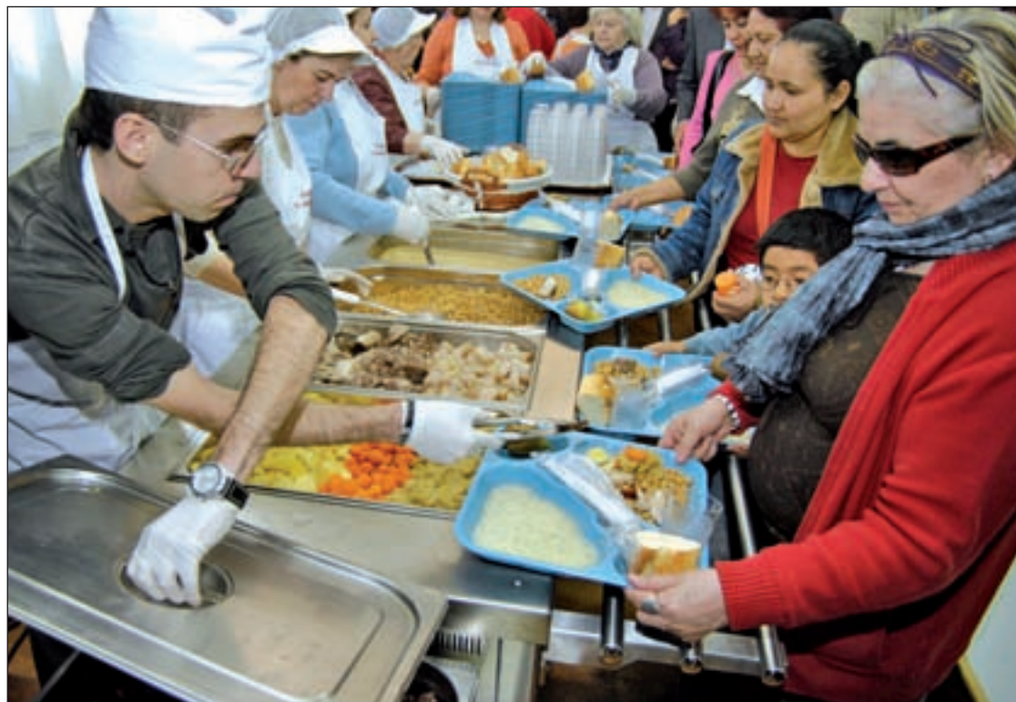
Un comedor social de la zona Sur de la Comunidad de Madrid GENTE

En 2013, las parroquias de la Diócesis invirtieron 625.707 euros en ayudas sociales, un 23,3% más que en 2012, según los datos de la Oficina de Economía del Obispado de Getafe. Los fondos empleados por Cáritas Diocesana de Ge-