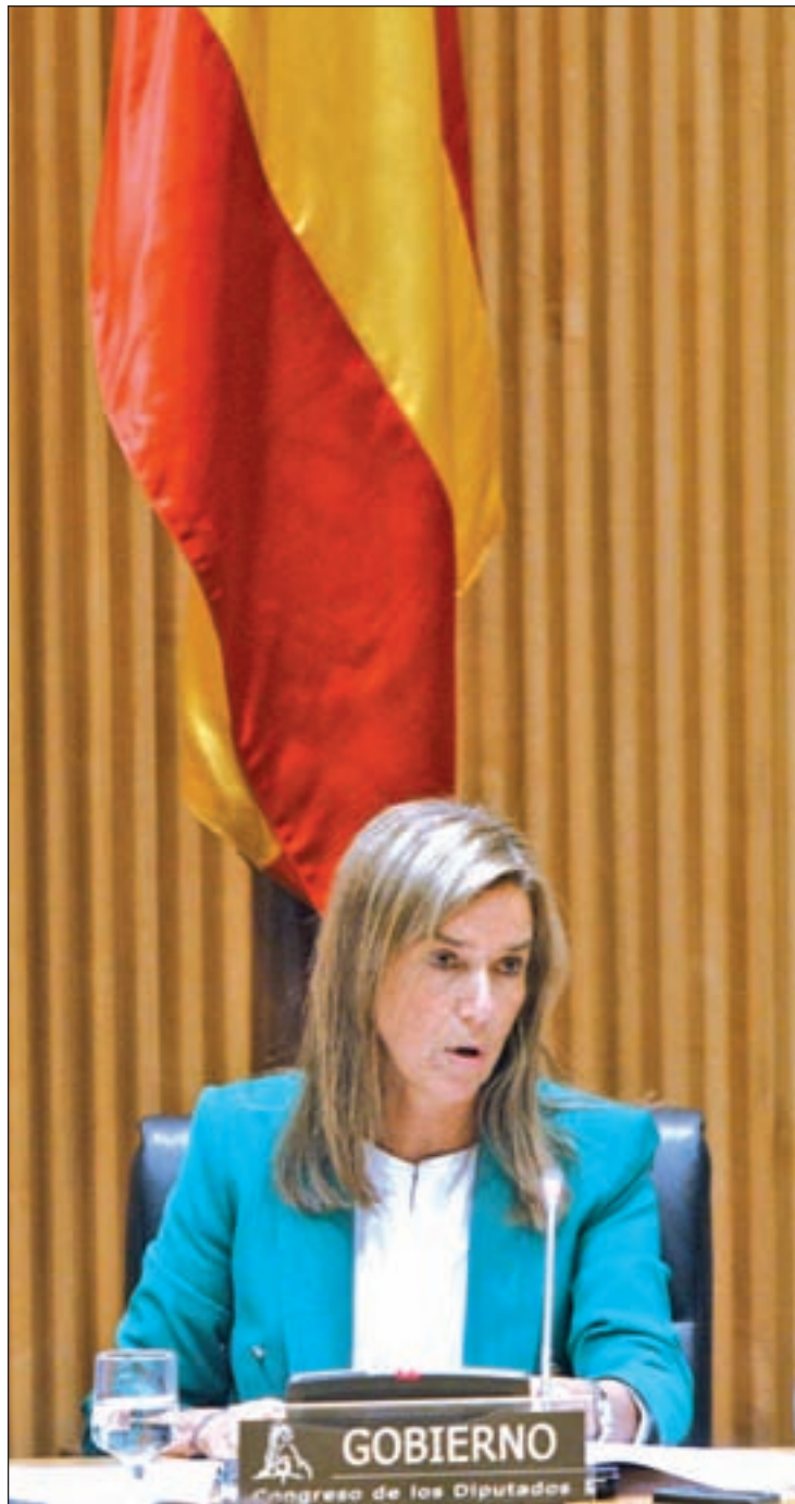
LA MINISTRA DE SANIDAD Ana Mato aseguró en el Congreso que, en el momento en el que termine la investigación, los resultados "serán públicos" y permitirán "tomar medidas" para evitar situaciones similares.

Asimismo, durante su intervención en la Comisión de Sanidad en el Congreso el pasado miércoles, Mato reconoció, por primera vez, que, en la gestión de la crisis del ébola, "probablemente, no hemos hecho todo bien y hay muchas cosas que mejorar", ya que este suceso "no tenía por qué haberse producido", por lo que es preciso "analizar las causas y atajar la situación". Al mis-