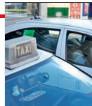
Entraría en vigor en 2015 GENTE

que la tarifa 3, que incluye una cuantía mínima de salida de Barajas, quedaría en 20 euros, una cantidad que se incrementará si el servicio se realiza en horario nocturno.