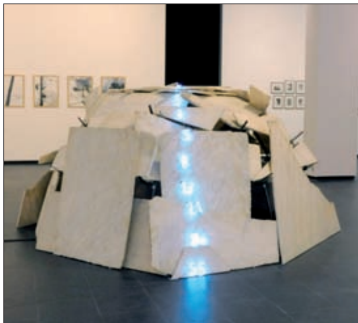
Una de las obras de la colección de la Fundación Arco

“En 2008 parecía impensable que la ciudad pudiera tener turismo cultural, pero ya es una realidad que sitúa a Móstoles en la vanguardia artística y en foco de