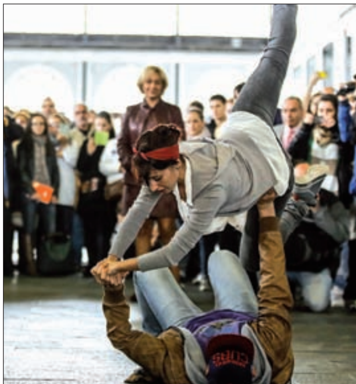
Un momento de la presentación en el Museo del Ferrocarril

Del 6 al 30 de noviembre, los escenarios madrileños se llenarán de danza con 23 espectáculos entre los que se encuentran nueve estrenos mundiales, uno europeo y cuatro nacionales. En el cartel destaca el montaje de danza teatro 'Ruhr-Ort', la obra más representativa de la coreógrafa alemana Susanne Linke que llega a España de la mano de la com-