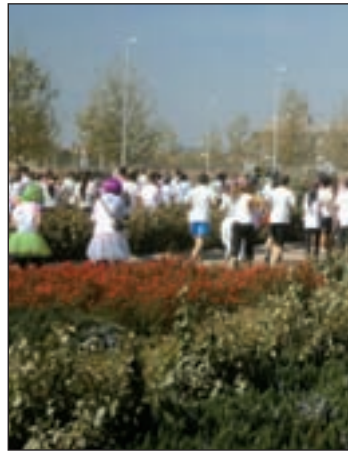
Participantes de la I edición

Para competir o para pasárselo bien, con fines solidarios o buscando la mera diversión. El completo calendario de carreras que atañe a la capital de España ofrece este domingo dos pruebas muy diferentes entre sí. Por un lado, la Carrera en Marcha contra el Cáncer se presenta ante los aficionados con el objetivo de "promover la mayor participación ciudadana en un evento solidario, uniendo a voluntarios, socios, pacientes, familiares, entidades, instituciones y a toda la sociedad civil, con un reto común: la lucha contra el cáncer, el mayor problema socio-sanitario de Madrid", según describió durante el acto de presentación el presidente de Junta