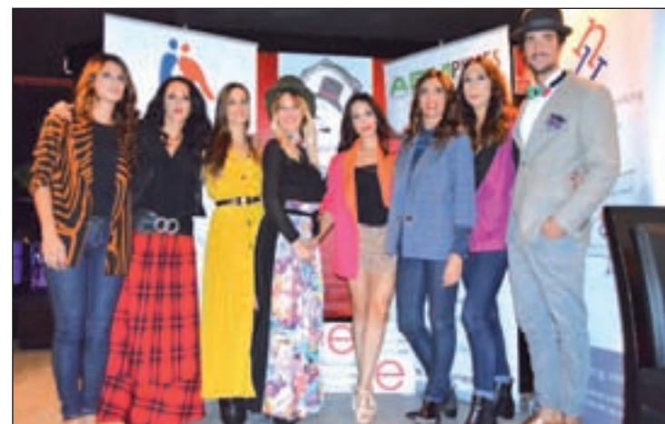
Participantes en el desfile de La Bohemia