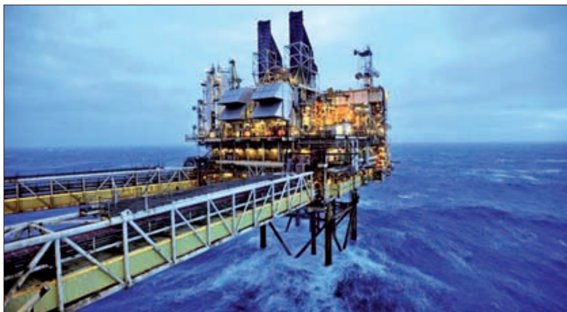
Imagen de una plataforma petrolífera

El ejecutivo nigeriano negoció en secreto durante semanas con la delegación de Boko Haram para lograr una tregua que contó con la colaboración del presidente de Chad, Idriss Déby.