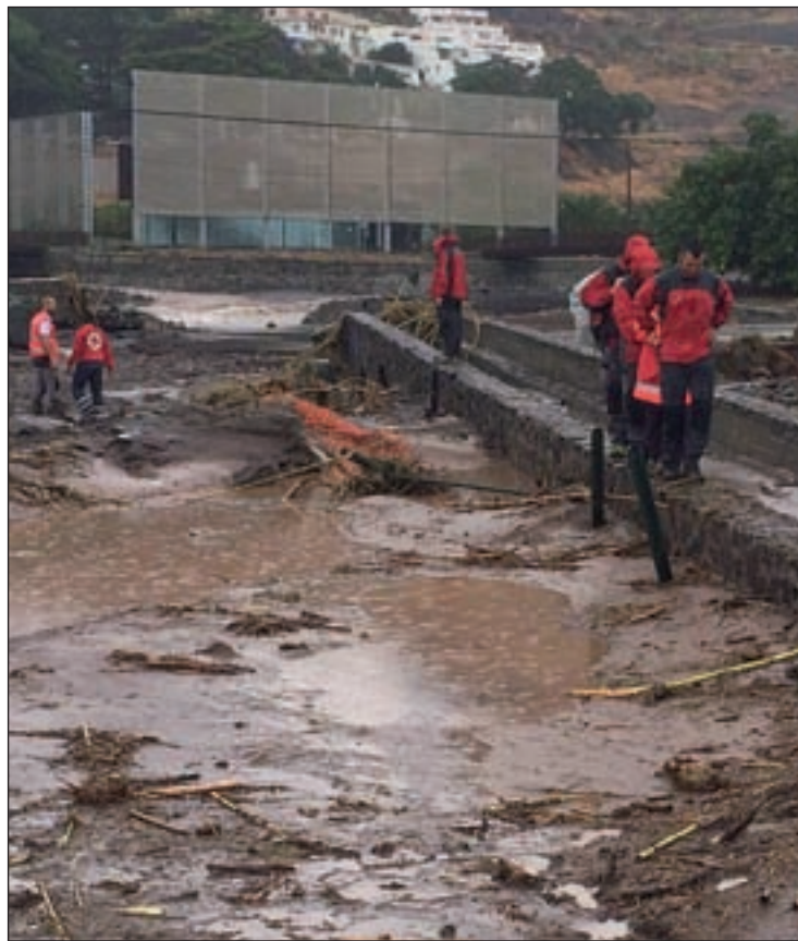
Terrenos embarrados tras el temporal

Respecto al tipo de incidencias, hay que destacar que los principales daños se centraron en inundaciones de viviendas particulares, rotura de vías, vehículos atrapados en zonas anegadas, desprendimientos sobre las carreteras, caída de muros y desplazamiento de contenedores. Para solventarlos se movilizaron más de 40 voluntarios de Protección Civil