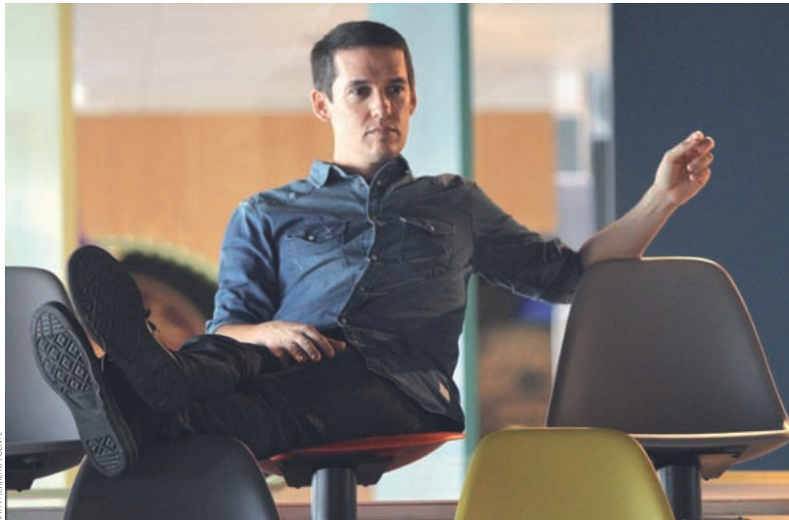
RAFA HERRERO / GENTE