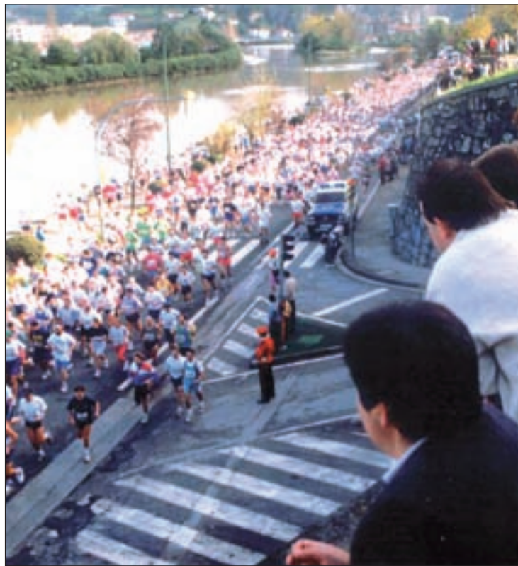
Imagen de la edición disputada en 1994