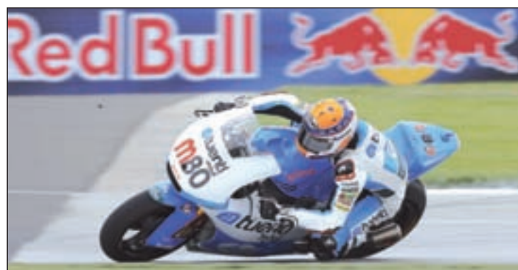
Rabat lidera la clasificación de Moto2

land, pero acabó subiendo al podio para encarrilar aún más el campeonato. En estos momentos, su renta respecto a su inmediato perseguidor, Mika Kallio, es de 31 puntos, por lo que en el caso de quedar por delante del piloto finés en la prueba de este domingo en Malasia, se coronaría como