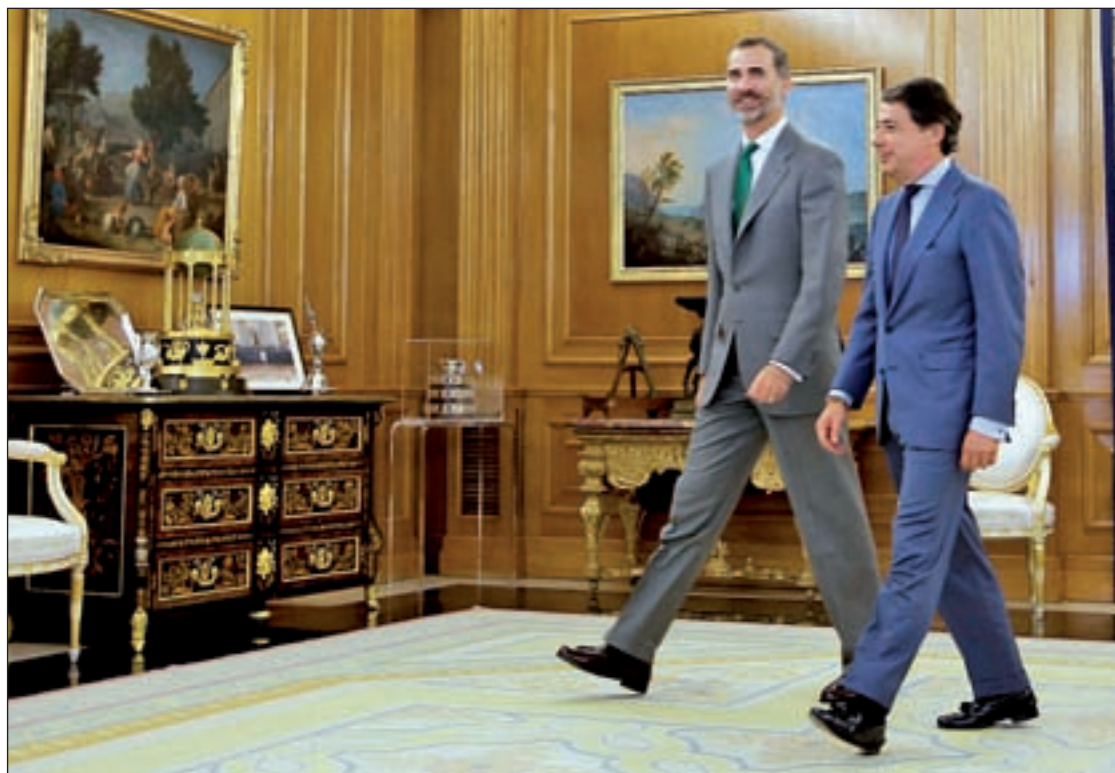
Felipe VI e Ignacio González, en el Palacio de la Zarzuela

González dio a conocer que repasaron "algunas cuestiones de política general", como es el caso de Cataluña, pero, sobre todo, de la "situación social en general". Preguntado por si el Rey está