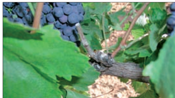
Brote de vid

tanto, para España se abren esperanzadoras expectativas en la comercialización del mercado europeo que “debemos abastecer de forma regular y constante”, afirman desde Cooperativas Agro-Alimentarias, a lo que añaden que “no debemos caer en antiguos y no muy lejanos errores, y afrontar el mercado con responsabilidad”.