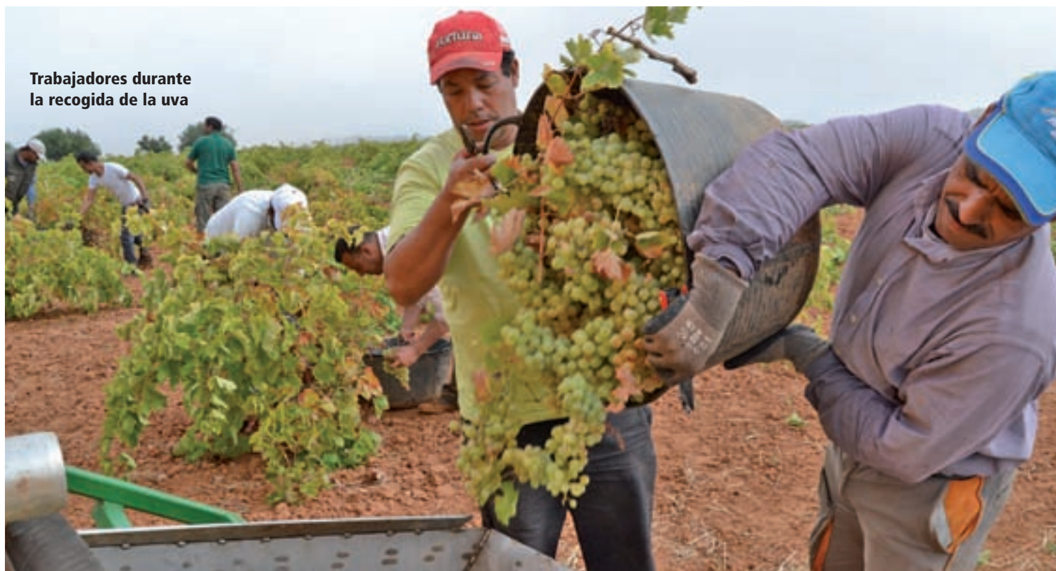
Trabajadores durante la recogida de la uva