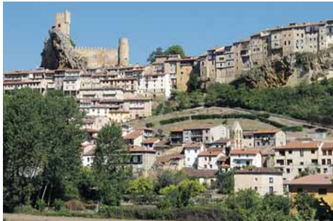
La geografía burgalesa cuenta con grandes atractivos turísticos; uno de ellos es Frías y su castillo.