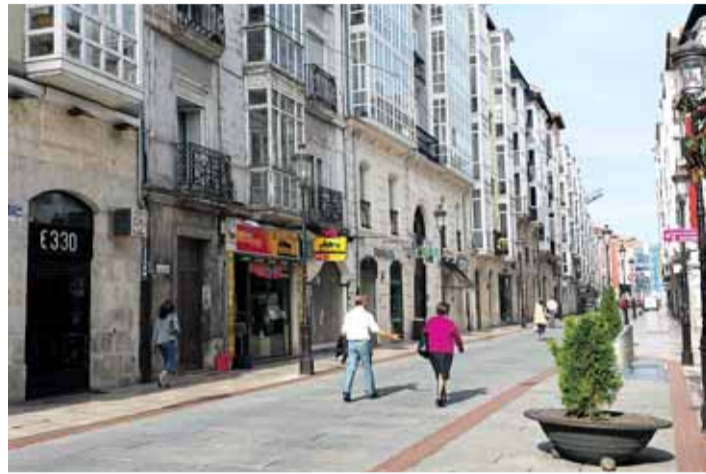
Lain Calvo, una de las calles más comerciales del Centro Histórico.

Para llevar a cabo estas iniciativas, Centro Burgos y el Ayuntamiento firmarán un convenio de colaboración mediante el cual