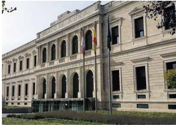
La sede del TSJCyL se quedará en Burgos.

ta por Burgos Ander Gil ha atribuido el respaldo a su moción "a una sociedad burgalesa que ha sido absolutamente combativa con unos cambios que sólo traían problemas y a la perseverancia del PSOE, que ha trasladado iniciativas a todas las instituciones para que no se materializara la propuesta del anterior ministro de Justicia, Alberto Ruiz-Gallardón".