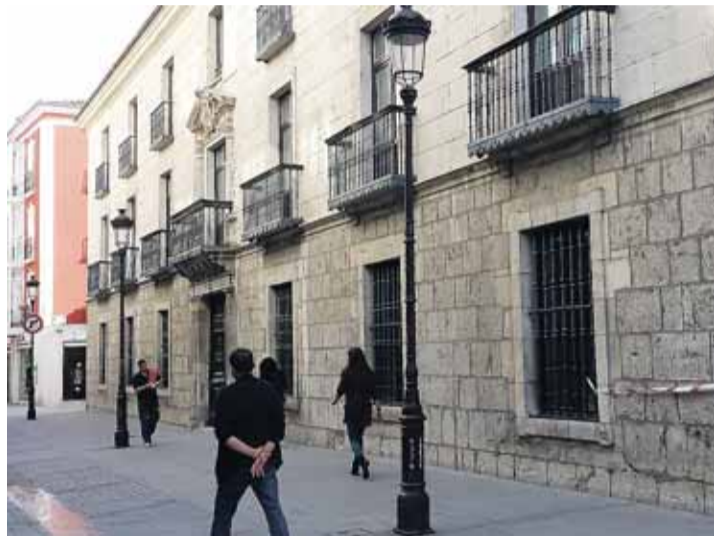
Edificio de la c/ San Juan en el que se ubica el 7º centro cívico.

La cifra de trabajadores municipales que se ubicarán en las dependencias de la calle San Juan asciende a 42 si bien habrá