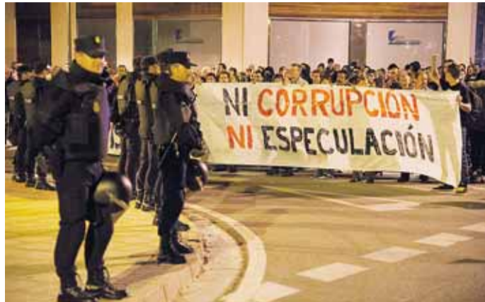
La manifestación del día 23 se encontró un fuerte dispositivo policial frente a la sede de Promecal.

Un grupo de representantes de la asamblea vecinal se reunió el martes 21, con el alcalde de Burgos para poder llegar a un acuerdo. El Ayuntamiento mantiene su posición de continuar