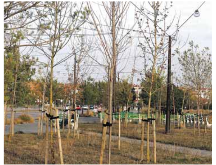
Aspecto que presentan algunos árboles del bulevar.

Las críticas se acentúan en relación con el bulevar ferroviario. "Su estado es lamentable, penoso, es una vergüenza, se encuentra en una situación de abandono y descuido intolerable", indicó Mahamud, quien puso sobre la mesa algunos datos: "Un 30% de los árboles que se plantaron está seco; otro 30% está ra-