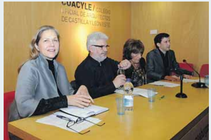
Los expertos se dieron cita en el Colegio de Arquitectos.