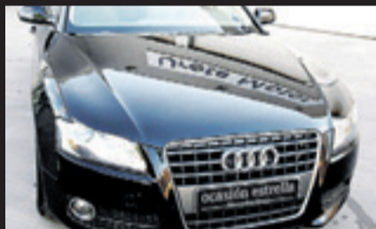
AUDI A 5 2.0 TDI SPORTBACK Año 2010. Cambio automático. Climatizador. Control de velocidad.