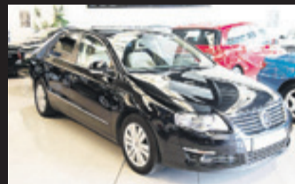
VOLKSWAGEN PASSAT 2.0 TDI 140 cv. Año 2009. 10 airbags ans. ESP. BASS. Climatizador bizona. Control de velocidad.