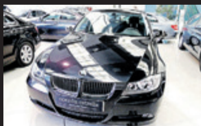
BMW 318 D Año 2008. 10 airbags. ABS. ESP. Volante multifuncional. Navegador. Climatizador. Ordenador de abordo.