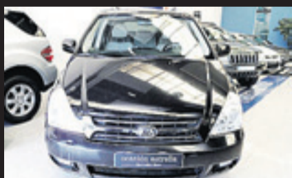
KIA CARNIVAL 2.9 CDI AUTOMÁTICA Año 2009. 10 airbags. Navegador. DVD. Puertas eléctricas. Cristales tintados. Libro de revisiones. Climatizador bizona.