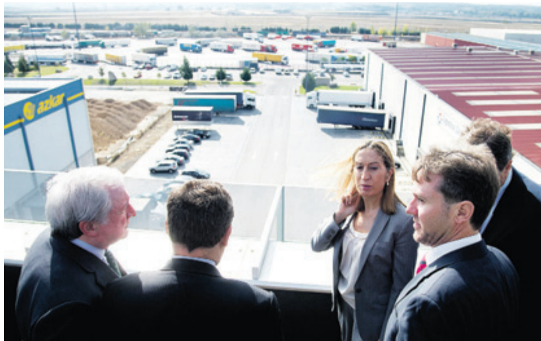
La ministra tuvo tiempo para conocer las instalaciones que serán ampliadas.

Poco antes de la intervención de la ministra, el alcalde de Burgos pedía a la ministra Pastor que tuviera en cuenta la necesidad financiera del proyecto y que hiciera todo lo posible para poder incluir al Puerto Seco de la ciudad entre las