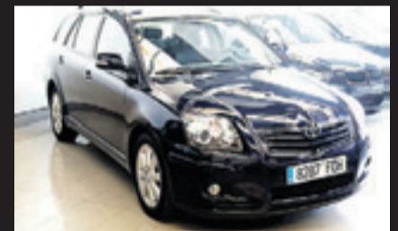
TOYOTA AVENTIS WAGON 2.0 D4D Año 2006. 10 airbags. ABS. Climatizador bizona. RadioCD. Control de velocidad de cruceo.