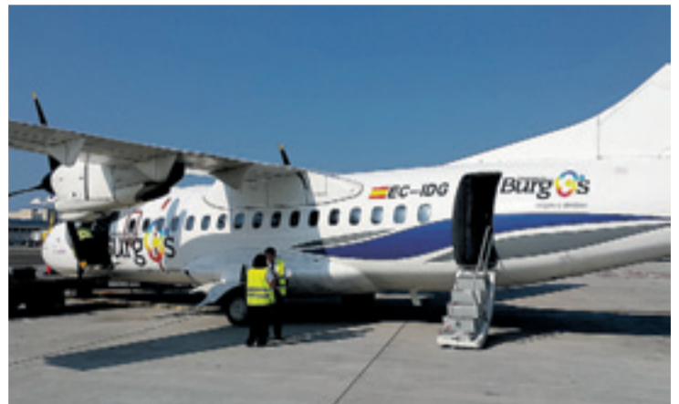
Avión recién aterrizado en la base de Villafraía el pasado verano.

Después de que el Ministerio de Fomento diese luz verde al aeropuerto para que puedan despegar y aterrizar aviones de pasajeros y mercancías procedentes de todo el mundo y no solo del espacio Schengen de la Unión Europea, Lacalle entiende que se abre un nuevo camino. Por ello, y sin concretar las fechas, indicó que "se trabaja" en la opción de que "antes o después de Navidad" exista la posibilidad de que haya una oferta de vuelos a Londres y el norte de África. "Destinos como Marruecos o Túnez", precisó el primer edil, consciente de que esta decisión marca un antes y un después en la vida del Consorcio.