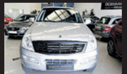
SSANGYON REXTON 2.7 CRDI Año 2005. 6 airbags. ABS. ESP. BASS. Climatizador. Cambio automático. Tapicería de cuero. Sensor de luz.