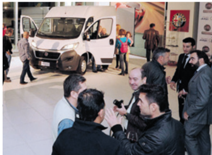
I Jornada de presentación del nuevo Fiat Ducato en Sport Móvil Julián.

Fruto del desarrollo de tres líneas directrices -robustez/fiabilidad, eficiencia/bajos costes de funcionamiento y nuevos con-