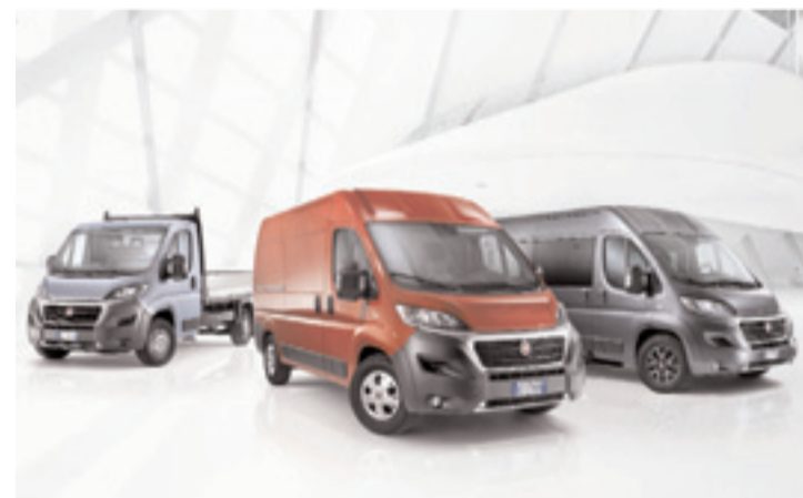
Nuevo Fiat Ducato, el mejor compañero de viaje y trabajo.

tenidos de alta tecnología- el nuevo Ducato presenta un diseño de vanguardia unido al concepto de un auténtico vehículo comercial ligero.