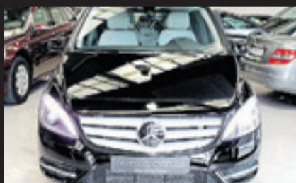
MERCEDES-BENZ CLASE B 180 CDI Año 2013. 11 airbags. ABS. ESP. Bass. Climatizador. Cámara de marcha atrás. Faros de xenon.