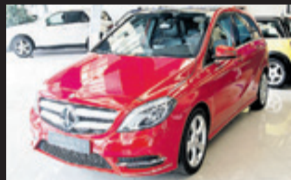
MERCEDES-BENZ CLASE B 200 CDI Automatico. Año 2013. 11 airbags. Paquete deportivo. Cambio automático 7G. Techo panorámico de cristal. 24 meses de garantía.