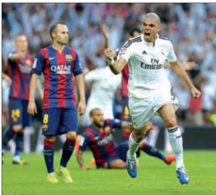
Sevilla y Real Madrid comprimieron la semana pasada la parte alta de la clasificación