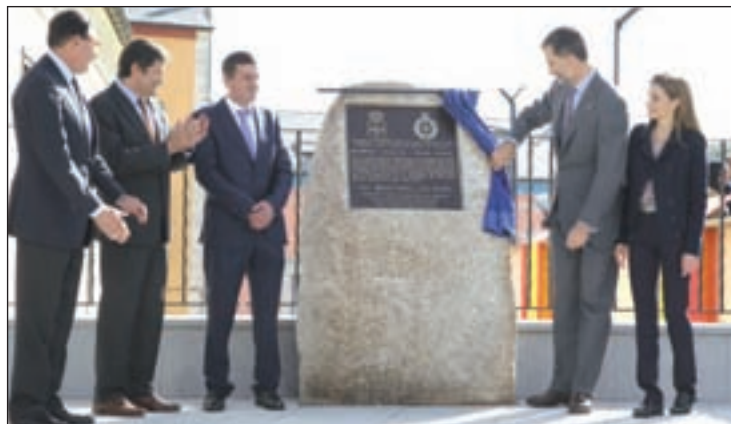
Los Reyes, en su visita a Boal el día después de la ceremonia

Esta edición de los premios ha sido la última en la que se entregaron bajo su actual denominación Premios Príncipe de Asturias, ya que para el próximo año, estos llevarán el nombre Premios Princesa de Asturias, para acomodarse a la actual heredera de la Corona de España, Leonor de Borbón y Ortiz.