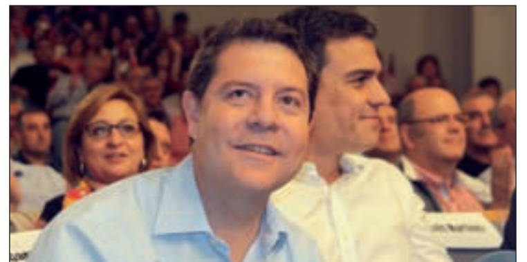
Page y Sánchez, durante el acto de partido

Por su parte, Page afirmó que si gana las elecciones creará un Consejo de Gobierno para recibir a las plataformas ciudadanas.