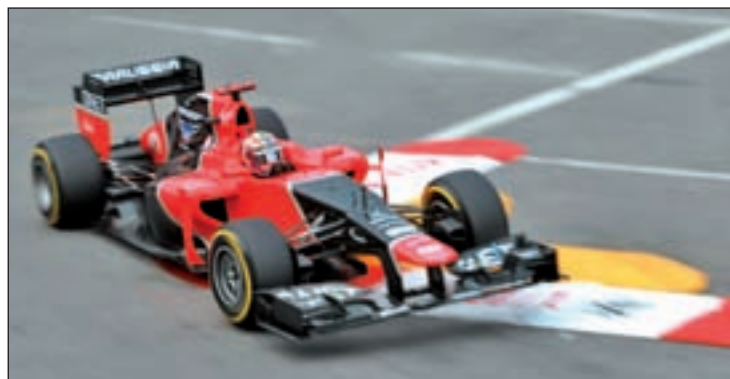
Los problemas económicos acechan a Marussia

ta en más focos que la propia carrera. Mientras Fernando Alonso sigue sin desvelar cuál será el equipo en el que compita el año que viene, la escudería Marussia ha protagonizado la noticia negativa de la semana, al entrar en concurso de acreedores y causar baja para la carrera que se cele-