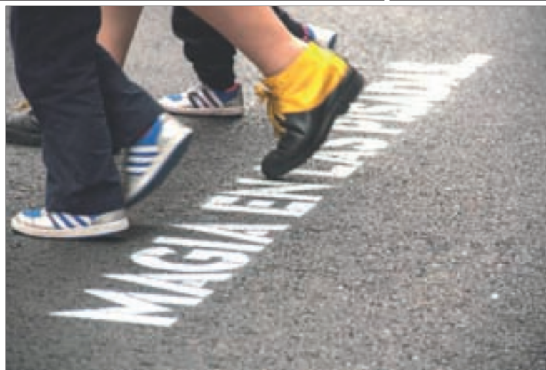
BOA MISTURA Y RAFA HERRERO/GENTE