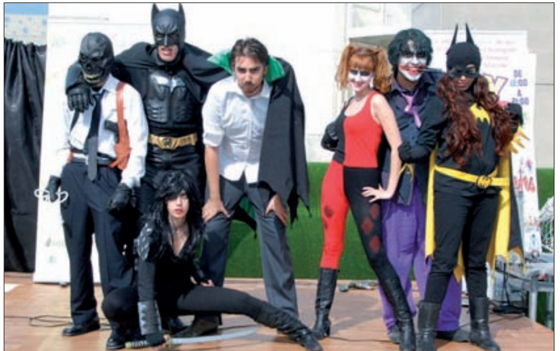
Un grupo de visitantes disfrazados de súper héroes en la edición pasada

Asimismo y entrando en el terreno literario, se podrá participar en juegos de acción como el 'Quidditch', de Harry Potter; o echar