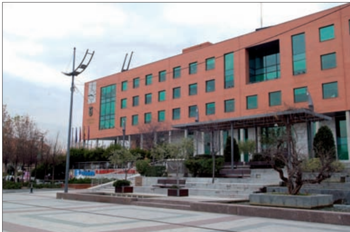
El Ayuntamiento de Alcobendas