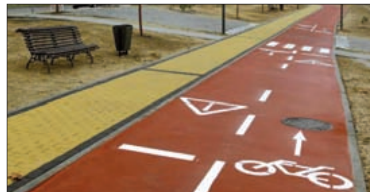
Carril bici de San Sebastián de los Reyes

recogería foto del vehículo, nombre y datos del propietario, edad del mismo, número de bastidor de la bicicleta e incluso la factura de compra, con el fin de que, en caso de robo, pueda presentarse ante el seguro ese documento necesario y conocer el parque móvil de la ciudad y sus usuarios.