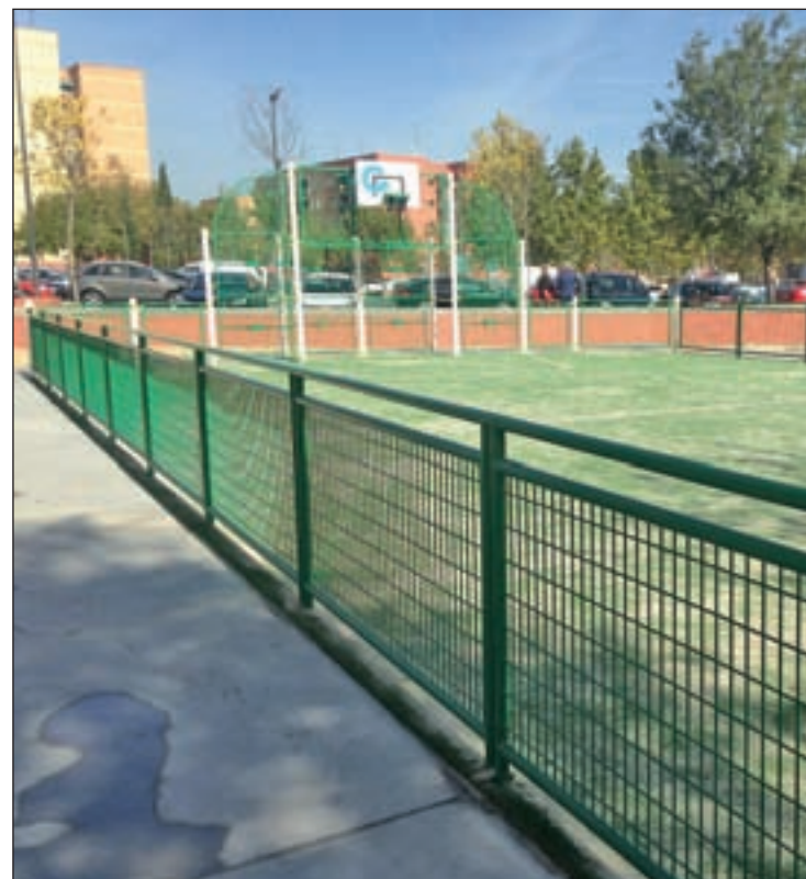
Nuevo aparcamiento y pista multideportiva en La Alhóndiga

La nueva infraestructura deportiva se une a la ya construida en la parcela J, en el Sector 3, y a la que actualmente se está ejecutando en la zona del 'skate park'. Además, ya hay otras dos instalaciones proyectadas en los barrios de Los Molinos y Buenavista, según comentaron fuentes municipales. Esta actuación, que responde a una demanda vecinal, se ha llevado a cabo en una superficie de 4.563 metros cuadrados, donde se incluyen dos plazas reservadas para minusválidos. La inversión