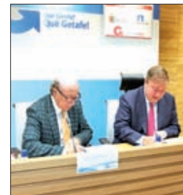
Firma del convenio

La primera lanzadera comenzará en noviembre y tendrá una duración de cinco meses. A su finalización, en la primavera de 2015, arrancará la segunda. El programa incluye sesiones individuales y grupales tres días a la semana. En ellas se trabajarán cuestiones relacionadas con la inteligencia emocional, la comunicación y la creatividad.