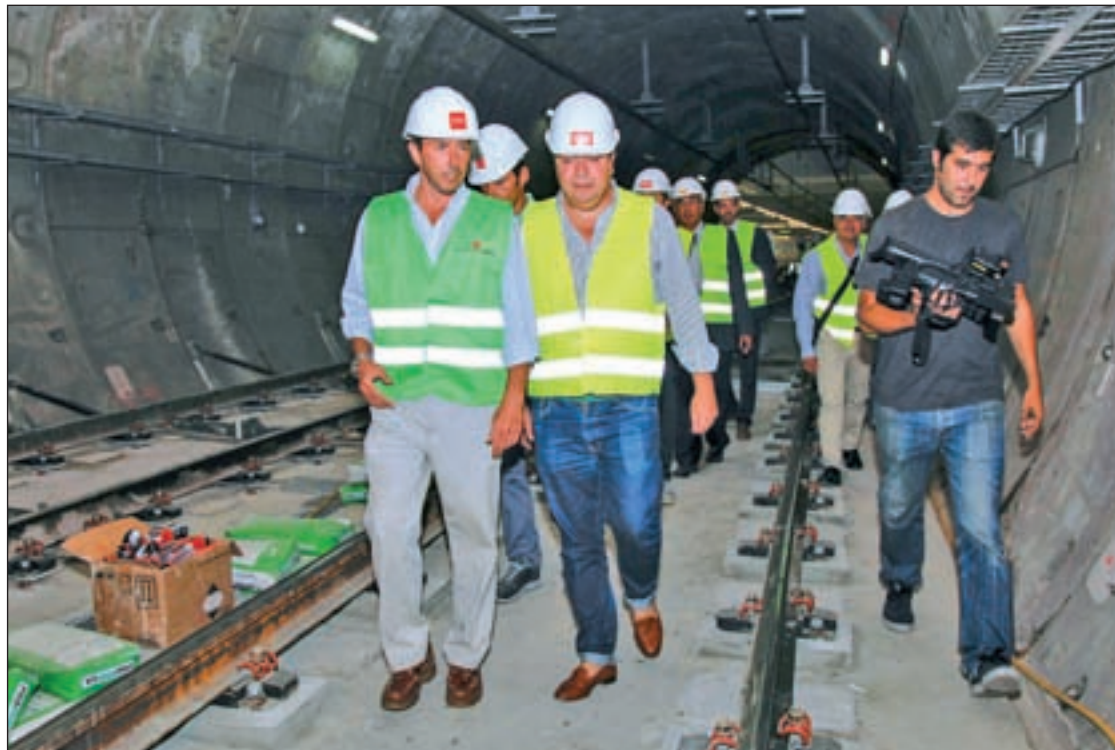
Estación de MetroSur de El Casar, en Getafe Norte

“El problema es que cuando se estrenó MetroSur ya hubo ruidos. En ese momento tuvimos unas negociaciones durante meses y, al final, se decidió bajar la velocidad en octubre de 2005, y hasta julio de 2014 de este año, los ruidos habían desaparecido. Ahora han hecho unas reformas, dicen que para mejoras, y han vuelto a subir la velocidad de los trenes con lo que nos encontramos con el mismo problema que antes”, comentó este vecino del Sector III, quien explicó que él en su vivienda no necesita despertador. “Sé que son las seis de la mañana porque me despierta el Metro. Y