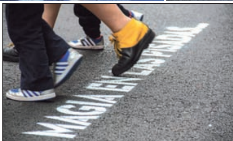
BOA MISTURA Y RAFA HERRERO/GENTE