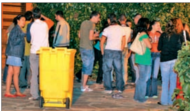
Personas haciendo botellón en la vía pública GENTE