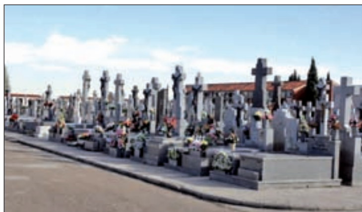
Cementerio de Getafe GENTE

La L-5 tiene paradas en su trayecto al cementerio en la avenida de España, y en las calles Gibraltar, Juan de la Cierva, San José de Calasanz, Ramón y Cajal, General Pingarrón, Leganés, Estudiantes,