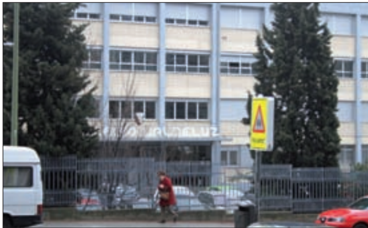
La fachada del colegio Valdeluz

Una de las exalumnas del profesor Andrés D. declaró que avisó en 2011 al exdirector de Valdeluz dado que había sufrido abusos por su parte en otro centro de Majadahonda. También el padre de una de las víctimas aseguró haber informado a la tutora de su hija, sin que el centro hiciera nada.