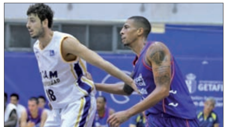
El Estudiantes jugará un derbi ante el Fuenlabrada

Con menos cartel que este Real Madrid-Valencia Basket, pero con bastante trascendencia. Así se presenta el derbi que jugará el Tuenti Móvil Estudiantes con el Montakit Fuenlabrada en la tarde del domingo (18:30 horas). En el