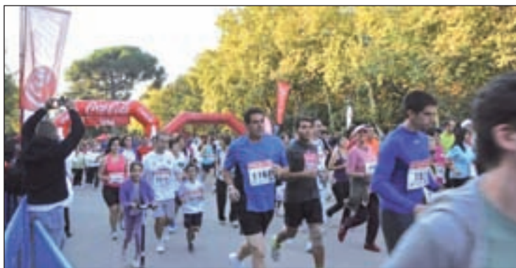
Edición anterior de la carrera