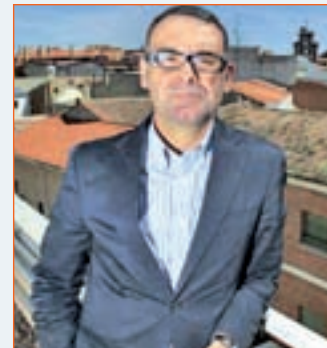
JOSÉ MARÍA FRAILE ALCALDE DE PARLA (PSOE)