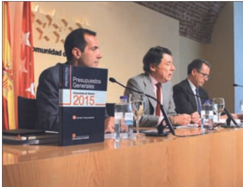
Los presupuestos se presentaron en el Consejo de Gobierno

Gracias al Plan PRISMA, dotado con 49,3 millones, las localidades verán mejoras en su territorio. En concreto, se contempla un aumento de las inversiones del 5% con respecto a 2014. Así lo dio a conocer el presidente de la Comunidad, Ignacio González, el