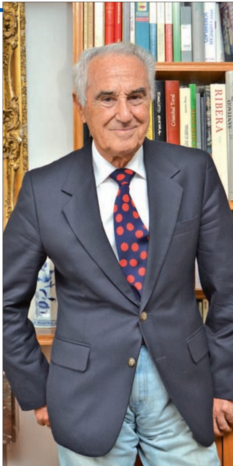
CHEMA MARTÍNEZ / GENTE

En cuanto al nacionalismo en Cataluña, Carrascal se considera "claramente antinacionalista", ya que "en el mundo se están buscando nuevas vías de cooperación y nacionalista sólo puede ser un despistado total o alguien que busca en el nacionalismo una forma de vivir y de progresar que no tendría en un espacio más ancho". Así, el autor mantiene que "el Estado de las Autonomías en España ha sido un fracaso", porque "la autonomía es una mayoría de edad y esto implica tomar