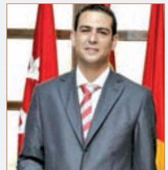
GONZALO CUBAS ALCALDE DE TORREJÓN DE VELASCO (PP)