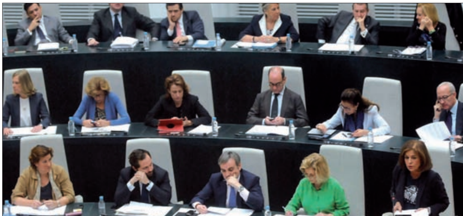
Pleno del pasado jueves