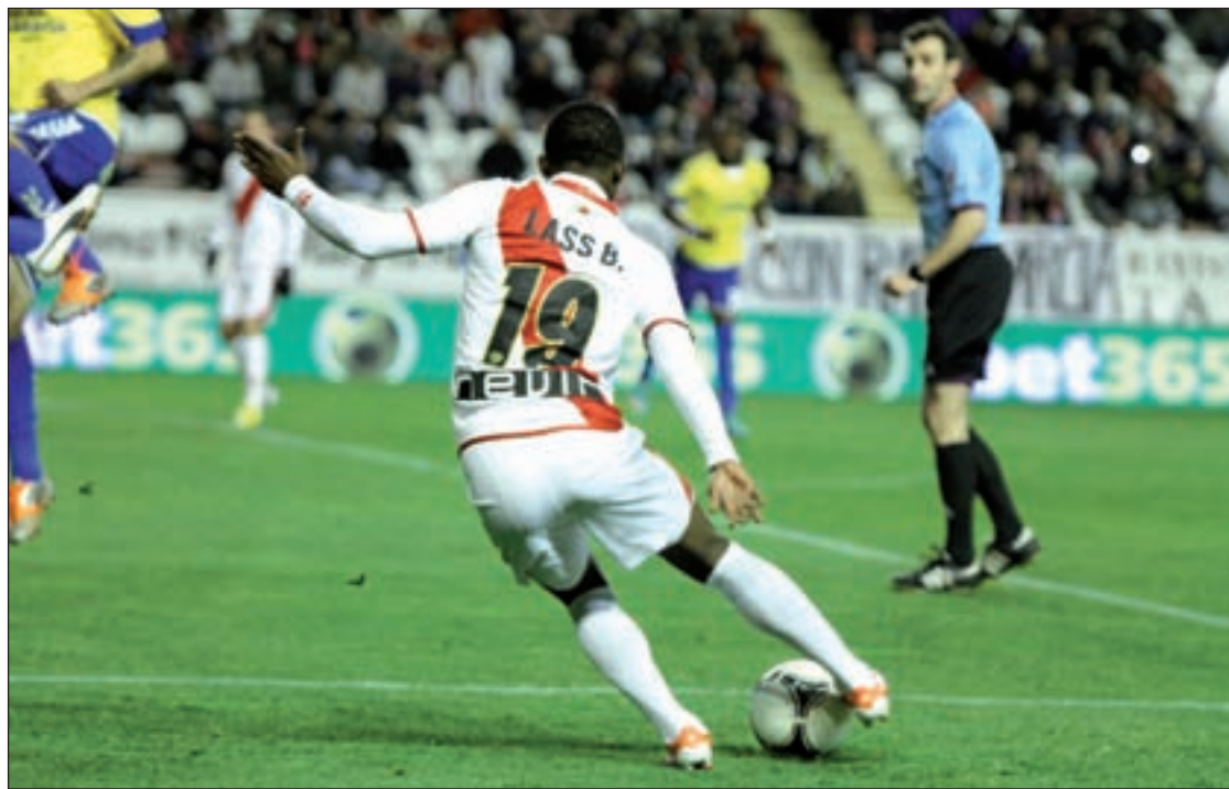
Lass pelea por hacerse un hueco en el once inicial del Rayo

Ha llovido mucho desde entonces, pero se puede decir que los caminos del Rayo y del Eibar han seguido trayectorias paralelas. Ahora, las dos entidades se mueven con cierta comodidad por la