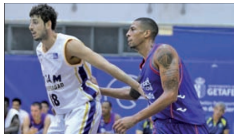
El Estudiantes jugará un derbi ante el Fuenlabrada

Con menos cartel que este Real Madrid-Valencia Basket, pero con bastante trascendencia. Así se presenta el derbi que jugará el Tuenti Móvil Estudiantes con el Montakit Fuenlabrada en la tarde del domingo (18:30 horas). En el