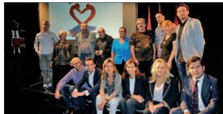
La foto de familia, al final del acto de presentación

durante el pasado año hubiera más de 30 millones de usos deportivos en las instalaciones municipales. El plan contempla, en colaboración con los centros de salud, paseos saludables, sesiones sobre hábitos saludables y actividades para familias con niños con problemas de obesidad.