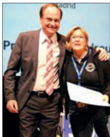
La entrega de galardones