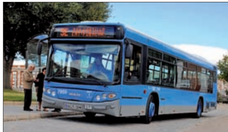
Uno de los autobuses de las rutas especiales a los camposantos

Normalmente, estas siete rutas funcionan con un total de 119 autobuses. Con este refuerzo extraordinario, la dotación se incrementa hasta alcanzar los 213