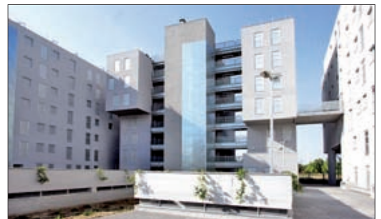
Algunas de las viviendas de la EMVS en La Catalana