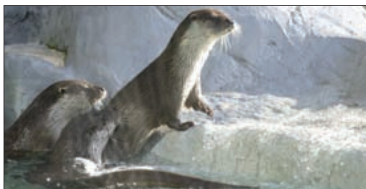
Las nutrias están catalogadas en peligro de extinción

El verso "Mi alma la tripula el viento de tu respiración" se encuentra en la calle Toledo. "Vuelan palabras lentas, hacen manitas bajo la ciudad", está pintado en la Plaza de Tirso de Molina. La frase que da nombre al proyecto, "Te comería a versos", está en la calle Santa Cruz de Marcenado, y "Magia en las pisadas..." también en la calle Toledo.