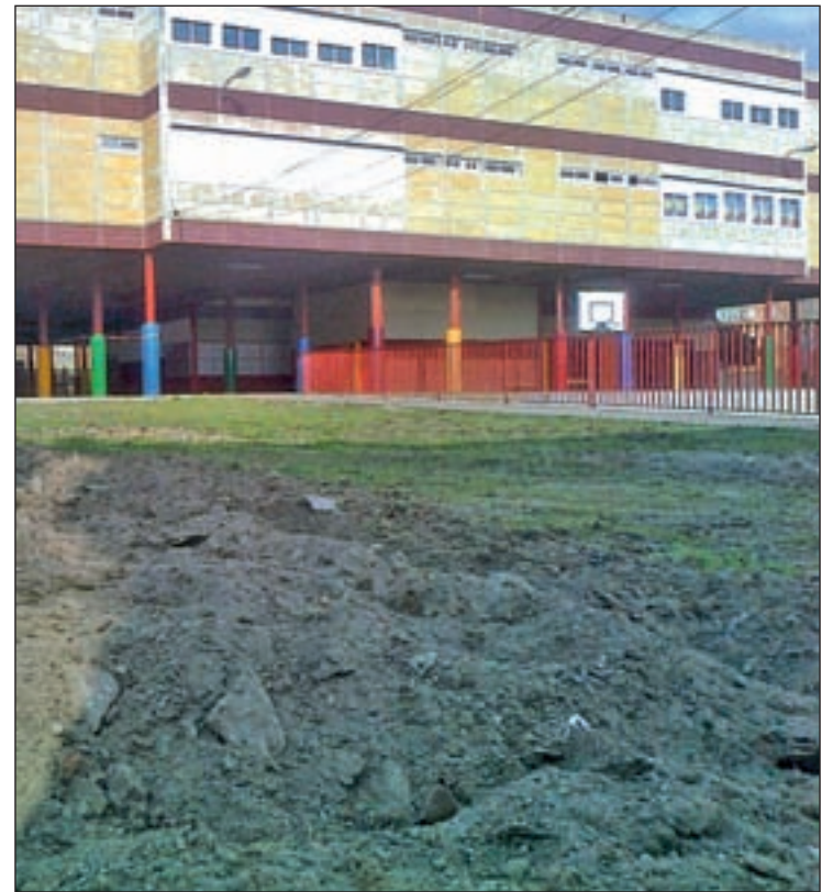
Las instalaciones provisionales del José Echegaray en Vallecas

Mientras tanto, los vecinos del Ensanche de Vallecas aseguran que, a pesar del anuncio inminente del comienzo de los trabajos, aún no se ha visto ningún tipo de movimiento en la parcela des-