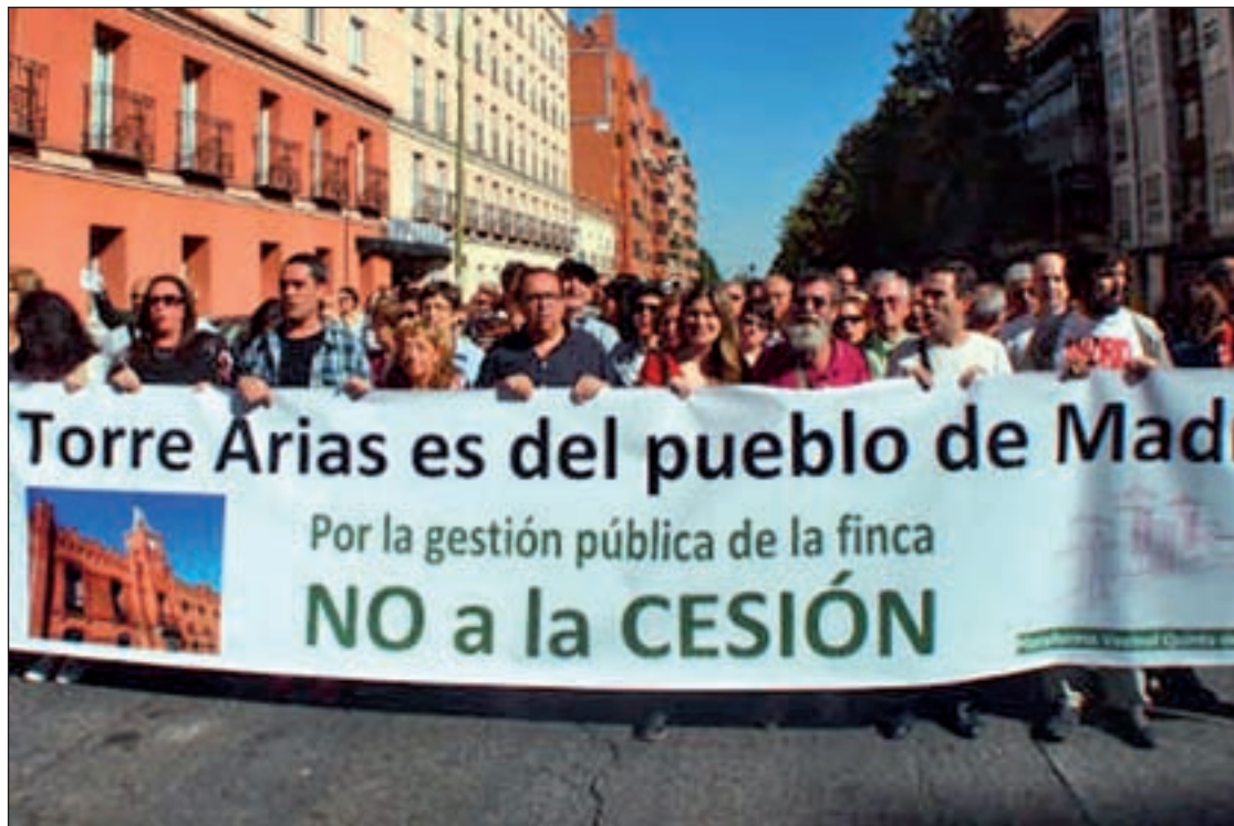
Un momento de la manifestación vecinal del pasado 26 de octubre

La edil considera que este espacio debe ser para "uso y disfrute de todos los ciudadanos". Además, apunta que los trabajadores del servicio municipal de jardinería creen que se podría crear un