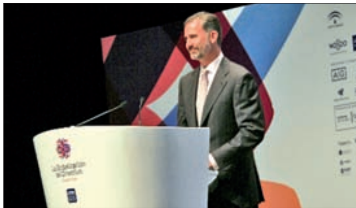
Felipe VI, durante su intervención