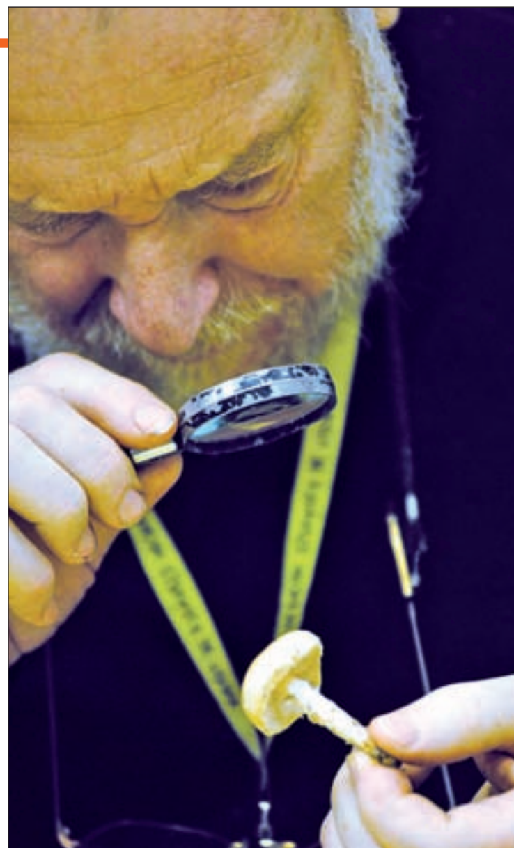
La Sociedad Micológica de Pozuelo presta un servicio gratuito GENTE

A este crecimiento también han ayudado varios condicionantes. La demanda en el sector de la restauración, ya que, como comenta la propia presidenta de esta asociación madrileña, "la seta es exquisita por muchas razones: