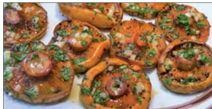
El niscal, uno de los protagonistas culinarios

más atractiva. La localidad de Las Navas del Marqués organizó unas jornadas micológicas en las que los asistentes aprendieron a descubrir especies tóxicas. Sin salir del municipio, este fin de semana se celebrará una ruta de la tapa en la que las mejores setas harán las delicias de los comensales.