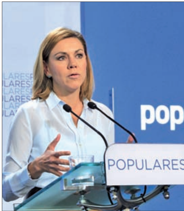
Cospedal se refirió a la corrupción tras el Comité de Dirección del PP

No obstante, desde el PP no se plantean cambios internos en la dirección nacional por los casos de corrupción y han defendido