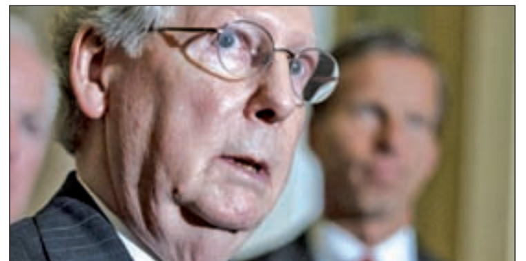
El senador republicano, Mitch McConnell

La victoria de los republicanos marca la primera vez, desde el año 2006, que ese partido controla ambas cámaras y augura un complicado fin de presidencia a Barack Obama.