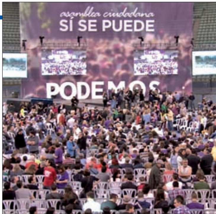
Imagen de una asamblea ciudadana de Podemos

La irrupción del partido de Pablo Iglesias hace retroceder a las otras dos formaciones minorita-