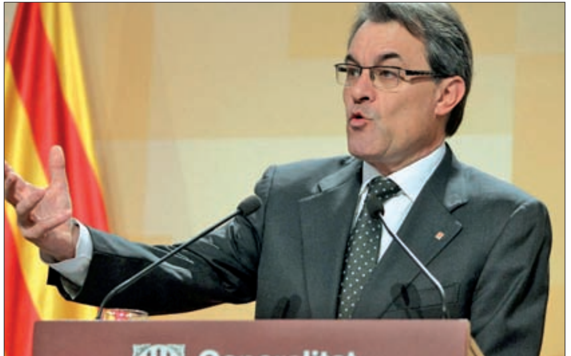
El presidente de la Generalitat, Artur Mas

El presidente de la Generalitat enviará un escrito a Mariano Rajoy el próximo lunes 10 de noviembre en el que le pedirá una votación que, "de forma definitiva y acordada", permita decidir a los catalanes su relación con el resto de España, como los referéndums que se hicieron en Quebec (Canadá) y Escocia (Reino Unido).