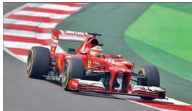
Alonso sigue a la espera

A la espera de conocer esta decisión, la atención en el campeonato del mundo se centra en sa-