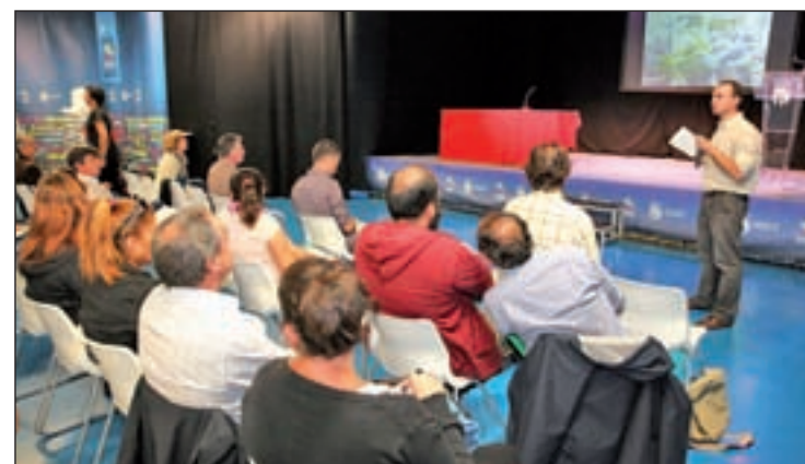
Foro sobre la Sostenibilidad

Sostenible (CIMAS), representa una “herramienta eficaz” para planificar el desarrollo local de manera sostenible, incorporando en la gestión municipal aspectos relacionados con el equilibrio ambiental, social y económico, y contando con la implicación de los vecinos, actores protagonistas en última instancia del desarrollo y disfrute de la ciudad, han dicho fuentes municipales. Ya ha concluido la primera etapa de diagnóstico (de enero a diciembre de 2013). Ahora se encuentran en la segunda fase de análisis para la