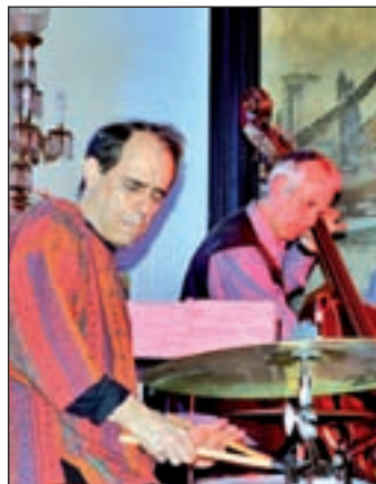
El festival incluye 21 concierto

Además, y entre otras actividades en los lugares ya citados, se abrirá un ciclo de debates, desarrollados en el Auditorio de Conde Duque con entrada libre hasta completar aforo, que abarcarán diferentes aspectos del jazz y su integración con otras áreas de la creación artística: el jazz y el