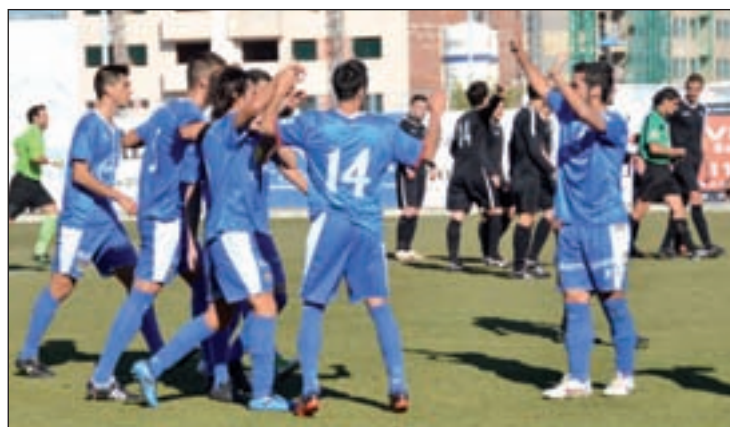
El CF Fuenlabrada durante un partido