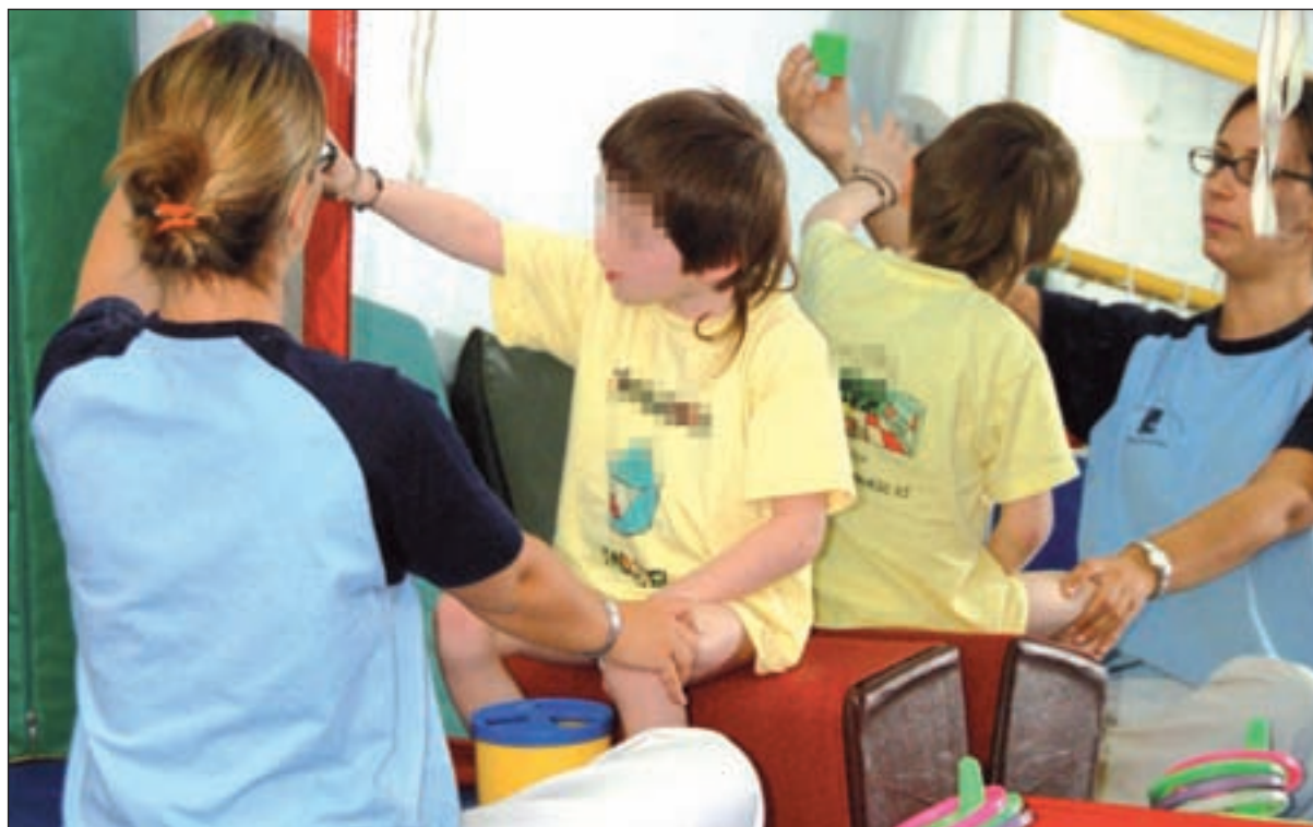
Niños con diferentes capacidades GENTE

En la última década, 11.357 han sido protegidos y atendidos por la administración, una buena parte en residencias infantiles del Sur de Madrid. Recientemente, el Gobierno regional autorizaba la presentación de propuestas por parte de las empresas que quieran optar al contrato de servicios de atención auxiliar en estos centros