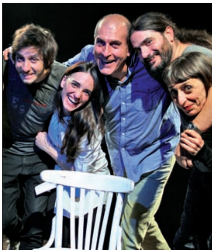
Los personajes de 'Intimidad', en escena

midad' trata de "desnudar a cuatro personajes en escena y demostrar que todos nos hemos sentido patéticos alguna vez, pero nos da miedo contarlo". Según ha añadido, estamos en una sociedad muy individualista y acusadora, y al final lo más importante ocurre entre las sombras, en la oscuridad de tus secretos. "Nosotros, en este montaje, lo que hacemos es poner un foco de luz sobre esa parte sombría", ha indicado. Con una escenografía "pobre" en elementos, pero "enorme" en contenidos, esta obra ha conse-