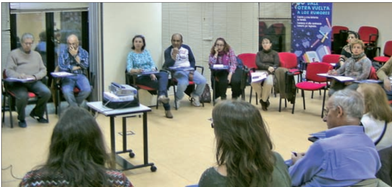
Alumnos durante las jornadas Antirumores