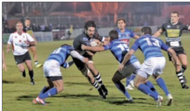
El Complutense Cisneros ocupa la tercera plaza

El Rugby Pozuelo y el Complutense Cisneros jugarán este sábado (13:30 horas) una nueva edición del derbi madrileño en el marco de la octava jornada de la División de Honor. Echando un vistazo a la clasificación y a los últimos resultados, no parece que ninguno de los dos llegue en su mejor momento. Los pozueleros comenzaron el curso con buen pie, sumando dos victorias en las tres primeras jornadas, pero desde su sufrido triunfo (16-17) ante el Hernani, no han vuelto a llevar-