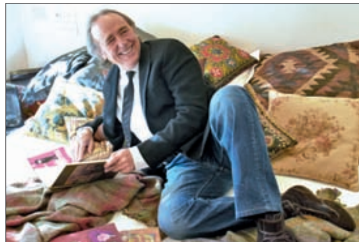
Joan Manuel Serrat

cine, el jazz como banda sonora de películas emblemáticas, o la relación entre la literatura y el jazz. Dichos debates correrán a cargo de los grandes especialistas de este género en España.