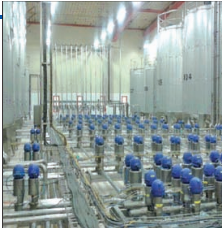
La fábrica de Coca-Cola de Fuenlabrada antes de ser desmantelada

del conflicto, ha vuelto a poner piquetes en las puertas de entrada al edificio para impedir que salgan furgonetas. “No queremos que saquen el material, porque entendemos que lo que buscan con ello es desmantelar la fábrica e impedir la ejecución de la sentencia de la Audiencia Nacional del 13 de junio, donde se dictaminó la readmisión de los despedidos en sus puestos”, ha explicado. En este punto, ha añadido que quedan quince días para que se cumpla el plazo de ejecución. “Y seguiremos aquí hasta entonces. Aunque la hayan intentado desarmar, tal y como está, funcionaría al 20 o 25 por ciento de su capacidad. Para que nos entendamos, se