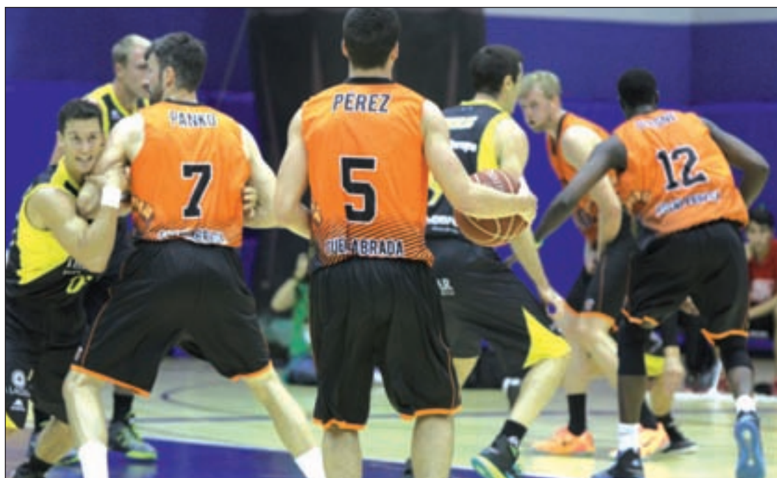
El Montakit durante un encuentro

Por su parte, el Real Madrid llega lanzado al segundo derbi madrileño. El equipo blanco no ha perdido ningún partido en las cinco jornadas que lleva en marcha la Liga Endesa. En el último encuentro ante el Valencia Basket, dominaron desde el primer mi-