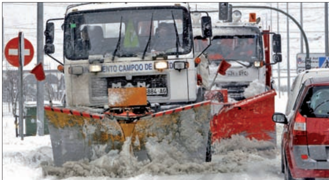
El operativo invernal pretende minimizar la incidencia de la meteorología en las carreteras

AFEM registró una querrela criminal admitida por el Juzgado de Instrucción Número 4 de Madrid por presuntos delitos de realización arbitraria del propio derecho, coacciones, delito contra la Hacienda Pública, falsedad documental, prevaricación, cohecho, fraude y malversación de caudales públicos en el marco de la externalización de la gestión del Hospital Infanta Elena, en Valdemoro; el Rey Juan Carlos, en Móstoles; y el Hospital de Torrejón de Ardoz.