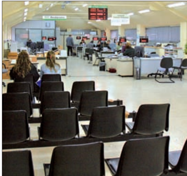
Oficina de empleo

Si atendemos a los datos revelados el pasado martes por el Ministerio de Empleo y Seguridad So-